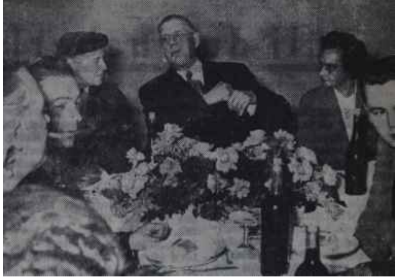
General De Gaulle "Büyük Avrupa" rüyası

Akra, ne de 1963 ve 1966 Adisababa toplantılarında Afrika ülkeleri arasındaki ayrılıklar giderilip bir görüş birliğine varılabildiği. İkincisi, son toplantıdan bu yana geçen bir yıl içinde bu 'ayrılıklar azalmak şöyle dursun, bunlara Nijerya iç savaşı, Rodezya ve Güney Afrika Birliği karşısındaki çelişik tutumlar gibi daha yenileri de eklenmişti. Üçüncü olarak, ılımlı tanınan bazı devletlerle -ki bunlar Fildişi Kıyısı, Senegal, Madagaskar gibi, Fransızca konuşan devletlerdir- Mali, Gine, Cezayir gibi devrimci bazı ülkelerin liderleri, daha çok önceden, -kimi, bu toplantıların Afrika devletleri arasındaki görüş ayrılıklarını ortaya çıkarmaktan başka birşeye yaramadığını ileri sürerek, kimi de, başında Mobutunun bulunduğu Kongo gibi Batı kuklası bir devletin başkentine gidemeyeceklerini söyleyerek-, bu toplantıya katılmayacaklarım açıklamışlardır. Fakat ortalıkta görünen bütün bu engellere rağmen, geçtiğimiz hafta, çoğu belçikalı olan paralı beyaz askerlerin hâlâ at oynattıkları Bukavadan yalnızca 1500 kilometre uzakta bulunan Kinşasada toplanan beşinci Afrika zirvesi, şimdiye kadar toplanan bütün Afrika zirvelerinden daha olumlu sonuçlara ulaşmayı başarıp, bütün dünyanın dikkatini kendi üzerine çekti. Alınan kararlar