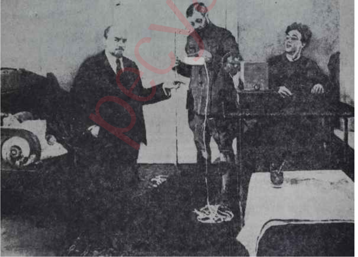
Leninin hayatı ve mücadelesi, yazarların olduğu kadar ressamların da başlıca konusunu teşkil etmiştir, ihtilâl başarıldıktan sonra yapılan sayısız tabloda o, çeşitli yönleriyle ele alınmıştır. Yukardaki de bir tablodur ve Lenini telgrafhanede göstermektedir.

Bence, hayatın bu dram ve trajedilerine karşı duyduğu kin ve nefret, Vladimir Lenini, Rusyanın bu demir iradeli adamını çok yüksel-