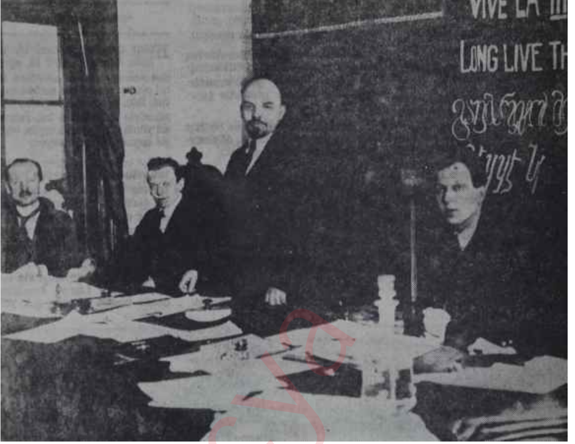
Yukardaki resimde Lenin, Mart 1919'da toplanan Komünist Enternasyonalin I. Kongresinde görülmektedir. Büyük bir lider, büyük bir idareci, büyük bir halk adamı olduğunda hemen herkesin İttifak ettiği Lenin, aynı zamanda azmin, iradenin, dehanın da sembolü olarak gösterilmektedir. Düşmanları dahi ona, "ölümünde bile büyük" demekten çekinmemişlerdir.

sindeki tutumundan sözediyorlardı. Biri onu şu şekilde tanımlıyordu: