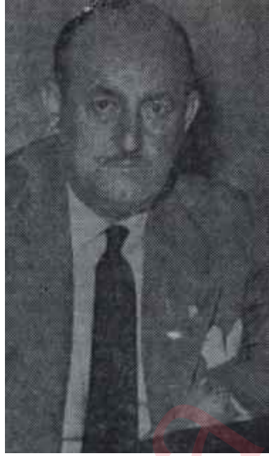
Orhan Şeref Apak

Orhan Şeref Apakın, 12'ye karşı 13 oyla futbolda Akdeniz Oyunlarına katılmamızı kararlaştıran Milli Olimpiyat Kurulunu inandırması kolay olmamıştır. Bunun ardından da, gazetelerin yayını üzerine Apak, kendini savunmak için, her zaman olduğu gibi, kaçamaklı cevaplarla vakit geçirmiş ve Amatör Millî Takımın Tunusa gitmesini sağlamıştır. Apaka göre, içlerinde 100 bin lira alanın da bulunduğu bu futbolcular, amatördüler. Gazeteciler kendisini sevmedikler için, çalışmalarını sabote etmek amacıyla, böyle bir iddia ortaya atmışlardır. Özellikle Tunusa hareketten önce yaptığı basın toplantısında Orhan Şeref Apak, bazı gerçeklerin ortaya çıkmasından çekindiği için, gazetecilere saldırma yolunu seçmiştir. Futbolcuların profesyonel olduklarını gerektiği yerde kabul etmek agoranda kalan ve "Elimizde bu futbolcuların amatör lisansları bulunduğu için bu futbolcuları amatör kabul ediyoruz" demekten çekinmeyen Futbol Federasyonu Başkanı için, yurda döndükten sonra yapılacak tek şey, susmaktır. Ancak Apakın, kolay susacak bir kimse olmadığı bilinmektedir. Apak, haklı görüneceği tek bir taraf olmamasına rağmen, Tunusa gitmeden önce bu konuyla ilgili olarak basın toplantısı yapmamış mıdır? Bu basın toplantısında spor yazarlarıyla Apak arasında geçen şu konuşma bile, Apakın kendini savunmak için ne durumlara düştüğünü göstermektedir. Bir spor yazarıyla Apak arasında geçen bu konuşma şudur: "— Orhan bey, yani siz bu fut-