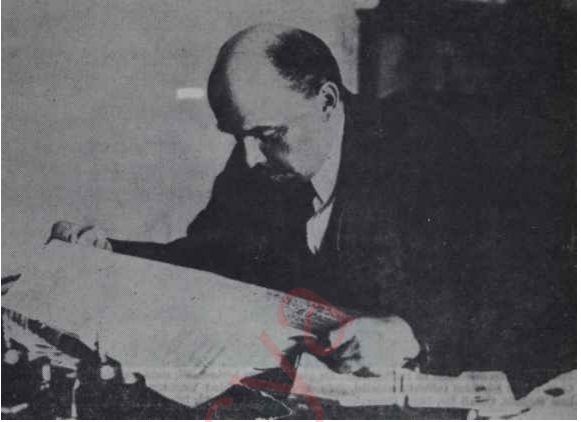
Lenin, 1918 Ekiminde çalışma odasında. Elindeki gazete, Pravdadır. Biyografi ve hatıra yazarları, Lenini, "az uyuyan, durmadan çalışan, korkunç enerji sahibi, başkaları için zevkenden ve eğlencesinden, hattâ dinlenme saatlerinden feragat eden adam" olarak tanıtmaktadırlar. Gerçekten de alçakgönüllülüğü, halk sevgisi, fedakârlığı, onu halkın gözünde kahraman yapmıştır.

tir. O, acının zaferi ve ilahileştirilmesi için en güzel dinî şarkıların yazıldığı ve gençliğin, gerçekte çok monoton olan tasvirler, alelade günlük dramlarla doldurulmuş kitaplarda yaşamasını öğrendiği bir memlekette, bir "Demirden yumruk" olmuştur. Rus edebiyatı, Avrupa'nın en karamsar edebiyatıdır. Bizde bütün kitaplar, hep aynı temayı işler: Nasıl acı çekmeliyiz? Nasıl acı çekiyoruz? Gençliğimizde ve olgunluk yaşımızda, muhakeme yetersizliğinden, diktatör idareden, kadınlardan, başkalarına karşı duyduğumuz sevgiden, dünyadaki kötü düzenden çektiklerimizi dile getiririz. İhtiyarlık çağında ise, hayatımızda yaptığımız hatalardan, dışsizlikten, kötü bir sindirimden ve ölümden söz ederiz.