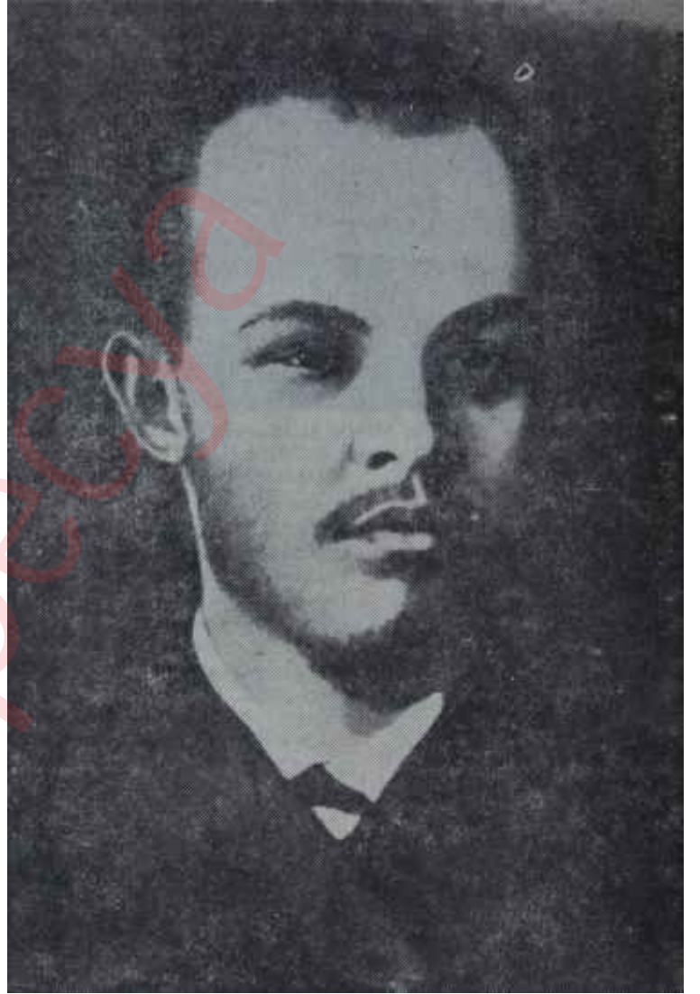
Leninin 1892lerde çekilmiş bir resmi. Azim ve zekâ okunan, asyalı bir yüz. O tarihte Lenin, yirmiiki yaşında bulunuyordu ve Rusya, Çar İkin-ci Nikolanın korkunç zulmü altında, gündengüne büyüyen grevler, mitingler ve suikastlarla 1905'e ve 1917'ye doğru gidiyordu.

V.L. Stroeve-Desnitski, birgün bana, Leninle ilgili bir olayı anlatmıştı: Leninle beraber İsveçten gelirken, vagona oturmuş, almanca basılmış bir kitapta, Dürer'e ait bir