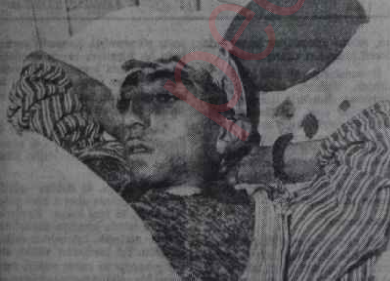
Kayseride yaralanan bir sporsever Kazanın değil, asayişsizliğin sonucu