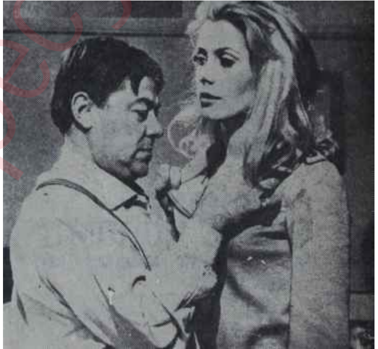
Catherine Deneme "Gündüz güzeli"nde Çözölmeye çalıřılan cinsel sır

Uyarıldığı edebî eserle karşılaştırılmak talih-sizliğine uğrayan filmler fransız yönetmen Serge Ro-