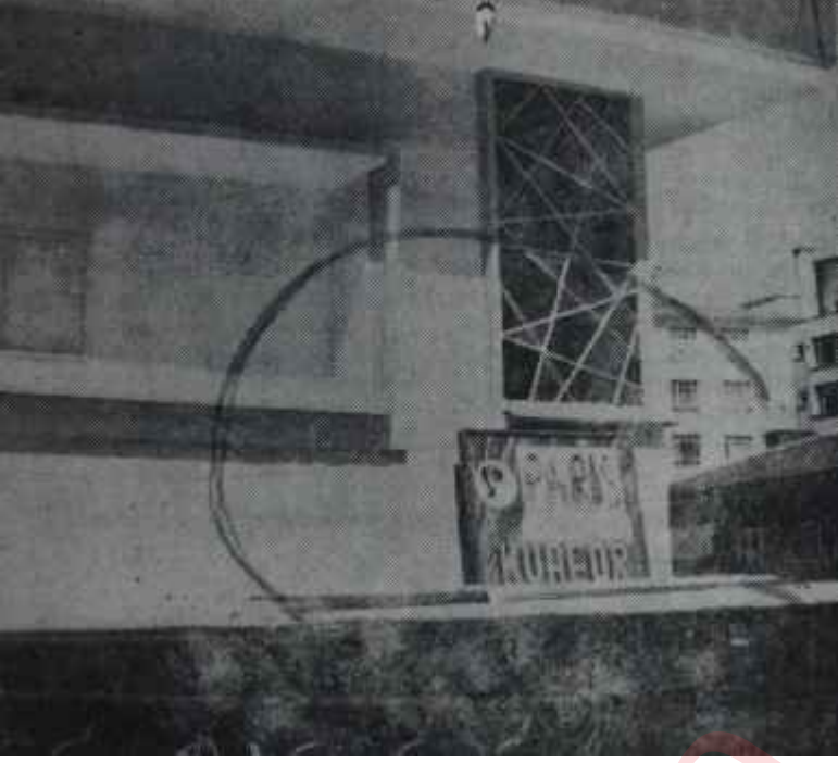
Paris Kuvaför Salonu Devlet, vatan, millet hizmetinde...

sayesinde, kısa zamanda mesleğinde ilerlemiş ve 1961 yılında, Sümer Sokak 2/5 numaradaki Paris Kuvaförde, yine kalfa yardımcısı olarak, iş bulmuştur.