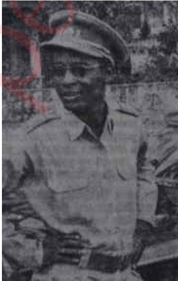
Mareşal Mobutu Şu Kongonun işleri

Büyük Şarlin "Büyük Avrupa" rüyası, Polonya gezisinden sonra, bir kâbusa dönmek eğilimindedir.