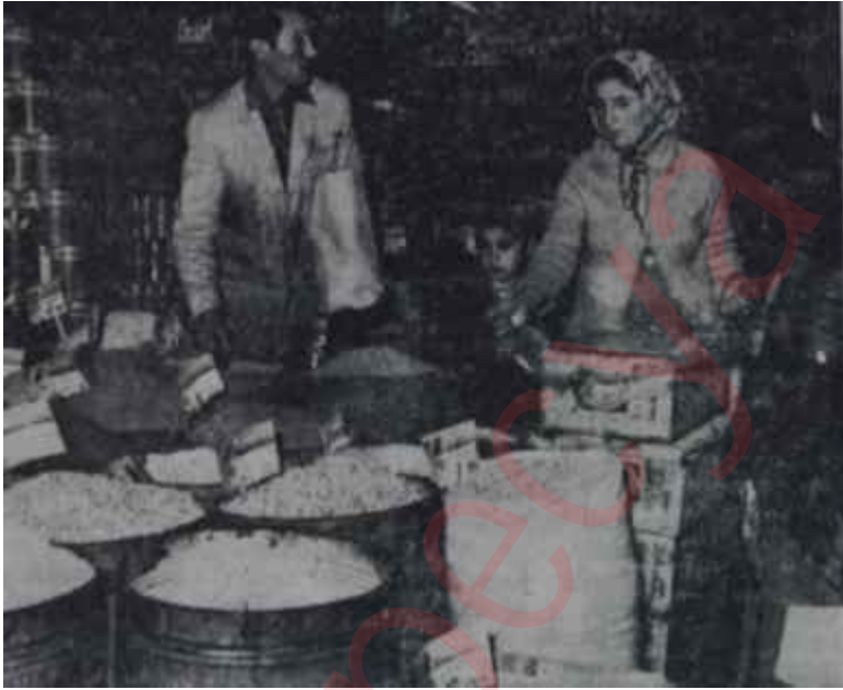
Yiyecek maddeleri başında vatandaşlar Yeme de yanında yat!

Ne var ki, bu basında, "hatalı yoldan dönmek fazileti gösteren" İktidarın, bu fazileti kimler karşı-