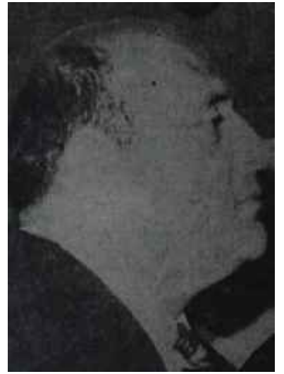
Yetki isteyen Süleyman Demirelin iki pozu "Dönüşü olmayan nehir"

yatırımlarını da tamamladıktan sonra bunları şahıslara devretmesi; ihracatı teşvik edilecek: maddeleri ihraç edenlerin tanıtma, pazar araştırması ve yerleşme masraflarına devletin de katılması veya masrafin tamamını karşılaması; yurt dışında iş alacak özel sektöre de aynı kolaylıkların sağlanması; iş sahiplerine, teşkil edilecek fonlardan büyük çapta krediler açılması.. gibi hususlar, tasarıda yer almaktadır. Halktan toplanmış vergilerle milyoner yaratma sevdası bir yana, tasarındaki bir hüküm, tartışma kabul etmeyecek şekilde Anayasaya aykırıdır. Bu, özel sektör lehine devletin istimplâkler yapmasıdır.