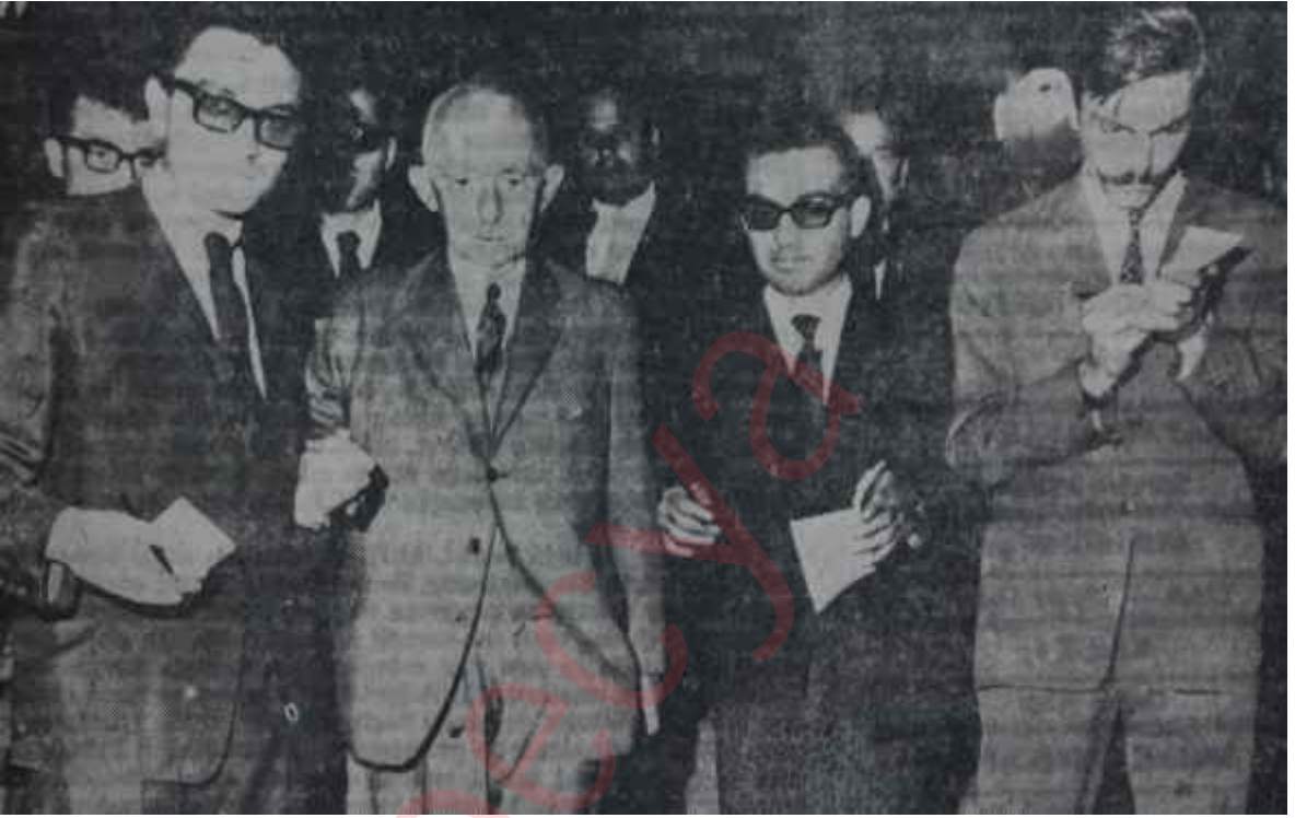
İsmet İnönü, Başbakanlığın merdivenlerinde gazetecilerle Davete icabet