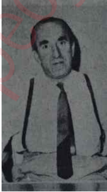
Semih Tuğrul Doğru söyleyeni..

Düzenlenen yatırım programı gerçekleştirilebilirse, İkinci beş yıl-lık plânın son uygulama yılı olan 1972'de Televizyonun yayın alanı An-