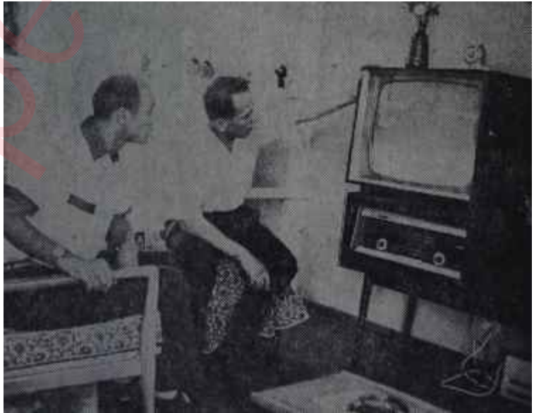
Televizyon başında bekleyen Ankaralı bir aile Eller aya giderken...

den daima aynı yerde asılı imiş gibi duran üç elektronik uyduyu verici şebekesi olarak dünyanın etrafına ve 40 kilometre yükseldiğe yerleştirmenin hazırlığı ilerlemiştir. Bu sistem gerçekleştirilir ve yerdeki vericilere ihtiyaç kalmadan uydulardan doğrudan doğruya odalardaki alıcılara yayın yapılırsa -ki yapılacaktır-, dünya yepyeni, biz türkler için ise çin yazısı kadar acayip problemlerle karşılaşıya kalacaktır. Örneğin Sovyetler veya Amerikalılar, böyle bir sistemle, karşı blok ülkelerindeki bütün evlere ulaşabilecek propoganda yayını yapabileceklerdir. Amerikadakiler veya ruslar, bu propoganda yayınlarına itibar etmeyebilirler. Onların izleyebileceği çok sayıda millî istasyon vardır. Ama televizyon şebekesini kurmamış veya genişletmemiş olan az gelişmiş ülkeler, böyle bir propoganda savaşında tam anlamıyla silâhsız kalacaklardır. Televizyon alıcısına sahip bulunan, fakat millî televizyon yayınından yararlanamayan az gelişmiş bir ülkenin halkı, propoganda dahi olsa, odasındaki ekranda belirecek görüntülerin cazibesinden kurtulamıyacaktır. Nitekim bu durum Türkiyede, daha doğrudan doğruya alıcıya yönelen uzay yayınları başlamadan ortaya çıkmıştır.