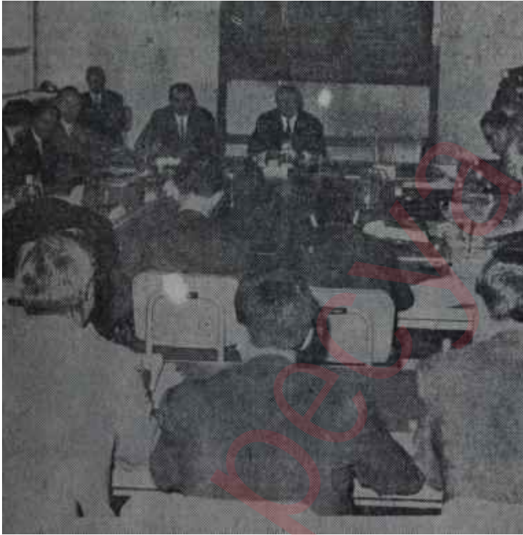
Başbakan Demirci ve Plâncılar Kuşa dönen bir teşkilât

Demirel İktidarını bu derece akıl-dışı ve Türkiye gerçekleriyle yüzdeyüz çelişki halinde bulunan tedbirlere iten sebeplerin başında, şüphesiz, biraz da idarî mekanizmadaki beliren tereddütler gelmektedir. Örneğin, geçmiş devirdeki olaylar sebebiyle gözleri açılan bazı yüksek dereceli memurlar, kolaylıkla şifahi emirler kabul etmemekte ve mutlaka yazılı emir istemektedirler. Bu ise, suyun başında bulunanların işlerini güçleştirmektedir. Bu yüzden ise İktidar, siyasî kayıplara uğramaktadır. Halbuki bundan sonra böyle olmayacak, geniş yetkilere kavuşan Hükümet, istediğini yaptırabilecektir. Anlatılan örneğe uygun bir olay, telekomünikasyon ihalesi sırasında cereyan etmiş ve bazı yüksek dereceli memurlar, yapılmak istenen kanun-dışı işlere karışmak istemedikleri için iş, uzun süre sürüncemede kalmıştır. Başbakan Süleyman Demirel, geçtiğimiz hafta