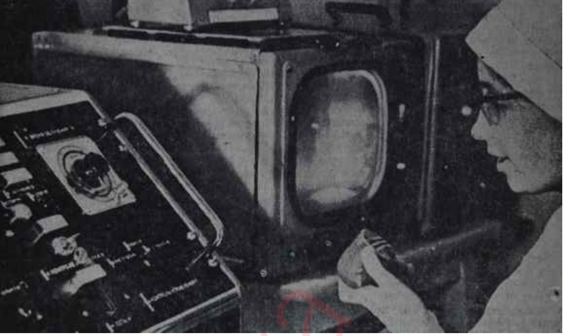
Bir Tv yayını hazırlanıyor Darısı başımıza

1972, Yozgat ve Sivas 1973, Malatya ve Diyarbakır 1974, Antep ve Maraş 1975, Samsun ve Giresun 1976, Bolu ve Kayseri 1977, Refahiye, Erzincan ve Erzurum 1978, Van, İsparta ve Antalya 1979, Denizli, Kastamonu ve Balıkesir 1980, Siirt, Hakkâri ve Edirne 1981, Karaköse, Kars ve Artvin 1982.