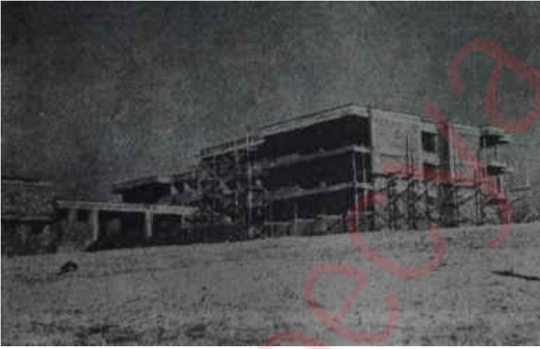
Keçiören Güçsüzler Sitesi inşaatı İhtiyarlara müjde!

ler Yurdu ise ancak, 17'si kadın ve 14'ü erkek olmak üzere, 31 yaşlıyı barındırabilmektedir. İnsanoğlu, bir çocukluk devresinde, bir de yaşlılıkta "yardıma muhtaçtır. Elbette ki, bir toplumun yarısını demek olan çocuklar üzerinde devletin ve milletin titizlik göstermesi gerekir. Ancak yaşlıların, güçsüzlerin, kimsesizlerin bakımı da bir toplumda yaşayanlara güven hissi veren ve onların, kendilerini topluma verebilmelerini, toplum için çalışmalarını sağlıyan bir sosyal sigortadır. Yaşlıların kendi hallerine ve kaderlerine terk edilmeleri, ileri bir toplumda görülebilen şeylerden değildir. Zaten böyle bir tutum, hiç şüphe yok ki, gençleri ve onların iyi va-