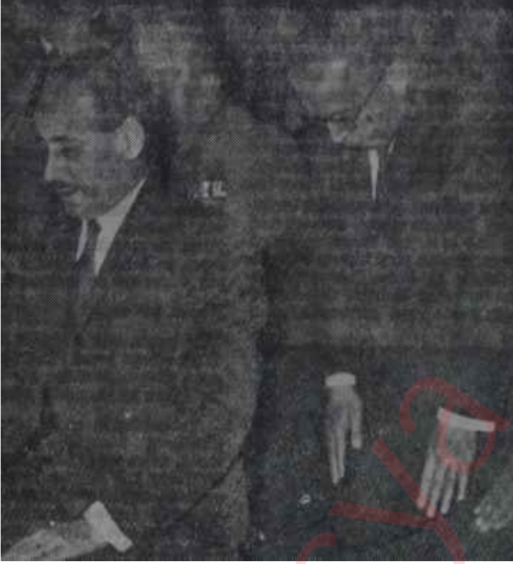
Dışişleri Bakanı Çağlayangil namazda Abdesti bol olsun!

"— Ama, özellikle Birleşmiş Milletlerde, iki yıl önceki tutumumuza bakarak, büyük bir başkalık olduğu da muhakkak. Yeni bağımsızlığa kavuşmuş tarafsız ülkeler bize, iki yıl öncesine göre, büyük sempati gösteriyorlar" diye devam etti.