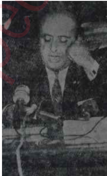
Demirel konuşuyor Dizi dizi inciler

Kapının önünde, kendisine güçlüklerle yer bulup oturabilmiş gazete-