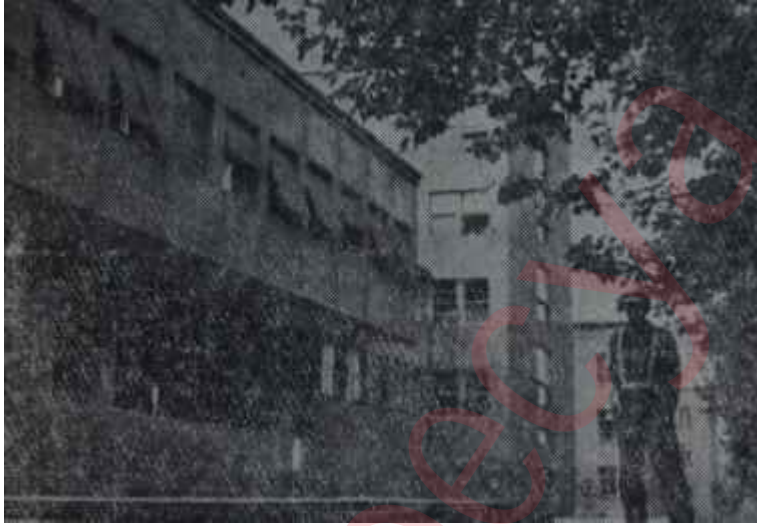
Dışişleri Bakanlığı binası

Durumunu sağlamlaştırmak için çabuk vb büyük bir Kıbrıs başarısının peşinde koşan yunan hükümetinin acelesini bilen Türkiye, buna karşılık koparılabilecek tavizi daha da büyütebilmek için, şimdi gözle görülür bir umursamazlık içindedir. Türk dış politikasını yönetenler kendilerini yavaşça çektiğe, yeni yunan hükümetinin daha büyük tavizlere razı olacağını sanmaktadırlar. Yeni yunan yöneticileri ise, Türkiye'yi görüşmelere zorlamak için bir yandan Batı Trakya'daki soydaşlarımız üzerindeki baskılan artırırken, öteyandan bizi Sam Amcaya şikâyet etmekte ve Washington'dan, Türkiyenin görüşme masası