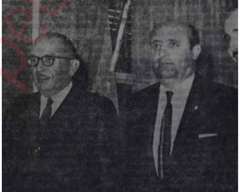
Süleyman Demirel - İhsan S. Çağlayangil "Haysiyetli dış politika" diyenler

Ârap - İsrail savaşıyla ilgili olarak toplanan Birleşmiş Milletler 0-lağanüstü Genel Kurulunda, Türkiye'yi temsil eden heyete dahil görevlilerden biri, kendisine yöneltilen "Son gelişmeler, türk dış politikasında bir değişikliğin belirtileri midir?" sorusunu hemen, "Hayır" diye cevaplandırdı. Fakat sonra, bu tek kelimelik cevabın biraz acele ve yetersiz kaçtığını kendisi de farketmiş olmalı ki, söze,