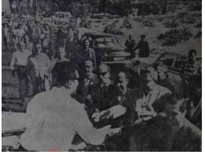
Ecevit Başpınarda karşılanıyor Gönüllü karşılayıcılar

Adanalı CHP'liler, genç işçiye, "Hoşgeldin! En az bizim kadar partiye sahipsin!" diye tezahürat ya-