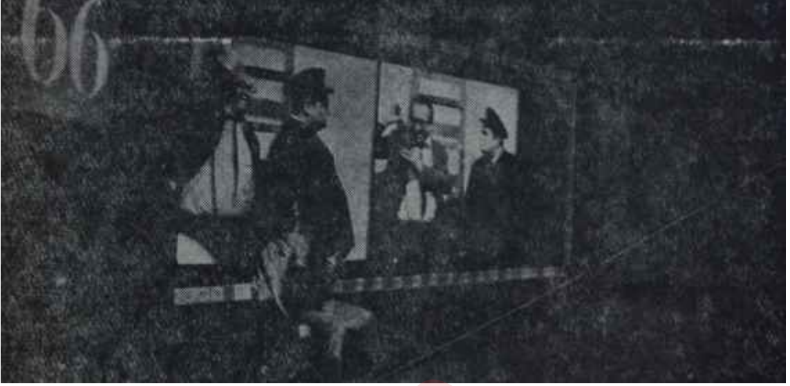
"Kino-Automat"tan bir görünüş Seç seç seyret!