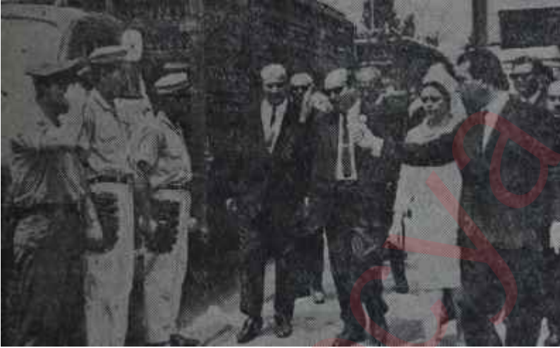
Demirel, İstanbul'da Coca-Cola tesislerinde