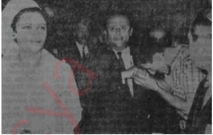
Süleyman Demirel el öptürüyor

Tarihî salonun görülmedik derecede insanla dolmasına sebep, Başbakanın altıncı basın toplantısını orada düzenlemiş olmasıydı. Salonu dolduranların yüzde 95'i, ilân ve reklâm koparmak amacıyla AP'nin meddahlığını yapan bazı dergi yöneticileriyle, gene AP'li Vilâyet ve Belediye Meclisi üyeleri, Vilâyetteki bazı memurlar, polisler, AP'li milletvekilleri ve 50'ye yakın meraklı vatandaştı. Gazeteciler, iki elin parmak sayısını geçmiyordu.