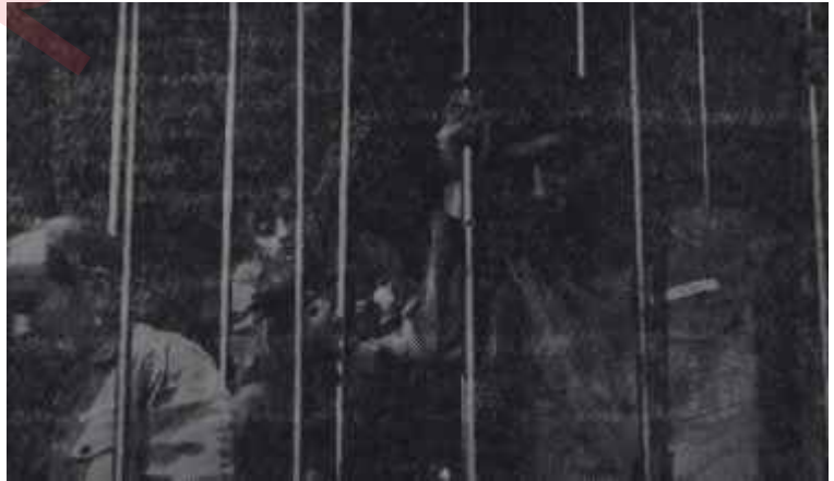
T.Ö.S. Tiyatrosunda "Suçsuzlar" Bir adli hatanın hikâyesi