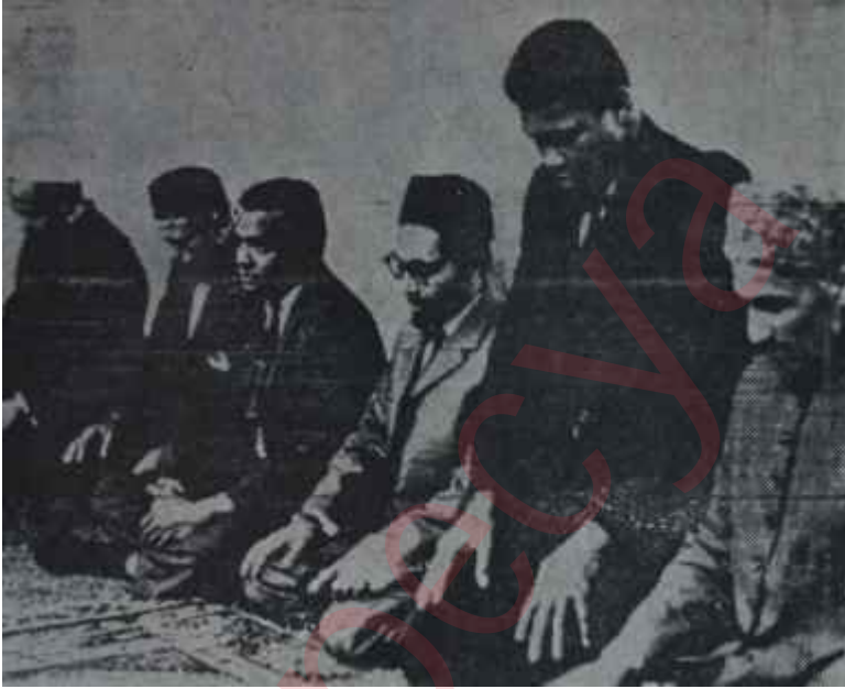
Muhammet Ali Clay namazda Yumruk, fikrin hizmetinde!