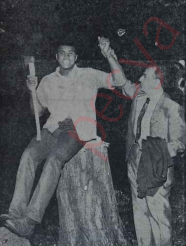
Olay ve meneceri Dundee Sevimli zenci

Nihayet 17 Şubat gelip çatı Clay, artık çılgına dönmüştü ve mütemadiyen, "Onu yeneceğim! Onu, bana Clay demekte inat ettiği için perişan edeceğim" diye söylüyor-