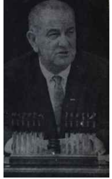
Kossigin — Johnson Zıt kardeşler