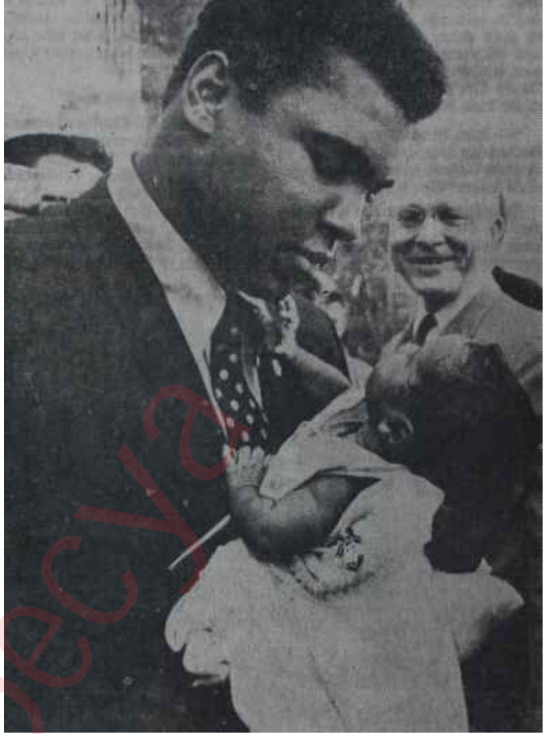
Şampiyonlar şampiyonu Clay

Clay'in bugün yumrukları kadar meşhur olan bir uzvu da bacaklarıdır. Dünyanın en biçimli ve güçlü bacaklarına sahip olan Clay, daha ân aylıkken yürümüştür. Ayaklarına