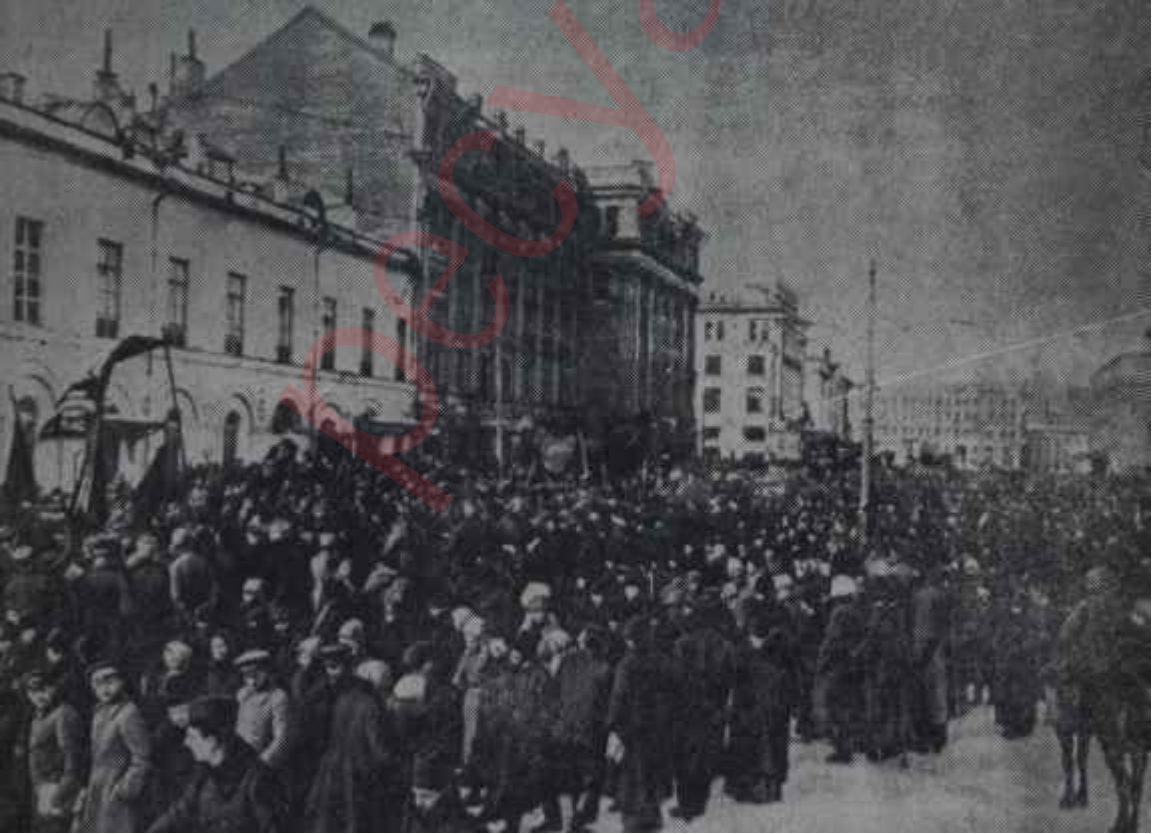
12 Mart 1917. Sokaklardaki kalabalık artık gittikçe büyümüş ve halk rejime karşı açıktan başkaldırıştı. Bir ihtilâlin gerçekleşmekte olduğunu bir, İktidar çevresi görmüyor ve anlamıyordu. Bu sırada İçişleri Bakanı "Eğer Rusyada bir ihtilâl olursa, 50 yıl sonra olur" diyordu.