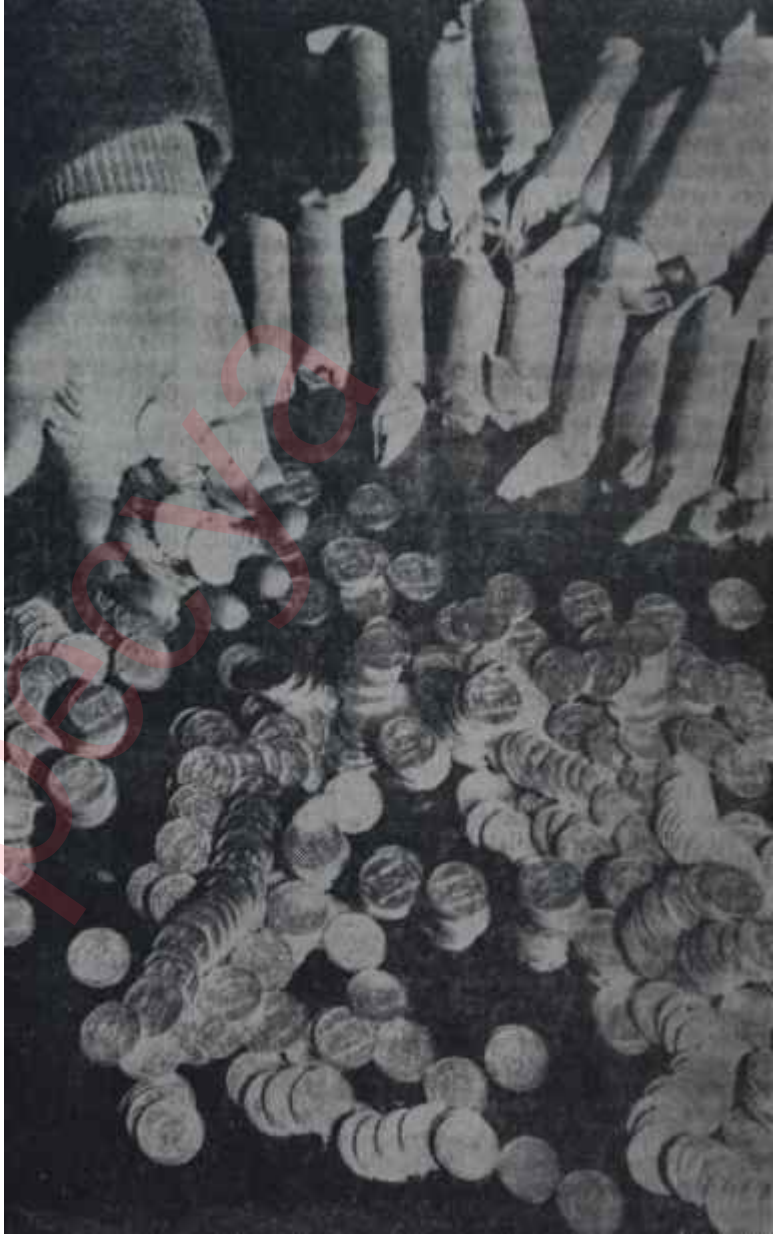
Bozuk paralar "Kötü para iyi parayı kovar"

Bilgehan, devalüasyon söylentileri ilk çıktığında, kendisi Maliye Bakanı oldukça böyle bir operasyonun