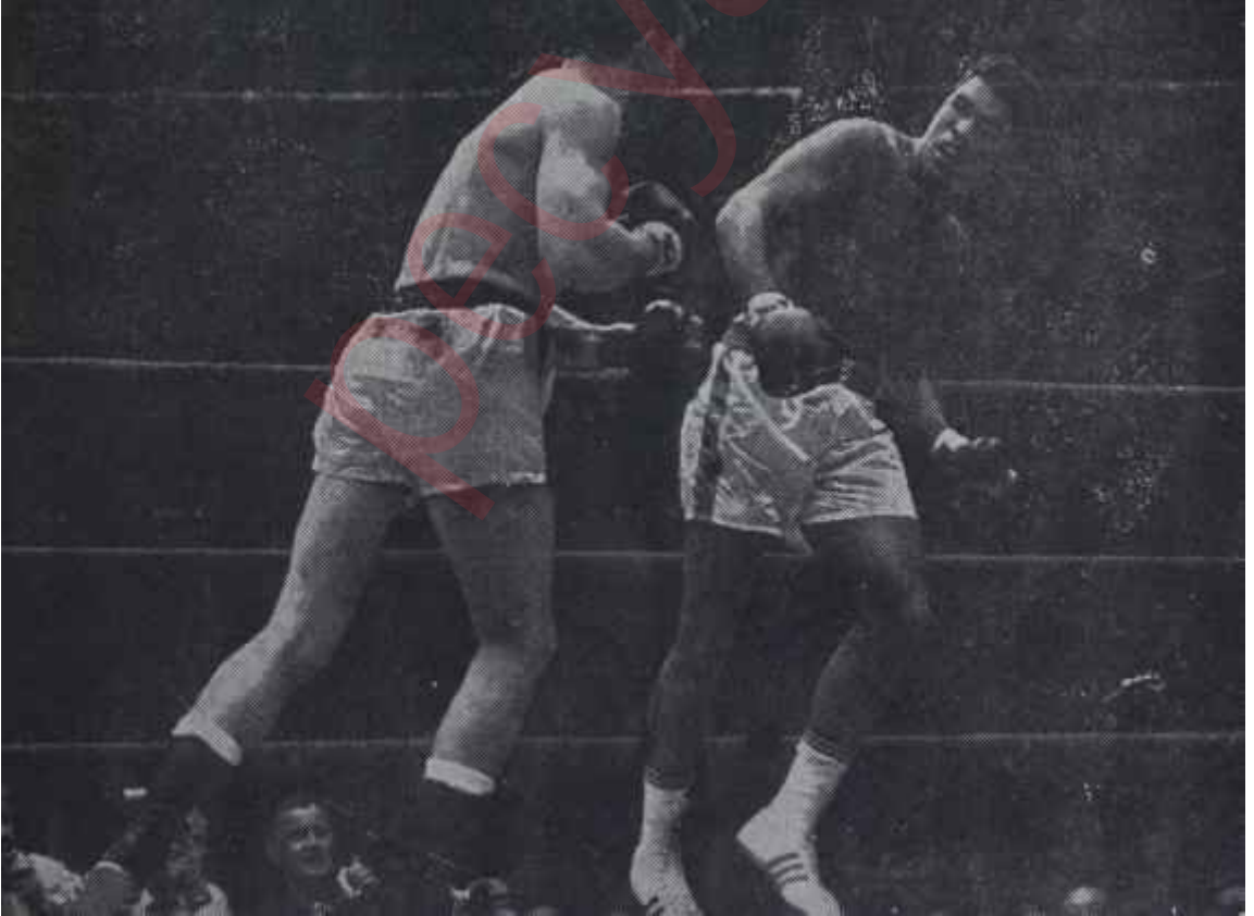
Muhammet Ali Clay ringde Mildenergeri kovalıyor "Benim adım ne, benim adım ne?"

Yargıç Joe İngraham'ın vardığı karar açıklanmadan önce Savcı Susman, durumu özetleyen ve yorumlayan konuşmasını yapıyordu. Bir ara susup, sesine daha saygıdeğer bir ton vermeğe çalışarak tekrar konuşmağa başlayınca, salona birden, fırtına öncesinin sessizliği çöktü ve ardından da fırtına koptu. Birçok amerikan dergi ve gazetesinin dünyaya bir acayip insan, bir cins deli, şımarık bir dev çocuk o-