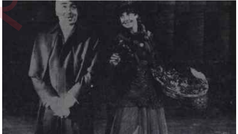
"My Fair Lady" İstanbulda Yılın müzikali