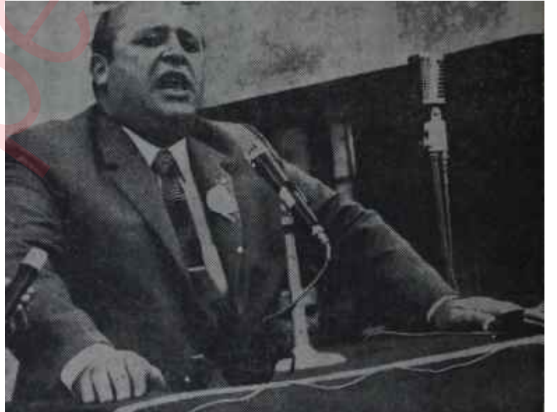
Demirel propaganda yapıyor "Atma Recep, din kardeşiyiz!"

Bu durum karşısında, gazetecilere, ellerindeki notlara göre haberlerini gazetelerine ulaştırmak düşüyordu. Nitekim, diğer gazeteciler gibi TRT ve AA muhabirleri de o gün aynı şeyi yaptılar. Eskişehir'e gelir gelmez telefona koşarak, haberi zamanında yetiştirmek için merkezle temas sağlamağa çalıştılar. Ne var ki aynı anlarda Demirel ve beraberindekiler Eskişehir Cer Atölyesini ziyaret ediyor ve Demirel burada kendince ve yakın çevresince "çok önemli" görülen bir konuşma yapıyordu. Gazeteciler, bu durumdan habersiz oldukları için, bu "çok önemli" konuşmayı atlادılar. Bunu bir türlü affedemeyen Demirel, her iki AA muhabirini de derhal buldurttu ve kendilerine muhabirliğine