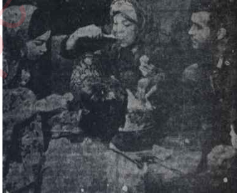
"Bitmeyen Yol"dan bir sahne Berlin yollarında

Berlin Festivali, bütün organizasyon mükemmelliğine rağmen, bu yıl 17. kere tekrarlandığı halde, birinci sınıf festivallerin en sonuncusu olmak niteliğinden sıyrılmadı. Bunda, en büyük rolü, Berlin Film Festivalinin bütün festivallerin "en siyasîsi" olması oynamaktadır. Soğuk savaşın kendini en çok duyur