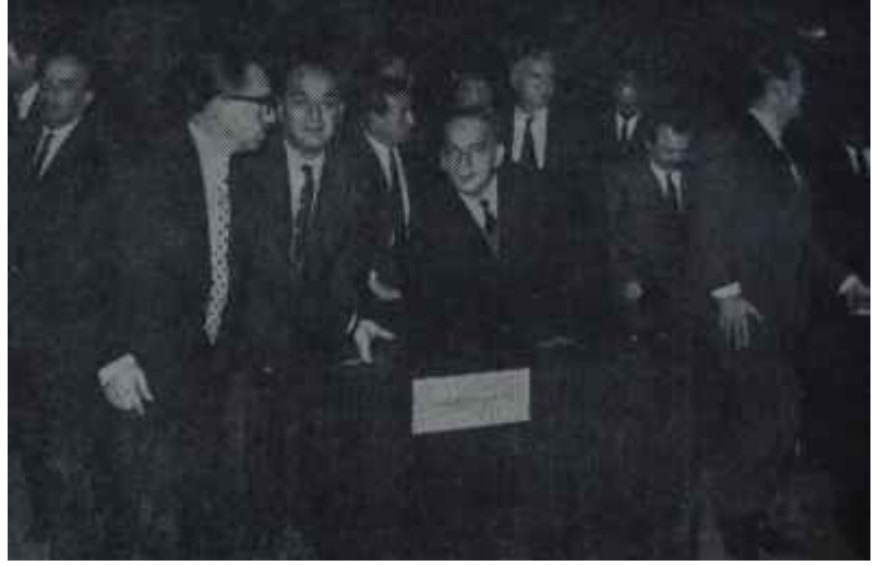
A.P.'li milletvekilleri Mecliste

Bu cümlelerin bir mizah mecmuasından aktarıldığı sanılmamalıdır. 1965 milletvekili ve 1966 senato seçim kampanyalarını biraz olsun hatırlayanlar, bu cümlelerin dövizler,