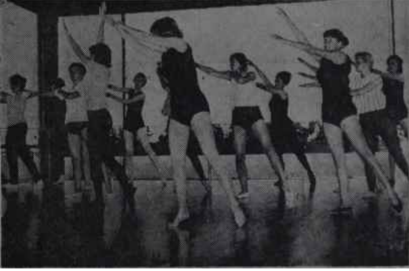
Bir spor salonunda gençler Eksik bir şey yok

rek veya görmeyerek, manzarayı seyrediyorlardı. Bundan sonra çıkacakları kat ise göklerde. Bu, dönüşü olmayan bir yolculuktu.