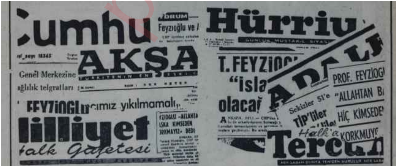
"4. Kuvvet" in iki ayrı yüzü inanarak yazanlar, inanmadan kuyu. kazanlar

Uzak solun dergileri, A.P. organlarının 180 derece tersi bir tutumdadırlar. Feyziöglünü kötülemekte, onu hiyanetle suçlamakta, fakat C.H.P.'yi ve Ortanın Solunu övmemeye de son derece dikkat etmektedirler. Ortanın solunun bir "burjuva yutturması" olduğu görüşüne sadıktırlar, Feyziöglü bunu bile aşırıydı saydığı için kendilerine hedef teşkil etmektedir. Bu yönde Ant en ileridedir. Yön onun daha gerisindedir.