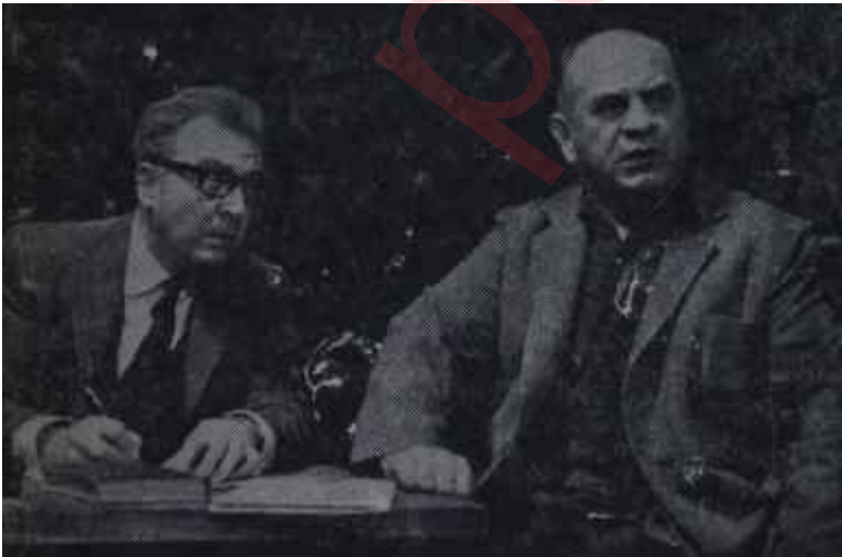
Oda Tiyatrosunda "Savunma" Ruhların karanlığına tutulan ışık

Milletler Tiyatrosunun yeni Müdürüne, sanat işlerinde, bir Yüksek Kurul yardımı olacaktır. Yüksek Kurul Kültür, Dışişleri, İktisat ve Maliye Bakanlıklarıyla, Seine ve Paris Belediye Başkanları, Seinc Genel Meclisi, Fransız Tiyatro Merkezi ve Milletlerarası Tiyatro Enstitüsü temsilcilerinden meydana gelmektedir. Ayrıca, Devlet ve Belediye temsilcilerinden kurulu bir Denetleme Komisyonu da idari ve mali işlerde yardım edecektir. Uluslararası Kartel