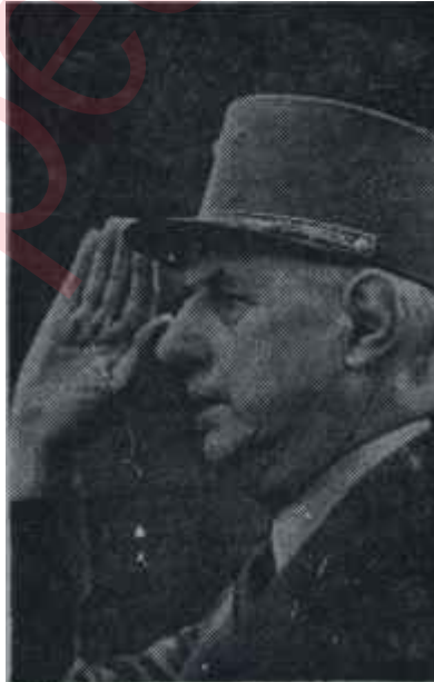
De Gaulle ...evet derse..

derdi. Oysa bugün, 1958 yılında iktidara geldiğinden buyana Fransada ilk defa şiddetli bir muhalefetle karşı karşıyadır. öte yandan Fransa-