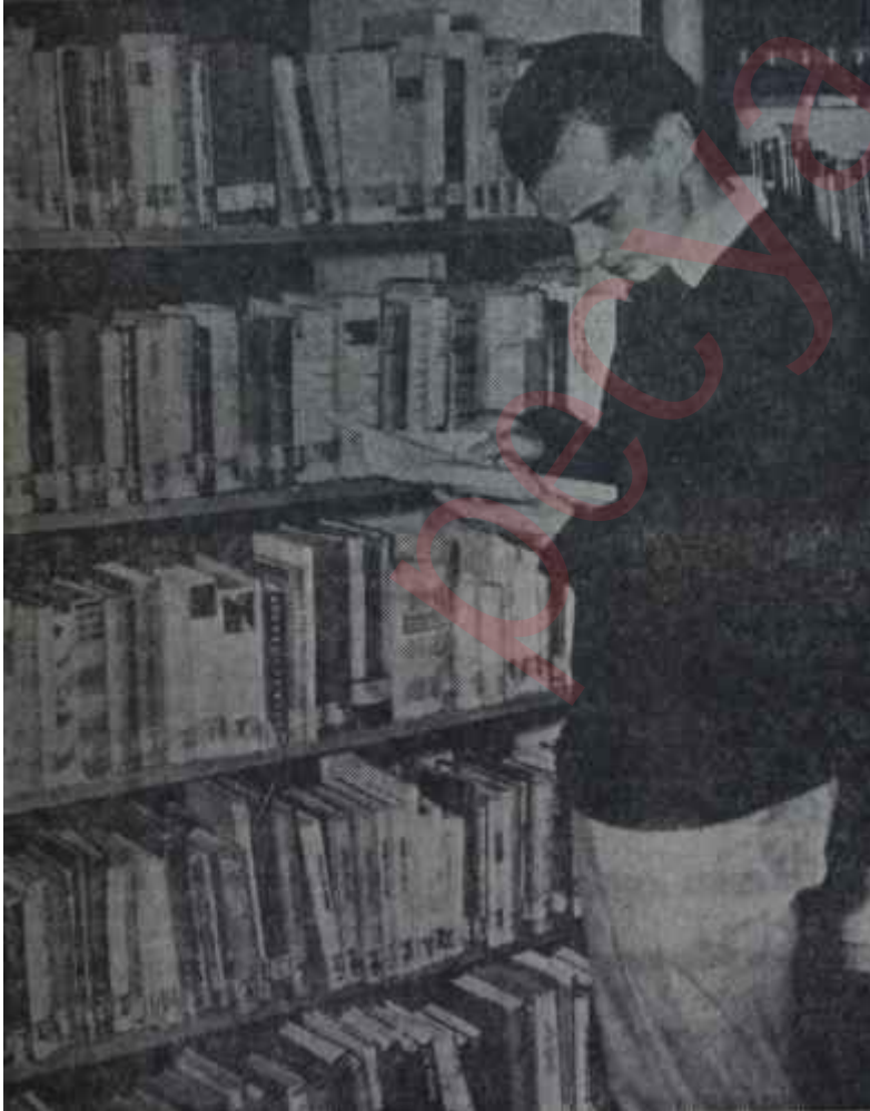
Bir alman genci yetişiyor Ham maddesi bilgi

İhtiyarlar evinin beş katını da gezdik. Pırıl pırıl odalarda yaşayan yaşlıların kimisi kitap okuyor, kimisi bir masa oyunu oynuyordu. Ama birşey bize acıklı geldi: Durumları bozulan ihtiyarlar bir kat yukarıya çıkarılıyorlardı. Frankfurta hakim, döner bir kale olan Henninger kalesinin çok yakınında hemen aynı hizada idik. Artık kendi kendilerine hiçbir iş yapamayan ihtiyarlar, tıpkı bir serde oturur gibi, bu camekanlı salonlarda oturuyor ve, göre-