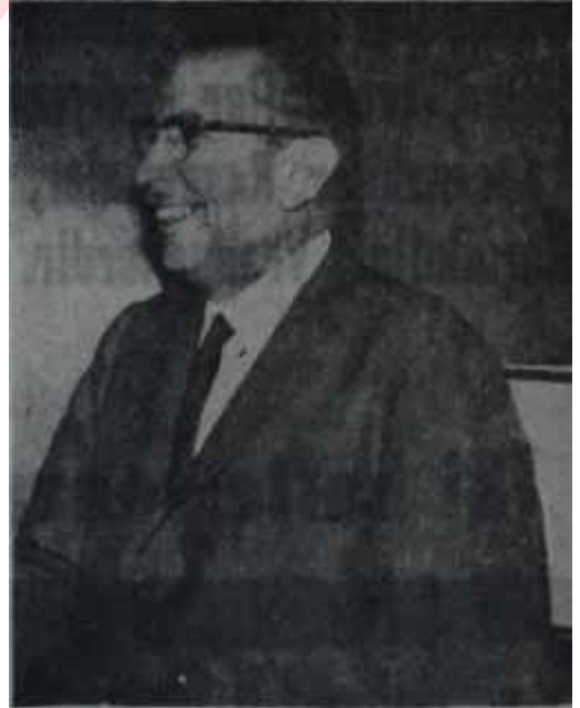
Dışişleri Bakanı Çağlayangil Cifesi çıkan işler

Bunun tedbirini almak kime düşer bilinmez ama, bir tedbir alınmasının tam zamanıdır.