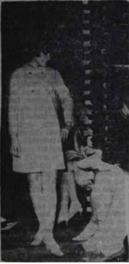
Renanda defile Göz ziyafeti