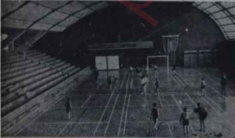
Gençlik Evinde spor Sağlam kafa, sağlam vücut..

"— Tabii, gençleri zararlı faaliyetlerden korumak için de bir takım kanunlar vardır, örneğin, onsekiz yaşından aşağı gençler lokallere gidip içki içemezler; onaltı yaşından küçükler ise gençlik lokalleri dışında genel gece klüplerinde dansedemez ve hatta buralara giremezler. Bizim örgütümüz, elbette ki kanun yapma yetkisine sahip değildir. Ancak biz, politikacılar kanalı ile