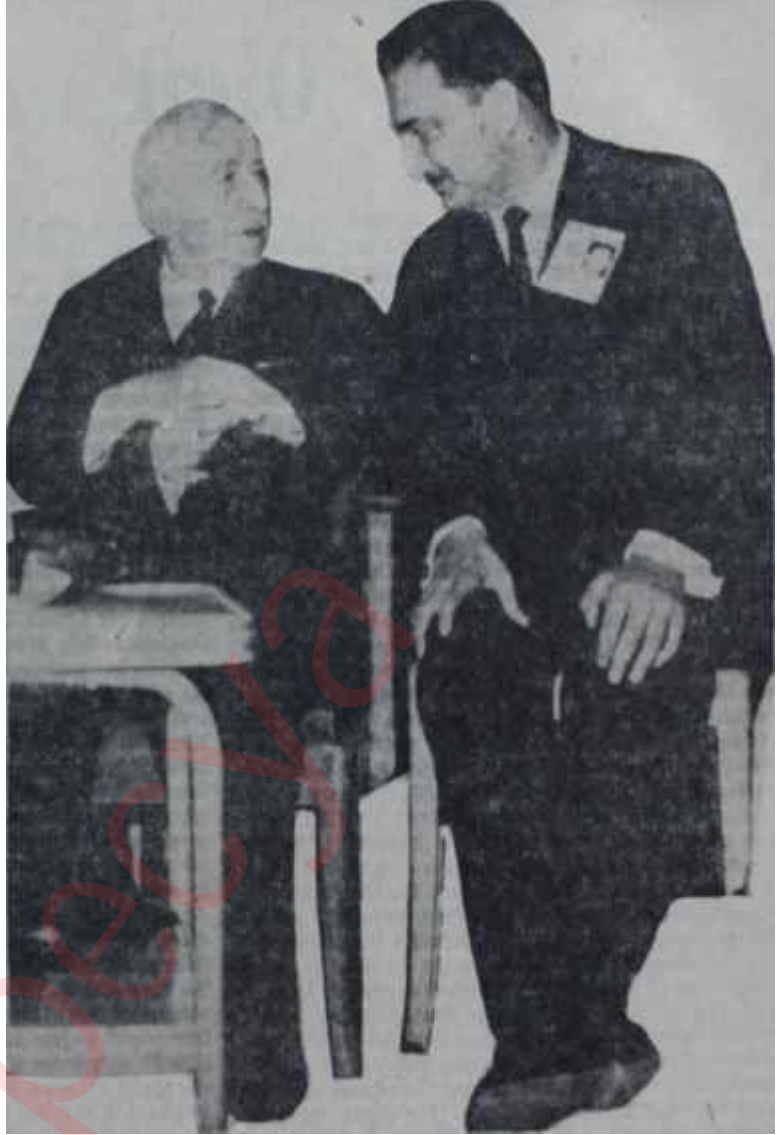
İnönü ve Ecevit başbaşa İki baş, bir parti için

"— Çıktığımız mücadele bizi güçlü kılmıştır. Sayımız önemli değildir, başaracağız" dedi .