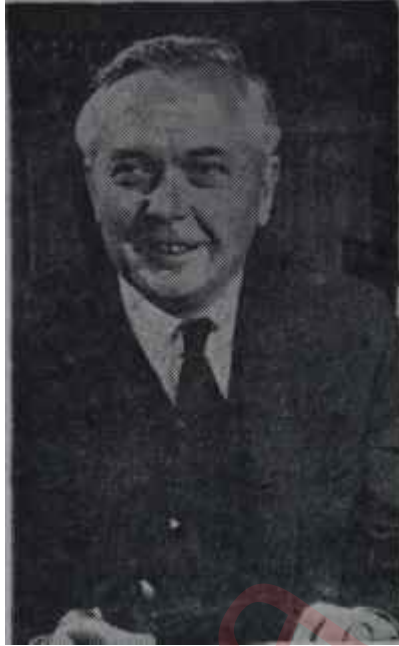
Harold Wilson De Gaulle...

Başbakan Wilson, başarısı gene General De Gaulle'ün tutumuna bağlı olan bu kararı vermeden önce uzun bir zemin yoklaması dönemi geçirmiştir. İngiliz yöneticileri, geçtiğimiz aylar içinde Ortak Pazar ülkelerinin başkentlerini dolaşmışlar ve 6'ların bu konuda ne düşün- düğünü öğrenmeye çalışmışlardır. Aslında, General De Gaulle'ün ne düşündüğünü bilmeden, Ortak Pazarın öteki üyeleri, Wilson ve arkadaşlarına hiçbir kesin söz verecek durumda değillerdi. Nitekim, vermemişlerdir de... General De Gaulle ise Wilson'la yaptığı görüşmede bu konuda kendisini bağlamamaya özel bir dikkat göstermiştir. Ancak, bütün bu konuşmalar sonunda Wilson'un İngilterenin bu defa bundan dört yıl öncesine göre daha şanslı olduğu kararını verdiği anlaşılıyor. Gerçekten, bazı tarafsız çevrelere göre, General De Gaulle şu sırada İngilterenin Ortak Pazara girişini belki geciktirebilecek kudrettedir ama, önleyebilecek kudrette değildir. Çünkü bu defa Ortak Pazarın öteki üyelerinin ve Fransız kamuoyunun General üzerindeki baskısı eskisinden çok daha fazla olacaktır. General De Gaulle, bundan dört yıl önce, Fransızların gözünde, kanlı Cezayir savaşını sona erdiren ve Fransaya siyasal istikrar getiren fi-