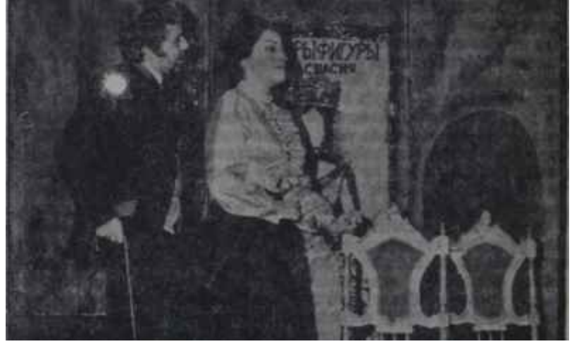
Arena Tiyatrosunda "Anastasia" Milyonların unutturamadığı efsane