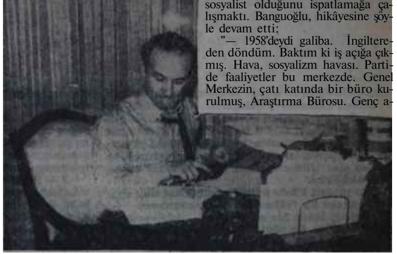
ÇEP'in hârika çocuğu Kırca çalışıyor Ne ararsan bulursun, samimiyetten gayri

Bir yandan, Parlâmentoda gerekli mekanizmayı kurmakla uğraşan Merkez Yönetim Kurulu, bir yandan da teşkilât çalışmalarını ve Ortanın Solunu halka anlatma Plânlan hazırlamaktadır. Bütün çalışmalar, eskiden olduğu gibi, yine bölge esasına göre ele alınacak ve her bölgeye ait geniş çalışma programları hazırlanacaktır. Gerek Teşkilât ve gerekse Genel Merkez seviyesinde yapılacak olan çalışmalarda karşı kuruluşlarla pek fazla uğraşmamak