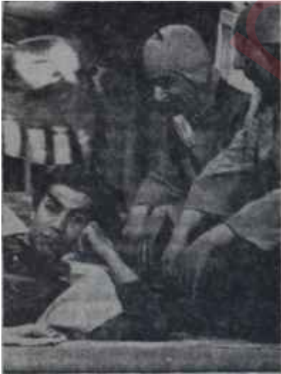
"Midasın Kulakları" Nancy yolunda