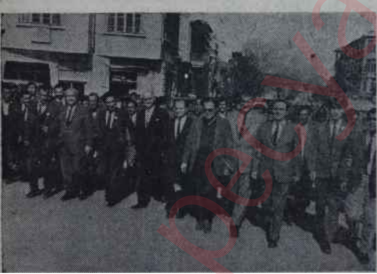
CHP'nin iki cephesi: Profesörler ve halk adamları