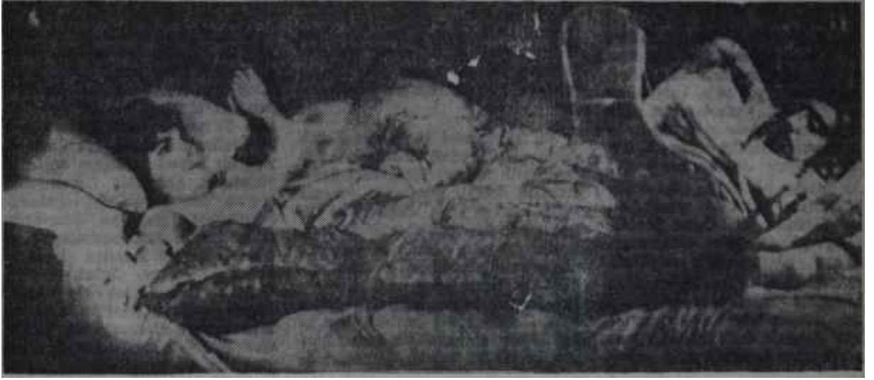
"Ulysses"den bir sahne Cannes'da skandallar zinciri