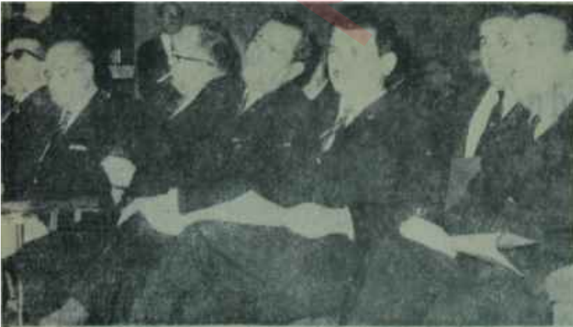
Türk Standartları Enstitüsündeki toplantıda Bakanlar Dostlar alışverişte görsün

Toplantının dikkati çeken özelliklerinden birisi de, Başbakan'dan ve Turizm ve Tanıtma Bakanından sonra Odalar Birliği Başkanı Suphi Batura söz verilmesinin kararlaştırılmış olmasıydı. Özel sektörcülük gösterisinde hiç bir fırsatı kaçırmak istemeyen yetkililer, bu konuda da aynı şekilde davranmışlar ve özel sektöre turizm konusunda olan inançlarını belirtmekte oldukça dikkatli hareket etmişlerdi.