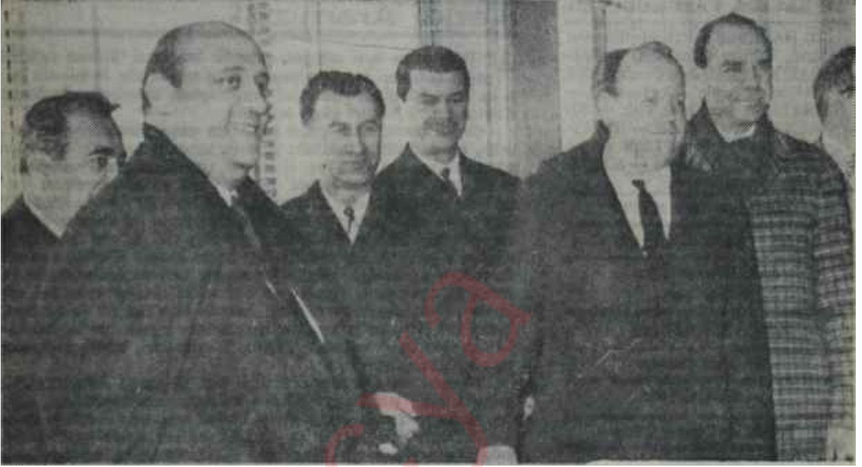
II. Demirel Kabinesi Hava alanında "Gitti Gülsüm, geldi Gülsüm"