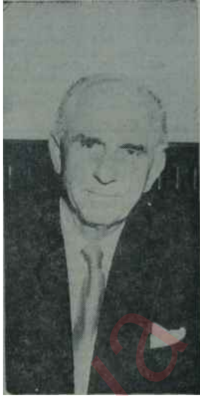
Yorgo Papandreu Kapana düşen tilki

Merkez Birliği Partisinin, seçimlerin yapılmasını tehlikeye dü-