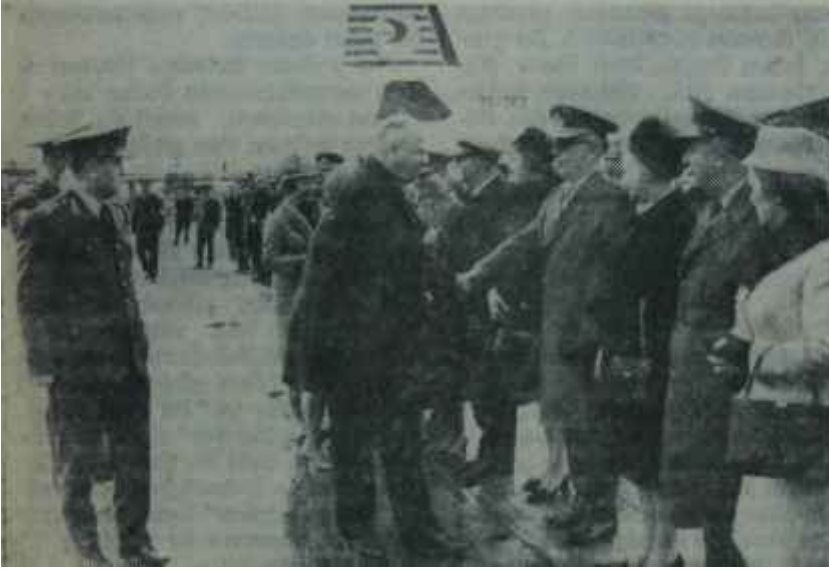
Cumhurbaşkanı Sunay Ankaradan ayrılıyor Ver elini Amerika!

dınlatılmış geniş ve iyi döşeli şeref salonunda bir devir ve teslim konuşması cereyan ediyordu. Koyu renk elbiseler giymiş, seyrek ak saçlı, gözlüklü bir zat, yanbaşında durmakta olan bir başka yaşlıca zata,