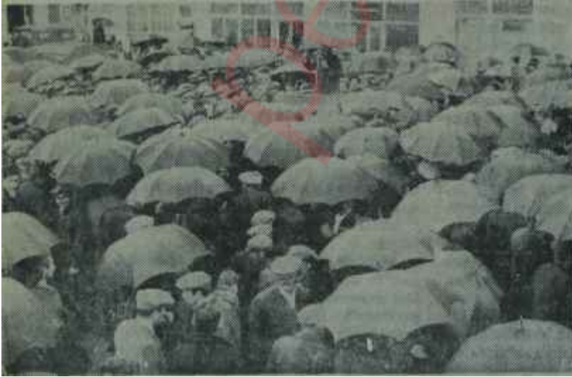
CHP Genel Sekreteri, yağmur altında halkla beraber İşte, 8'leri kızdıran tablo!

"— Arkadaşlarımız Ulustan memnun değiller. Hakları var.. Ama, Turhan FeYZioğlundan memnunlar mı? Bin defa daha az memnun olmaları lâzım. Ulus kim, FeYZioğlu kim? Ulus bir gazete, en sonda.. Partinin "resmî organ"ı olsa bile.. Ama FeYZioğlunu, Partiyi yıkmak için Don Kişot kesilmiş bu adamı bu Grup hâlâ kendi Başkan Vekili diye tutarsa, bizim Ulustan şikâyetimiz bir mâna ifade eder mi ve en önemlisi bu teşkilât bizi, temsilcisi diye tutar mı? Evvelâ şu belâları biç olmazsa bizim temsilçiliğimizden atalım, sonra oturup serinkanlıkla ciddi meselelerimizi konuşalım."