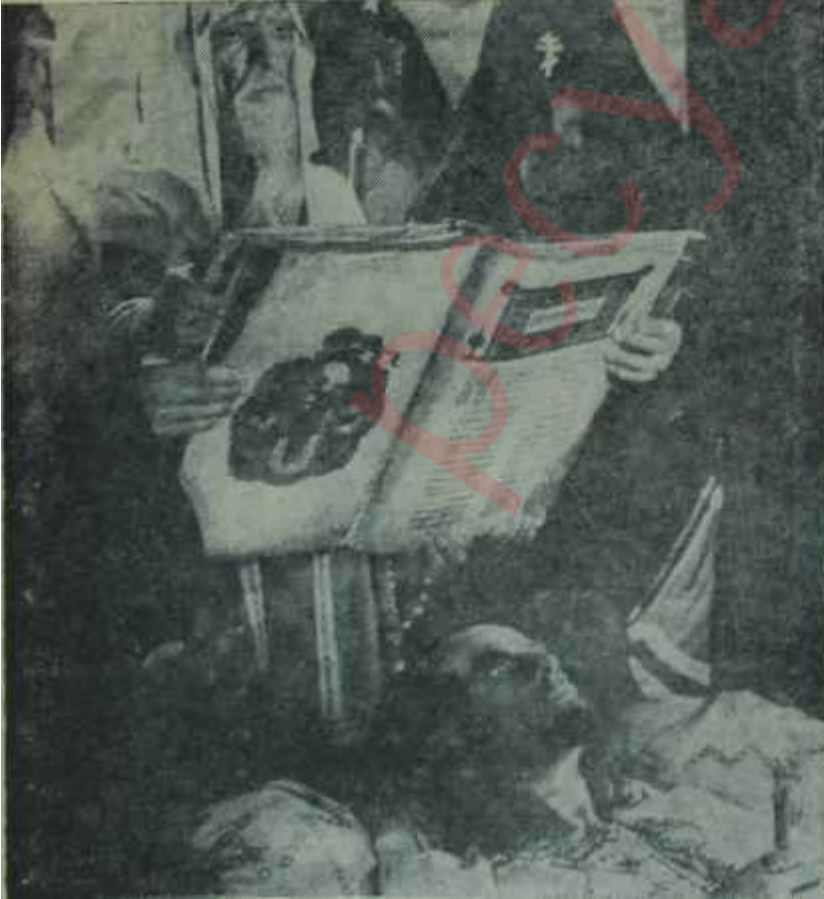
"Korkunç İvan"dan bir sahne Bir sergiden görüntüler