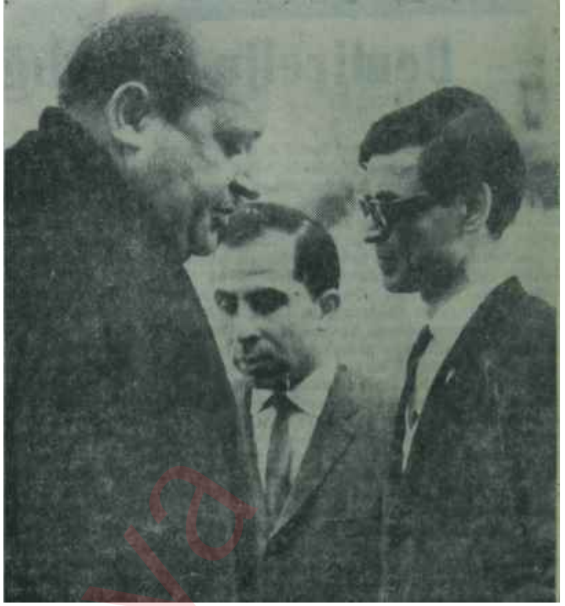
Demirel, 31 Mart günü iki âmâ ile Görenler ve görmeyenler

Bu manzaraya bakılırsa, birbiru- çuk yıldanberi sözü edilen ve nihayet gerçekleşen "kabine revizyonu" Demirelin galibiyeti ile sonuçlanmıştı. Öyle ya, Başbakan, ana muhalefet partisinin karışıklık geçirdiği bir anda kabinesini kuvvetlendirmiş, üstelik, Gruptaki hizip liderine -Başbakan Yardımcılığı istediği bilindiği halde- Ulaştırma Bakanlığını