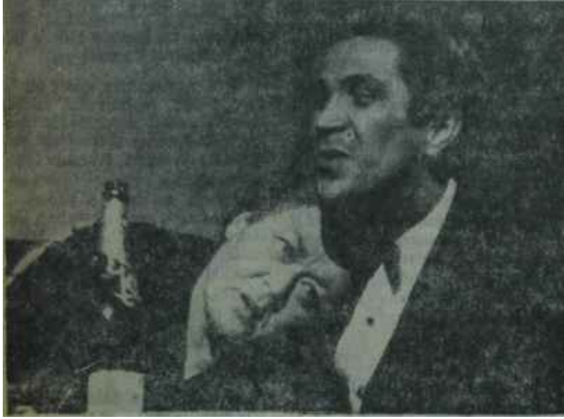
Yeni Sahnede "Bü tün gün ağaçlarda"