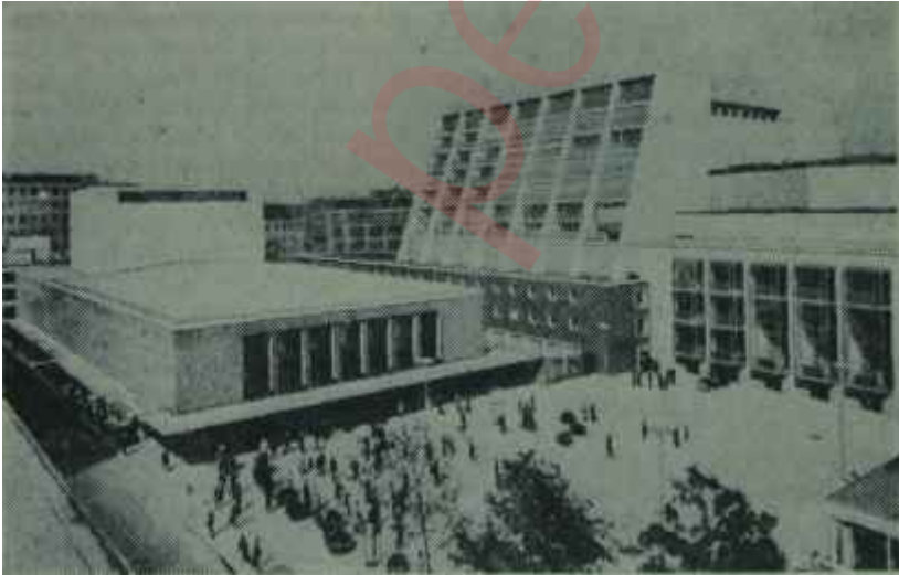
Köln Şehir Operası ile Şehir Tiyatrosu Tiyatro mimarisinde yenilik

Bonn, Beethoven'in doğduğu, çocuk denecek yaştaiken saray orkestrasında keman çaldığı şehirdir. 1959'da üçüncüsü yapılan "Beethovenhalle", her iki yılda bir, dünyanın en ünlü icracılarını, sonbaharda, burada topluyor, eserlerini çalarak, dâhi besteciyi anmalarına vesile oluyor. Ama bu şehrin şimdi. 1965'denberi, gidilip görülmeğe değer bir büyük ve modern tiyatrosu da var.