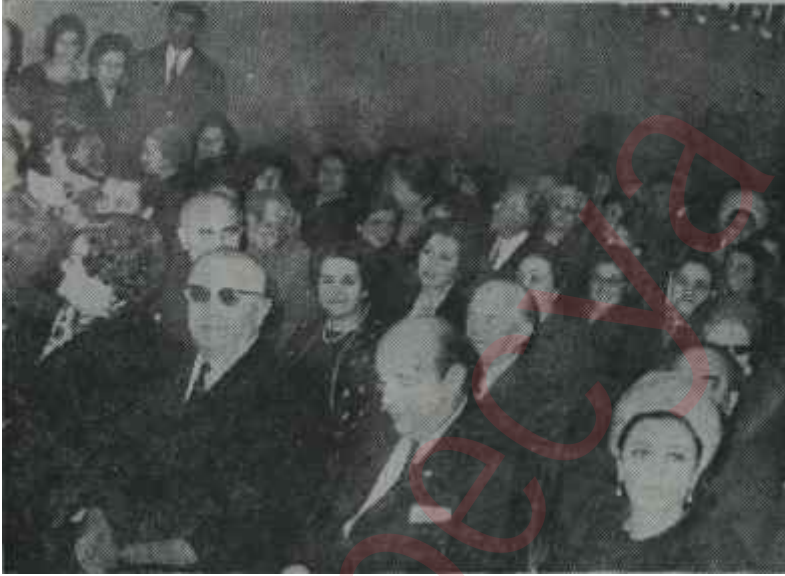
Yardım Sevenler Derneği nin gönüllüler toplantısı Herşey gönülden başlar

Genel Merkez bir de Ankarada Genel Merkez binasının üst katında 200 öğrenciyi barındıran bir kız yurdu açmıştır. Bu yurt paralıdır ve amacı, Anadoludan okumaya gelen kızlara, en ekonomik şekilde tahsil imkânını kazanmalarını sağlamaktır. Yardım Sevenler Derneği memleketimizi ziyarete gelen yabancıların ve kadın faaliyetlerini izleyen yabancı uzmanların daima ilgisini çekmiş, bu bakımdan, memleketimizdeki gönüllü çalışmalarının bir iftihar haline gelmiştir. Her fırsatta diğer derneklerle işbirliği de yapan Derneğin kapısı 10 Kasım'da, Atatürk'ün ölüm gününde bütün yoksullara açıktır; onları geri çevirmeye, onlara elinden gelen yardımı yapmaya çalışır.