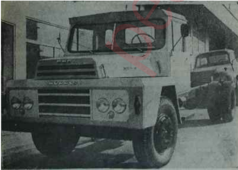
Satılmak için bekleyen bir kamyon "Ne sihirdir ne keramet, el çabukluğu marifet"