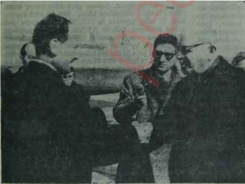
Irak Cumhurbaşkanı Arif Esenboğada Doğudan bir dost

"— Mesele Genel Kurmay Başkanlığı tarafından Bakanlığa intikal ettirildiğinde Nihat Bey ve biz, bu işi kendi şirketimizin beceremi-