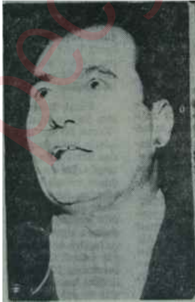
Arif Ertunga Patlıcan efendimizdir...

B aşbakan Demirel ve hanımı kalabalığın arasından sıyrılarak arabaya ilerlemeğe çalışırken büyük