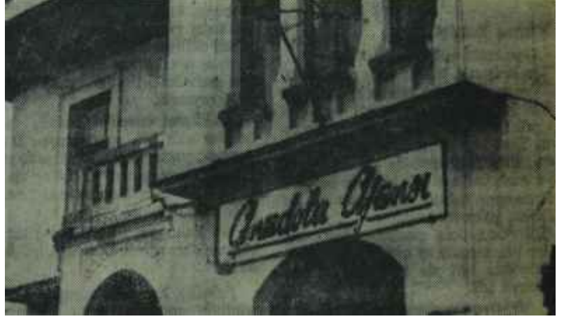
A.A. Merkezi Tarafsızlık

ğer azalar, bu süre içerisinde hiç bir suretle AA'nın işlerine karışmamış, bilâkis çalışmaların tam bir tarafsızlık zemini üzerine oturtulabilmesi için normalin üstünde bir kolaylık ve anlayış göstermişlerdir. Bu süre zarfında AA, tamamıyla yöneticilerinin insiyatifine terkedilmiş, takdir bizlere ait olmuştur.