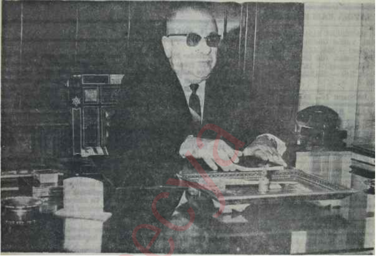
Cumhurbaşkanı Sunay Çankayada makamında Çelişik sözler...