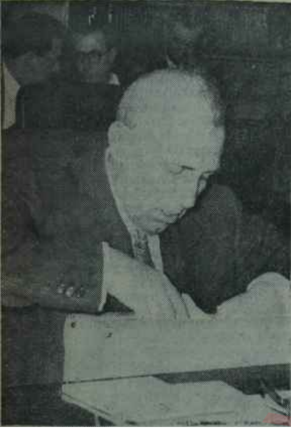
Muharrem İhsan Kızıloğlu ihtilâl sonrasının renkli simalarından biri oldu. Onun İçişleri Bakanlığı C.H.P.'nin çok şikâyetini çekti ama onun da C.H.P.'lilerden şikâyetleri vardı ve iki taraf da bunlarda haklıydı. Kızıloğlu Bakanlıktan ayrıldıktan sonra da Kurucu Meclis koridorlarında kulis faaliyeti yaptı ve nisbî temsilin kabulünü önlemeye çok çalıştı.

hayatında yeni partilerin milletvekilleri veya senatörleri olacaklardı. Bu, İhtilâlcileri çileden çıkarıyordu ve o günlerdeki hava içinde, gergin asapla, çıkarmaması da güçtü. İsmet Paşa onlara şunu söylüyordu: