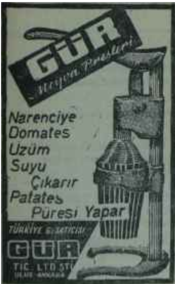
(AKİS — 66)