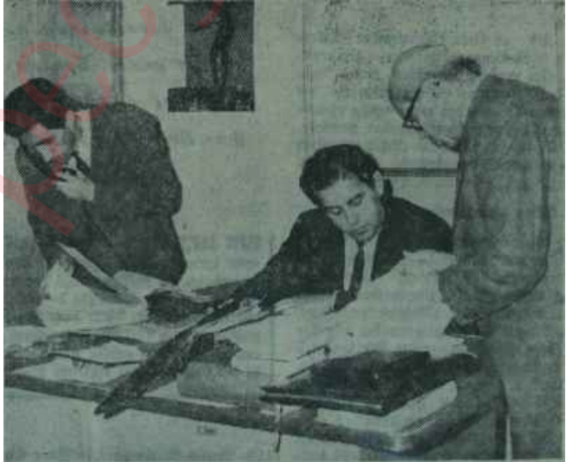
Fakir Baykurt Öğretmenler Sendikasında Aynı yoldan ikinci geçiş

Bütün bunlar olurken, T.Ö.S. ve T.Ö.D.M.F.'nin kendi üzerlerine düşeni yapmadıktan; ürkek ve çekimser davrandıkları, yöneticilerin, "kırım"ın ucu kendilerine dokunmadığı sürece pasif kaldıkları, kendi canlan acıyınca bildiri üstüne bildiri yayınladıktan ve gazetelerin eşliğini aşındırdıktan şeklindeki şikâyet, öğretmen çevrelerinde yaygın durumdadır. Bir zamanlar çok daha küçük sebeplerle kıyameti koparanlar, bugün ancak kapalı kapılar ardında dertleşmekle yetinmektedirler. Gerçi yasalar, Sendika ve Federasyonun daha sert çıkışlar yapmasını engellemektedir ama, yine de güçlü bir karşı mücadelenin mümkün olduğu düşüncesi yaygındır.