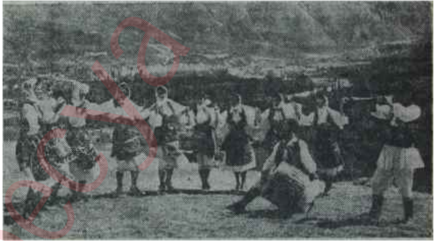
Makedonya folkloründen bir örnek Türk etkisi nasıl da belli!

komünlerin hazırladığı plânlar izlemektedir. Komünler, yugoslav politik anlayışının tipik bir özelliği olarak, toplumsal hayatta çok önemli roller oynamaktadırlar. Yugoslavyanın bugün ulaştığı nokta, olumlu veya olumsuz ise de, buraya varılmada en büyük rollerden birisini, muhakkak surette, komünler oynamışlardır. Komünlerin seçimle gelmiş yöneticileri, komün sınırları içindeki her türlü toplumsal, ekonomik ve siyasal faaliyeti düzenlemekte ve planlamaktadırlar. Yönetim dizginlerini sıkı sıkıya elde tuttukları ve günlük yaşayışın içinde halkla omuzomuz buldukları için, hata payının küçük olmasını sağlamakta bazı kolaylıklar elde etmektedirler. Bu nedenlerle finansman, yatırım,