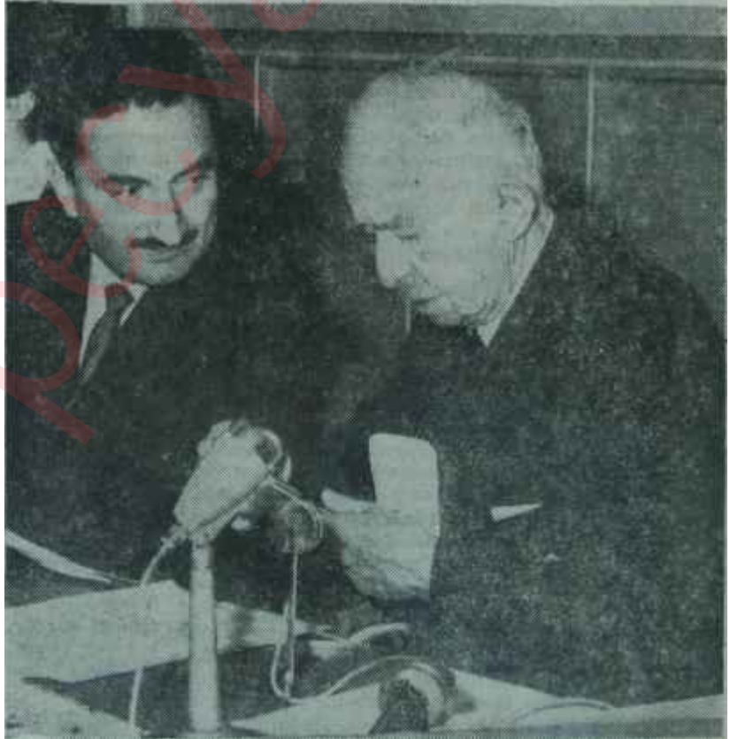
C.H.P. Genel Başkanı İnönü ve Genel Sekreter Ecevit "Ortanın Solu" aklın yolu

G ömleğinin yakalarını, önünü arkasına giydiği kahverengi eski kazağının üstüne çıkarmış kısa boylu esmer adam, gazetecinin sorusunu dikkatle dinledikten sonra bir süre düşündü, sonra gayet açık ve kesin olarak, "yeni bir parti kur-