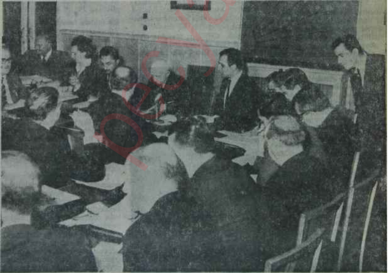
CHP Meclisi toplantı halinde Yolunu şaşırırlar da var

Nitekim bu hafta, "Ortanın Soluna karşı" etiketi altında CHP'de İnönünün muhaliflerinin bir "iktidar çıkışı" yapmak hevesleri ve hazırlıkları artık kendini tamamen hissettirmişti. Zaten bir süredenberi AP'li gazetelerde, Feyzioğlu lehine yazılar yayınlanmağa başlamıştı. Hattâ geçenlerde bir AP'li gazetesinin başyazısında kayserili Profesör açıkça övülmüştü. Ve bu başyazı, mahut Tahkikat Komisyonu üyeliği yapmış bir eski DP'liye aitti. Daha az bilinen bir husus ise AP'deki "Aydın kanat" adına Aydın Yalçının, CHP'deki "Feyzioğlu kanadı" adına ise Coşkun Kurcanın karşılıklı ola-