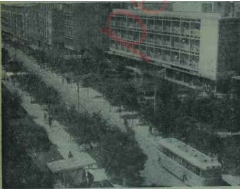
Zagrebde yeni bir mahalle El işler, göz görür, dil övünür

veya deviasyonist bir sosyalist uygulama ile kapitalist dünyanın ekmeğine yağ sürmektedir" demek, işi hiç bir şekilde halletmediği gibi, batılıların görüşüyle, "üretici ve sermaye niteliğinde bir özel mülkiyet olmadıktan sonra, gerisini anlamaya çalışmak neye yarar?" demek de hiç bir şeyi halletmemektedir. Özellikle Türkiyede, sosyalist akımların yeni yeni tartışıldığı, unutulmuş defterlerin karıştırılarak, "Asya tipi üretim tarzı" gibi konulardan medet umulduğu bir dönemde, yugoslav örneği üzerinde durmakta faydalar vardır. Kendisini sosyalist sanan birçok kimsenin yaptığı gibi, kapitalizmi tenkit etmek dünyanın en kolay ve en rahat işidir. Şartlan Türkiyeye pek çok benzeyen Yugoslavyanın, bugün ulaştığı noktaya gelineye kadar yaşadığı macerayı bilmek, bu bakımdan, önem taşımaktadır.