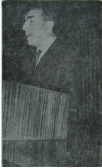
Alpaslan Türkeş "İpin ucu bendedir."

Bütün bunları bilen, hiç değilse hesaplayan Demirel ve çevresi, bir süredir yoğun bir transfer faaliyetine girmişlerdir. Meselâ Safa Yalçuk kanalıyla YTP idarecilerine, AP'ye iltihak etmeleri için haber gönderilmiş ve fakat "elçi" eli boş dönmüştür. Çünkü şu günlerde YTP ile MP'de, birbirleriyle birleşme temayülü mevcuttur ve yapılan temaslarda, prensipte anlaşmaya varılmıştır.