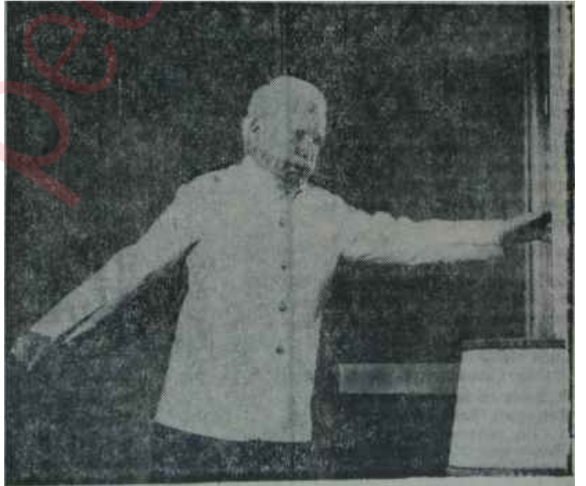
Chaplin'in dönüşü 1966'nın sürprizi

Fransa, birkaç yıldanberi sürekli olarak kaybettiği seyirci yüzünden -1966'nın ilk üç ayında bir yıl öncesinin aynı dönemindekine göre seyircinin yüzde 12'si kaybedilmiştir- ekonomik bakımdan bir bunalım içinde bulunmasına rağmen, yine de canlılığını korumağa çalışmıştır. Claude