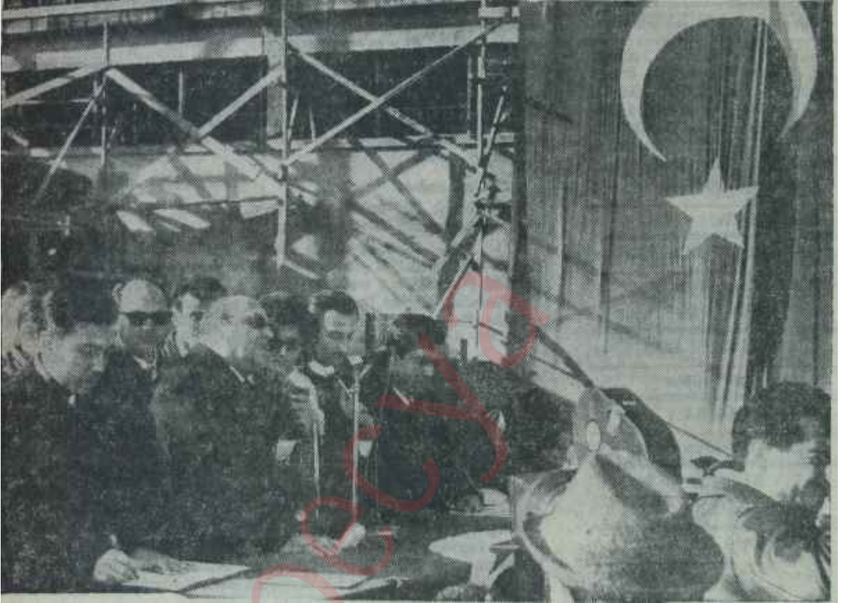
Süleyman Demirel Ambarlı Santralını açıyor