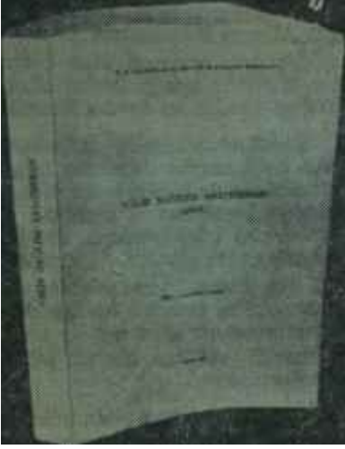
"Türkiyede Mili Gelir Dağılımı" İşte asıl mesele

dır. Zira DPT, problemi çözmek için, çok çeşitli yöntemleri aynı zamanda deneyen bir çalışma yapmıştır.