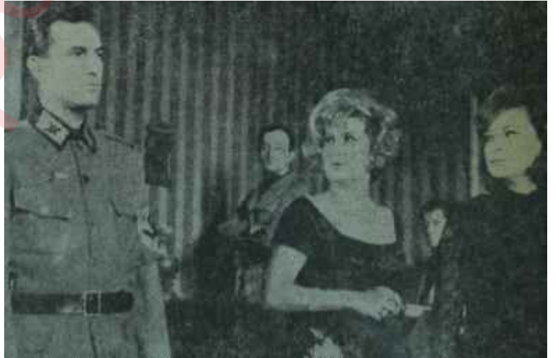
İstanbul Şehir Tiyatrosunda "Canavar Sofrası" Can pazarı