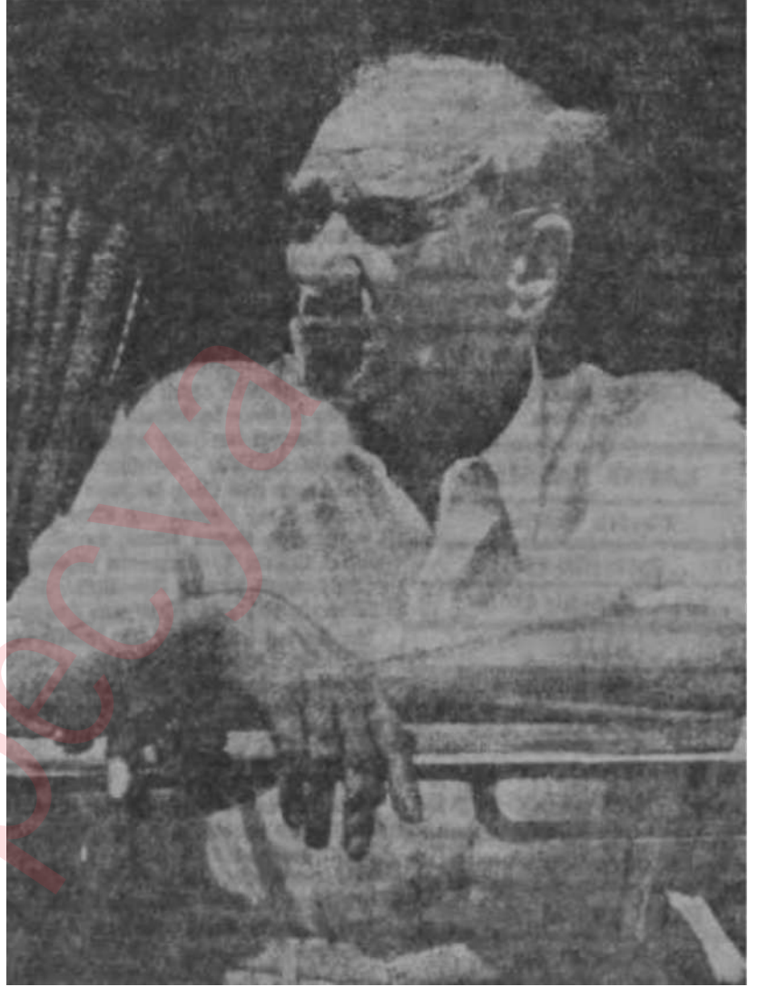
Atatürk ölümünden bir süre önce önemli olan, getirdikleri

Atatürkün ölüm yıldönümlerinin havasını değiştirmeye kim, nihayet cesaret edebilecektir? Demogojinin bu kadar yaygın olduğu bir ortam içinde bu, bir gözü peklik meselesidir. Atatürk Günü tabii şekline sokacak kimse veya bunu teklif eden, derhal, bilhassa Atatürke hiç inanmayanlar tarafından "Atatürkün aziz hatırası"na saygısızlıkla suçlanacaktır. Meclislerde Atatürkün bir heykelinin bulunmasının ve sanki sağlamış gibi adının her yoklamada okunarak bütün heyetin o çağırışa "Burada!" demesinin bile -aman yarabbi, ne suni bir anma şekli!- talep edildiği bu ortam Atatürkü gereği gibi anmamızın en büyük maiidir. Sanki biz "Ya Hasan, Ya Hüseyin" diye dövünen bir milletiz ve sanki Atatürkün gelişi, türk-