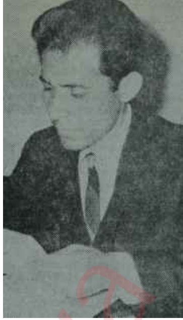
Hayrettin Uysal Cihad açıldı

Türkiye Öğretmenlerinin gerçek temsilcisi olan Türkiye Öğretmen Dernekleri Milli Federasyonu Genel Başkanı Hayrettin Uysal durumu şöyle özetledi: