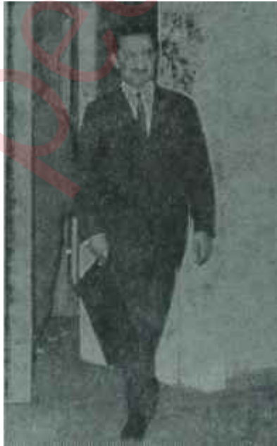
Bülent Ecevit Teşkilâta hareket

Biten hafta içinde, CHP'de garip bir hadise oldu. Kurultaydan mağlûp çıkan Feyzioglu takımı,