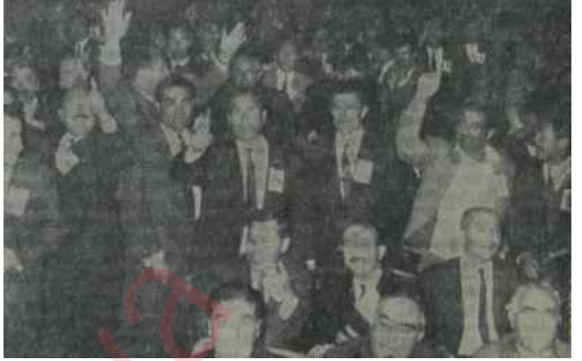
CHP Kurultayından bir sahne

CHP'deki sağ kanat, İsmet İnönüyle sosyal ve ekonomik konularında uyuşmazlık halindedir. Cumhuriyetin kurucusu ve lâiklik ilkesinin şampiyonu olan CHP'de irtica maneviyat değil, maddiyat sahasındadır. Ortanın Solu diye adlandırılan reform programı CHP'nin muhafazakâr zümrelerini ayağa kaldırmıştır. Eşraf takımı, CHP'nin yıllardır en sıkı desteklerinden biri olmuştur. Bu takım, Atatürk'ün ve ondan sonraki günlerin bütün devrimlerine yürekten katılmıştır. Eşraf, ancak son demokrasi devriminde biraz mırın-kırın etmiş, bunda kendi hâkimiyetinin tartışılması tehlikesini görmüş, fakat netice itibariyle büyük mukavemet göstermemiştir. Fakat sıra sosyal adalet reformuna gelince vergilerin açıklanması, toprak dağılımının yeniden düzenlenmesi, işçi hakları, servet beyannameleri, milli gelir gibi konular Eşrafın hiç hoşuna gitmemiştir. Şimdi, Kurultayda İsmet Paşanın Ortanın Soluna karşı çıkanlar eski CHP'nin bu destekleridir. Fakat görünen, CHP'nin bu desteklerini feda etmek ve yerlerine yeni destekler koymak niyetinde olduğudur.