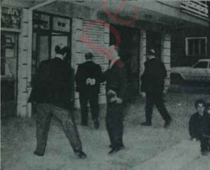
Esatoğlunun kokteyline gelen Ecevit ekibi Kurultay stratejisi plânlanıyor

Kurultay, bu önemli noktayı her halde dikkat nazarına alacaktır.