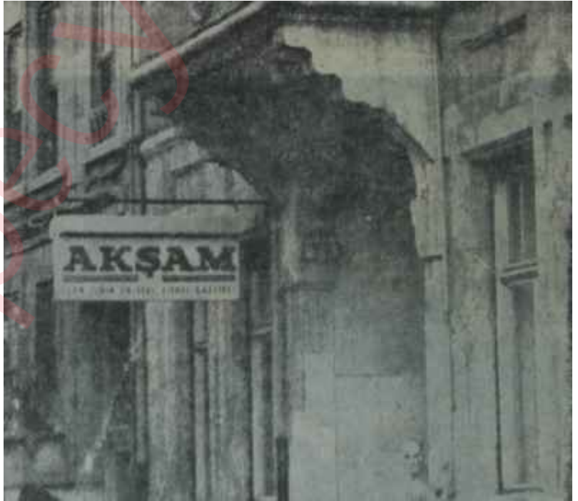
Akşam Gazetesinin binası

Bundan iki hafta kadar önce bir gün, bir genç adam İstanbulda, Bâbüâlîde, emektar Akşam gazetesinin tahta merdivenlerini süratle