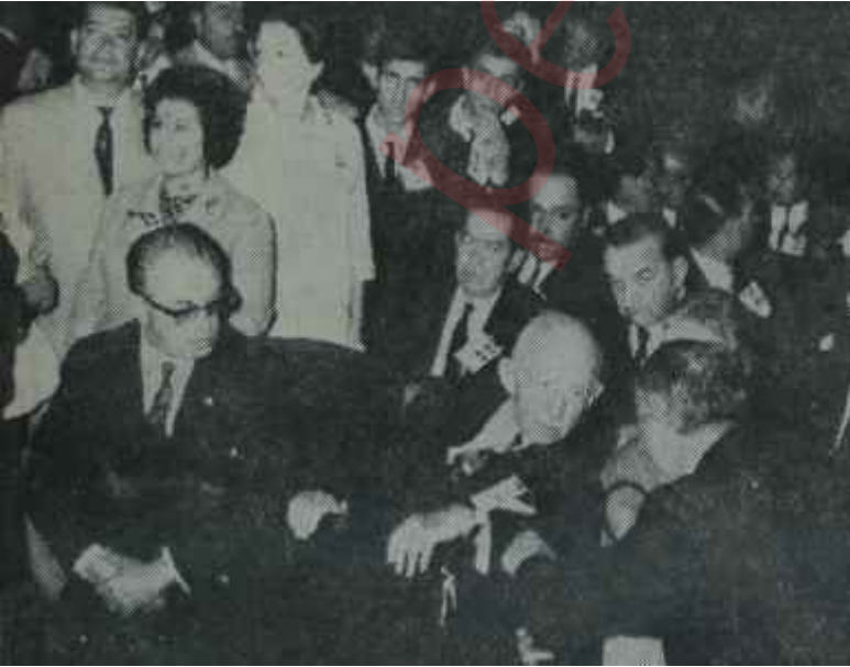
Genel Başkan İnönü Kurultayda Meşaleyi lider yaktı

Genel Müdür 13.9.1966 günü, gerek Ticaret Bakanlığına ve gerekse TRT ye gönderdiği yazılarla bazı çevrelerin dikkatini üzerine çekmiş bulunuyordu. Çünkü bu yazılarında "depremin vuku bulduğu 19.8.1966 tarihinden 10.9.1966 ya kadar bölgeden 9173 baş koyun ile 6818 baş