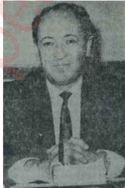
Suphi Yavaşca Millet malı deniz

Bu tartışmalar geride kalmış, Danıştay kararlarının uygulanması teamül haline gelmiş, ellerinde Danıştay kararları, haklarını alamadan merci arayan memurların sayısı, rahmetli Kümbetlioğlunun sözü ile, "görülmemiş" seviyeyi bulmuştur. Bugün memur, haksızlığa uğrarsa, merci bulamayacağını bilmektedir. Bu endişe, idare mekanizmasını sarmıştır. İşte partizanlığın ve kanunsuzluğun en hızlı şekilde boy atacağı, en müsait iklim budur. "Memurlar korkacaklar ve kanunsuzluklara boyun eğecekler"-dir. Zihniyet, budur. Ama, bu şartlar altında "Hukuk Devleti"nden bahsedilemeyeceği de muhakkaktır. Bu ümitsizlik öyle bir hale gelmiştir ki, haksızlığa uğrayan bir müs-