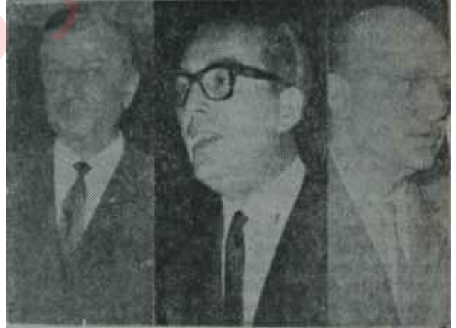
Aksal — Feyzioğlu — Erim Devrimci sfenksler

Hesaplardaki asıl yanlışlık, İnönü'den sonra partinin bu tip liderlerden her hangi birine, tek başına kalabileceği hesabıdır. C.H.P. yi tek başına devralabilme şansına malik adam yalnız Kasım dilektir. Fakat onun devralacağı parti, elbette ki C.H.P. olmayacak, manasız ve silik, ömrünü hemen yitirecek bir topluluk olacaktır. Bu hazin âkibetten C.H.P. yi koruyacak tek alternatif bugün, İnönü'nün anlattığı manadaki ve partinin büyük liderleri tarafından kabul edildiğinde şüphe bulunmayan felsefe etrafında, bunların bütün gayretleriyle toplanmalarıdır. Demirel