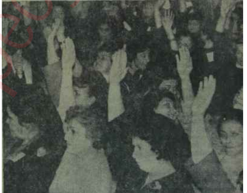
Bir Kadın Kolu kongresi Ortanın Solu, kurtuluş yolu