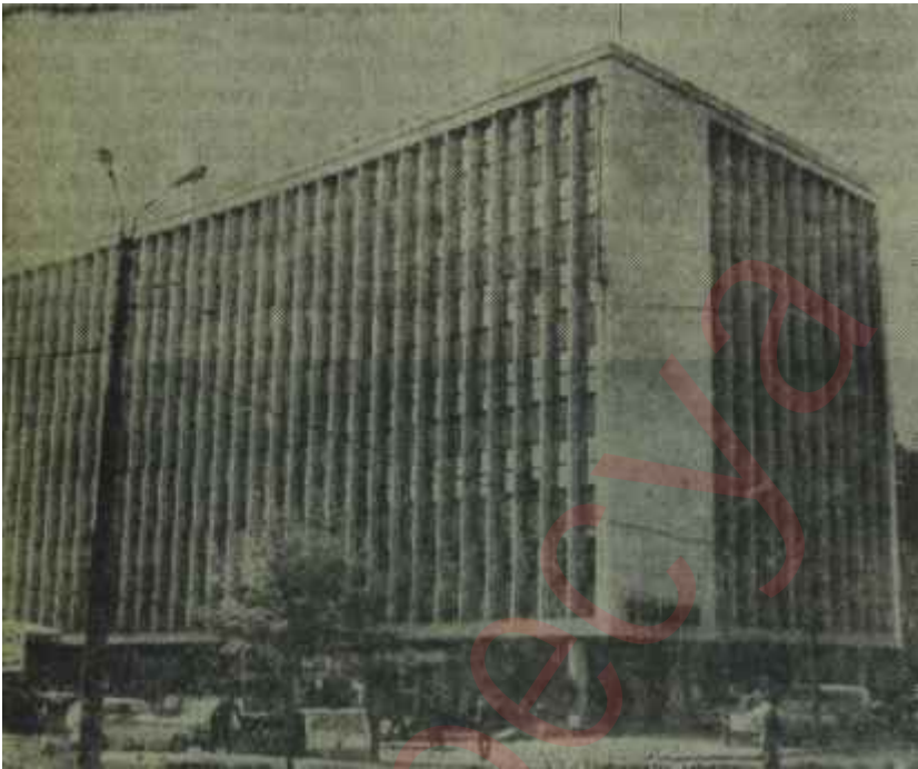
Etibank Genel Müdürlük binası

"— Sol sınırdadır değil! Ortanın Solu deyimini kullanarak basamak