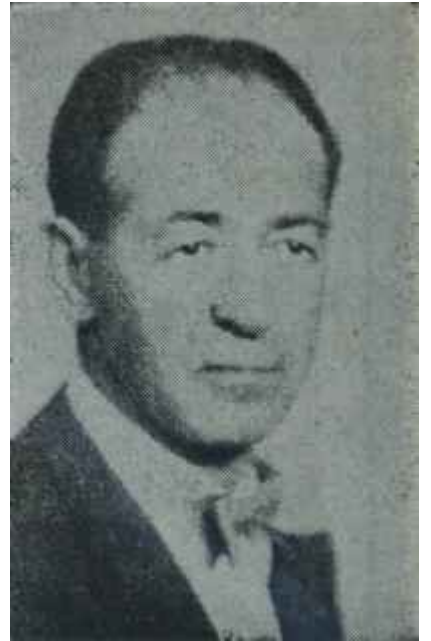
Kümbetlioğlunun boş masası ve son resmi