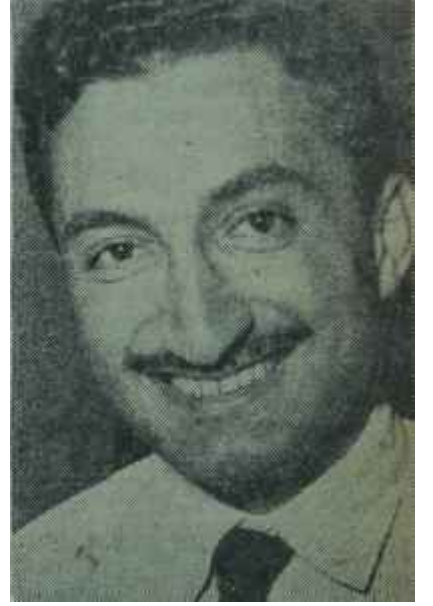
Turhan Feyzioğlu - Bülent Ecevit Maksud bir, rivayet muhtelif

baka, ekonomik reformların dışındaki bütün ilerici hareketleri bütün gücüyle desteklemiştir. Fakat, Türkiyenin şartlarının icabı, 27 Mayıs Devriminden sonra sıra memleketin ekonomik sorunlarına geldiğinde C.H.P.'nin İnönü ve genç lider takımı tarafından temsil edilen Ortanın Solu fikirleri bu Eşrafı ürkütmüştür. Şimdi, partinin bu Eşraf tabakasından ayrılıp kendisine yeni destekler bulması lâzımdır. Zira Eşraf, bir ananın ve belki lâiklik ilkesi anlamının dışında kendisiyle çok ortak noktayı, artık C.H.P.'de değil, A.P.'de görmektedir. Son seçimlerde büyük miktarda "klâsik C.H.P. oyu" nun sandığa gitmemesi bu yüzdendir. CHP. Ortanın Solu sloganını kullansın veya kullanmasın, ekonomik alandaki reformcu fikirlerini muhafaza ettikçe menfaat ayrılığı Eşrafı ken-