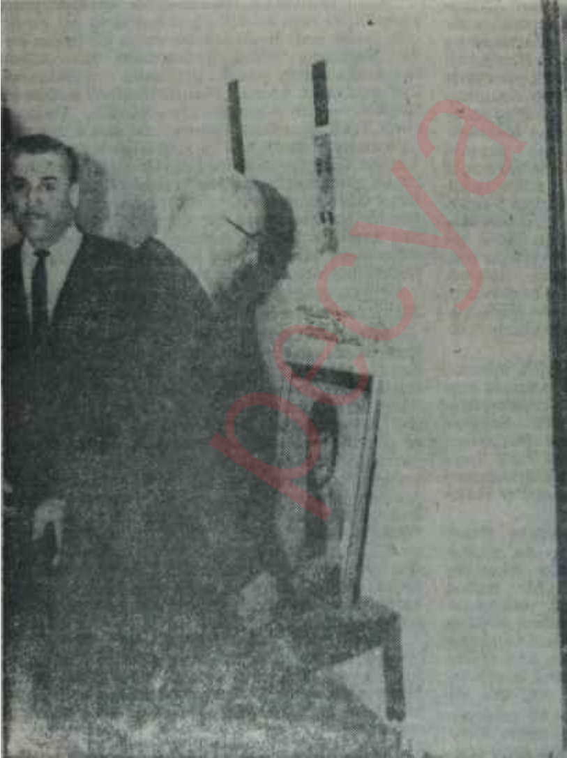
Celâl Bayar Tarabyadaki otele giriyor Birinci takım faaliyette...

Berkin "Biz kendi aramızda bir aile toplantısı yapıyoruz. Kimsenin girmesini onun için istemiyoruz.." demesine rağmen, toplantının önemli bir güne rastlaması manidardı. Zira, o sabahki gazetelerin manşetleri, Bayar da dahil, uzun masanın etrafına toplanmış olanların yüreklerini ağızlarına getirecek nitelikte haberler veriyordu. Cumhuriyet Se-