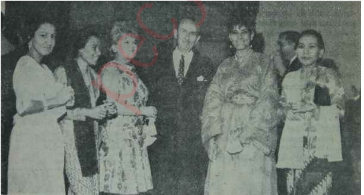
Mısır Elçiliğindeki kokteylde güzel Fas Sefresi