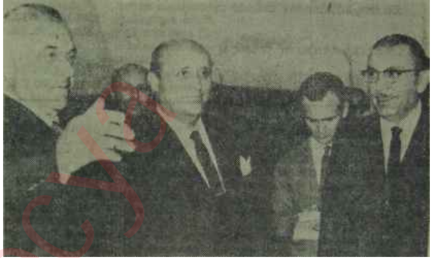
Romen Başbakanı Maurer karşılanıyor

geçmesi gerekmiştir. Bükreş ile Moskova arasındaki bağıntıların biçim değiştirmeye başladığını gösteren ilk işaretler 1961 yılında başlamıştır. Bilindiği gibi Romanyanın eski kuvvetli adamı Gheorghiu Dej ile taraftarları, 1961 yılında, Moskovaya bağlılıkları pek iyi bilinen Anna Pauker, Luca ve Gheorghescu grupunu şiddetle suçlamaya başlamışlardı. Bu suçlama, 1962'de toplanan Romanya Komünist Partisi XXII. Kongresi sırasında zirvesine ulaşmış ve savaş yıllarını Moskovada geçiren Pauker grupuyula Romanyada kalıp nazilere karşı savaşan Dej grubu arasındaki çekişme, sonunda Dej'cilerin zaferiyle sonuçlanmıştır.