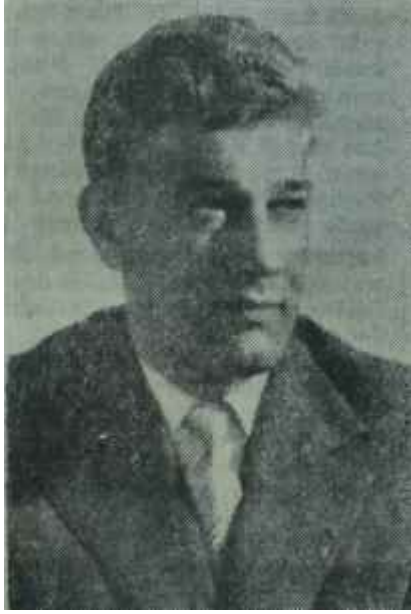
Dışişleri Bakanı Manescu Pırl pırl bir avrupalı

Maurer'in Romanya Başbakanı olduğu sırada Romanya çeşitli meselelerle karşılaşıyor bulunuyordu. Bunun en başında, hiç şüphesiz, COMECON'un Romanyaya dikte etmek istediği ekonomi politikası gelmektedir. Gerçekten de, Sovyetler Birliği, daha çok bir tarım ülkesi olduğunu ileri sererek, komünist devletler arasında yapıla-