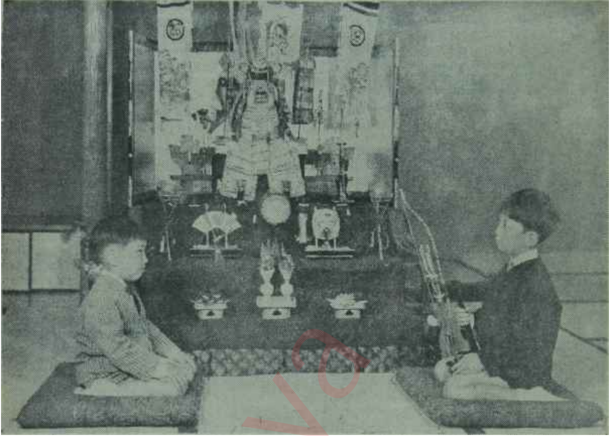
Japon, işte bu çocukların oturduğu şekilde oturuyor. Yani, iki dizini kırıp bileğinin, yahut topuğunun üzerine.. Tabii, böyle oturuş da ancak kimonoyla kabil oluyor ve bunu pantolonla yapmaya kalkıştınız mı, pantolonunuz soba borusuna dönüveriyor

Bunlara mayko-san deniliyordu ve bunlar Kyotonun bir özelliğini teşkil ediyorlardı. Akşam yağmurluydu. Bir otomobile dar sokaklardan geçerek adına Gion denilen mahalleye vardık. Geşsa Evi Tokyodakinin eşiydi. Ancak ondan daha az büyük ve daha az şıktı. Fakat Japonya'nın bütün evleri gibi aynı derecede temizdi. Tabii ayakkabılarımızı kapıda çıkardık ve tatamilere basarak üst katta bir odaya girdik. Oda da, bütün hazırlıklar yapılmıştı.