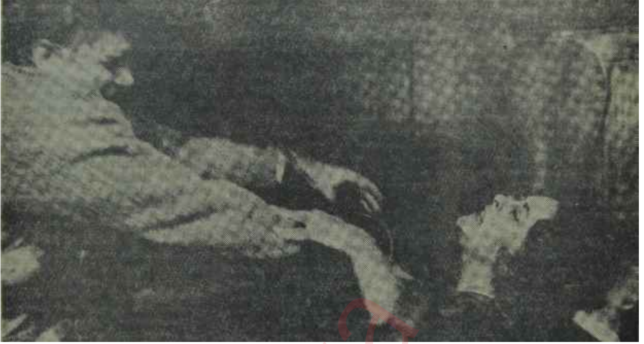
"Hain Kurt"ta, Burton ile Elizabeht Taylor