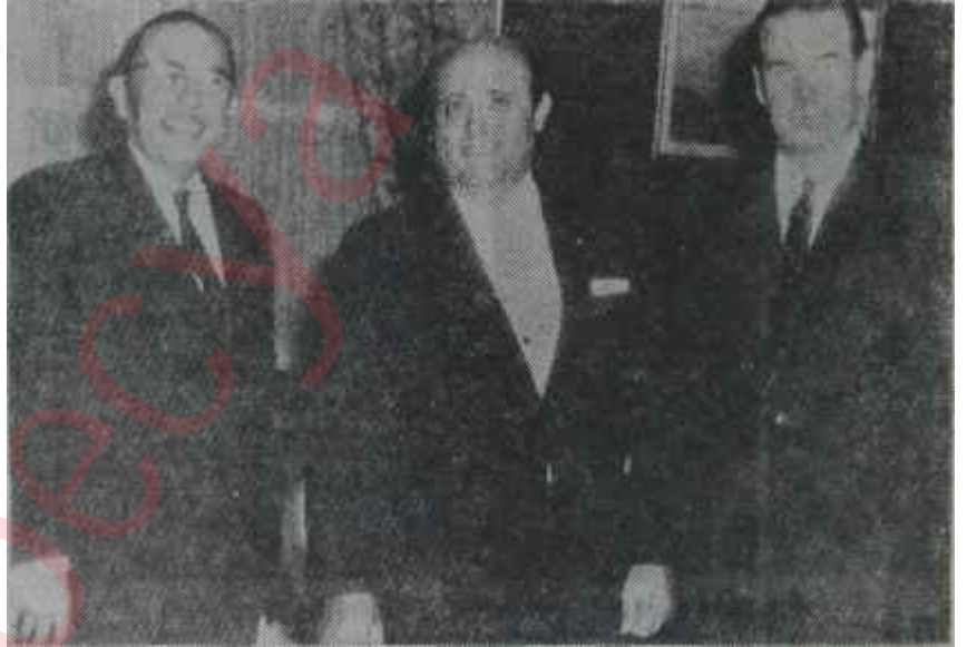
Alman Dışişleri Bakanı Schröder, Çağlayangille Nâzik görüşmeler