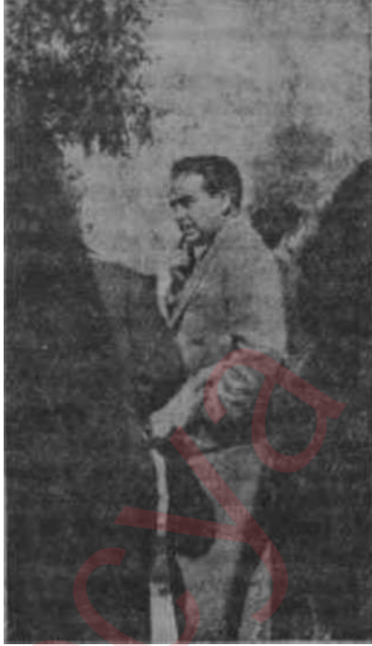
Erol Simavi Meyvalı ağaç

Basının bu durumu, gazeteciliğin "haber verme fonksiyonu" nun zedelenmiş bulunduğunu hiç olmazsa bir kısım basın için dikkatli gözlerin önüne, basın bakımından biraz tehlikeli şekilde serdi. Gazetelerin parti veya siyasi tercih itibarıyla ayrı renkte olmalarının anlaşılmayacak tarafı yoktur. Ama milli haysiyeti şiddetle ilgilendiren bir hadisede, pislüğünü külle örten kedi