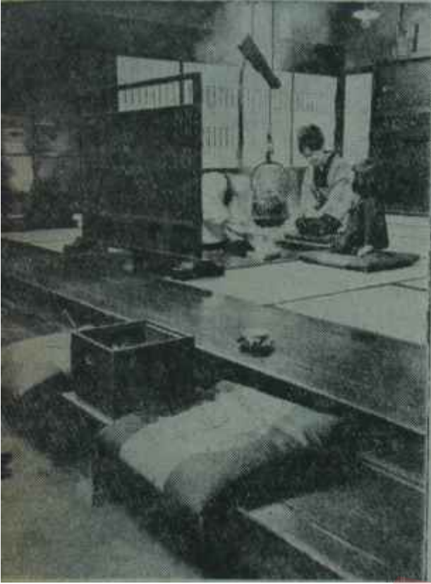
Japon evi, dünyanın en sade evi. Bir defa, yüksek eşyası yok. Her şey yerde olup bitiyor. Yerde yemek yeniyor. Yerde yatılıyor. Yerde yemek veya çay pişiriliyor. Minder, japon evlerinin tek mobilyası. Herkes, minder üzerine diz çöküyor. Tabii, alışmayan için yorucu bir oturma tarzı.

munun adı günde kaç kişi ziyaret eder, bilir misiniz?" dediler.