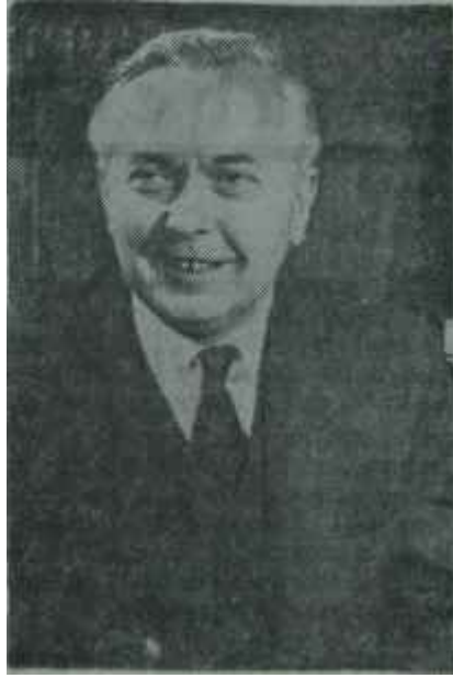
Harold Wilson Grevcilerle dertte

Deniz işçilerinin bu istekleri karşısında, işverenler, bugün için böyle ağır bir yükün altına giremeyeceklerini ileri sürmektedirler. Çalışma haftasını 40 saate indirebilmek için kendilerine iki yıllık bir