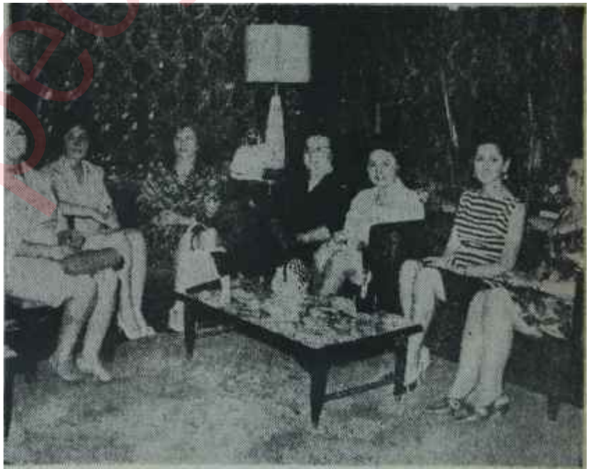
Florence Nightingale Komitesi Dinlenmeği hakettiler.