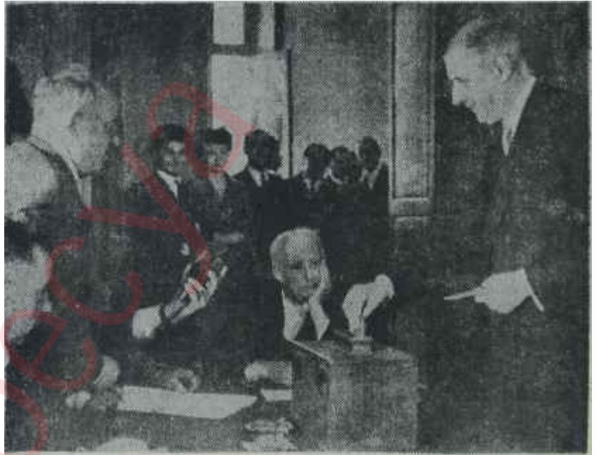
General De Gaulle Yıldırım çeken

Brüksel toplantısından sonra da NATO, dış zirhların parlıtıısıyla yapıp sönen, fakat içi en önemli ko-