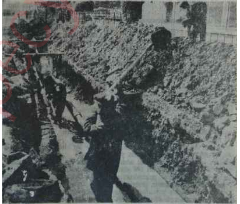
Tarabyada pis kokuları yayan lâğım "Her sengine yekpare acem mülkü fedadır"

Olay şudur: Tarabya Otelini, henüz tamamlanmadan, bu yıl hizmete açan Emekli Sandığı, otelin karşısındaki plajı da alarak burayı modern bir plaj hâline getirmiştir. Bu plajın yapımı ise ayrı bir dramdır. Emekli Sandığı, plajı yazın almış, faaliyete geçirmek için geceli gündüzlü çalışmış, fakat başaramamıştır. Bütün kış boyunca da plajda hiç bir faaliyet görülmemiş, nihayet geçen yazın ortasında plaj, tamamlanmamış olarak, açılmıştır. Ancak, bu defa da ortaya, Tarabyadaki evlerin denize dökülen lâğım ve pis suları meselesi çıkmıştır. Bunun üzerine Emekli Sandığı ilgilileri Belediye ile anlaşmışlar, Tarabya ve civarında denize akan pis suları ve lâğımları bir kanalda bir-