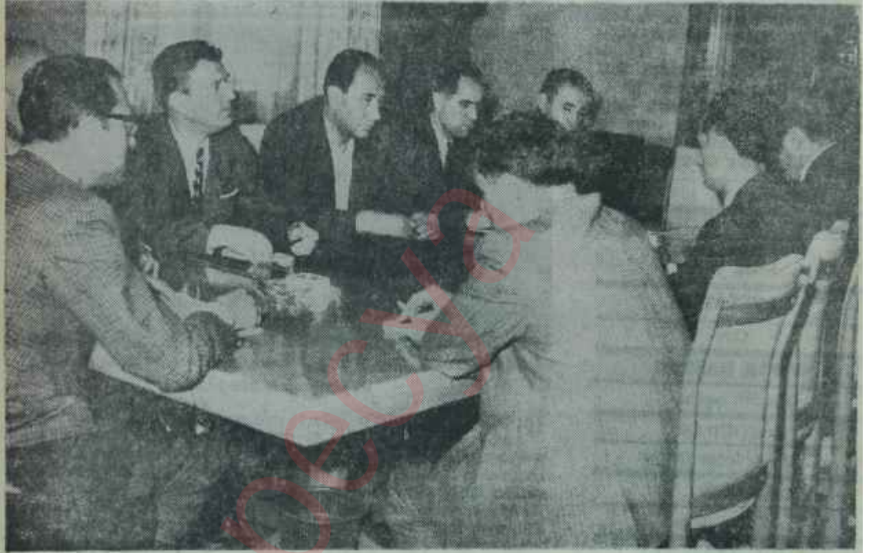
Meclis Başkanı Ferruh Bozbeyle ve parti temsilcileri birarada İnsanlar konuşa konuşa anlaşabiliyorlar...