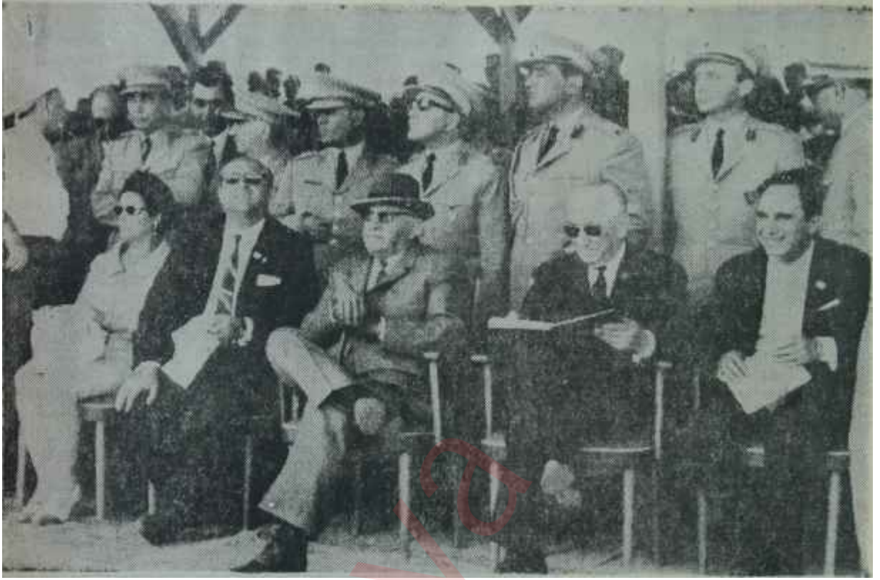
Cumhurbaşkanı ve Başbakan, temel atma töreninde Düzensizlik içinde bir tören

"— Ne bu rezalet?. Çekin şunları, Yarbayım!.." dedi.