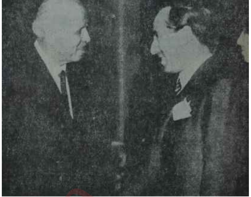
Dedemanlar Otel Dedemanda Yakalara karanfil

'— Başka türlü nasıl mümkün olabilir? Kinsey raporları filan ortada..'