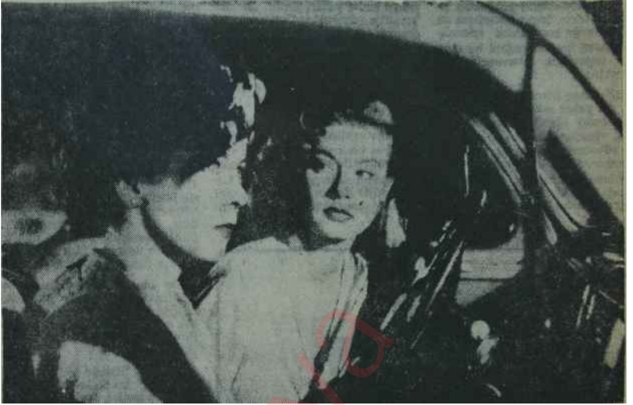
Ida Lupino, Peggy Dow Oyuncu, yönetmen vs...