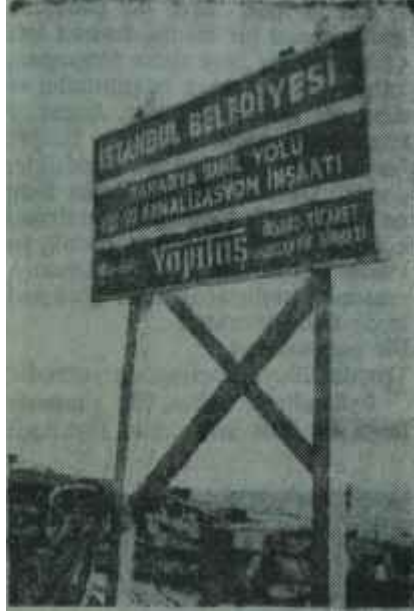
Tarabya sahil yolunda tabela Güzel İstanbul!..

Bilhassa Tarabyada oturan yaşlı ve tecrübeli kimseler, durumu üzüntü ile izlemektedirler. İfade edildiğine göre, bu ince boru bu kadar yükü taşımaya yetmeyecek ve sık sık patlamalar olacaktır. Üstelik Tarabya, gün geçtikçe inkişaf eden bir bölgedir. Bu ince boru bugün için yeterli olsa bile, gün geçtikçe sayıları artan evlere yetmeyecek, mutlaka patlayacak ve onarılması için aylar geçecektir. Sonra, bu pis suların, Kireçburnunda denize döküldükten sonra tekrar koya dönmesi de mümkündür. Gerçi şişe atılarak bazı tecrübeler yapılmıştır ama, Boğazın akıntıları sık sık de-