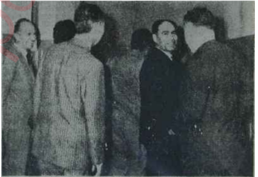
Yargıtay savcıları toplantıya giriyorlar Konu: Demirel

Tedbirler Kanununun "E" bendinde ise "Mensup oldukları partinin feshedilmiş DP'nin devamı ol-