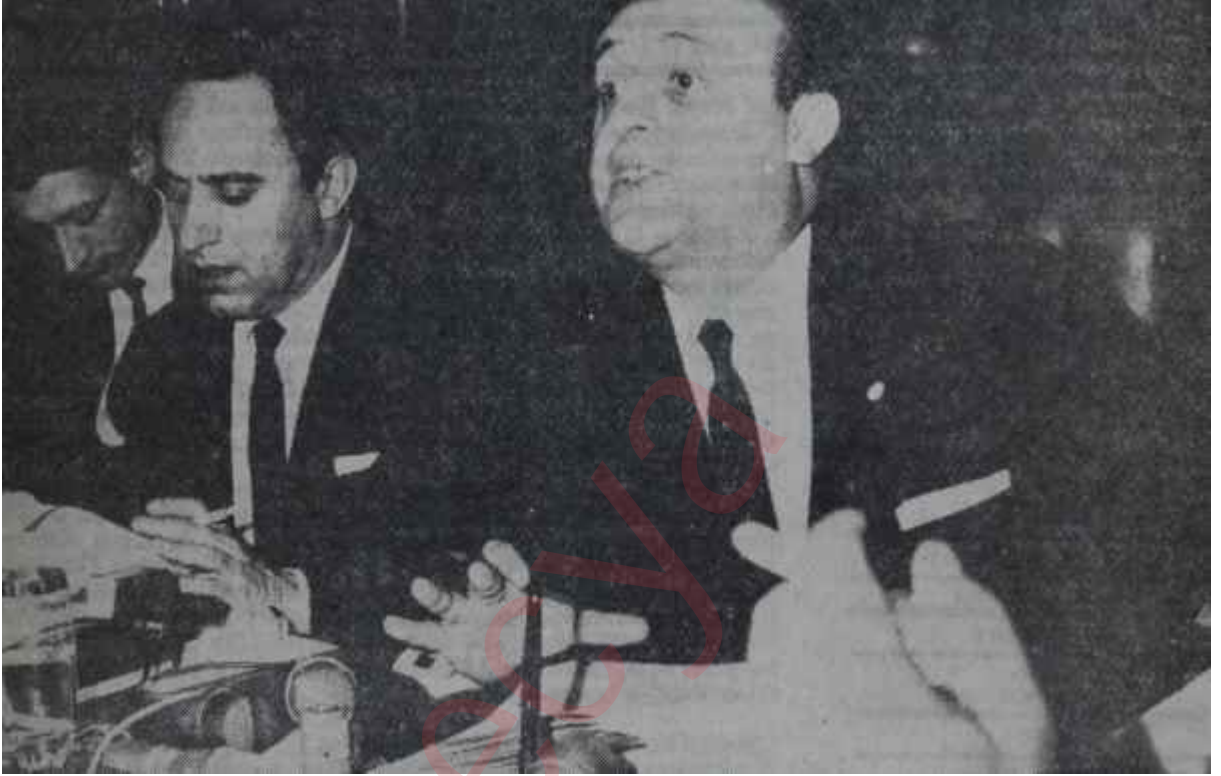
Süleyman Demirel basın toplantısında, konuşuyor "Püf!"