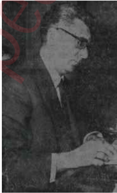
Ziya Kayla Bir kurban daha

Merkez Bankası konusunda en tehlikeli icraat, hiç şüphesiz, emisyon musluklarının tekrar açılması yoluna gidilmesidir. 1965 yılında yüzde 10'a yaklaşan fiyat artışlarına paralel olarak tedavüldeki bank-