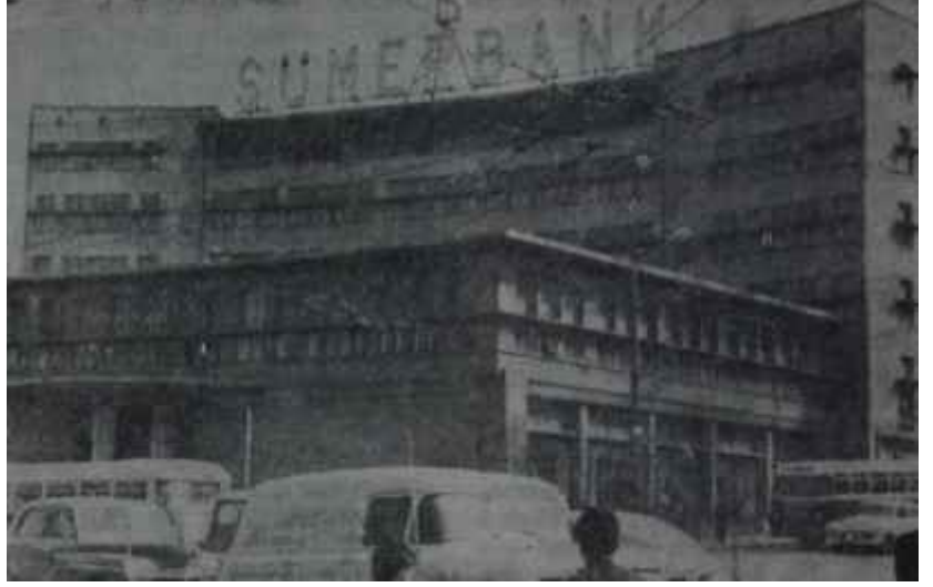
Sümerbank Genel Müdürlüğü Yeni V.C. ocağına doğru