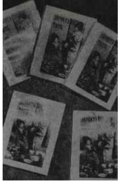
"Japonya'da Tatil'in kapağı İçeride daha tatlı

Şair mizaçlı, edebi kabiliyeti yüksek, hukuk biliminin dar kalıp ve çerçevesini kırmayı bilen bir insan olduğu yazılarından anlaşıl-