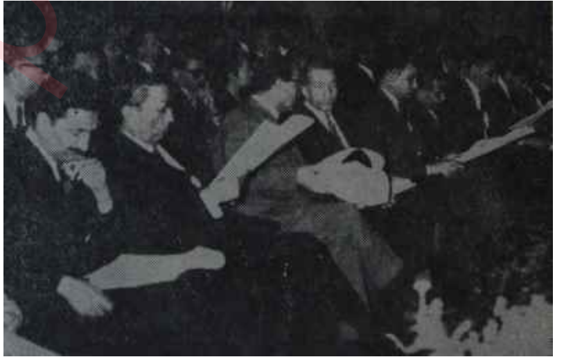
Türk-İşin 6. Genel Kurul toplantısı Bir oyun hazırlanıyor

Türkiyenin çeşitli bölgelerinden Ankaraya gelen sendika temsilcileri, şu günlerde bir sınavın arefesinde bulunmaktadır. Bu sınav,