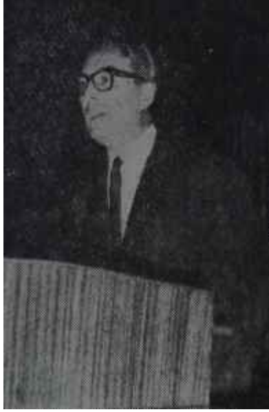
Turhan Feyzioğlu Başarılı muhalefet

Yaya kalan tataragaşı Meclisteki 241 kişilik Grubun önünde hiç bir engelin duramayacağını düşünenler, ne yazık ki