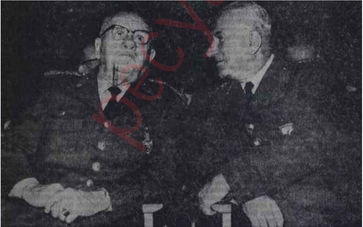
Orgeneral Sunay — Orgeneral Tural Zincirin sağlam halkaları

Eğer Gürselin koma hali bu olağanüstü metodlarla biraz daha uzar, Af ve Seçim tasarıları Atasagunun imzasıyla yayınlanırsa, t adısız yo-