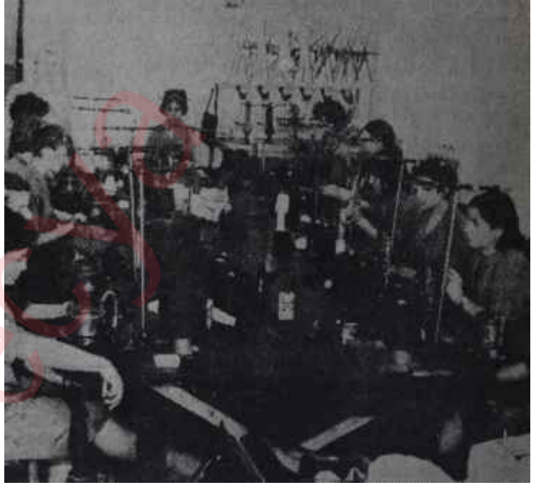
Yardımevenler Derneği atölyelerinde çalışma Toplum kalkınmasının başka yönü

Yardımevenler Derneği, önemli hastalıklara yakalandıktan sonra, yeniden hayatlarını düzenlemek zorunda kalanlar için rehabilitasyon merkezleri kurmuş, yurdun muhtelif yerlerindeki 86 şubesi, pastahanelerden hamama, en ince el işinden, nakış ve dikişten büyük ve toptan dikiş atölyelerine, kadar her çeşit iş sahası açmıştır. Karşılıksız gıda,