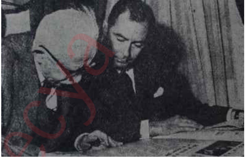
İnönü ve Toker çalışıyorlar "İsmet Paşayla 10 Yıl"

"İsmet Paşayla 10 Yıl"ın bir ek-sik tarafını da söylemeden geçemeyeceğim. Bu eksik taraf, İsmet Paşanın 1954 yılında ısrarla yürüttüğü ve 1960'dan sonra tekrar döndüğü ve halen de şampiyonluğunu yaptığı millî egemenlik politikasına -yani petrol ve madenlerimizi yabancı-lara kaptırmama, kapitülasyon-ları hortlatmama, nihayet millî bağımsızlık politikasına- yeterince ışık tutulmaması, bu konu üzerinde durulmamış olmasıdır. İsmet Paşa daha 1954 seçimleri arefesinde, DP İktidarının tuttuğu yolun yol olmadığını, bu yolun Türkiyeyi çıkmaza götürdüğünü görmüş ve buna kar-