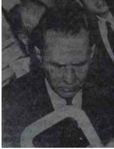
Kosigin Konuşulan ne?

Son üç haftalık gelişmelerden sonra şimdi, tarafların, her zamankinden daha çok görüşme masası başına oturmaya yakın oldukları söylenebilir. Hem Hanoi, hem de Washington, böyle bir oturma için şimdiye kadar ileri sürdükleri pek çok şartı bir tarafa bırakmış görünmektedirler. Özellikle Birleşik Amerika, barış saldırısına başladığı günden buyana, görüşmenin her türlü süne taraftar görünmektedir. Hai-