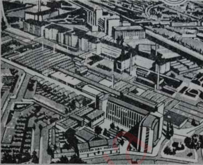
Merkez Fabrikaları: N. V. Philips Gloeilampenfabriek, Eindhoven Holanda

Elektronik teknolojinin önceri Philips, bütün dünyada mevcut 50 istihsal fabrikası, 100 mütahhasıs firma, 260.000'i aşan personeli, 75 yıllık teknik tecrübe ve ülkeler arası geniş hizmet şebekesi ile dünyanın her yerinde emrinizdedir.