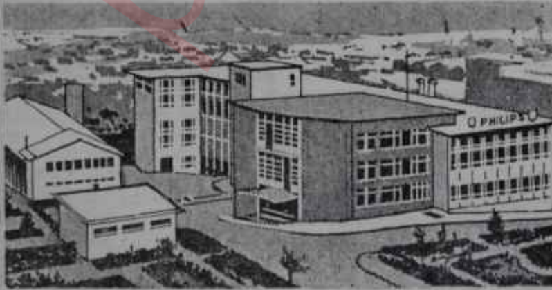
TÜRK PHILIPS Fabrikaları: Levent - İstanbul

ANKARA SUBESİ Atatürk Bulvarı 292/4. Tel.: 124175