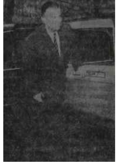
Parker Hart Alışverişi seven bir dost

AP İktidarı, kaygan zeminde bir takım hünerler göstermeğe çalışmaktadır ama, bu gayreti onu hergün biraz daha uçuruma yaklaştırmaktadır.