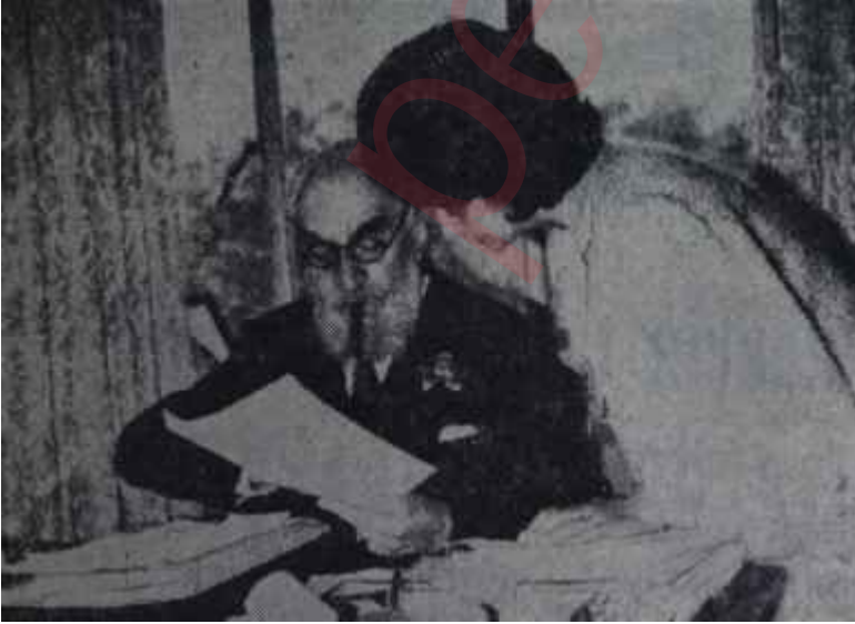
Gülbenkyan anılarını anlatıyor "Ben türk tâbiyetinden çıkmadım ki.."