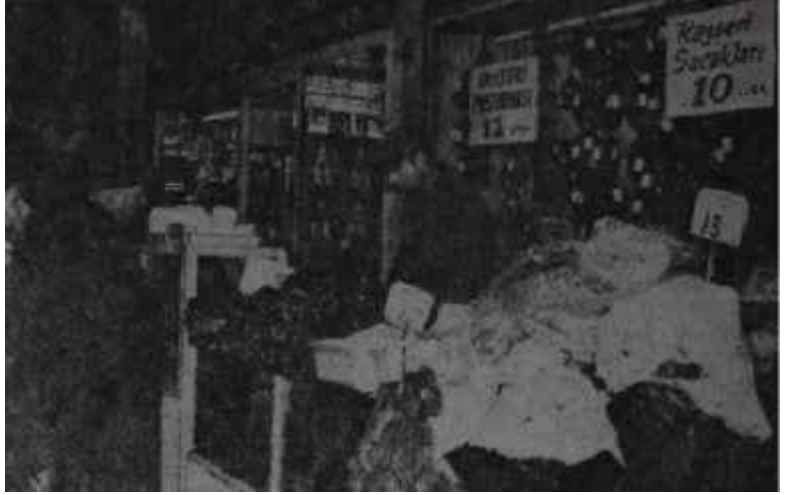
Bir bakkalda yiyecek maddeleri ve fiyatları Biri yer, biri bakar...

Fiyatlardaki bu yükselmeler aslında Cumhuriyet tarihinin rekorudur. Şekle bakılırsa, rekor yılı olarak 1958-59'u göstermek gerekir. Çünkü o tarihte alınan istikrar tedbirleri, Millî Korunma Kanununun kaldırılması, türk parasının değerinin düşürülmesi ile fiyatlar yüzde 19 yükselmişti. Bu, ekonomik kararların doğurduğu ve istatistiklerde eski resmî fiyatlar yerine gerçek fiyatların kullanılmağa başlanmasından ileri gelen zorunlu bir artışıdır. Son bir yıl içinde kaydedilen yüzde 10.3'lük artış ise gerçek bir artıştır. Bu yüzden 1965-66 fiyat artışları bazı otoriteler tarafından 1958-59 artışlarından da hızlı diye nitelenen 22 Ocak 1966