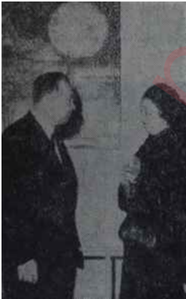
Arsebük ve eseri "Güneş ve Ben"

Alâmeriken iftar sofrası Türk - Amerikan Kadınları Kültür Derneği, ramazanda bir iftar gecesi düzenlemeyi gelenek haline getirdi. Geçirdiğimiz hafta dernek üyeleri, Ankara Palasta bir iftar sofrasında buluştular. Amerikalılar böyle şeylere çok meraklı, pideler ve