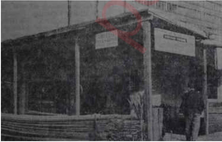
İnşaat malzemeleri Karaborsa hortluyor

Yani Demirel, "eğer fiyat artışını durduramazsa kurşuna dizeyim" şeklinde tehditlerle Maliye Bakanı durumuna düşmüştür.