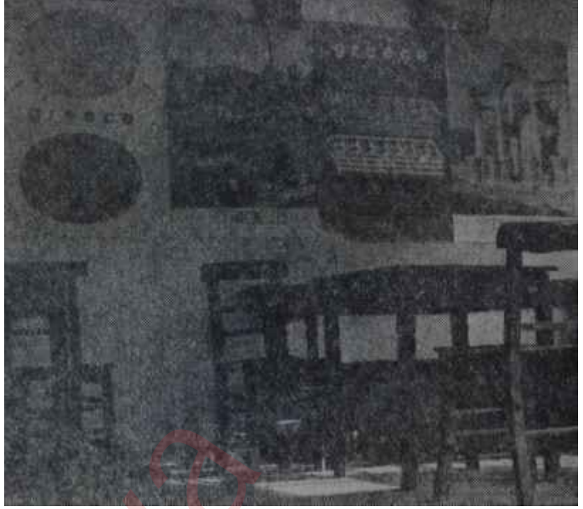
İmrozda bir kahvede asılı yunan afişleri "Atina nire, İmroz nire?"

şurasına burasına dağılmış köylerdeki meyhane ve lokantalarda neşeli gruplar halinde toplanmaya başladılar. "Sevinçli haber"i, İmrozun üzümlerinden yapılmış nefis şarapla "ıslatacak"lardı. Kaleköyde, is kelenin karşısındaki lokantada da durum böyleydi.