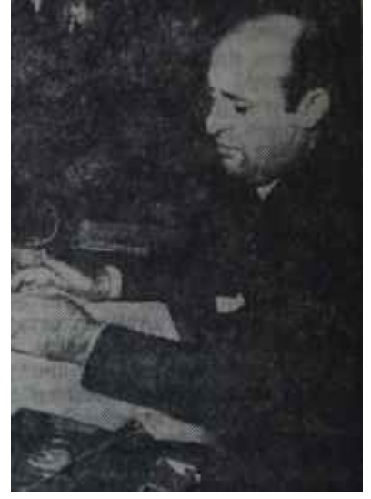
Başbakan Demirelin, basın toplantısında üç ayıp

"Dimedik mi? Didik... O halde, öyledir!"