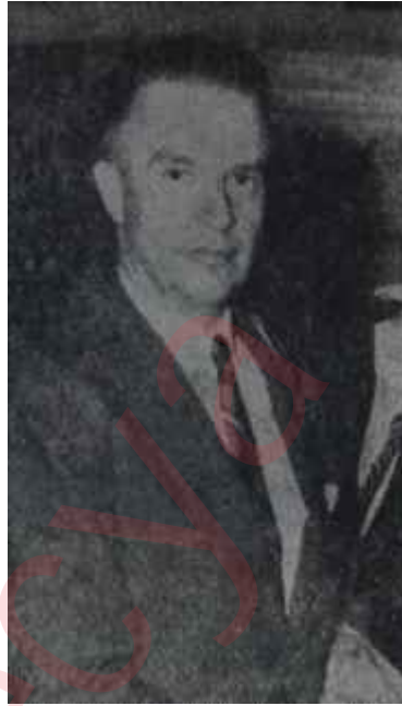
Parker T. Hart

İyi haber: Herkes görevini yavaş yavaş bilmeye başlıyor!