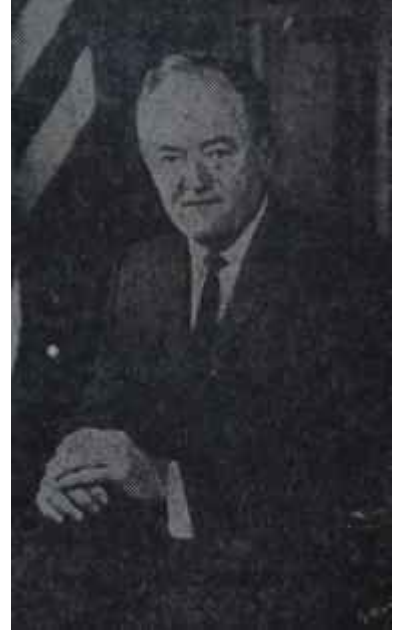
Başkan Johnson ve Yardımcısı Hubert Humphrey Şu Vietnam meselesi...

muştur. Gene bu satırların yazıldığı sırada, geçen ay Kremlinde yapılan değişiklikler sırasında başbakan yardımcılığından alınıp partiçi gü-