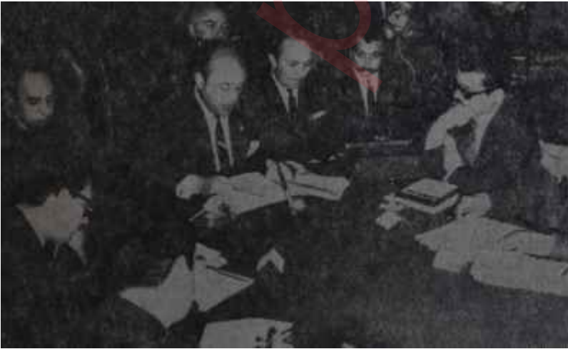
Demirelin basın toplantısında gazeteciler Keçi boynuzu koklayanlar