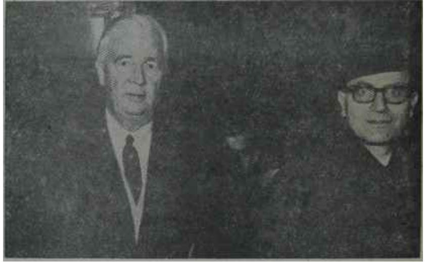
Von Mangoldt Demirelin yanından çıkıyor

Bundan on gün kadar önce Esenboğaya efendi, kibar, sakin tavırlı, yaşlı bir alman indi. Eski bir iş adamı olan, Nasyonal Sosyalizm devrini etliye sütlüye pek karışmadan geçirdikten sonra, son yıllarda yıldızı parlamaya Avrupa Yatırımlar Bankası Genel Direktör Yardımcılığı, Avrupa Para Sandığı'nda Almanya Temsilciliği yapan bu yaşlı adamın bugünkü görevi, Türkiye'ye Yardım Konsorsiyomu Başkanlığı, ismi ise Von Mangoldt'tu. Mangoldt'un bugünkü görevi Türkiye için pek önemli, ama Avrupada fazla dikkati çekmeyen bir görevdir. Meselâ, Türkiye'de daima Başbakanlar tarafından kabul edilen Konsorsiyom Başkanı. Avrupada aynı şerefe nail olabilmek için, "Türkiye'de Başbakanla görüşüm" diyerek, ko-