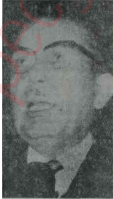
İhsan Sabri Çağlayangil Turist Bakan

Kıbrıs işinin Birleşmiş Milletlere geleceği kimsenin meçhulü değildi. "Çok partili bir dış politika"nın gerektirdiği şeydu: İktidar ve Muhalefet otururlardı. İktidar Muhalefete; gelen son haberleri bildirirdi. Duruma beraber bir teşhis koyarlardı. Yapılacak olanı ve takınılacak tavırı kararlaştırırlardı. Erim, Sarper ve Erkin gibi hadiselerin başlangıcını bilenler, hattâ İnönü kendi tavsiyelerini söylerlerdi. Hükümet hareket hattını tâyin ederdi. Ondan sonra, icradan sorumlu Bakan ve Dışişlerinin yetkilileri, teknisyenleri kalkarlar, giderlerdi. Eğer gerekirse Muhalefet burada, Hükümeti bu konuda tam olarak desteklediğini Muhalefet Liderinin veya sözcüsünün ağzından ilân ederdi. Ürgüplünün Hükümeti za-