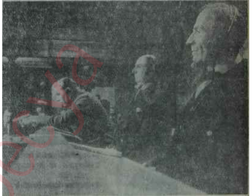
"Nüremberg Duruşması" Seyirciye hoş, eleştirmeciye boş

askerî savcısı Richard Widmark ile alman avukat Maximilian Schell arasındaki söz düellosuna takılıp kalıyor. Burt Lancaster'li, Montgomery Clift'li, Marlene Dietrich'li, Judy Garland'lı değişik ve zengin bir sanatçılar geçidi, seyircinin dikkatini asıl meseleden büsbütün çeliyor. Mesele, hukuku, adalet dağıtımını, çağdaş dünyanın insanlığa karşı en korkunç cinayetlerini işleyen bir rejimin hizmetine veren yargıçların sorumluluğunu incelemekten çıkıyor, Kramer'in nedense üzerinde çok durduğu alman avukatın demagojileriyle "millî menfaatleri korumak", "kendi ülkesinin kanunlarını uygulamaktan başka kabahati olmamak" şekline dökülüyor. İş bu noktaya gelince, gerek savcı, gerek avukat, gerek sanıklar