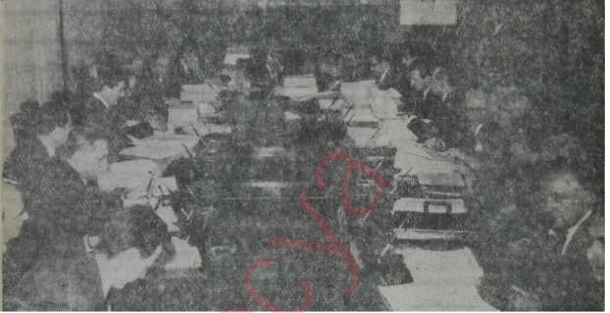
Yüksek Plânlama Kurulu toplantı halinde Plâncılar sayıyla galip