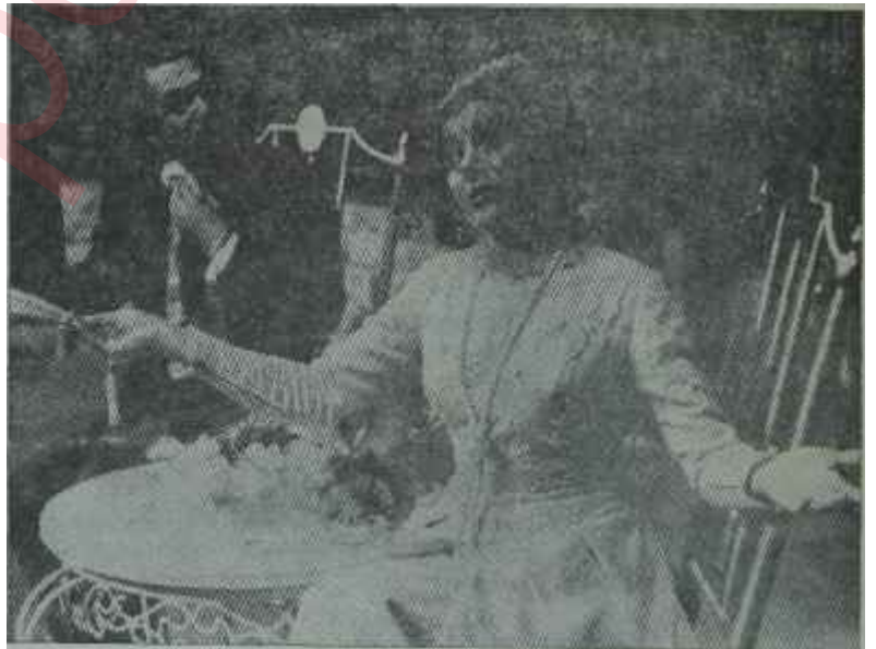
Yeni Sahnede "Kahvede Şenlik Var"