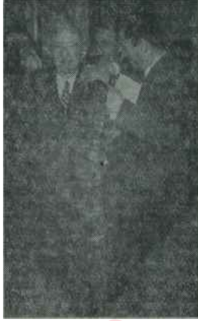
İnönü CHP'de Ortanın solunda

"— Güçlükler, bizim elimizde olmayan sebeplerden çıktı. Yalnız Program, bu seçimlerde seçmenlere gereği gibi anlatılamadı. Direnme-