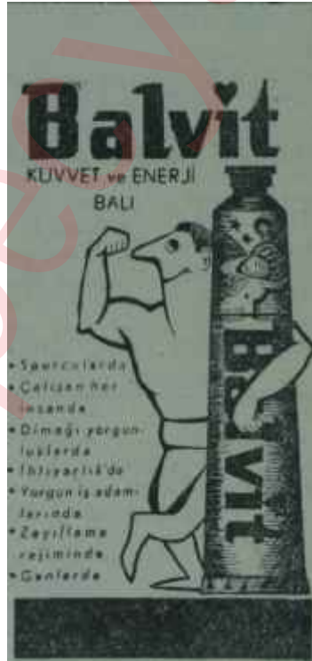
(AKİS — 647)

Kadınlar bu kıyafetleri erkekleri taklit için değil, pratik olduğu için seçmişlerdir. Bir dağ evinde, danslı bir gece toplantısında da pantolon gerçekten pratiktir. Bunun için, daha fantezi kumaşlardan yapılan "pantolon-cekete" takımları küpe ile de giyilmektedir. Bu defa ayakkabılar çok hafif topuklu olabilir veya topuksuz rügan olanları tercih edilir. Dağ evine çıkmadan, evde misafir kabul eden bir kadının da böyle değişik bir kıyafet giymesi moda olmuştur. Ama bu, şehirdeki danslı yerlere bu kıyafetle gitmek gerektiği anlamına gelmez. Prensip, kadının erkeğe benzemesi değil, bu kıyafet içinde kadının daha kadın görünmesinin sağlanmasıdır.