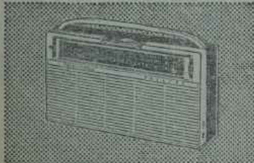
L3 TR 287 Transistorlu. Fiyatı TL 595,—