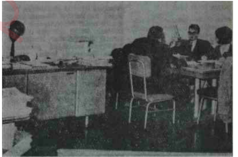
Plancılar "Plan Çalışması" yapıyorlar "Aman, sis zahmet edip yorulmayın!"

Bu ana isteklerin kıyasında köşesinde serpiştirilmiş duran bazı tâli istekler de bulunmaktadır. Bunlara göre yerli ve yabancı sermaye tesisleri kuruluşlarından itibaren en az beş yıl vergi vermeyecekler, ham madde ve temel madde ithallerinde düşük ithal vergisi ve resmi ödeyecekler, ucuz faizli, uzun süreli bol iç kredi bulabileceklerdir.