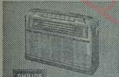
L4 TR 20T/5: Transistorlu, Fiyatı TL 745,—