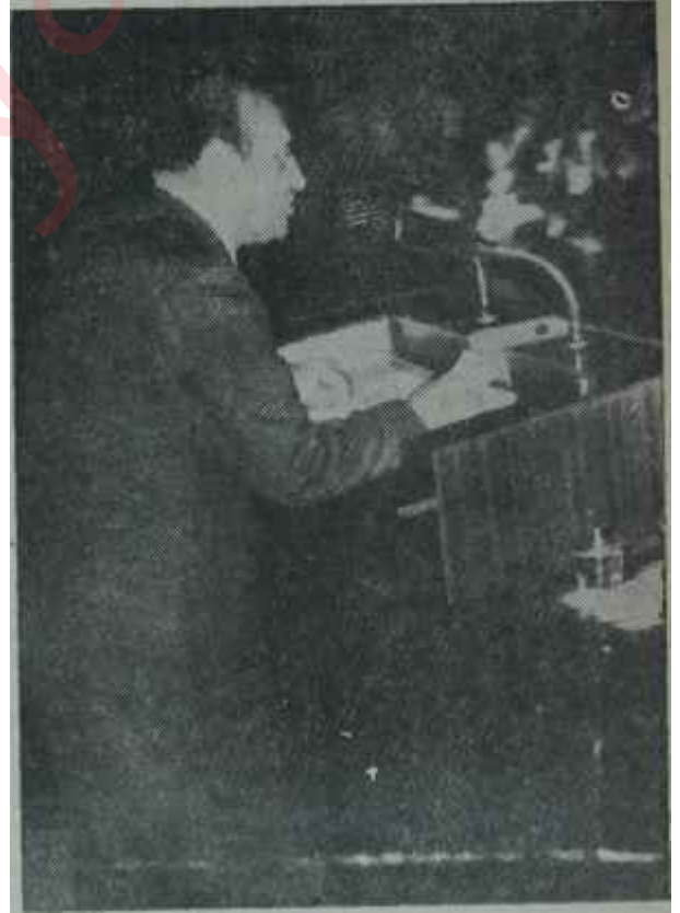
Demirel kürsüde İçi dolu bir istiridye

"... Cevaplarımı arzetmiş bulunuyorum. Sabrınızı suistimal ettiğim için özür dileirim (Şiddetli alkışlar ve 'estağfurullah' sesleri)"