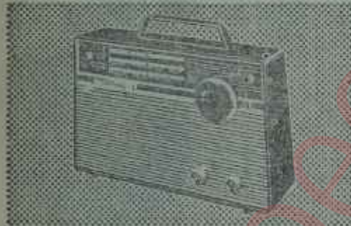
B3 TR 31T: Transistorlu, Fiyatı TL 565,—