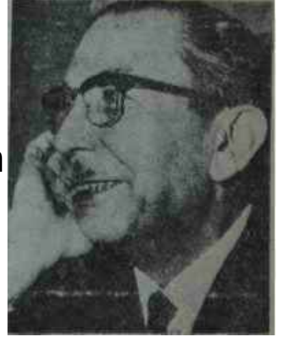
İhsan Sabri Çağlayangil Boyunu görelim

Bu İktidarın da karşısında nâmert bir Muhalefet bulunsaydı, Kıbrıs Olaylarının almış olduğu durum karşısında iğrenç bir gülümsemeyle ellerini uğuşturur ve: