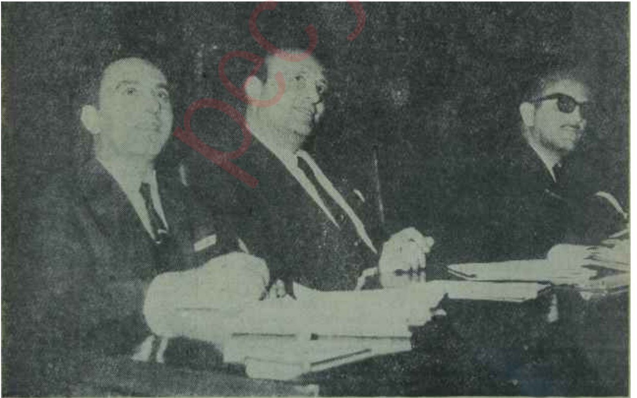
Demirci müzakereleri izliyor "Kabaramazsın kel fatma!"

Normal durum bu iken, AP'nin, belki seçimlerde muvaffak olduğu için tekrarlamakta fayda gördüğü bir oyunu Mecliste tekrar sahneye koyduğu farkedildi. AP hatipleri CHP'ye "marksist" diye saldırdılar -İnsaf- ve tabii bu, şiddetli tepki yarattı. AP'liler öteki taraftan TİP sözcülerinin nihayet sükûnetle dinlemeye mecbur oldukları ve amerikanlarla ilgili iddialarını kavga sebebi yaptılar. bu arada CHP'ye de bulaştılar. Bövlece TİP ile CHP'yi yanyana getirdiler. Bundan umdukları, bu iki partiyi "Marksist Cephe" olarak tecrit etmek ve Muhale-