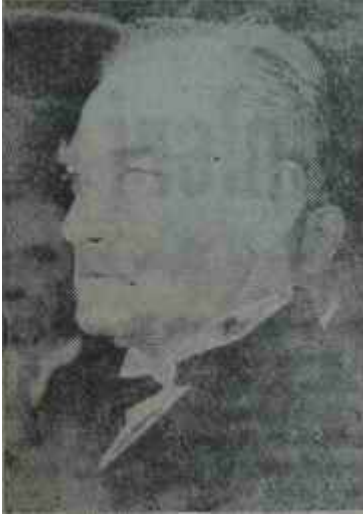
Kemâl Atatürk Benzersiz adam