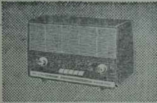
B4 TR 11T: Transistorlu Fiyatı TL 669,—