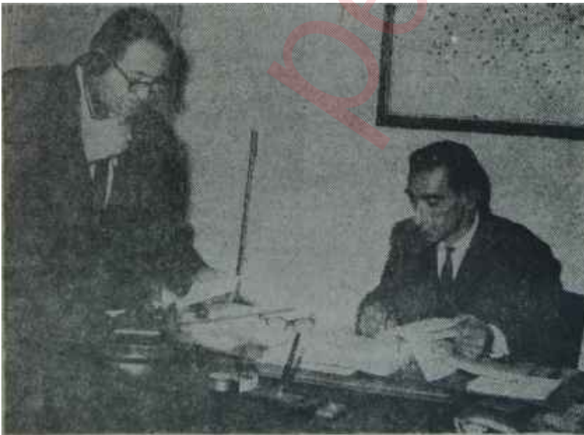
A.P. Genel Merkezinde Erdemir ve Türkeş benzeyen memur