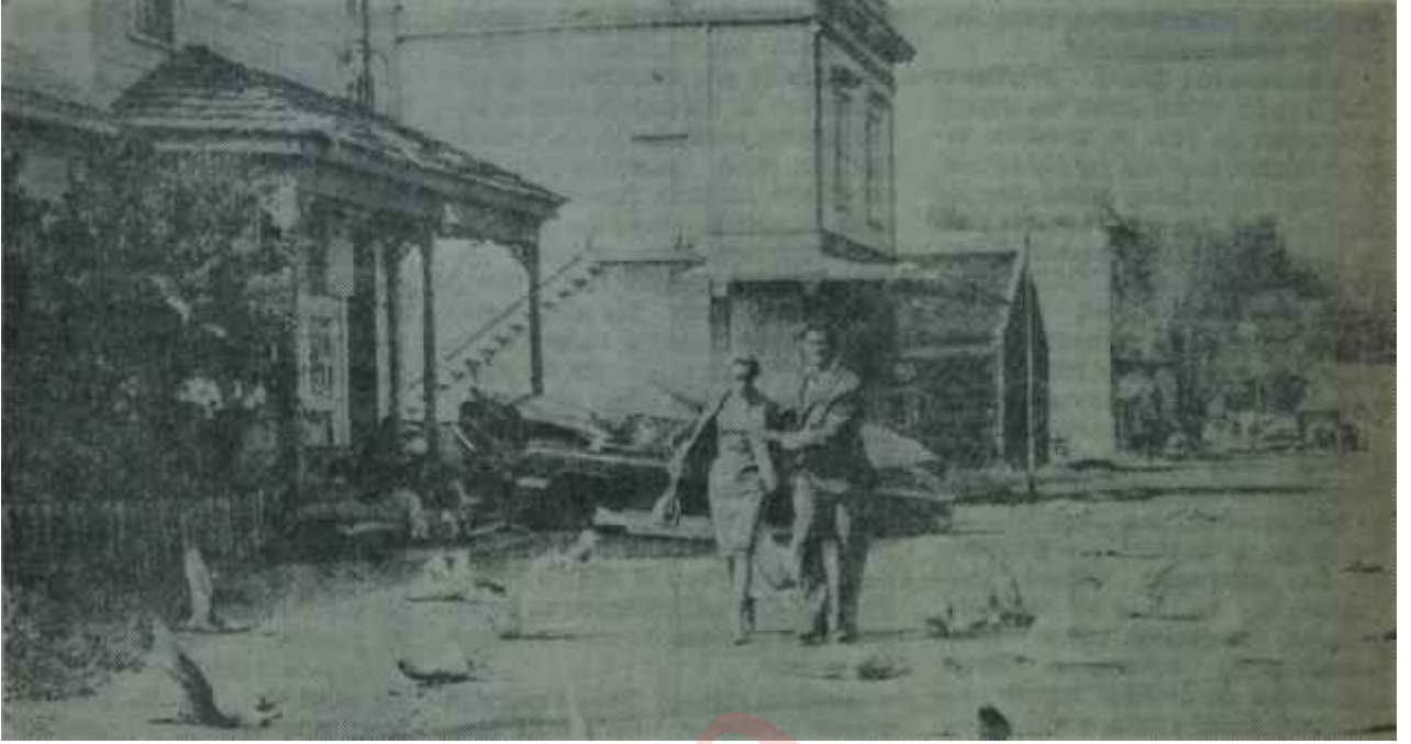
"Kuşlar"dan bir sahne