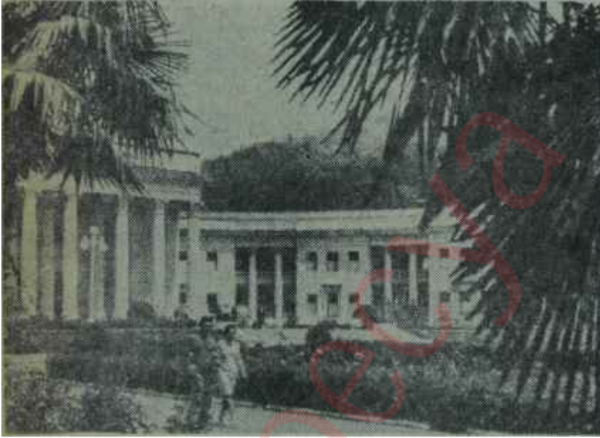
Matsesta kaplıcaları 26 günlük beylik beyliktir

Dairemize çıktığımız zaman saat bire. geliyordu. Gece yansından sonra, bir! Bu, rus ölçüleriyle bir safahattı.