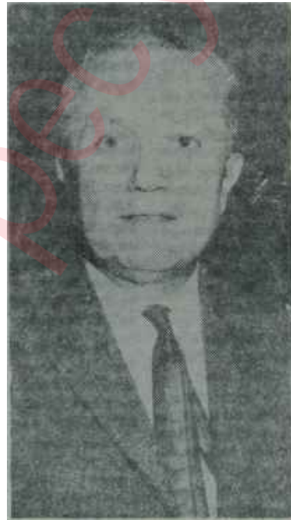
Tahsin Yalabık Şeref imihani

lar var, birlikte çalışmaya devam edeceğiz" dedi.