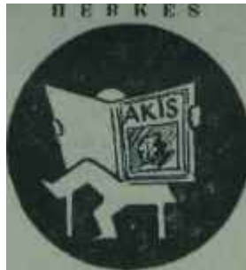
O K U Y O R

Leningradın her köşesi bir âbide. Şehrin kurucusu, Deli Petro. Onun şahlanmış bir at üzerindeki heykeli Neva kıyısında bir meydanı süslüyor. Bir başka kıyıda ise Bolşevik İhtilâlinin ilk işaretini kuru sıkı bir salvoyla veren ve toplarını Kışlık Saraya çevirerek kızıkları destekleyen, sonra da telsiziyle İhtilâli dünyaya ilk defa bildiren namı Orora kruvazörü duruyor. Kruvazör şimdi müze. Halk merakla geziyor. Kışlık Sarayın biraz ilerisinde, Katerinanın dostu Prens Orlofa verdiği bir "mütevazı hediye" bulunu.