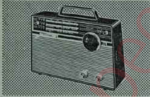
B3 TR 31T: Transistorlu. Fiyatı TL 565,—