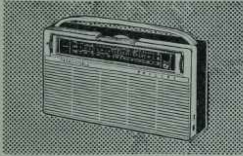
L3 TR 26T Transistorlu. Fiyatı TL 595,—