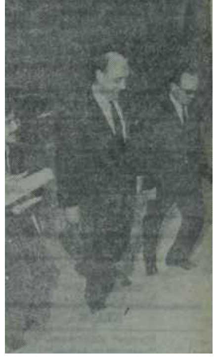
Türkeş, Bölükbaşı ve Demirel, Liderler Toplantısına geliyorlar