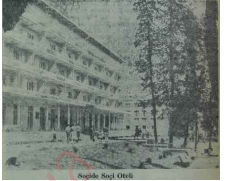
Burası işçilerin değil, turistlerin!

Sovyetler Birliğinde" tedavi bedava. Buna her çeşit ameliyatlar, hastahane masrafları dahil. Bedava dediğim, para şahıslardan çıkmıyor. Mesela Matsestada 12-14 banyoluk tedavi 6 ruble, değil mi? Eğer çalışan sınıfa dahiseniz, bunu mensup olduğunuz meslekî