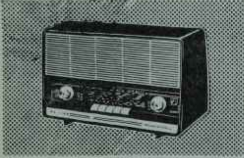
B4 TR 11T: Transistorlu Fiyatı TL 669,—