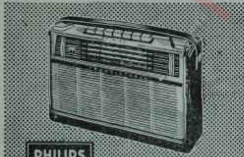
L4 TR 20T/S: Transistorlu, Fiyatı TL 765,—