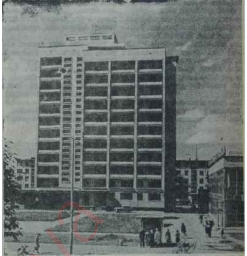
Rusyanın her tarafında görülen manzara Sabırlı rus, ikametgahını bekliyor