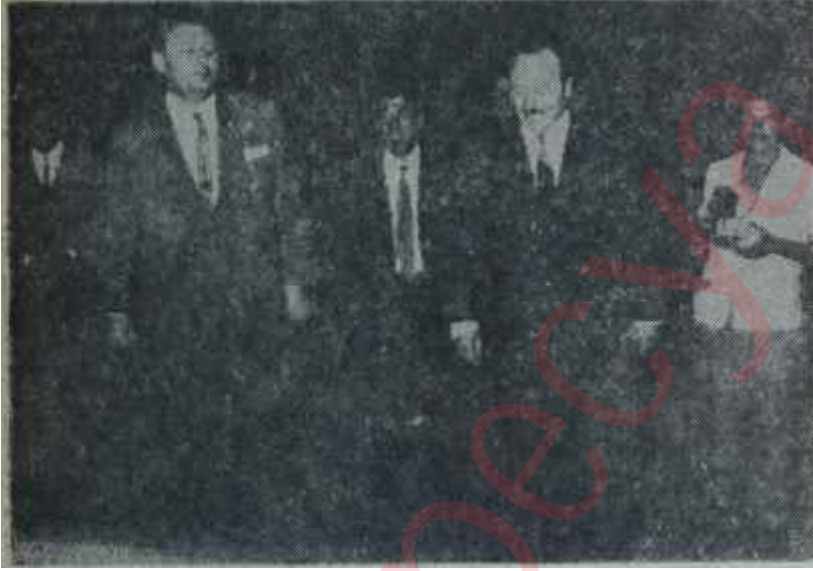
Demirel ve Sükan Liderler toplantısına geliyorlar

«Karıncanın kanatlanması...» Demirel bu şartları, bu özellikleri ve bu cesareti ile Genel Başkanı bulunduğu AP'yi iktidara getirmeye çabalamaktadır. Bu yolda seçtiği usuller kendi kapasitesine uygundur. Sadece, ferdi çıkışları ve