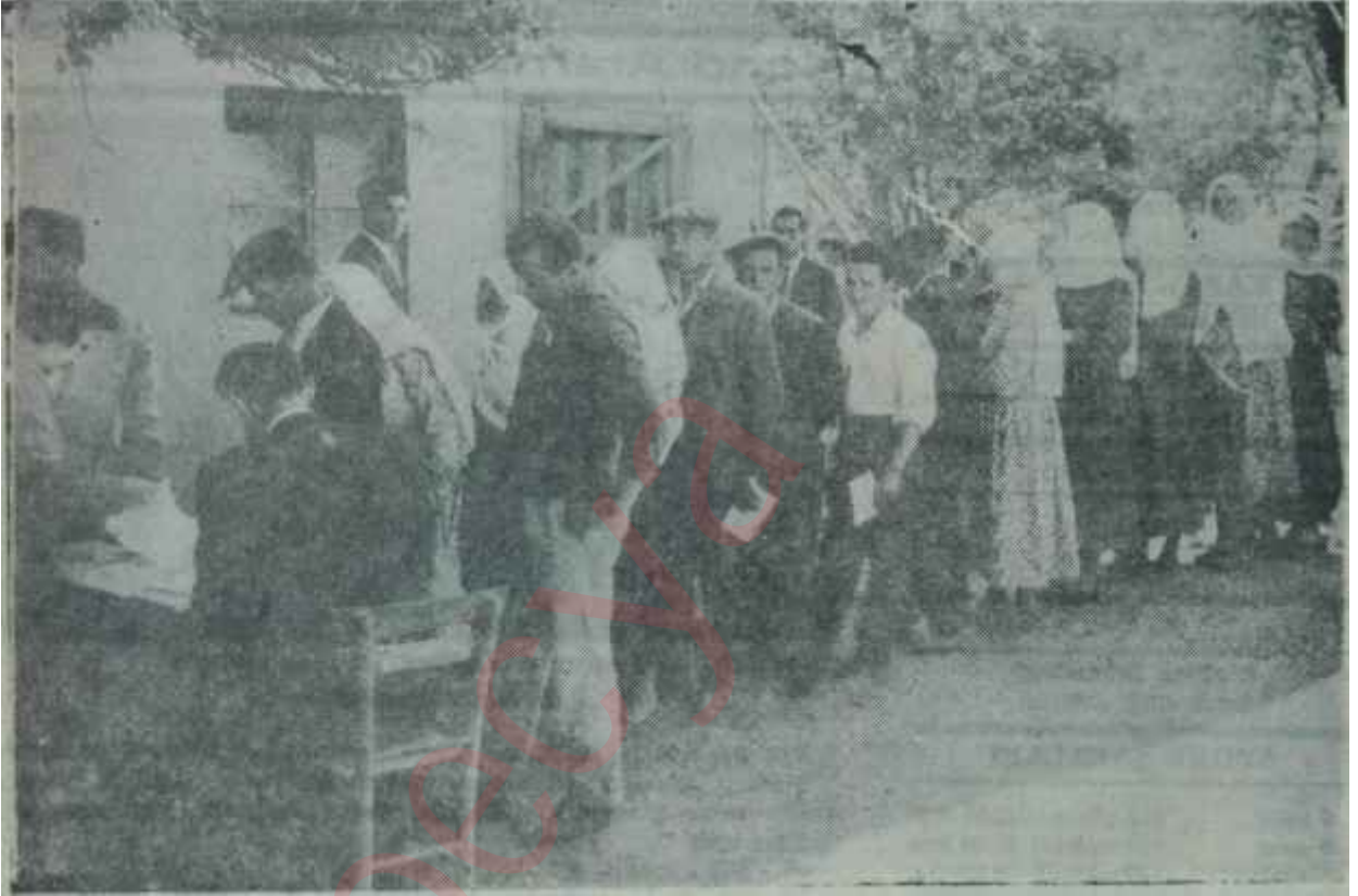
Bir seçimde oy veren seçmenler