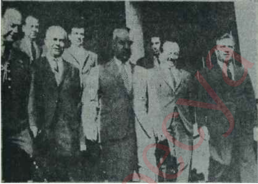
Ürgüplü yeni Bakanlarla M.S. Bakanlığı önünde