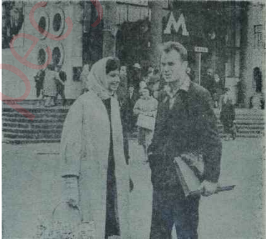
Moskovanın meşhur metrosu önünde