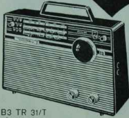
B3 TR 31/T FİYATI TL. 565.-