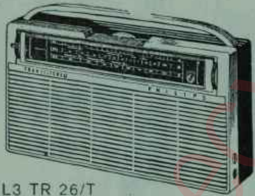
L3 TR 26/T FİYATI TL. 595.-