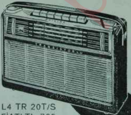
L4 TR 20T/S FİYATI TL. 765.-