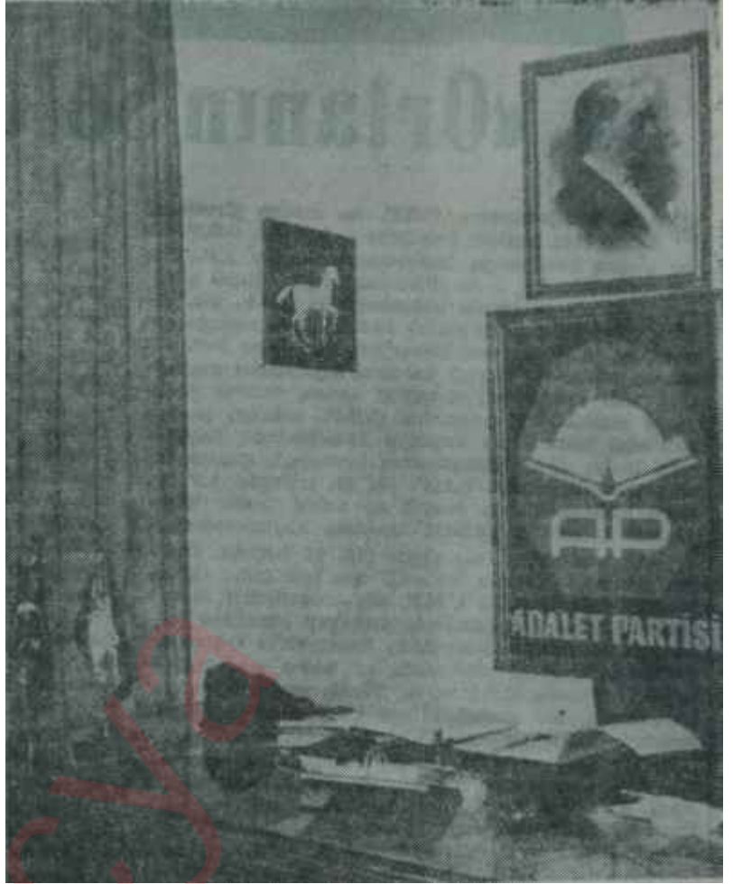
A.P.'nin "Kır At"lı Genel Başkanlık koltuğu

Ama bilinen, normal şartlar altında kimin kime oy vermeyeceğidir. Mecliste iki ana blok olacağı muhakkaktır: CHP. ve AP. Bunlardan hangisine kimler, kesinlikle oy vermeyecektir? C.H.P.'ye AP. ve MP. kesinlikle, Y.T.P. muhtemelen oy vermeyecektir. AP.'ye ise kesinlikle C.H.P.. C.K.M.P. ve T.İ.P. oy vermeyeceklerdir. Bu, basıların sandığı gibi ya A.P. + MP. + Y.T.P., ya da CHP. + CKMP, + T.İ.P. koalisyonu demek değildir. Pek âlâ küçük partiler, büyüklerin Mecliste ki sandalya sayısına göre, bunlardan birini, Hükümete iştirak etmeksizin destekleyebilir. Tıpkı, bir kısım Y.T.P. lilerle Bağmsızların III. İnönü Hükü-