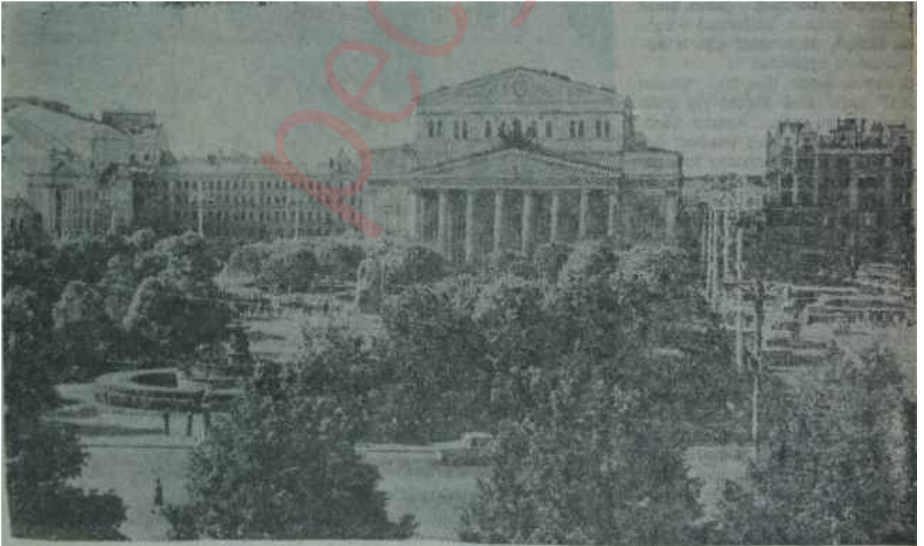
Meşhur Bolşoy Tiyatrosunun dışarıdan görünüşü Çarlık devrinden kalma ama, şimdi karşısında Marx oturuyor