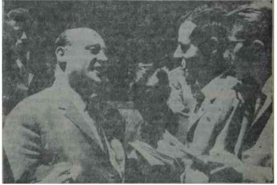
Demirel Başbakanlık önünde gazetecilerle "Bir doksun, bin ah dinle.."

Adamlar, hem de hemen o gün istifa etmezler mi?