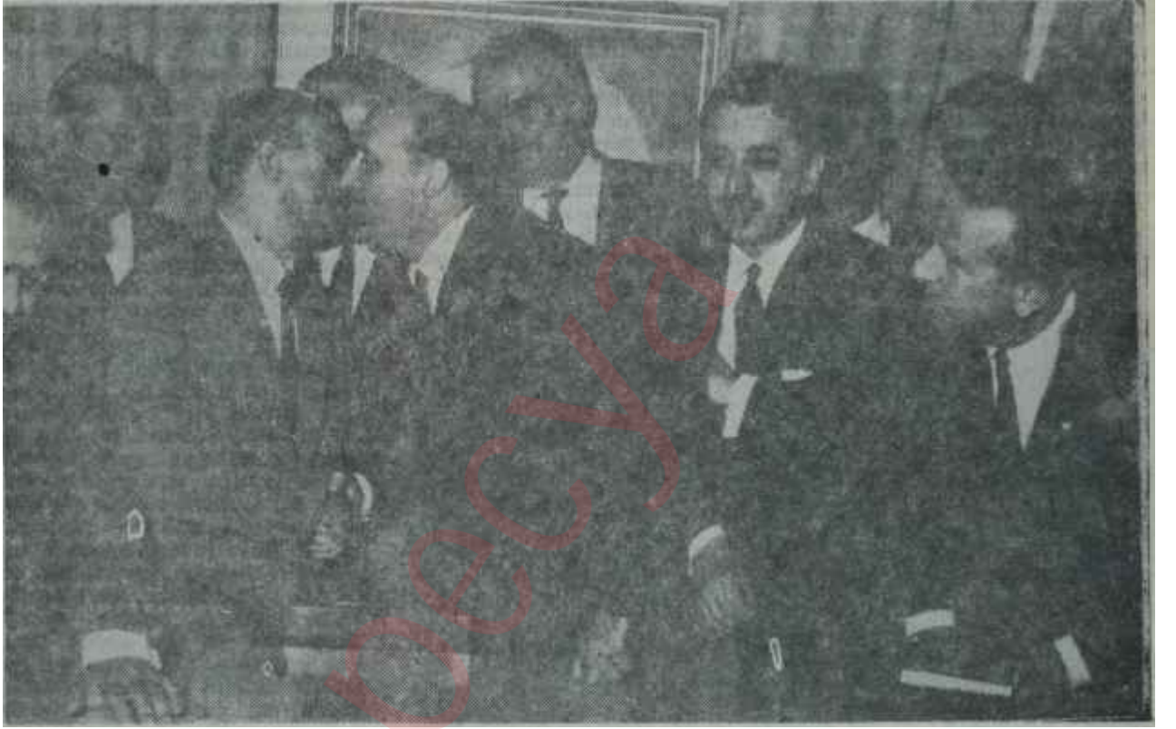
Demirel, A.P.'ye yeni katılan CK.M.P.li Bakanları öpüyor

bir endişe yaratmadığını, aksine, memnuniyet uyandırdığını ortaya koyuyordu. İnönü bu demecinde, Kıbrısın IV. Koalisyona, Sovyet müdahalesi bertaraf edilmiş ve bağımsız, federasyona imkân veren bir çözüm yoluna açık şekilde devredildiğini de hatırlatarak, Makariosun son emrivakileri ile meydana gelen ve henüz bir mukabil tedbir alınamayan bugünkü durumla mukayese yapmak isteyenlere iyi bit dayanak noktası veriyordu. Gerçekten, Makariosun tarafımızdan cevapsız bırakılan son emrivakileri Kıbrısta son derece aleyhimize bir