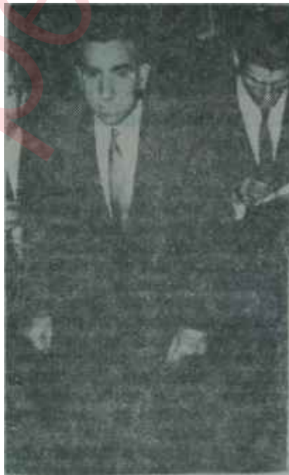
C.K.M.P. lideri Türkeş- Zor oyunu bozdu!

Ortağı bulunduğu Hükümete her vesile ile muhalefet eden ve halkoyunun dikkatini ancak bu yollarla üzeri ne çekmeyi başarabilen Bölükbaşı, bu defa da aynı oyunu oynamak istemiş, fakat Koalisyonun diğer ortakları ile Başbakan ve Cumhurbaşkanı'nın ciddiye alınmayınca, bıyık-sakal hikâyesinin kahramanı durumuna düşmüştür. Bir kere, Hükümetten ayrılmasına imkân yoktur. Çünkü, Hükümette bundan önce patlak veren anlaşmazlıklar sırasında hem Hükümet Başkanına, hem de Kabinedeki kendi Bakanlarına şiddetle muhalefet ederken, bir yandan da Meclis kürsüsünden, her ne sebepten olursa olsun, hiçbir kuvvetin kendisini Hükümetten ayıramayacağını defalarca açıklamış, bun da ilerisi için herhangi bir sakınca görmemiştir. Bu yüzden Bölükbaşı gerek Koalisyon ortaklarına ve gerekse seçmenlerine angaje olmuş durumdadır. İkincisi, itiraz ettiği adayın Bakanlık koltuğuna oturması sağlandıktan sonra hiçbirşey olmamış gibi gene, "Bizi koalisyondan ölüm bile ayıramaz" şeklinde demeçler verse, bunun da kendisinin ve partisinin seçmen önünde itibarını iyice sarsacağı muhakkaktır. Bu sebeplerle, olayların