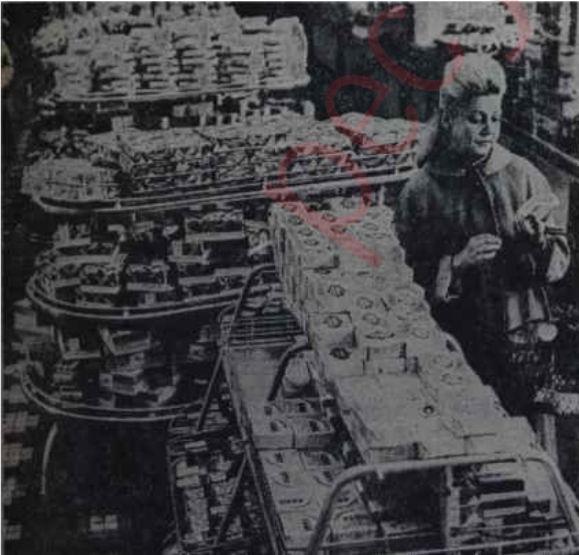
Moskovada bir dükkânda bolluk