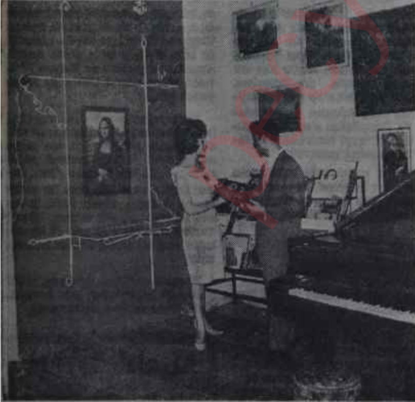
Ankara Sanat Galerisi

"— 21-22 Nisan 1963'den, yani halkevlerinin yeniden açılışından bugüne, memlekette iki ana fikri yerleş-tirmekte başarı yazandığımıza inanıyoruz. Birincisi halkın, halkevlerinin politikanın dışında olduğuna, politikanın dışında yaşayıp ilerleyeceğine inanması; ikincisi, halkevlerinin ataturkçülüğün merkezi oluşudur. Halkevlerinde sağcılık ve solculuk asla yer almayacaktır. Büyük Ata, otuzüç yıl önce, halkevlerini bu amaçla ve halk eğitimini tamamlamak için açmıştı. O, bir yandan millî eğitim kurumlarını teşkilâtlandırırken, bir yandan da halkın bir araya toplanarak kendi kendisini yetiştirmesini, çeşitli konuları görüşmesini bildiğini bilmeyene öğretmesini ve bilmediğini bilenden öğrenmesini istemiş, yani bugün ileri toplumlar tarafından ortaya atılan halk eğitimine bağlı toplum kalkınması fikrini halkevleri teşkilâtı ile gerçek-