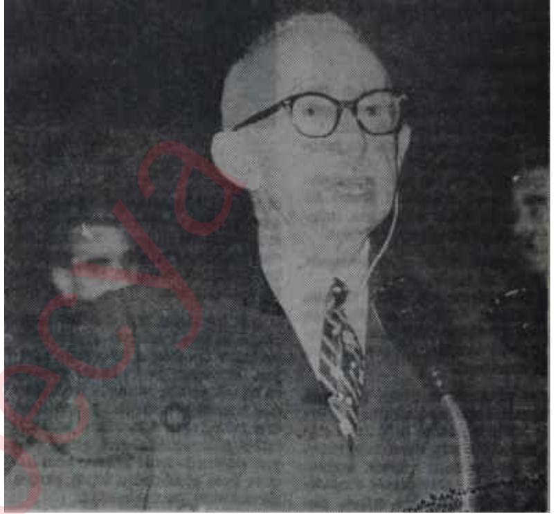
İnönü Mecliste konuşuyor

İsmet İnönü sırtının teriyle hemen orada, 1965 yazının ilk çivilemesini yaptı ve ertesi sabah da, İstanbuldayken kalacağı Heybeli adadaki evine geçti. Heybeliadadaki evin bir özelliği vardır. İsmet İnönü, "darağaçlarının kurulacağı" veya "boyunlara asılmış idam fetvaları"nın bahis konusu edildiği bir meşhur polemigi gene böyle bir yaz Menderesle Heybeliadadan