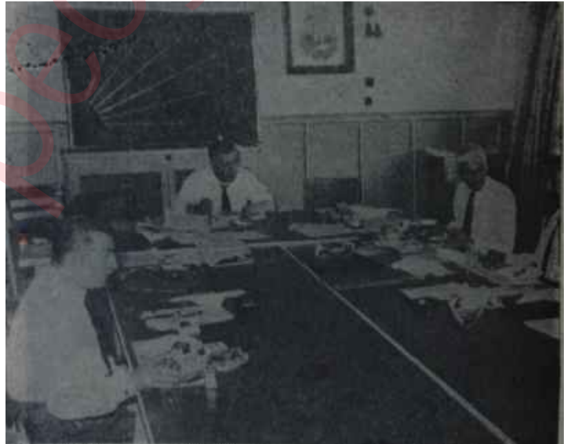
C.H.P. Genel Merkezinde seçim hazırlığı

MP de bir mangayı aşmayan gücü ve irikayım liderinin ağızıyla pek büyük iddialar sahibidir ama, seçimlerde sadece Bölükbaşı hayranlarından oy koparacağı bellidir. Tabii hala, Bölükbaşı hayranı varsa'..