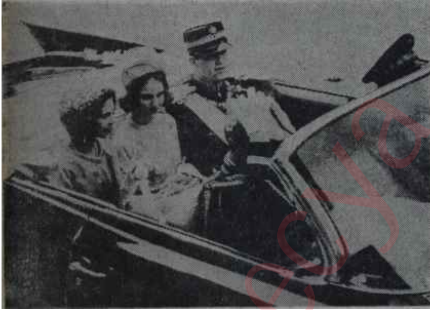
Yunan Kral ailesi Taht tehlikede

İşler bu noktaya gelip dayandıktan sonra, bütün gözlemciler, bu çekişmenin ya Kralın gerilemesiyle, ya da Papandreunun yeni seçimlere gitmesiyle sonuçlanacağını sanıyorlardı.