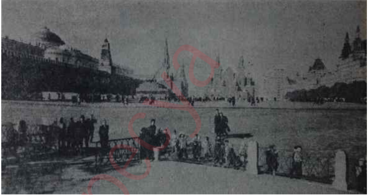
Moskovanın meşhur Kızıl Meydanının görünüşü

rin merkezi durumunda bulunan Kremlin, asıl Moskova Prenslarının sarayı. Moskovanın kurucusu diye bilinen ve bu sıfatıyla at üzerinde bir heykelinin şehrin meşhur Gorki Cad desini üzerine dikilmesine hak kazanan rus prensi Yuri Dolgoruki 1156'da- Borovitski tepesine tahtadan-bir kale yaptırmış. Burası Moskova Prenslarının ikametgâhı olmuş. İki asır sonra, 1367 civarında tahta duvar ve kaleler beyaz tuğlaya çevrilmiş. Bir asır daha geçmiş, 1485 ile 1493 arasında rus ve italyan mimarlar bir yeni duvar çemberi yapmışlar. Bugün mevcut "Kremlin Duvarları" bu. Ondan sonra, bu