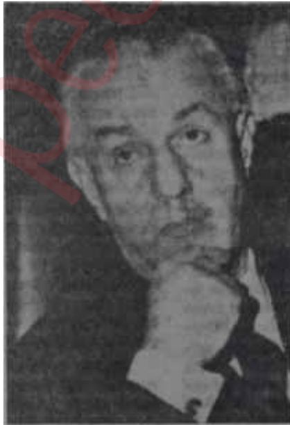
Suat Hayri Ürgüplü Akıl için yol birdir

yeti Başkanı için böyle hallerde tutulması gereken mâkul yol söyleyeceklerini önceden Hükümete bildirmek, yapacaklarını önceden Hükümete danışmaktır. Tabii bu bağları arzu etmeyen, müstakil karakterli sayın şahsiyetler bu memlekette bulunabilir. Ama bunlara düşen, o takdirde. Cumhurbaşkanlığına hiç talip olmamak, politikacı iseler politika yapmak, kendi taraftarlarını mahir sevk-i idareleriyle iktidara getirmek ve Başbakan olmaktır. Türkiyede ancak Başbakanlar, sorumlu olduklarından, hareketlerini bizzat kararlaştırmak imkânına sahiptirler. Yoksa, sorumlunu başkasının