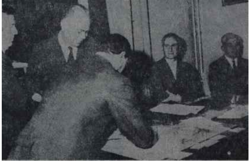
C.K.M.P.'de seçim çalışması İki yolun ortasında

Ana iktidar partisi A.P., büyük bir gizlilik içinde hazırladığı "kır at" sembolüyle oy avına çıkmış bulunmaktadır. A.P. li yöneticilerin hedefi, çoğunlukla köylerdeki muhafazakâr halk kütleleridir. Devlet kapısındaki işini, D.P. devrinden kalma bir alışkanlıkla, ocak veya bucak başkanına yaptırmayı rahatlığına pek yakıştıran bu kitle, A.P. nin ağına en kolay düşecek bahttır. Ayrıca, plânsız ve programsız, "her mahallede bir milyon" sloganına uygun bir iktisadi anlayışla memleket idare etmeğe, çalışan A.P. için kolay ve çok kere gayri meşru yollardan para kazanan, bu hevesi kursaklarında saklayan eski zengin ve ye-