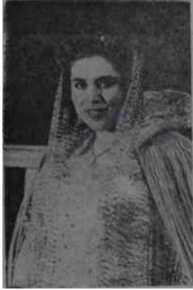
Semiha Berksoy sahnede

Beni al, öyle kal, Kalbe sal sevgiyi, Sevgide yok günah, Böyle oh, ne iyi! Sevmek bu, bakarken gökyüzünde aya görünür gözüme bir çift mavi göz. Sevmek bu, sevmek gelir mi şakaya? Sevmek bu! Onundur her yerde son