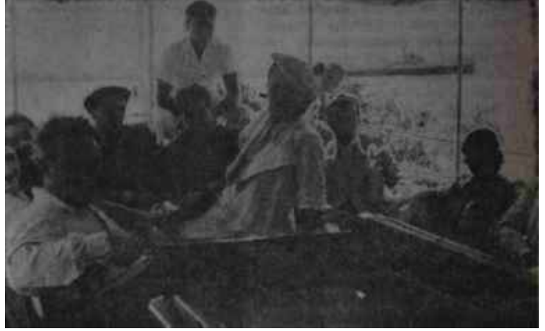
Semiha Berksoy yıllar önce bir vapur gezisinde