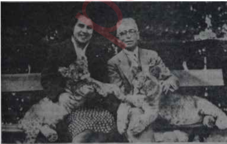
Semiha Berksoy Avrupada bir parkta Göz görmeyince gönül katlanır

Büyük bir şevkle çalışmağa koyuldu. Nâzım Hikmeti uzaktan görüyor, kendisini hayran hayran seyretmekle yetiniyordu, Semiha şairle ilk karşılaştığı gün onun hakkında hiç birşey bilmiyordu. Ona tesir eden, genç adamın altın sarısı saçları, dalgın bakışlı gözleri oldu. Bir masal kahramanına aşık olur gibi, genç kız kalbinin bütün saffiyetiyle, kendisinden oniki yaş büyük, tecrübeli, olgun adama bağlandı. Kimdi, neydi, ailesi, var mıydı? Neden sonra bunları araştırmağa başladı, Şiirlerini, yazılarını artık okuyor, uzaktan hayatını takip ediyordu. Hususi hayatı hakkında da çok az şey biliniyordu. Çapkın olduğu söylenir, kadınlar tarafından çok beğenilirdi. Evli