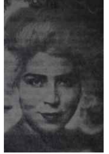
Semiha Berksoy Geçmiş zaman olur ki...

Semiha gözlerini adamın Orta Asya akıncılarını hatırlatan yüzünden ayıramadan, ahenkli sesini dinledi, Sıra kendisine gelince, uzatılan şiiri titreyen parmaklarla aldı. Parmakları, kalbi titriyordu. Fakat sesine hâkim olmasını bildi. Okumağa başladı: