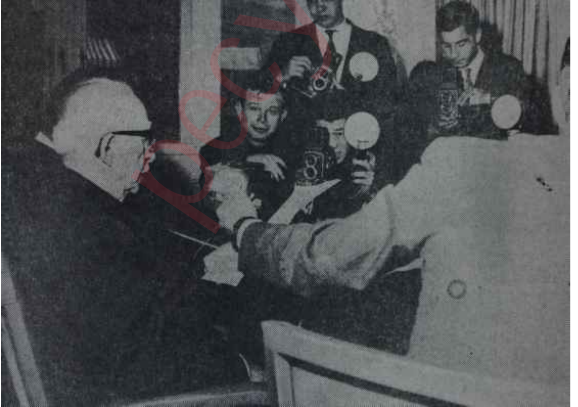
Muhalefet lideri İnönünün basın toplantısı Dilinin altındaki: "NATO'nun kararını bekliyoruz"

Londrada hava, Kıbrıs buhranının bir an evvel bir sonuca vardırılmasının gerektiği havasıdır. Buna, başta Amerika Türkiye ile Yunanistan ve herkes müttefiklerdir. Amerika canı sıkın haledir. Üstelik Kıbrıs, Amerikanın nazarında toplantının da en önemli meselesi değildir. Ball, Vietnam politikası konusunda müttefiklerinden bir