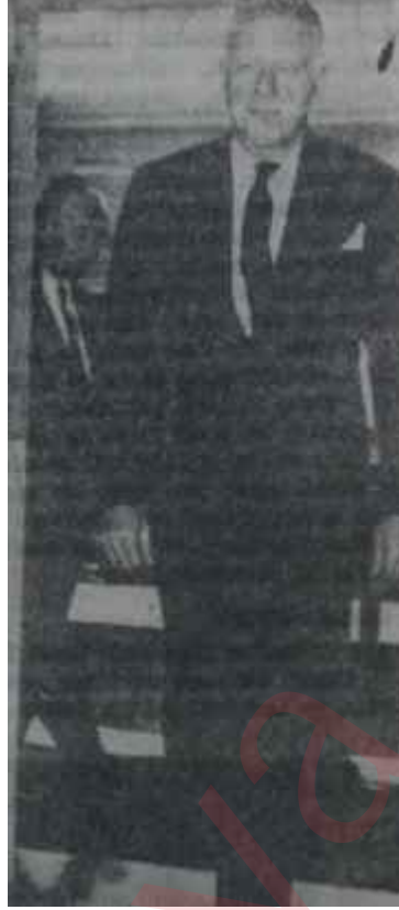
George Ball Kızıl renk allerjisi

Bu kadarı kâfi midir? Elbette ki hayır!. Hükümet, bıkmış usanmadan, önemle Kıbrıs anlaşmazlığı üzerinde durduğunu, gerekirse elindeki bütün kozları kullanacağını ilgili devletlere anlatmak zorundadır. Şu satırların yazıldığı sırada Londrada toplantı halinde bulunan NATO Bakanlar Konseyi bu bakımdan Türkiye için büyük bir fırsattır. NATO üyelerine iyice anlatılmalıdır ki Kıbrıs bütün türkler için çok ciddi, çok önemli ve çok hayati bir konudur ve bu anlaşmazlık Türkiyenin hoşuna gitmeyen bir biçimde çözülmüşse bunun geniş çaplı etkileri olacaktır. Çünkü Batılı devletlerin Orta Doğudaki çıkarları Lâtin Amerikadaki veya Uzak Doğudaki çıkarlarının-