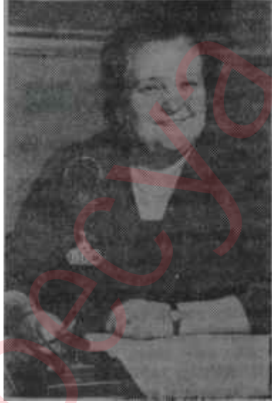
Prof. Afetinan İlim yapan kadın