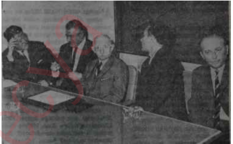
C.H.P.'ye katılan 14'ler İnönü ile C.H.P.'de

Şimdi C.H.P. üç ateşli, imanlı, reform taraftarı eleman kazanmış bu----- Bunların mezizetleri dinamizmlerinde, coşkun ruhlarında, çalışma güçlerinde ve şarj olmuş dinamiklerindedir. C.H.P. böyle bir itici kuvvete muhtaç haldedir. Ama eğer C.H.P. nin yeni üyeleri, kendilerini eski partinin çalıştırmasını beklerlerse çok beklerler C.H.P. ancak memleketin pek sıkışık hallerinde canını dişine takan bir teşekküldür. Ona,