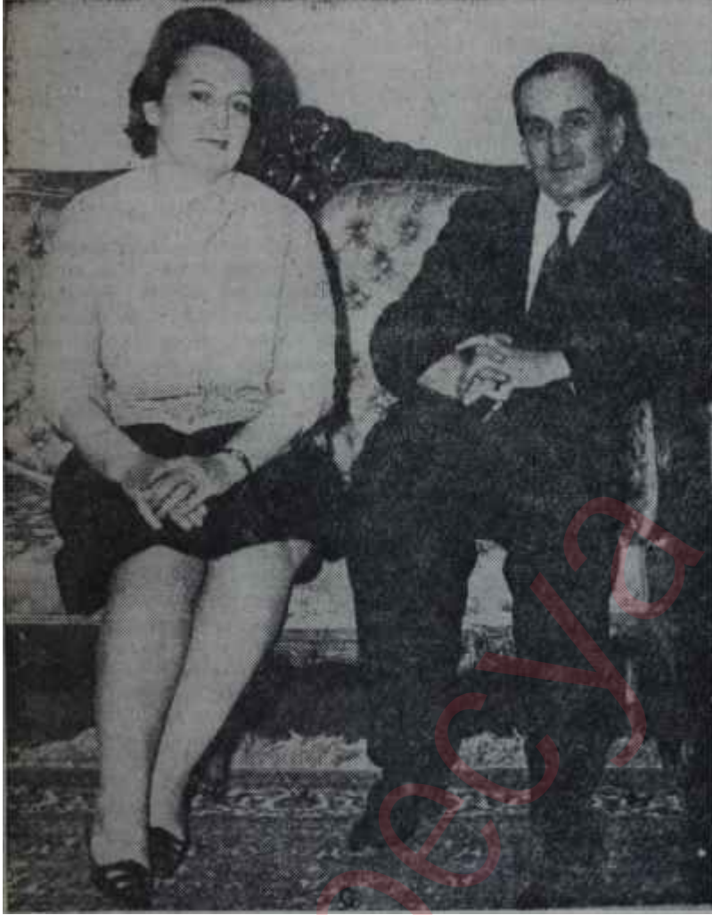
Maliye Bakanı Gürsan evinde, eşyle Yumuşak başlı bir zat

tulmuş, analarıyla babalarıyla ilişkileri kesilmiş ve parasız kalmış olan Türkiye'deki Kıbrıslı türk öğrencilere öğrenim yardımı yapan Kıbrıs Türk Derneğine bir milyon lira verilmesi hakkındaki önerge kazaya uğramıştır.