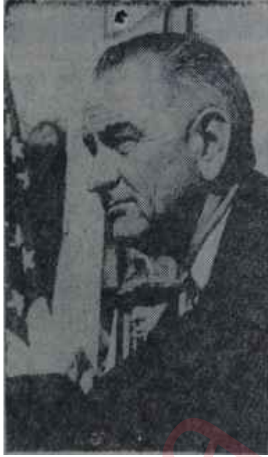
Başkan Johnson Ele verir talkını...

Ancak, Amerikan hükümetinin memnurlukla karşıladığı Dominik ihtilalini amerikan özel sermayesinin de aynı şekilde karşıladığı söylenemez. Trujillonun devrilmesinden sonra yapılan seçimleri kazanan Dr. Bosch, belki Başkan Kennedy gibi dünya görüşü geniş bir yönetici için ortanın biraz solunda olmakla beraber, parlamentaryer demokrasiye inanmış, aranıp