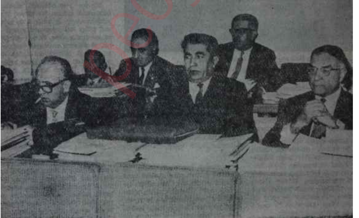
Bütçe Komisyonunda C.H.P. ekibi

Bu çalışma tarzı, Komisyonunda devam edip gitmiştir. Hatta bir ara derneklere yardım faslında kesenin ağız öylesine açılmıştır ki, Bütçe Genel Müdürü "imdat" ister gibi feryad etmiş, "Başkan bey, bir saatte yaptığımız zamlar 10 milyon lirayı buldu, rica ederim..." demek zorunda kalmıştır. Bu furya içinde esas maksadı hiç bir zaman anlayamamış olan Komünizmle Mücadele Derneğine 100 bin, komisyon üyelerinin o sıradaki fısıldaşmalarına göre "Bakan Mülkiyeli olduğu için" Mülkiyeliler Birliğine 175 bin, hadiseli Bursa kongresinden sonra yarattığı polemiklerle AP'nin büyük sem patisini toplayan Milli Türk Talebe Birliğine 50 bin lira âdeta dağıtılmış'tır. Fakat bu arada gerçekten yardım yapılması gerekli olan dernekler unu-