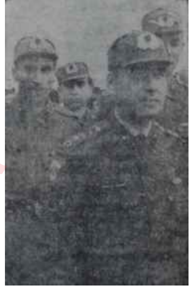
Kıbrıs'a çıkan Değişirme Birliği ve kumandanı Türkiye "he" demeyecek