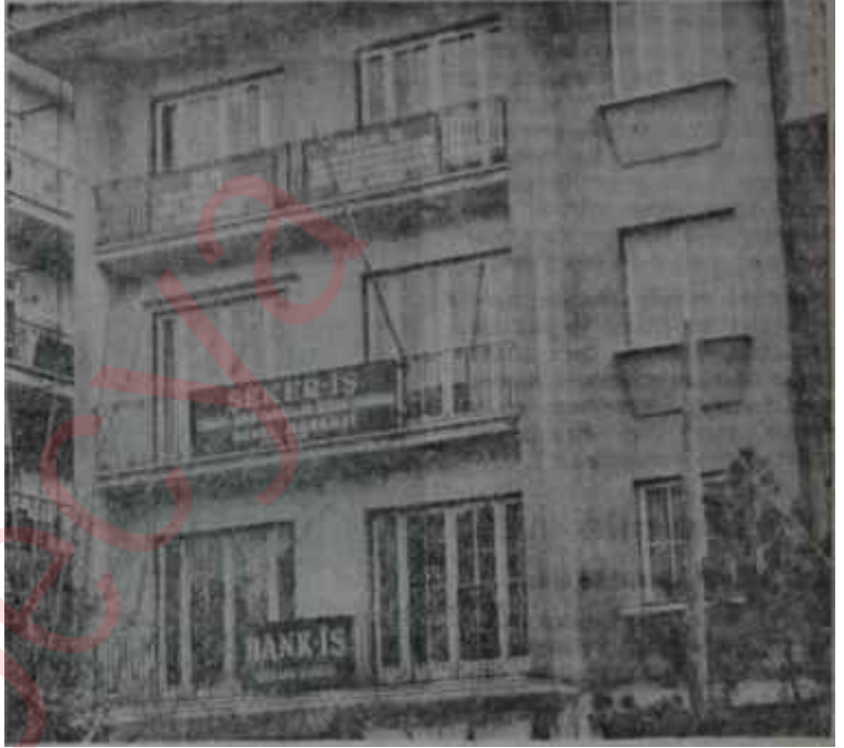
Türk-İşe başkaldıran sendikaların idarehaneleri