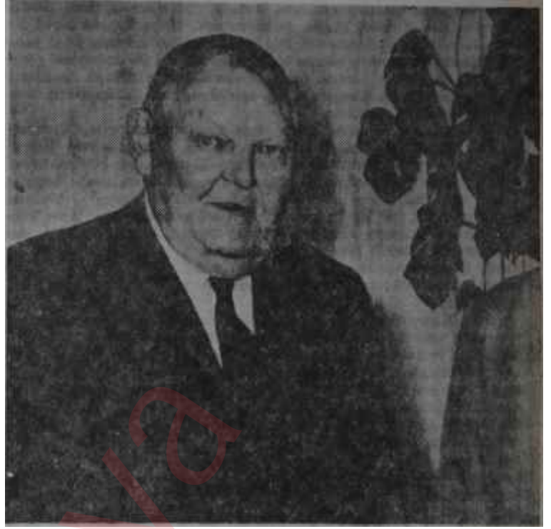
Ludwig Erhard Akıl yolu birdir

Bilindiği gibi, bu suçlular hakkında kovuşturma açılma tarihi, alman ceza kanunlarındaki genel kurala uygun olarak, yirmi yıllık bir zaman aşımı sonunda, 8 Mayıs 1965 tarihinde sona ermektedir. Fakat bu tarih yaklaştıkça bütün dünyada, özellikle İkinci Dünya Savaşında alman işgaline uğramış ülkelerde, savaş sırasında işlenen insanlığa karşı suçlarda zaman aşımının işlememesi yolunda kuvvetli bir akım belirmiştir. Bu görüşü savunanlara göre ortalıkta daha cezalandırılmamış bir sürü nazi suçlusu vardır ve bunların işledikleri suçlar genel ceza kuralları gereğince cezalandırılmamaktadır. Böyle olunca da, bu suçlara yirmi yıllık olağan zaman aşımı