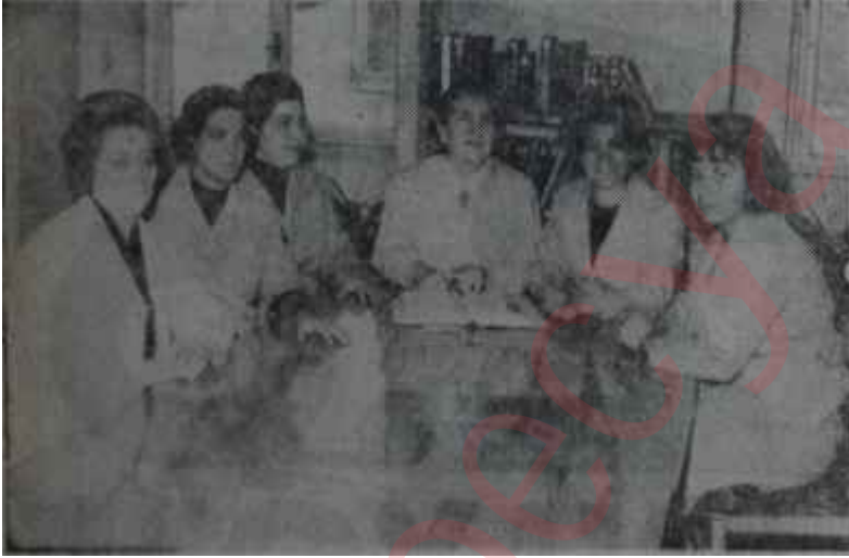
Nümune Hastahanesinin yeşil önlüküleri