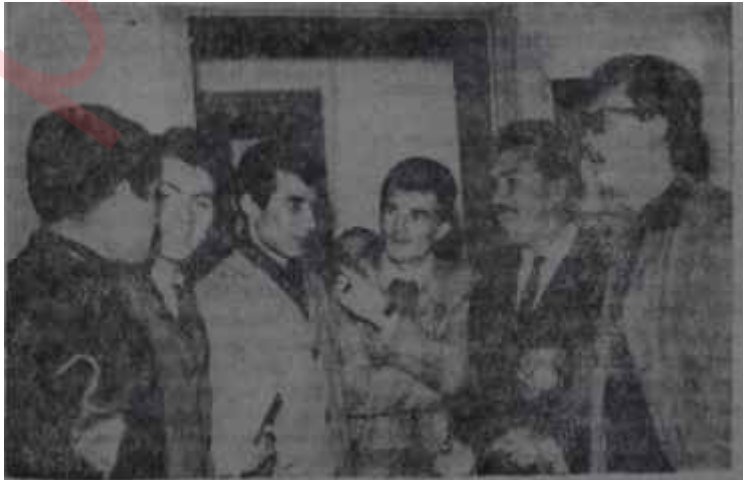
M.T.T.B. li gençler yürüyüşten önce