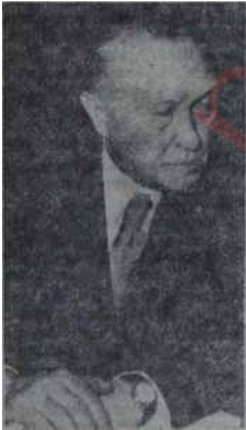
Adenauer Eski defterin sahibi

Bilindiği gibi, Batı Almanya kabinesi 21 bakandan kuruludur ve bunların beşi Hür Demokrat Parti üyesidir. Şimdiki durumda öteki Hür Demokrat Bakanların istifa edeceklerini gösteren bir belirti yoktur. Bununla beraber, Bucher'in istifası Hür Demokratlarla Hristiyan Demokratlar arasın-