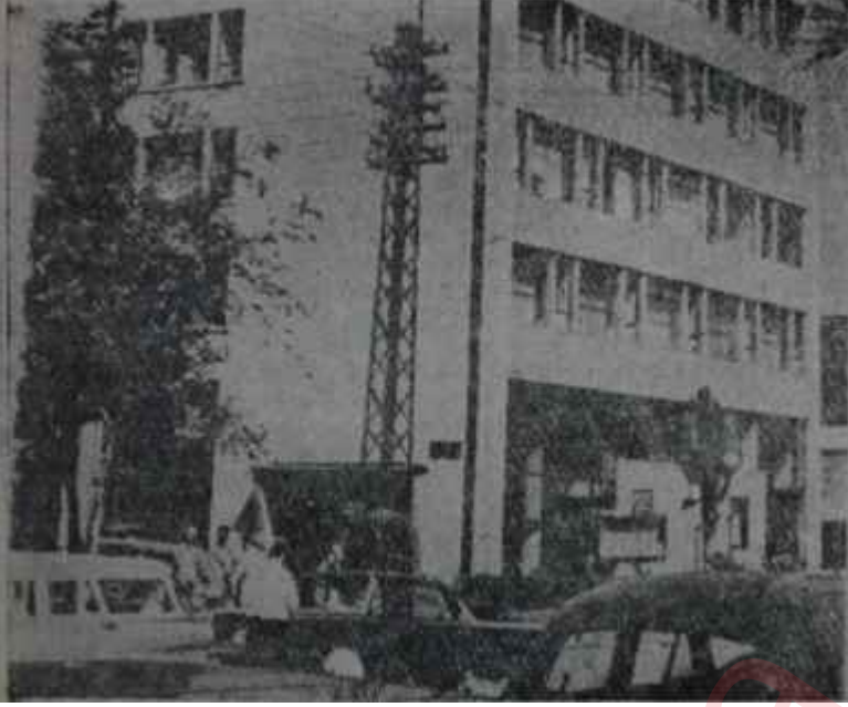
Turizm - Tanıtma Bakanlığı "Yardan geçerim, serden geçmem"

kasıtlı- bir hatadan ibaret görülemez. TRT bir kamu müessesesidir. Onun bağımsızlığı, türk milletinin onayından geçmiş bir Anayasa ile perçinlenmiştir. Bu nokta üzerindeki müdahaleler ve oyunlar soğukkanlılıkla, ihtiyatla değil, infialle, en sert tepki ile karşılanacaktır.