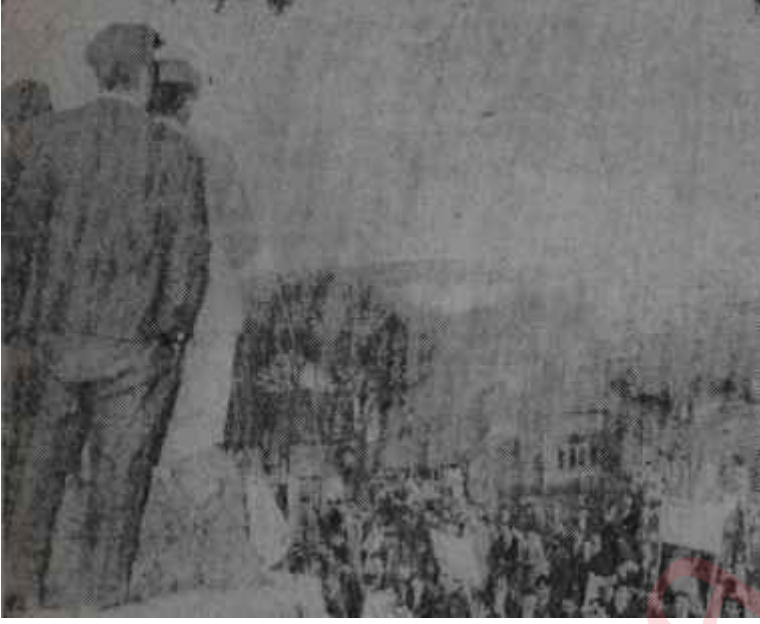
Zonguldak olayı ile ilgili yürüyüş Dereyi görmeden paçaları sıvayanlar