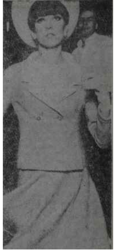
1965 tayyörleri Beğendiğini seç!

Bu değişik bahar tayyörleri yanında chanel tayyörleri, belden kemerli uzun ceketli tayyörler, truvakar ceketli tayyörler, de çoktur. Kışın görülen yuvarlak etekli tayyör ceketleri hem kısa, hem de uzun olarak mev-