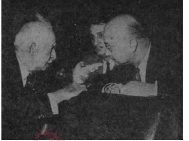
İsmet İnönü, gizli celseden az önce Mecliste Kedisine keçiyoynuzu sundular

Bu ayıklılıklara rağmen bir gerçek, Ürgüplü Hükümetinin Kıbrıs konusunda bütün partilerin mutabakatını temin etmek arzusudur. Aslında gizli oturum, Işık ve dolayısıyla Ürgüplü Hükümetinin bu konuda attığı üçüncü adımı teşkil etmektedir. Daha önce yapılan Liderler Toplantısı ve Pazartesi günü toplanan Senato ve Millet Meclisi Dışişleri Komisyonlarında verilen bilgilerle, sağlam bir plâform kazanılmak istenmiştir. Böylece, liderler ve dış politika meselelerinde yetkili sayılması gereken Komisyon üyeleri tatmin edildikten sonra, Meclislerde fazlaca bir muhalefetle karşılaşılacağı hesaplanmıştır. Gerçekten bu kademeli hesap yanlış çıkmamış ve hele izlenen politika bir önceki Hükümetin politikası olunca, Muhalefetten fazlaca bir sızıltı gelmemiştir. Tabii bunda Işıkın akıllıca hazırlanmış konuşmasının ve hemen her çevrede ki-