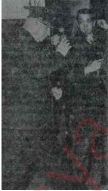
Sunay ve Kumandanlar Güvenlik Kuruluna geliyorlar İşleri zorlaşan kimseler

Bunun bir sebebi, her birinin lideri kendisini dev aynasında gören -belki Ahmet Öğuz hariç - ve üçü Hükümetin dışında sorumsuz dört partili Koalisyonunda yetkiyle karar verecek ve bunu tecrübesine, görgüsüne ve devlet adamlığı vasfına dayayacak bir kimsenin bulunmamasıdır. Zonguldak Hadiselerinde Enerji ve Tabii Kaynaklar Bakanı Mehmet Turgut ile Çalışma Bakanı İhsan Sabri Çağlayangil ve İçişleri Bakanı İsmail Hakkı Akdoğanın tutumları son derece zayıf olmuş, meselenin çapını tesbitte işledikleri hatalar Hükümetin prestijini kırmıştır. Daha sonra, işçilerin üzerine jetler gönderilmesi-