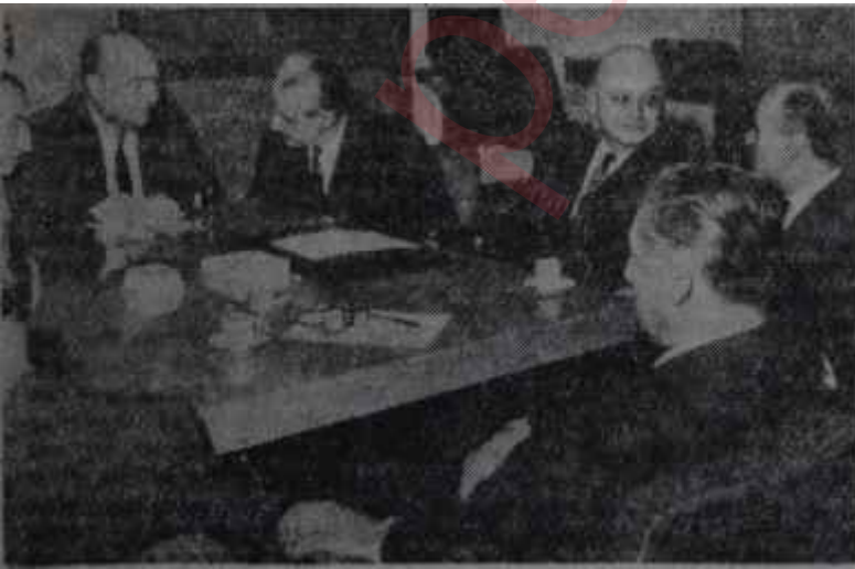
Dışişleri Komisyonu Mecliste çalışıyor Önce komisyon

Sadece Başbakan Suat Hayri Ürgüplüye atfedilerek İngiliz Times'ında çıkan bir haber Başkentte Kıbrıs işiyile ilgilenenlerin midisini bulandırmıştır. Times'a bakılırsa Ürgüplü Makariosun Adada, türklere dokunmamak şartıyla, istediği gibi hakim olup memleketi istediği gibi idare etmesine razı bulunduğunu söylemiştir. Halbuki bunun, mevcut andlaşmalarla bir ilgisi yoktur. Birleşmiş Milletlerdeki müzakerelerde de rumlar "Self - Determination" üzerinde ikili konuşmalar "dan bahsettiklerinde bizim temsilcimiz Orhan Eralpm "Andlaşmaların mevcudiyeti üzerinde ikili konuşma" teklifini yapmaması gariptir. Görüşmelerden bir netice alınmak istenilirse bunda temelin, mevcut andlaşmalar olması lâzımdır. Andlaşmaların