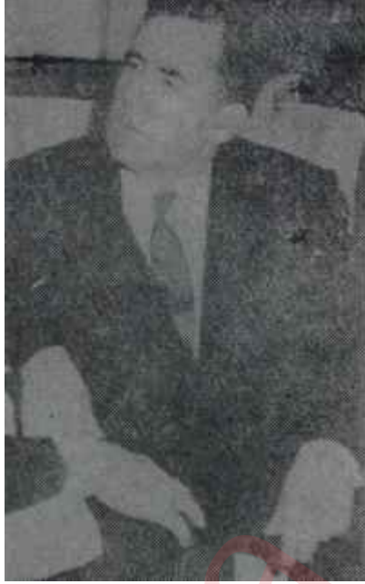
Gromiko Havanda su dövüldü

Birleşik Amerika tarafından girişilen hava akınları, bu hafta, bir de nitelik değiştirmiştir. Amerikan savaş uçakları, şimdiye kadar, yalnız sabit hedefleri bombalıyorlardı. Oysa bu hafta alınan haberler, amerikan uçaklarının uçuş sırasında gördükleri yer değiştiren askeri birliklere de ateş açmağa başladıklarını göstermektedir. Bununla beraber amerikan uçakları, şimdilik, bombaladıkları bölgede bir değişiklik yapmış değillerdir. Bombardıman edilen bölge henüz Hanoi'ye kadar genişletilmemiştir. Ancak, Kuzey Vietnam hükümeti 80 bin kadın ve çocuğu Hanoi'den boşalttığına göre, komünist yöneticiler burasının da doğrudan doğruya tehdit edildiğini ve günün birinde buraya da sıra geleceğini düşünmektedirler. Bundan başka, şehirde önemli korunma tedbirlerinin de alındığı bildirilmektedir.