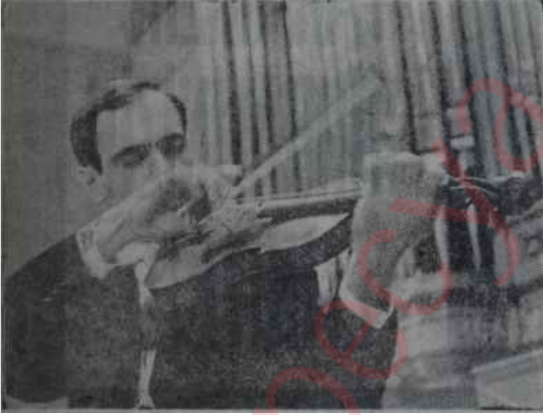
Leonid Kogan Umulanı veremedi

nü Konser salonunda ve Cumhurbaşkanlığı Senfoni Orkestrasıyla beraber verildi. Programda Beethoven'in Sekizinci senfonisi, Mozart'ın La majör keman konçertosu, Debussy'nin "Images"den "İberya" adlı süiti çalındı. Orkestradan çok parlak ve temiz bir Beethoven dinledikten sonra, mütad canlılık ve akıcılıktan mahrum, te-reddütlü bir Mozart dinleyince, müzik-severler birden şaşırıldılar. Hele son bölümde, ritm de dahil, birçok aksamalar görülünce. Kogan üçüncü bölümü sondaki alkışlara karşılık tekrarlamayı uygun buldu. Ama bu üçüncü bölüm bir gün önce çalınan Beethoven konçertosundaki son bölümdü. Böylece dinleyicilere tatlı bir sürpriz yapılmış oldu. Konserin son parçası olan İberya süiti Lessing'in gayretiyle repertuvara yeni giren bestelerden olmasına rağmen umulmayacak bir şekilde "oturmuştu". Herhalde, alkışta aslan payını kendisine ayırmayı düşünen Lessing, haklı olarak bunu konserin en sonuna koymuştu!... Ama sonuç tam tersi oldu: değerli sanatçı, hakettği övgü gösterisini dinleyicilerden göremedi. Zaten salon Kogan'ı dinledikten sonra hayli boşalmıştı. Bu, herhalde „Ankara sanat çevreleri için kınanacak bir tutumdur.