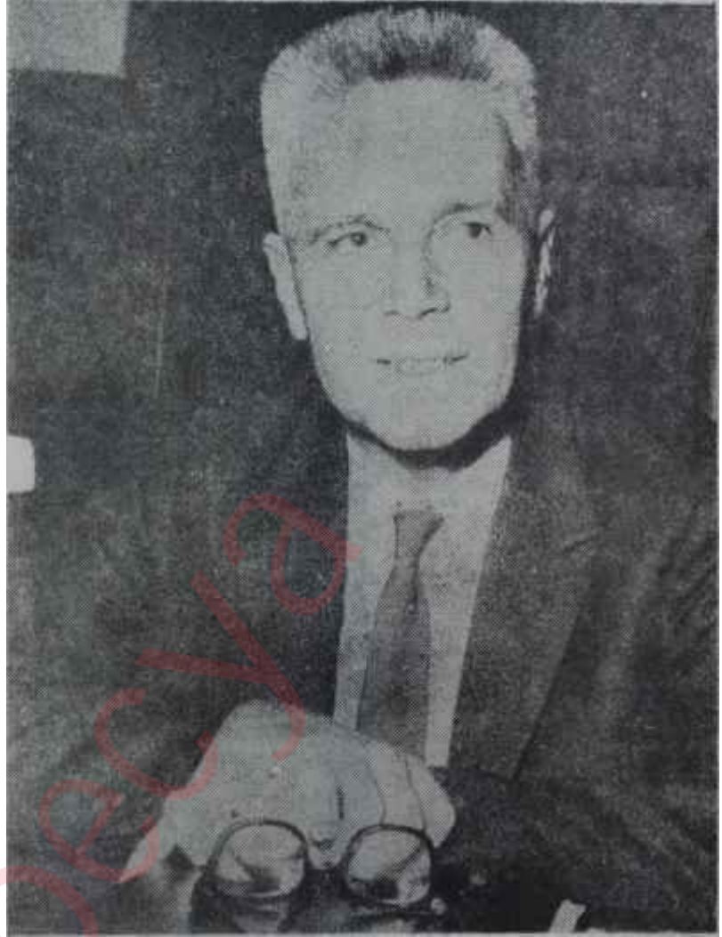
Prof. Tinbergen basın toplantısında

"— Plânlama Uzmanı Tinbergen, 1963-64 kalkınma hızının yüzde 6.2 olduğunu söyledi. Siz ne dersiniz?"