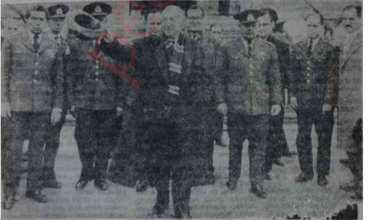
23 Şubat Sabahı

Yok, eğer Bölükbaşı "22 Şubat darbesini ben bastırdım" demek istiyorsa kendisine tavsiyemiz şudur: Git be kardeşim, kendini bir iyi üfürükçüye okut!