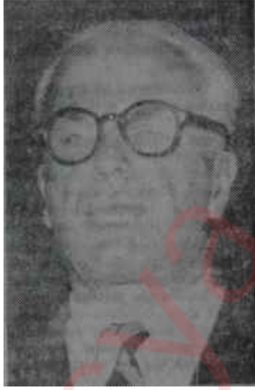
Fuat Sirmen Veto!

Olay, bu Çarşamba günü TBMM Senato Başkanlığı odasında cereyan etti. Bir gün önce liderler, Hükümet ve Grup temsilcileri, ani bir şekilde, Senato Başkanı Enver Aka tarafından davet edilmişlerdi. Ankara gibi heyecan dolu bir şehirde bir liderler toplantısı demek, çok önemli gelişmeler demektir. Fakat toplantının konusu öğrenilince, endişe şaşkınlığa çevrildi, Enver Aka liderleri, milletvekili ve senatörlere fazladan para ödenmesini ön gören bir teklifi görüşmek için çağırılmıştı. Partilerin sorumluları kızgınlıkla hayret arasında bocaladılar. YTP liderlerinin tepkisi, toplantıya katılmama kararı oldu. MP ise, Senato Başkanına yazılı bir cevap göndererek, böyle bir toplantıyı lüzumsuz bulduğunu, katılmıyacağını bildirdi. AP lideri Süleyman Demirel toplantıya katıl-