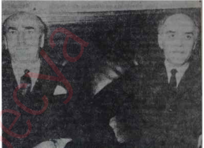
Hasan Işık Sovyet Büyük Elçisi Nikita Rijofla

Yeni Dışişleri Bakanı Hasan Işık bu sözleri Salı günü, Dışişleri Bakanlığının toplantı salonundaki uzun masayı çevreleyen otuzu aşkın gazeteci karşısında söyledi. Sezarın hakkını Sezara vermek gerekirse, konuları ele alınmadaki cesareti, açık sözlülüğü ve güler