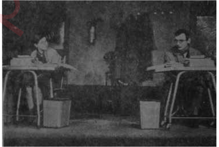
Gen-Ar'da "Daktilolar" Ömür törpüsü

Sonuç: Yepyeni iki küçük amerikan avant-garde'ı; doğru bir yorum içinde sahneye konulmuş, iyi oynanan ve amerikan tiyatrosunun -Albee'den sonraya- nereye yöneldiğini gösteren iki önemli oyun.