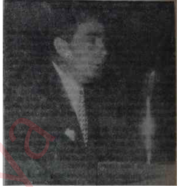
Metin Toker bir konferansta

— Aynı tarz yutturmacalar Yönde yapılıyor. İsmet Paşa aşırı cereyanlar konusunda Cumhuriyete verdiği demeçte bu cereyanları "hürriyet nizamını bertaraf edip kendi totaliter, müsamahasız katı sistemlerini iktidara getirmek gayretinde" olarak tanımlamıştır. Şimdi Yönü aynen dinleyiniz: "Eğer aşırı sol deyiminden kastedilen buysa Türkiyede böyle bir akım yoktur. Zira memleketimizde totaliter akımlar yasaklanmıştır".