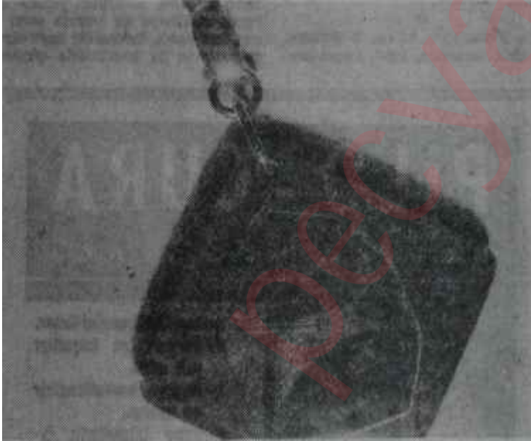
Dağıtılan A.P. markalı anahtarlık

Geçirdiğimiz haftanın sonunda Cumartesi günü CHP'li Kadınlar Kolu