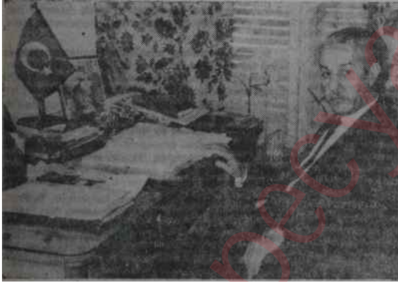
Suat Hayri Ürgüplü

Bizzat Suat Hayri Ürgüplü'nün bazı sohbetlerinde açıkladığına bakılırsa Gürsel - Ürgüplü temasları bundan bir süre önce başlamıştır. Aslında bu temaslar için "devam etmiştir" tâbiri daha yerindedir. Zira Meclisin bu devresinin başında Gürsel ve Ürgüplü Çankayada komşuluk yapmışlardır. Ürgüplü Senato Başkanlığına seçildikten sonra Cumhurbaşkanı köşkünün yanında bulunan, ecnebi misafirler için yapılmış, sonradan Menderes tarafından el konmuş konağı "resmî ikametgâh" olarak kullanmıştır. Ürdünlü, makam arabası olarak da Menderes'in eşi için devletçe getirilmiş son model Cadillac'ı seçmiştir. Gürsel bu komşuluk sırasında Senato Başkanını sık sık Köşke, sevdiği türk filmlerinin gösterilişinde hazır bulunması için davet emiş ve Ürgüplüyü "pek yumuşak başlı bir zat" olarak tanımıştır. Ürgüplü, Cumhurbaşkanı'nın bu filmlere olan sevgisini paylaştığını sık sık ifade etmiştir. Şimdi çok kimse, yeni Senato Başkanı Enver Aka bir resmi ikamet-