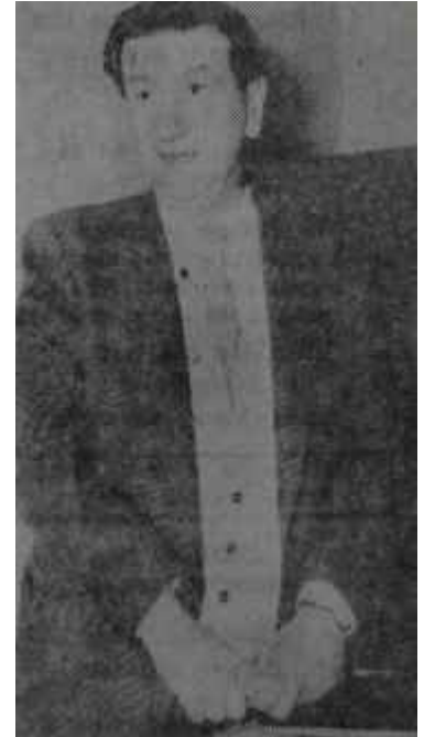
İhsan Doğramacı ...Şimşir tarak