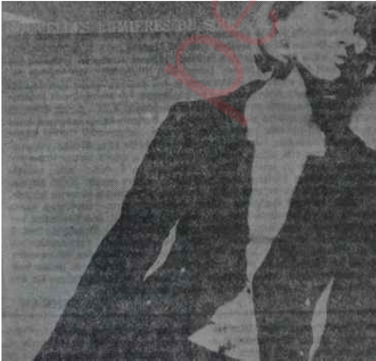
Bir eski siyah tayyör Gizli servet!

Çok ciddi görünümlü şömizye elbiseleri veya değişik renkte düz tayyör, leri de aynı şekilde elden geçirmek mümkündür. Meselâ şömizye bir elbise, aynı renkte bir gipur dantel yaka ve kol ağzları ile gerçekten şık olacak ve en şık bir yere gidebilecektir. Kürk taklidi tüylü naylon kumaşlar ve püskül şeklinde yünler, aksesuar olarak kullanıldığı takdirde, giyene