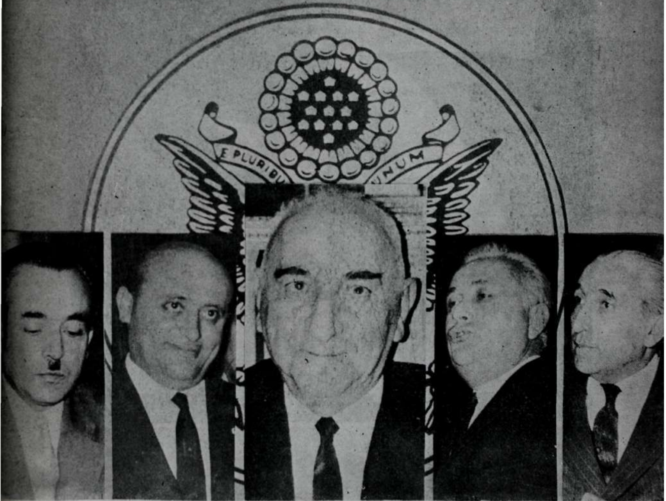
ÇANKAYADA BULUŞANLAR TARTIŞILAN ŞÜPHE: ARKADA BİR GÖLGE YOK MU?