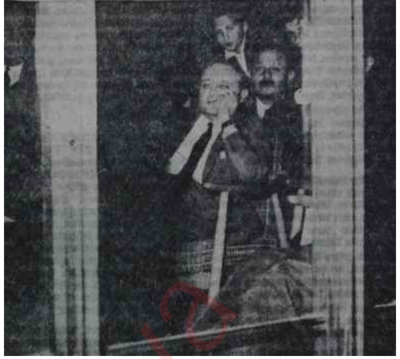
Sırça Köşkte Demirel

AP Grubunda da, sahneye konulan bu oyuna büyük, bir direnç mevcuttur. Salı sabahı Ürgüplü üzerinde anlaşma ya varıldıktan sonra bile bu direnç devam etmiş, hattâ liderler Çankaya'ya çıkmadan iki saat önce AP Grubu işe