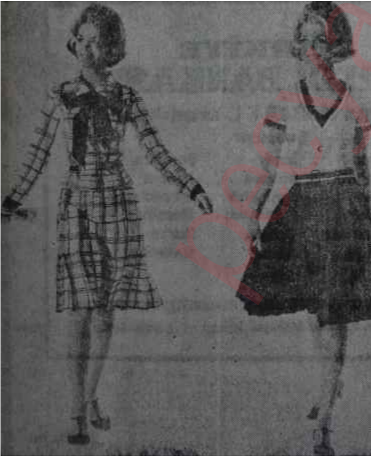
Pliseli bütün etekler Kumaşçılara müjde

Detay zenginliği, özellikle tayyörlerde büyük rol oynamakta, tayyörlerin en klâsiklerine bile çok kadıncı bir hava getirebilmektedir. Meselâ uzun, ceketli bir kruvaze tayyörün sert hattı, boyundan uzak olarak biçilmiş klâsik yuvarlak yakayı giydiren şeffaf bir eşarp ve bu eşarpı tutan çok büyük bir süslü iğne ile giderilmiştir. Gine uzun ceketli bir lâcivert tayyörün akık yuvarlak yakası ve uzun kolları beyaz kapaklarla açılmıştır. Tayyörün yalnız