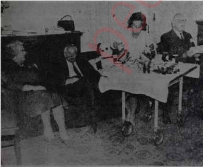
Harold Wilson ailesi ile birlikte