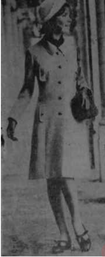
1965 baharı Hem klasik, hem yeni

üst kısmında bulunan düğmeleri ise hem yanyanadır, hem de siyahlı beyazlı dama taşa benzemektedir. Ceket belde kemerle kapanmıştır. Genel olarak kısa ceketli tayyörler daha çok döpiyes havasını taşımaktadır ve biyelerle, sutaşlarla yan düğmeler, şal yakalar, yanda kapanan beyaz kapaklı yakalarla kadınlıştırılmıştır. En klasik tayyörlerin bile hiç olmazsa yakaları açık biçilmiştir ve süslü eşarplarla, hava yumuşatılmıştır. Tayyörlerde ucun kollular yanında, dirsekte biten kısa kollular ve truvakar kollular da çoktur.