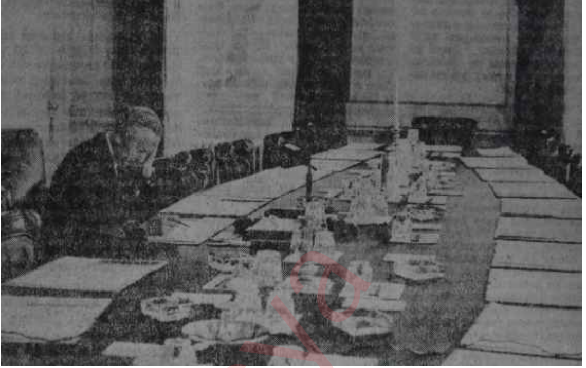
Britanya Başbakanı Harold Wilson Kabine toplantı salonunda Yalnız fakat emin