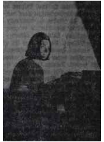
Münih Piyanolu Üçlüsü Anılacak sanatçılar