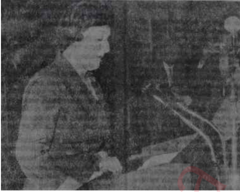
Senatör Zerrin Tüzün