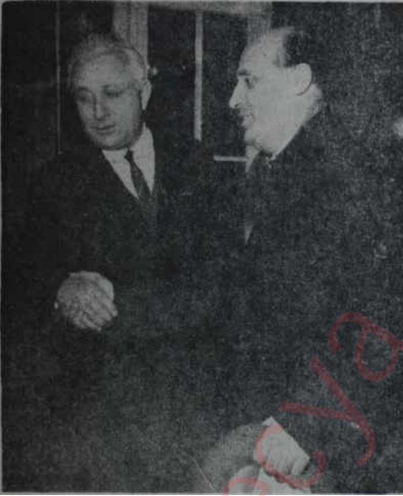
Demirel Y.T.P. de Alicanla