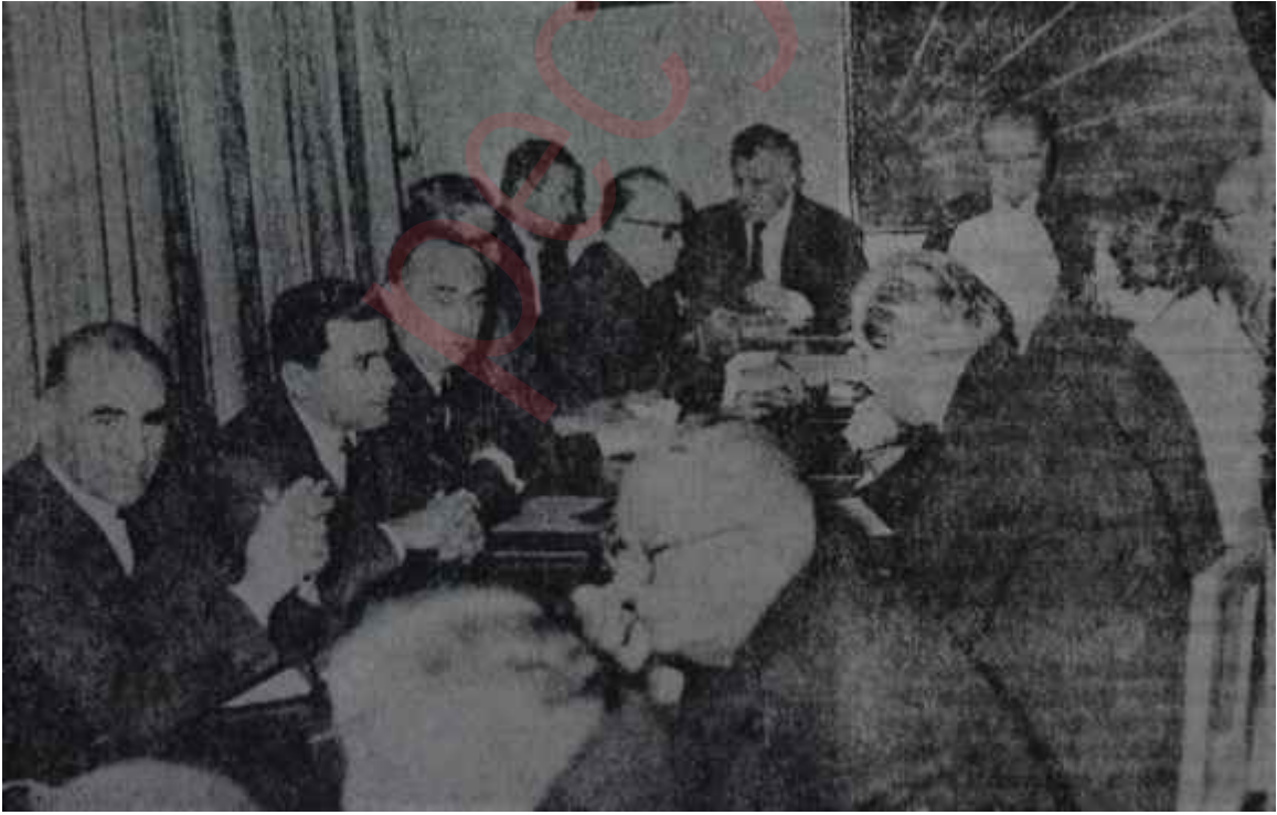
C.H.P. Meclisi son toplantısında Hazırlık çalışması

Karamüftüoğlunun sözlerinde açığa çıkan mukavemet. CHP yöneticilerini son günlerde epey uğraştırmışlar. Toprak Reformu Kanun Tasarısı Meclise verildikten sonra, CHP içindeki toprak ağaları ve reform aleyhtarları derinden, fakat etkili bir çalışmaya girmişlerdir. Parti liderinin, Hükümetin ve Parti yöneticilerinin reformlar lehinde benimsedikleri kesin tutum karşısında, bu unsurlar direkt bir çıkış yapmanın akıllılık olmayacağını anladıkları için dolaylı yolları seçmişlerdir. CHP içindeki reform aleyhtarları aynen A.P.'nin kurnazlığını benimsemişler, söze "biz toprak reformuna aleyhtar değiliz" diye başlamakla beraber, işi geciktirmek ve savsaklamak için yollar aramışlardır. Toprak reformunun, karma komisyon yerine bütün Meclis