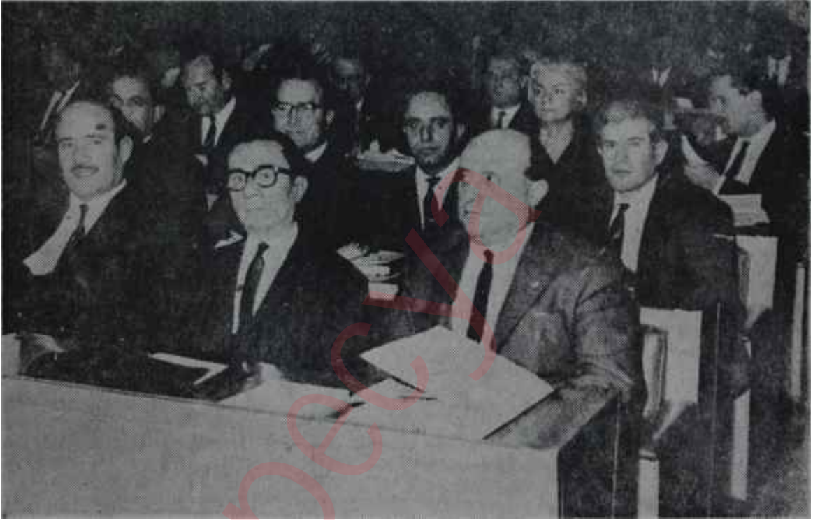
A.P. Grubunun ,Demirelli toplantısından bir sahne