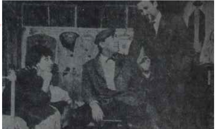
Meydan sahnesinde "Toz pembe" Dünya öyle görünür ama