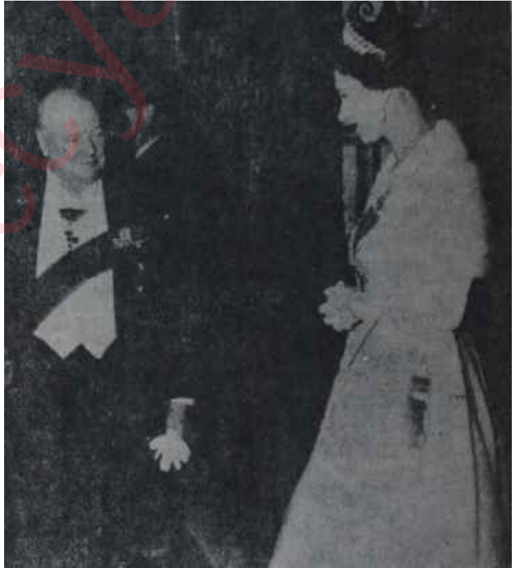
Churchill ve Kraliçe Elizabeth

Başbakan Wilson'ın da söylediği gibi, Sir Winston'un kayboluşu, bir çağın sona erdiğini göstermektedir.