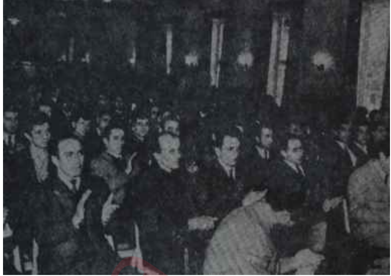
Maden işçilerinin bir toplantısı