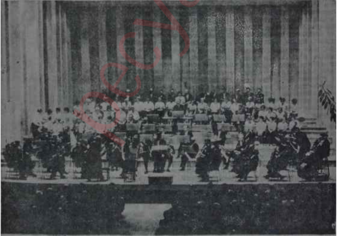
Nordwestdeutsche Filarmoni Orkestra ve Korusu Sanat, sanat ve insanlar içindir...

lere mal olduğunu hesaplarsak, korkunç sonuçlara ve rakamlara erişiriz. En büyük problemimiz "vakit'tir. Türkiyenin hiç bir konuda kaybedecek vakti yoktur artık, Ana meselelerin çözümü, değişen şahısların kişisel "karpislerine veya devrin "tefsir"lerine bağlı kalmamalıdır. Bunun içindir ki, sanat ve kültür işlerini yeniden plânlı yacak, düzenliyecek ve yeni hedeflere doğru en az zaman kaybı ve en büyük "randımanla yürütecek örgütü kurmak istiyorsak, çarenin en idealini. Kültür Bakanlığını gerçekleştirilmeliyiz. Sanat hayatımızda olumlu bir kalkınma "düzeltmeler"le değil, ancak köklü davranışlarla olabilir. Temenni edilirdi ki. Müzik ve Sahne Sanatları Daimi Danışma Kurulu bu konuyu, çözümlenecek meselelerin başında addederek, ele alsındı. Ancak bu temel üzerinde sağlam bir bina inşa edebiliriz. Aksi halde bütün çabalar boşa gidecek ve sonuçta "Kubbede boş bir seda"dan başka bir şey kalmıyacaktır.