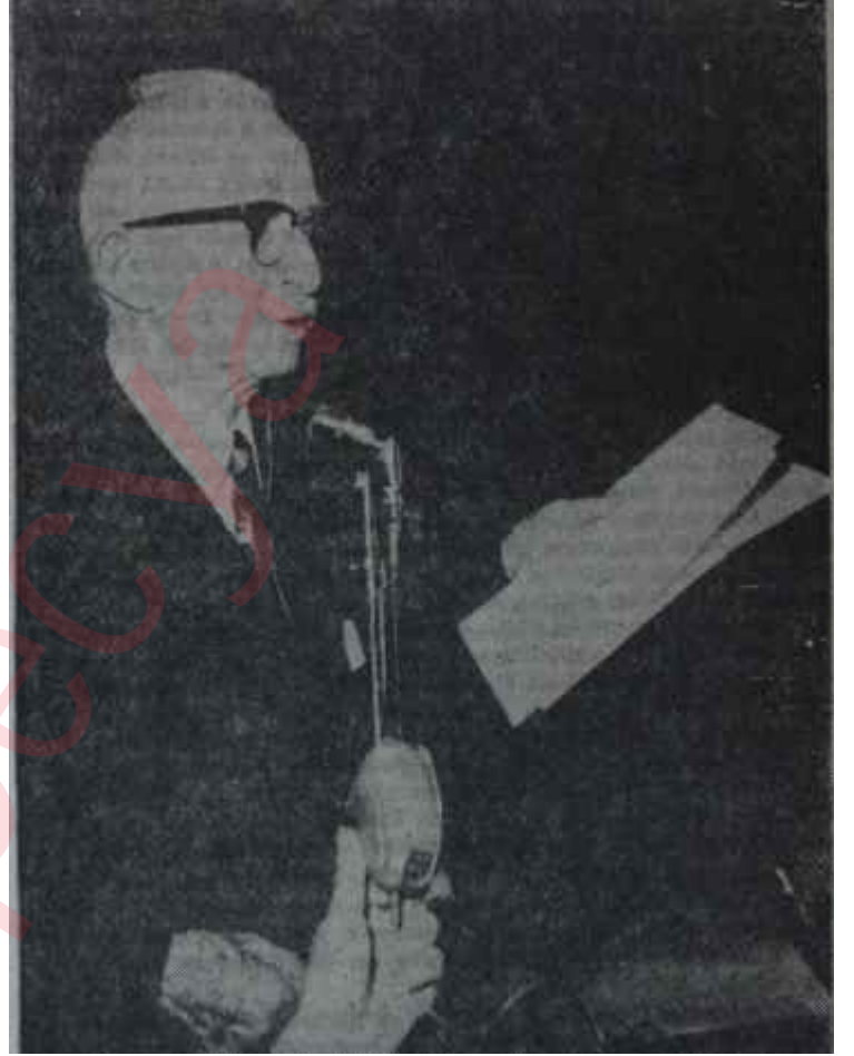
İnönü Çalışma Meclisinde konuşuyor İşik tutuyor

Genel Merkezdeki sinirli anlar bu terk olayından sonra geçti. Bir gün önce, Dördüncü Çalışma Meclisinin açılışında Başbakan İsmet İnönü ve Çalışma Bakanı Bülent Ecevitin sosyal problemler ve işçi hakları alanında verdikleri kesin ve gönül ferahlatıcı teminatlar, bu olayla işçilerin gözünde birer yalan seviyesine inivermişti. Bu, inanılır bir durum değildi. Fakat me-selenin heyecanı içinde bulunan işçi-