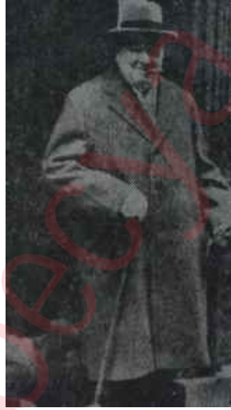
Winston Churchill Bir rüzgârdı, geldi geçti.

Churchill'e yapılan övgülerin en dikkati çekenini General De Gaulle'den geldi. Son yıllarda yazdığı hatıraların da eski İngiliz Başbakanına olan kırgınlıklarını gizlemeğe lüzum bile görmeyen De Gaulle, Kraliçe Elizabeth'e yolladığı mesajda, Fransanın İngiltere'nin içinde bulunduğu matemi en derin şekilde duyduğunu bildirdi. Fransız Devlet Başkanı, Bayan Churchill'e gönderdiği mesajda da bu büyük insanın şahsında bir savaş arkadaşını ve dostunu kaybettiğini söyledi. Nihayet, bir gün sonra bir açıklama yaparak Churchill'in cenaze töreninde