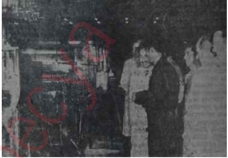
Çalışma Bakanı Ecevit bir fabrikada işçilerle Mahallinde inceleme

çin dışarda değerlendirilen emek büyük bir ihraç malı ve döviz kaynağı haline gelmiştir. Nüfusu bizim üçte birimiz kadar olan Yunanistanın şu anda yabancı memleketlerde bizimkilerden fazla işçisi vardır ve dışardaki yunanlılardan Yunanistana gelen para yı'da 100 milyon doların üstündedir. Bu, maliyeci lisanında "görünmeyenler" denilen diğer kaem dövizlerle birlikte Yunanistanın tediyeye dengesine sıhhat kazandıran başlıca unsurlardan biridir. İspanya, İtalya ve Portekiz de Batı Avrupaya bol bol el emeği ihraç eden memleketler arasındadır. Şimdi Türkiye bunlara yeni yeni katılmaktadır ve türk işçilerinin dışarda kazançları büyük itibar kendilerine rağ-