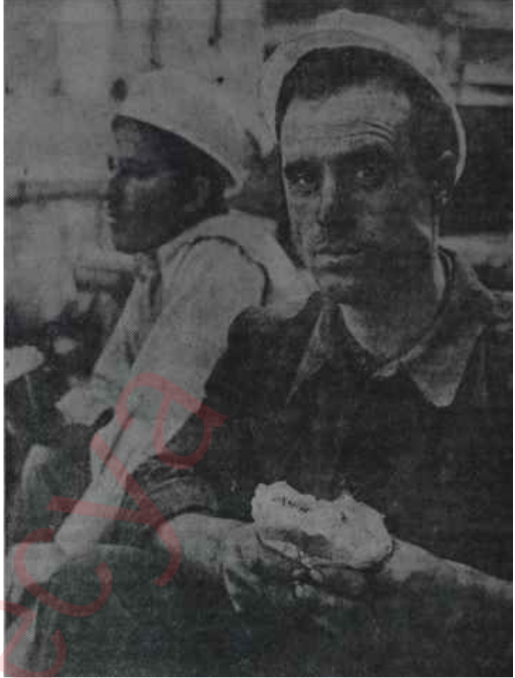
İşten sonra peynir ekmeğini yiyen bir işçi Biz çalışırız, el övünür..

Batı Avrupadaki işçiler "anlatacak mesele" dedikleri zaman en ziyade bu para gönderme meselesini kastetmektedirler. Gerçekten de işin başında çok aksaklıklar olmuş ve işçiyi hem soğutmuş, hem de karşılaşılan güçlükler başka çarelerin aranmasına yol açmıştır. Bu güçlüklerin bir kısmı aklılmaz bürokrasi anlayışsızlıkları-