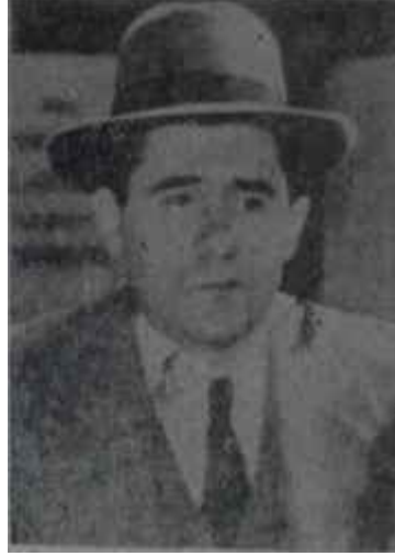
Cromiko Sinyali çekti

Bunun dışında sadece, siyasi hayata bir "D.P. efsanesi" bulunduğu için A.P. de. yani sosyalistlikle uzak yakın -sosyalizm düşmanlığından gayrı- hiç bir ilgisi bulunmayan bir cep-