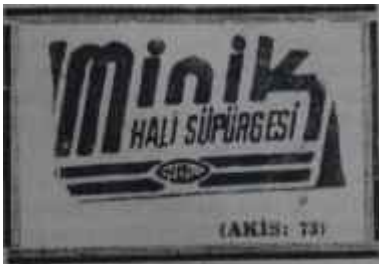
AKİS, 29 OCAK 1965

18 Ocakta İmar ve İskân Bakanlığı salonunda açılan seramik sergisinde Vejdî Keyn, sanatverleri hayran bırakan seramik panoları ile bir yandan en düşündürücü tabloları sunarken, bir yandan da renk ve şekil bakımından modern dekorasyona yeni buluşlar getirdiğini ispat etti. Tabii taşları hatırlatan yer saksısı, bir yeşillikle, şık bir modern evin en güzel bir köşesini teşkil edebilecek nitelikteydi, Keyn renkli ve