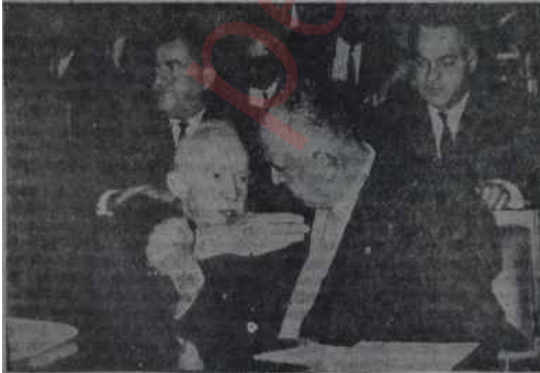
Başbakan İnönü Mecliste müzakereleri takip ediyor Doğru düşünüp doğru konuşan

Ancak şu sıralarda AP'yi ürküten. Milli Bakiyeler Kanunu dolayısıyla küçük partilerin CHP'nin etrafında birleşmiş olmalarıdır. Oysa AP, "AP'ye iktidar verilmez, seçimleri kazansa bile iktidara gelemeyecektir" söylentilerine bir sünger geçmek ve önümüzdeki genel seçimler için çantada keklik bilinen oyların yanısıra iktidarı da peiinen garantilemek istemektedir. Bunun için, en kısa zamanda İnönü Hükümetini düşürmek ve gerek halkı, gerekse zinde kuvvetleri AP iktidarına alıştırmak fikri, şu sırada, bu partinin