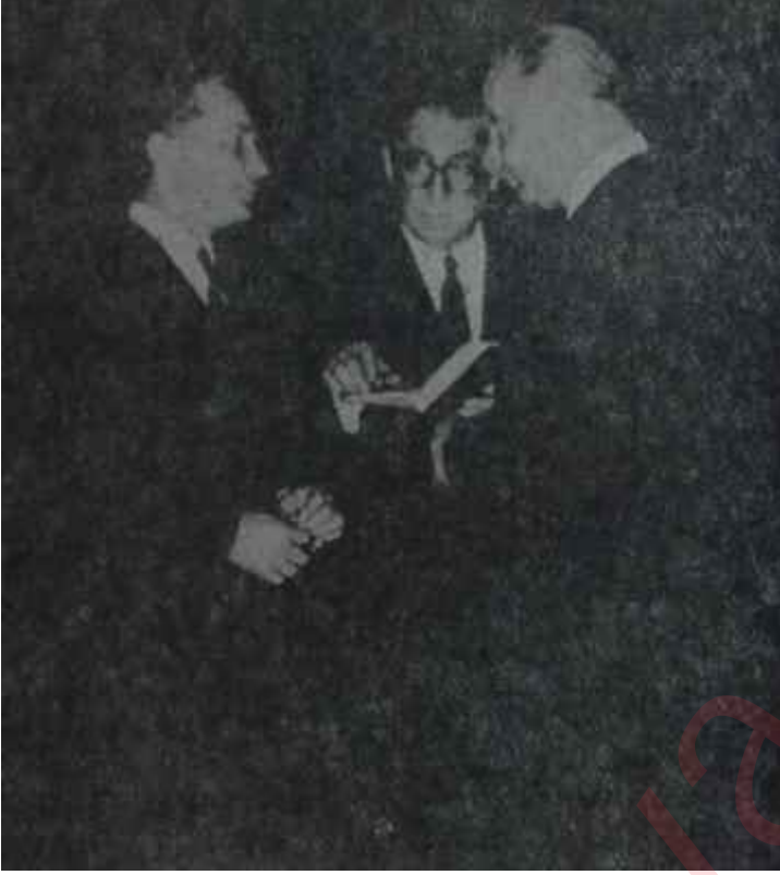
A.P. liler kuliste Çabalama kaptan..

yöneticileri arasında çok tutulan bir fi kirdir.