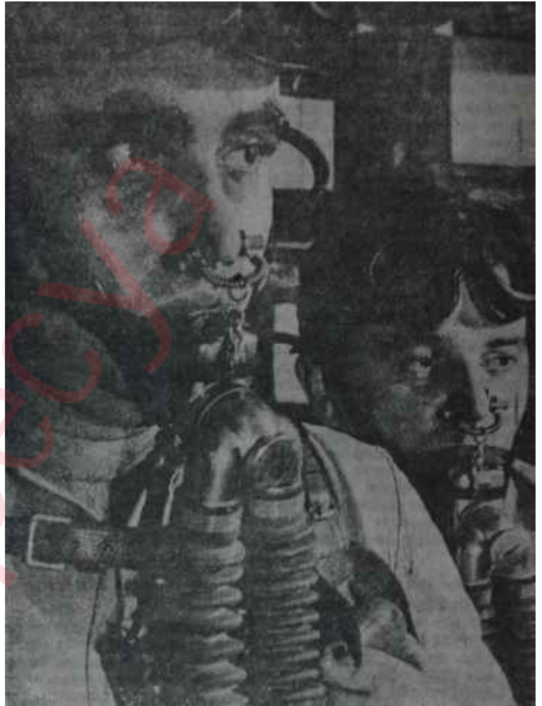
Bir maden tahlisiye ekibi çalışıyor

Türkiyenin bu yeni ihraç maddesinin, yabancı memleketlere işçi gönderilmesinin istikbali her şeye rağmen çok parlak görünmektedir. Bir defa işçilerimiz muazzam çoğunluklarıyla çok müsbet tesir bırakmışlardır ve yabancı işverenler türk işçi kullanmaktan hem memnundurlar, hem de bunu aramaktadırlar. Çalışma Bakanlığı ve Maliye Bakanlığı işin tadını almış oldukları için elbirliğiyle bu sahayı işletmeye ça-