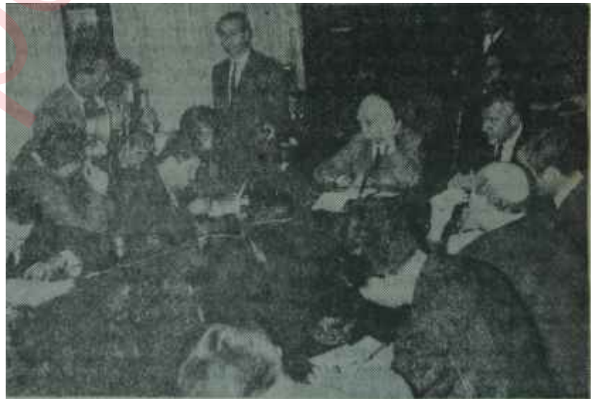
Başbakan İnönü basın toplantısında Müdavele-i efkar

Bu hususta çeşitli rivayetler ileri sürülmekte ve Parlâmento koridorlarında kulaktan kulağa. Başbakan'a yakınları tarafından, Vuralın yirmi gün önce partisinden istifa ettiğinin söylendiği fısıldanmaktadır. Ancak fısıltılar ve hattâ gerçek ne olursa olsun, CHP'nin arkasındaki bağımsızlar grubunun desteği hayli zayıflamıştır. Güven oyunu Grupta karara bağlayamayan YTP hin ise bundan böyle CHP