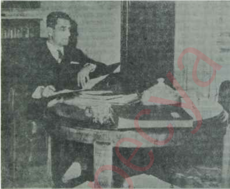
Sağlık Bakanı Demir odasında

İşte bu deneyler, ekonomistlerin ellerinde tuttukları bir teorinin pratik sahaya geçişini ve toplumu hedef tutan bir meselelerin kişinin doğrudan doğruya kendi meselesi olmasını sağladı ve bu yönden güç kazandı.