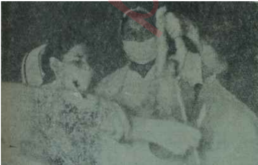
Doğum yapıldıktan sonra bebek, doktorun elinde

T.B.M.M. gündemine gelirken, Ankarada düzenlenen bir seminerde orantamı yoklama görevini yerine getirdi. Konuşmacılar haricinde her istiyenin katılıp konuştuğu bu seminerde, 1964 Türkiyesinde, doğum kontrolü ortamının tam mânasile hazır olduğu meydana-