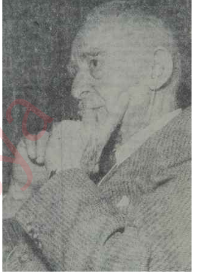
Başbakan İnönü konuşuyor ve düşünüyor İki el bir baş içindir!