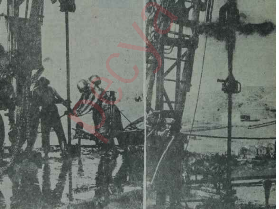
Çelikle fıskıran petrol ve bir petrol kuyusu Yerin, altındaki servet

miktarı 613 bin 650 tona yükselmiş, rafine edilen miktar ise 568 bin 286 tona balığ olmuştur. Henüz kati neticeler alınmamasına rağmen, 1964 yılı istihsalinin 700 bin tonu rahatça asacağı ve bu miktarın tamamına yakın kısmının ise Batman Rafineri Tesislerinde tasfiye edileceği tahmin edilmektedir. 1965 yılında ise istihsalin 1 milyon tonu aşması beklenmektedir.