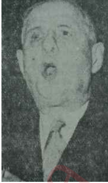
General De Gaulle Kızdırmaya gelmez!

Krutçef böyle bir konferansın toplanmasını isterken, ortaya, tarih olarak bu yılın 15 Aralıkını sürmüştü. Fakat eski Sovyet lideri, bu tarih yaklaşımadan koltuğundan oluvermiştir. Eski Başbakan işbaşından uzaklaştırılır uzaklaştırılmaz, bütün yorumcular, bu toplantı teklifinin âkibeti üzerinde düşünmeye koyulmuşlar ve toplantının yapıp yapılmayacağını tartışmaya başlamışlardır. Krutçefin işbaşından uzaklaştırılmasının yeniden stalinciliğe dönüş olmadığını duyurmaya, büyük önem veren yeni Sovyet idarecileri, Doğu Avrupadaki komünist partileri ferahlatmak için Krutçefin "barış içinde birlikte yaşama" ve "komünist blok içinde her komünist partiye davranış hürlüğü" politikasını devam ettireceklerini bildirirken, bu toplantıyı da benimsemek zorunda kalmışlardır. Bununla beraber, komünist partiler arasındaki