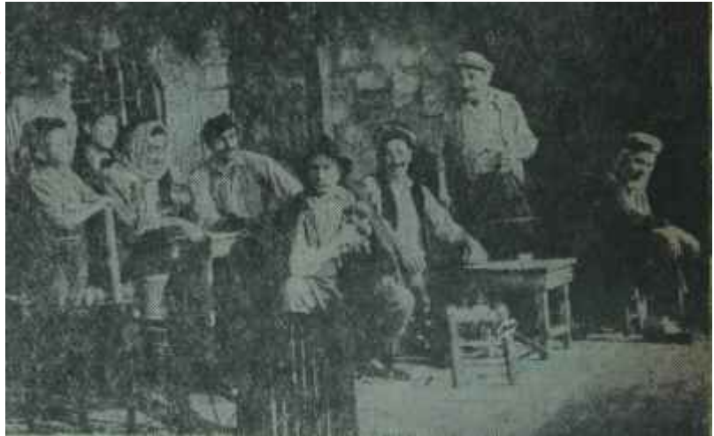
Tepebaşı Tiyatrosunda "Topuzlu" Topuz gibi oyun