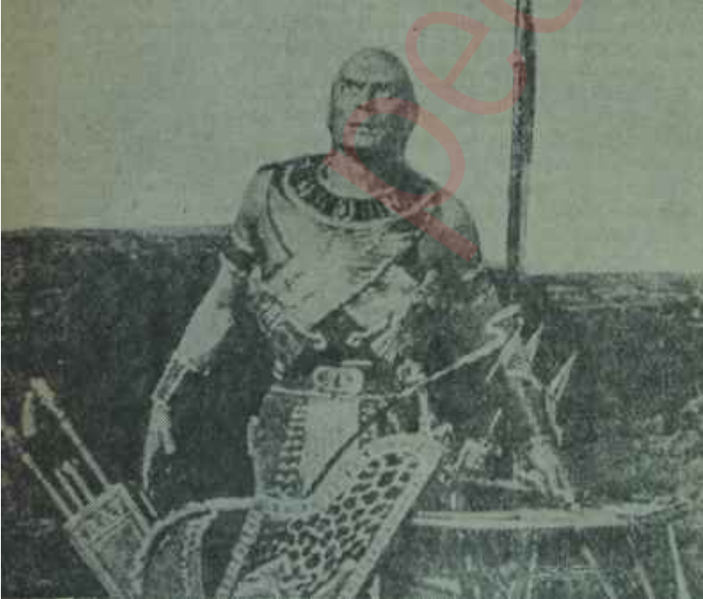
Yul Brynner "On Emir" de Savrulan dövüzcikler!.

De Mille, savaştan yeteri kadar çıkar sağladıktan başka savaş sonrasında da kendine sömürecek konular buldu. Savaş toplumlarda çeşitli sosyal değişimleri hazırlamış, düşünce ve inanışlarda ilerici gelişmeler olmuştu. De Mille, bu defa evlilik, kurumu, cinsel ayrışma ve kadın erkek ilişkilerini filmlerine konu edindi. Bu rada şunu da belirtmek gerektir : De Mille, farkında olmadan çağma ve çağının toplumsal yaşayışına ayna tutuyor, sinema yoluyla günün gerçeklerini gün ışığına çıkarıyordu. Ana soylu bir sanatçı olmaması yüzünden bu gerçekler çokluk sinemanın uydurma gerçeklerine adapte ediliyordu ve gerçek, gerçeklikten çıkmaktaydı. De Mille, filmlerine kahraman olarak belli bir sınıfın belli yaştaki kişileri seçmişti. Bunlar, evlilik kurumunu kendilerine göre düzenliyorlar, aşkı kendilerine göre yorumluyorlar, yine kendilerine göre bir görgü kuralı uyguluyorlardı. Da Mille de yasak aşkı işler ve seyircisine. verirken, yine elinden geldiği kadar gözaboyayıcı bir tutumu sürdürüyordu. Bir süre sonra, kadın dernekleri, din adanları ve ahlaki korumakla görevli çeşitli kuruluşlar, De Müle'in