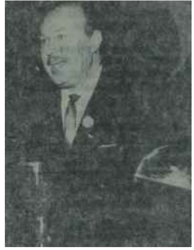
İdareciler Kongresine katılanlar ve İçişleri Bakanı Öztrak