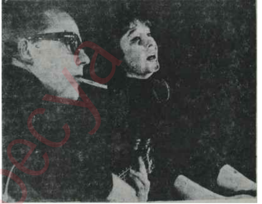
Behrend ile Belina

Geçen haftanın sonunda Cumartesi günü yılın ilk Üniversite ve Halk