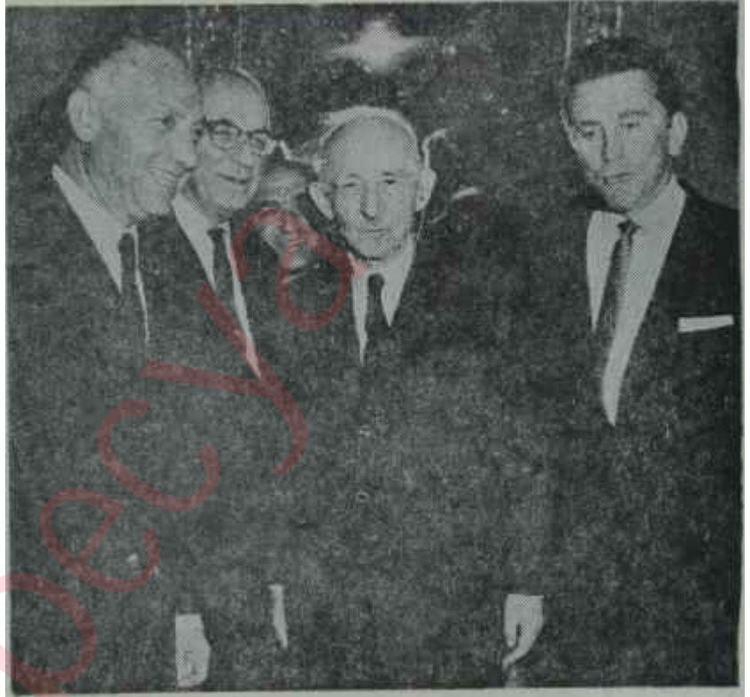
Kirk Douglas İstanbulda Başbakan İsmet İnönüyle birlikte

İstanbulda dört gün kaldı. Çarşamba günü geç vakit uçaktan indiğinde kendisini, bir hayli hayran, sinema ve amerikalisever karşıladılar. Douglas, başka ülkelerde daha sıkı ve daha yürek hoplatan karşılamalara alışkın olmalıydı ki, Yeşilköydeki az sayıda inşanı görünce önce hafif tertip bozuldu, fakat bunu gizlemeğe çalıştı. Ancak gazeteciler, Douglas'la bizdeki "bir politikacı arasında hemen bir benzerlik Kurdular. Zira Douglas, uçaktan iner inmez, hemen karşılayıcılarının üzerine yürüyerek, kendisini tanışın tanıma sınavına önüne çıkanın elini sıkmağa başlamıştı. Sonra Şeref salonuna alındı.