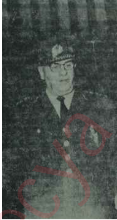
Cevdet Sunay Ordunun sesi

Daha sonra, İnönünün bir çok teşhisi M.B.K. zamanında ve 1961'den bu yana doğru çıkmıştır. Af yaygaralarının huzursuzluğa yol açacağını İnönü söylemiş, bu huzursuzluk belirmiştir. Bayarın ilk tahliyesindeki taşkınlıkların hiç kimseye fayda vermeyeceğini İnönü söylemiş, bu taşkınlıklar hiç