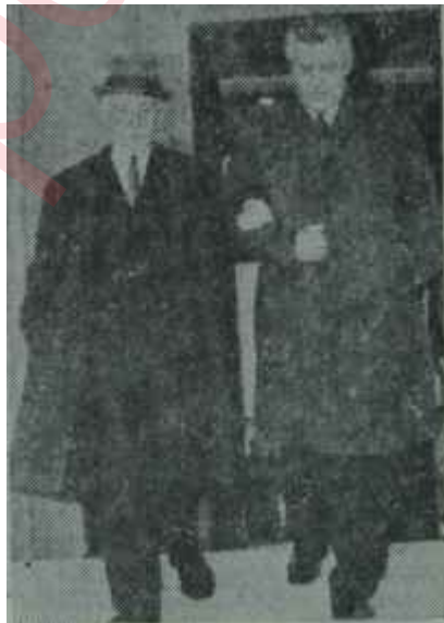
İnönü ve Satır

"— Sizin hakkınızda da 1962 yılında hazırlanmış bir dosya mevcut. Böyle