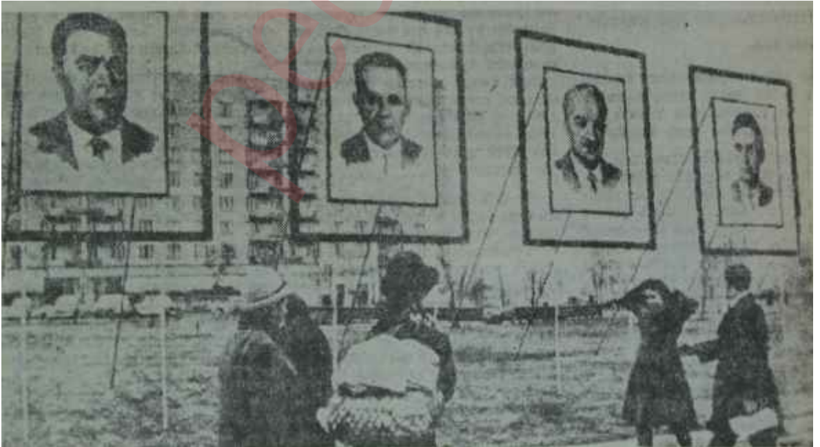
Sovyet büyüklerinin Moskova sokaklarındaki resimleri Asil kuvvetli olan partidir.

Gromiko zaman zaman müdahaleler yapmaktan geri kalmadı. Bunlar daha ziyade zemin yoklaması ve niyetlere, doğru teşhis koymak hedefini güdüyordu. Meselâ, Sovyetler Birliğinde milletlerin bir arada, federasyon şeklinde yaşamaları konutunda "Ama, sosyalist bir sistem içinde.." müdahalesini yaptı, Erkin kendisine gerekli cevabı bulup vermekte güçlük çekmedi. Daha sonra, Türkiyenin jet uçağı göndermesi, bombardıman etmesi, askerî tehditler ileri sürmesi de Gromika tarafından "dış müdahale" olarak vasıflandırılmak istendi. Erkin o bahsi de başarıyla kapamaydı bildi, Gromukoya şunu sordu: "Eğer bir yerde ruslar başkaları tarafından imha edilmek istenilirse Sovyetler Birliği ne yapar?"