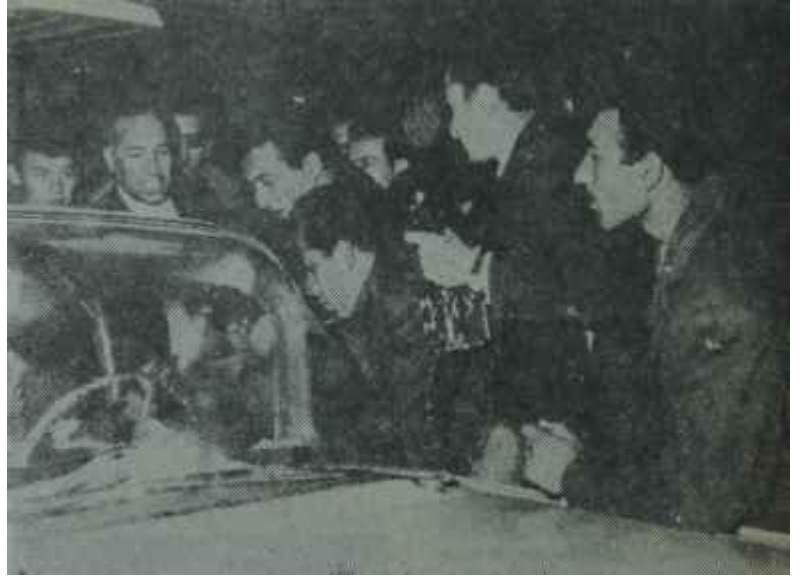
Bayarın otomobili Ankarada gazetecilerin arasında Akıl başa devşirilince

Cumhurbaşkanının yetkisiyle affedilenler de bu tashih-i karar düşüncesini destekleyeceklerdir. Her ne kadar, cezaevlerinden çıkanların hemen hemen hepsi "Siyaset mi? Allah göstermesin, Allah yazdıysa boz sun!" demekte iseler de, AP'nin yeni formülü ve sloganı bir yerden sonra böyle diyenlerin hepsinin de işine gelmektedir. AP kurmayı, Demirelin di-