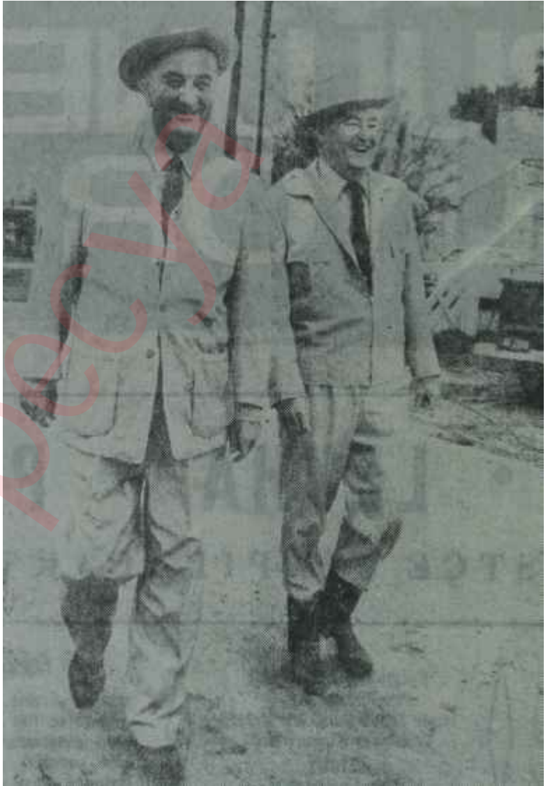
Lyndon Johnson seçimi kazandıktan sonra yardımcısı ile "Hello Cowboy"

Demokrat Partinin durumuna gelince; Başkan Johnson'm, amerikan halkından aldığı kayıtsız şartsız desteği hangi yönde kullanacağı henüz bilinmemektedir. İşin doğrusu, bu desteği de kendi görüşlerinin çekiciliğinden veya kişiliğinin kuvvetinden değil, Goldwaterin beceriksizliği yüzünden kazanmış bulunmaktadır; Şimdi Kongredeki büyük çoğunluk da kendi tarafında olduğuna göre, vakit ge-