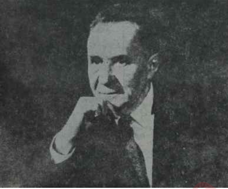
Aleksis Kosigin İp kimin elinde ?

Gramiko buna : "— Oo, o zaman çok fena olur.." diye cevap verdi.