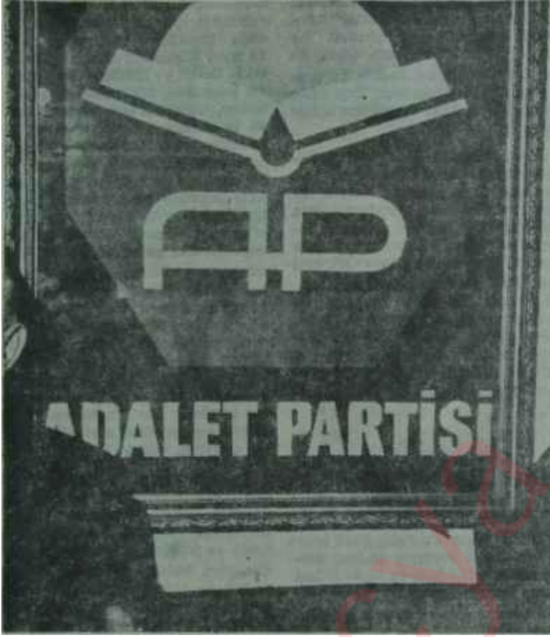
A.P.'nin arması Dipsiz kile, boş ambar

eğildi - Bilgiç için, "onun üstün vasfı iyi bir partici, iyi bir teşkilâtçı olmasıdır" denilmektedir. Devlet adamı olarak hemşehrisinden daha ağır bastığı ileri sürülen Süleyman Demirelin konuşması, daha çok iktisadi meselelerle ilgili oldu. Tekin Arıburun ise ortada bir konuşma yaptı. Alkışların çoğunu Bilgiç ile Demirel topladılar.