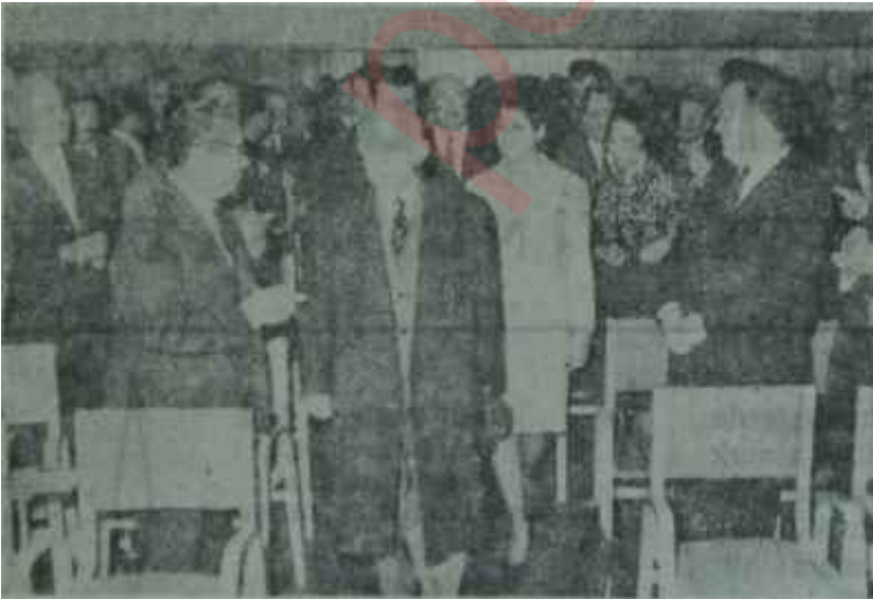
İnönü Kızılırmak havzasının sulaması ile ilgili toplantıda Hedef: Planlı kalkınma

İkibuçuk yıldanberi çalışıldığı hâlde birtürlü bitirilemeyen ve daha bir süre devam edeceği ileri sürülen bu çalışmalar nihai sayılmamalıdır. Daha aynı havzanın plânlama çalışmaları, ondan sonra da ortaya çıkacak verimli projelerin "fizibilillte raporları" düzenlenecek ve ancak bunların tamam oluşundan sonra yatırımlara gidilebilecektir. Bu kadar çeşitli işlerin bu kadar uzun sürmesi gerçeği karşısında Devlet Su İşlerinin daha geçen yıl birkaç milyon dolar karşılığında plânlama projesi düzenlenmesi işlerini amerikan firmalarına ihale ettiğini bilenler bu yönden idarecilere hak vermekte gecikmediler. Çünkü eğer Devlet Su İşlerine kalsaydı belki 50 yılda eldeki 26 havzanın etüdlüğünün bitirilmesi mümkün olmayacaktı.