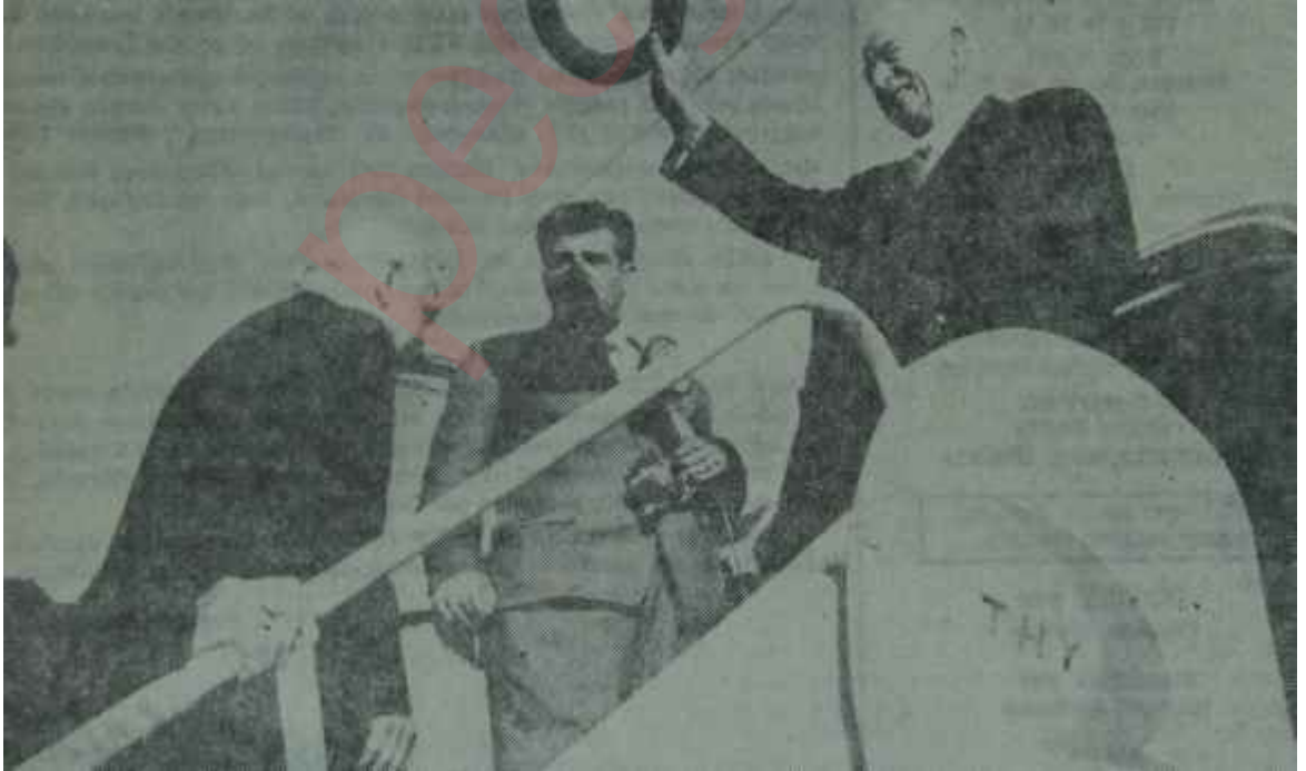
Başbakan İnönü Muş - Tatvan yolunu açmağa gidiyor

Kısa bir süre önce üç devlet - Türkiye, İran, Pakistan - arasında temelleri atılmış olan işbirliğinin gerçekleşmesinde ulaştırma açısından büyük faydası olacağı sanılan bu yolun geri kalan kısmı önümüzdeki iki yıl içinde bitirilecektir. Bunun için gerekli finansman kaynakları sağlanmış bulunmaktadır..