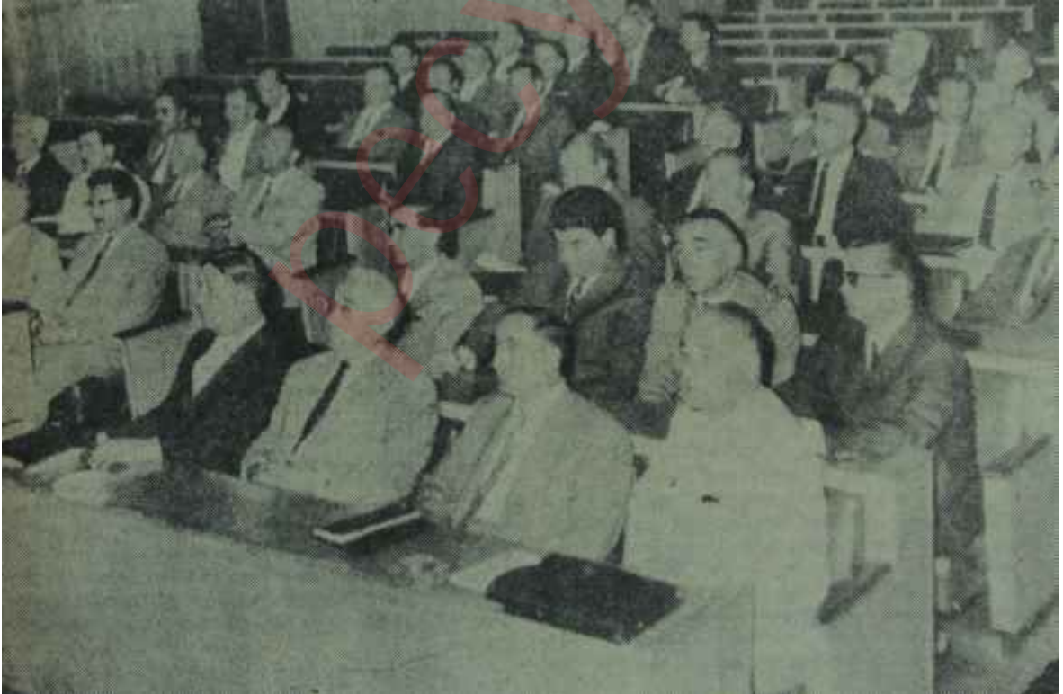
AP'liler Grup toplantısında

Ana Muhalefet Partisinin dramı Kasım başında Mecliste kendisini gös-