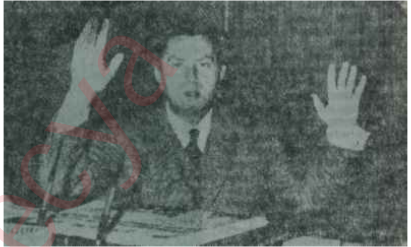
Turhan Kapanlı Akıl için yol birdir

temle çıkan sonuçlar daha âdil olmaktadır. Barajlı Dhont sistemine göre 158 milletvekili alan AP bu sisteme göre 152 milletvekili çıkartmakta ve 6 milletvekili kaybetmektedir. 173 milletvekili çıkarmış olan CHP'nin ise bu sistem ile kaybı 6 milletvekili olmakta ve milletvekili sayısı 167'ye düşmektedir. Tabloda da görüldüğü gibi Milli Bakiyeler sistemi, küçük partileri korumakta, daha doğru ifadeyle, haklarını iade etmektedir. Bu sistemle CKMP'nin 9, YTP'nin ise 3 milletvekili kazancı olmaktadır. Burada dikkati çeken bir nokta da Milli Bakiyeler Sisteminin CKMP ile YTP arasındaki bir eşitsizliği tasfiye etmiş olmasıdır. 1961 seçiminde CKMP YTP'den daha fazla oy aldığı halde 11 tane daha az milletveki-