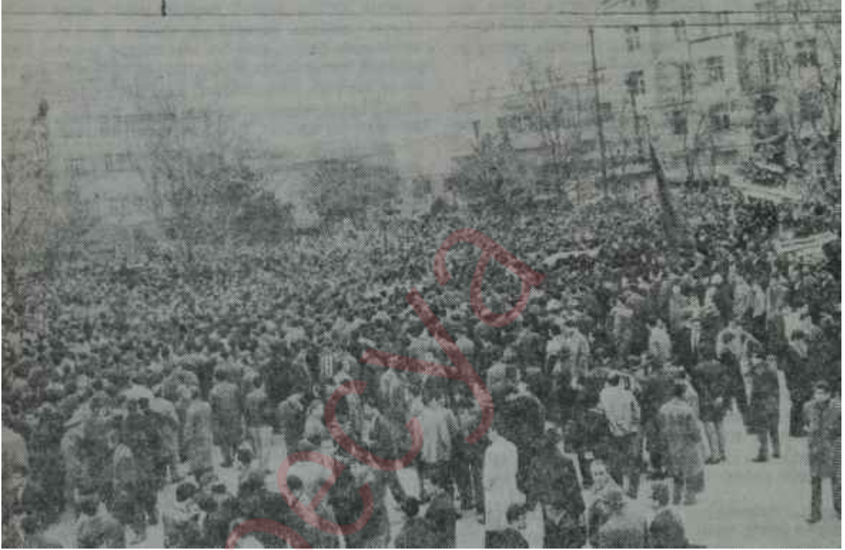
Bir seçim mitingi