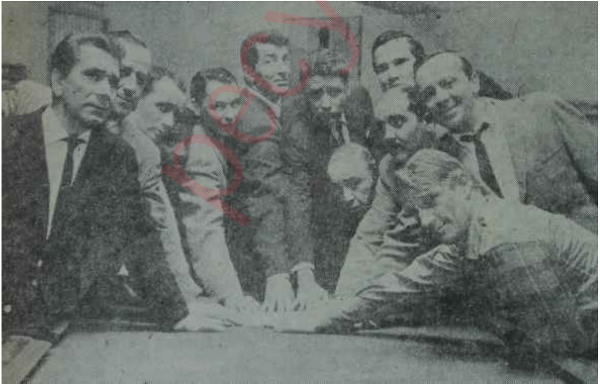
Conte, Sinetra, Martin, Davis Jr. ve Lawford "Soyuncular" da "Eski askerler ölmezler"

Milestone, daha sonraki filmlerinde "Batı Cephesinde Yeni Birşey Yok" kadar başarıya erişemedi ama, her filmde bu çizgi dışına çıkmadı. Çıkmamağa da çaba gösterdi. Çeşitli ara filmlerinden sonra, bu defa yeni bir yazar ve yeni bir romanla seyirci karşısına çıktı; John Steinbeck ve romanı "Of Mice And Men - Fareler ve İnsanlar'.., Milestone, Remarque'ın savaş içindeki insanlarına çok ben. zeyen Steinbeck'in savaş dışı ve yine küçük insanların serüvenlerini yalın, içten ve en az "Batı Cephesinde Yeni Birşey Yok" kadar ustalıkla anlatıyordu. Başrollerini Lon Chaney Jr ile Burges Meredith'in paylaştıkları "Fareler ve İnsanlar", Milestone'un Hollywood sinemasındaki yerini daha da pekiştirdi. Fakat olaylar İkinci Dünya Savaşım doğurmuş, sinema, savaşın propagandasına adanmıştı. Hollywood, iki çeşit film imal ediyordu. Birinci tür filmler, düzmece kahramanların akıl almaz savaş serüvenleriydi Moral eğitimi sınıfının bu filmlerinde kahramanlar hârikalar yaratıyorlar, mitolojiye yaraşır olaylara girip çıkıyorlar ve seyircileri savaşa alkış tutmağa zorluyorlardı. İkincileri