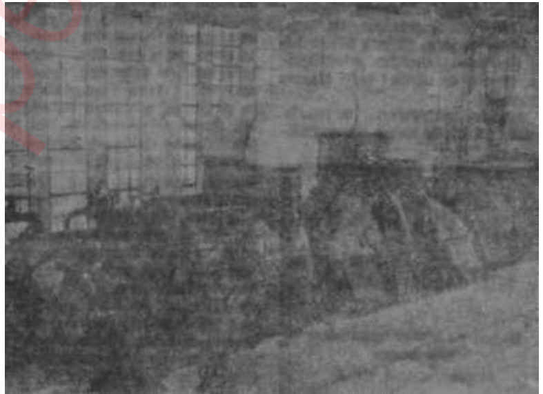
Silâhtarğa elektrik santralında turbinler Anlaşılmaz bir olay

İstihsal, nakliyat ve İETT de çalışan personelin gelir vergilerinin ödenmemesi yüzünden birikmiş olan borç 27 Mayıs 1960'dan önceki dönem aittir. 27 Mayıs 1960 günü yapılan tesbitte 18 milyon 6 2 8 bin 648 lira 60 kuruş olarak bulunan borç tutarına" d i n 1 milyon 301 bin 75 lira 83 "kuruşu ödenebilmiş ve borç ancak o düzeye indirilmiştir. Çeşitli sebeplerle 300 milyon civarında borcu bulunan ve bu yüzden mali sıkıntı çeken