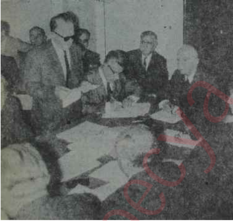
Yeni C.H.P. Meclisi ilk toplantısında "Besmeleyle başladık işe"

Satır ve iki yardımcısı önümüzde- ki günlerde yeni bir çalışma progra- mı hazırlıyarak. Kasım ayı içinde to- lanacak olan Parti Meclisine sunacak- lardır. Muhtemelen CHP'yi seçimlere kadar götürecektir olan bu ekip, en a- zından genel seçimlerin bütün mesu- liyetini omuzlarına almış bulunmak tadır