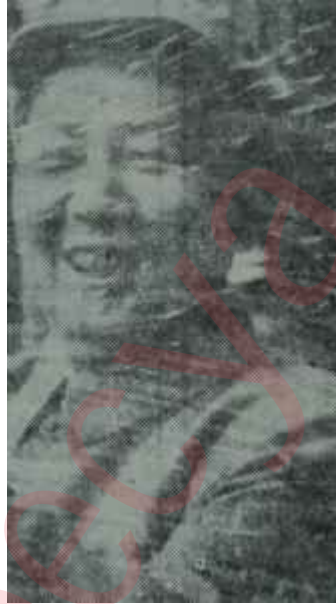
MaoÇe-tung Bombası patladı

Komünist Çinin bu amacım Asyadaki komşularının sezmemesi imkânsızdı. Nitekim, Pekinin ilk atom denemesi yaptığı haberi, en çok bunları korkutmuştur, Hint Başbakanı Şastri, bu konuda duyduğu endişeyi gizlemekten çekinmemiş, Komünist Çin idarecilerini bu denemeleri derhal dur-