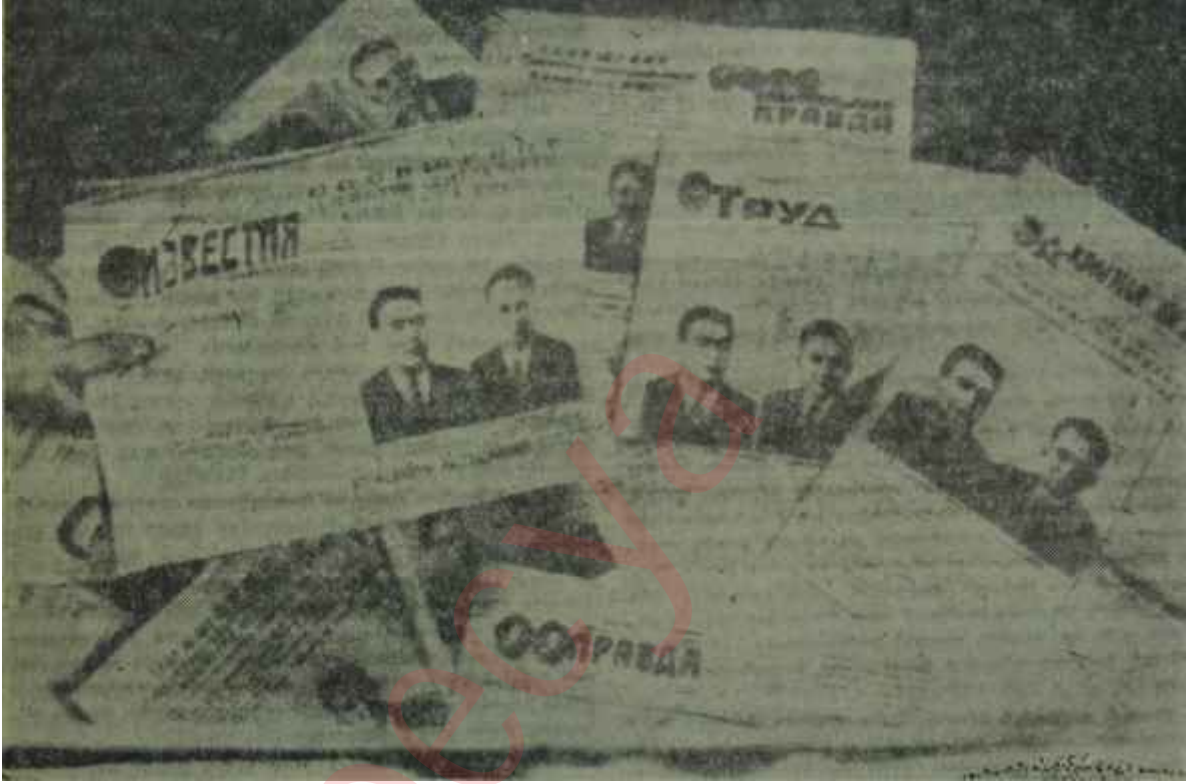
Sovyetler Birliğindeki değişiklikten sonra gazetelerin durumu