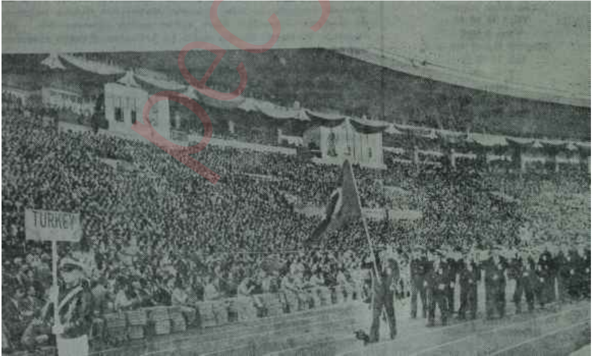
Tokyo Olimpiyatlarında türk ekibi

Birkaç yllandanberi devam etmekte olan bu zincirleme