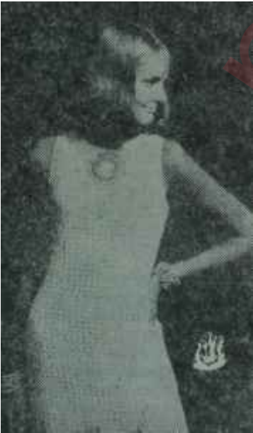
Beyaz örgü modası Ucuza gelen şıklık

Giyimli örgü elbiseler ve örgü takımlar ince yünlerden, dantel işi olarak yapılmıştır. Renk siyah veya beyazdır. Vücudu iyice saran incecik delikli, uzun, siyah bir sveter, siyah düz bir etek üzerine giyildiği takdirde, bu yıl rahatça dansa gidebilecek hem de bütün gözleri üzerine çekecektir. Gine ince siyah yünden yapılmış, önu