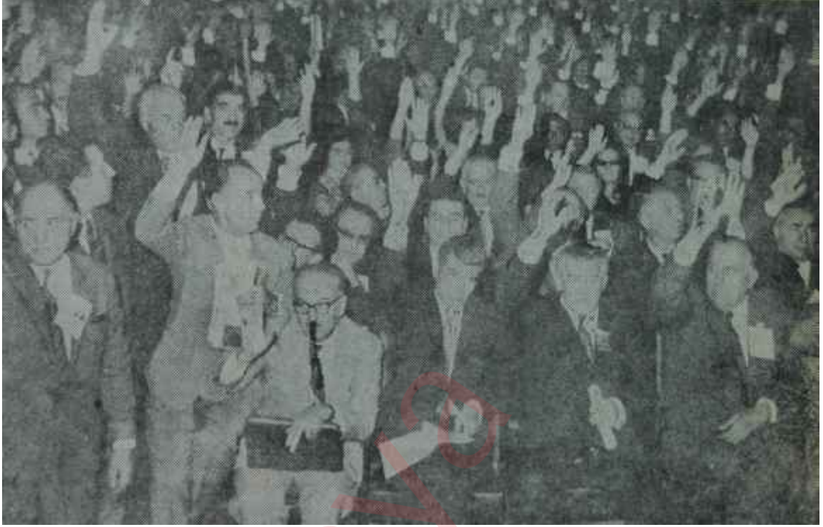
C.H.P. 17. Kurultayı toplantı halinde Gözler üstünde