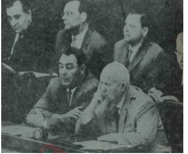
Nikita Krutçef iktidarda, olduğu günlerde yardımcısı Brejnef ile Dost kazığı

Krutçef, 1961 Haziranında da Kennedy ile Viyanada buluşmuştur.