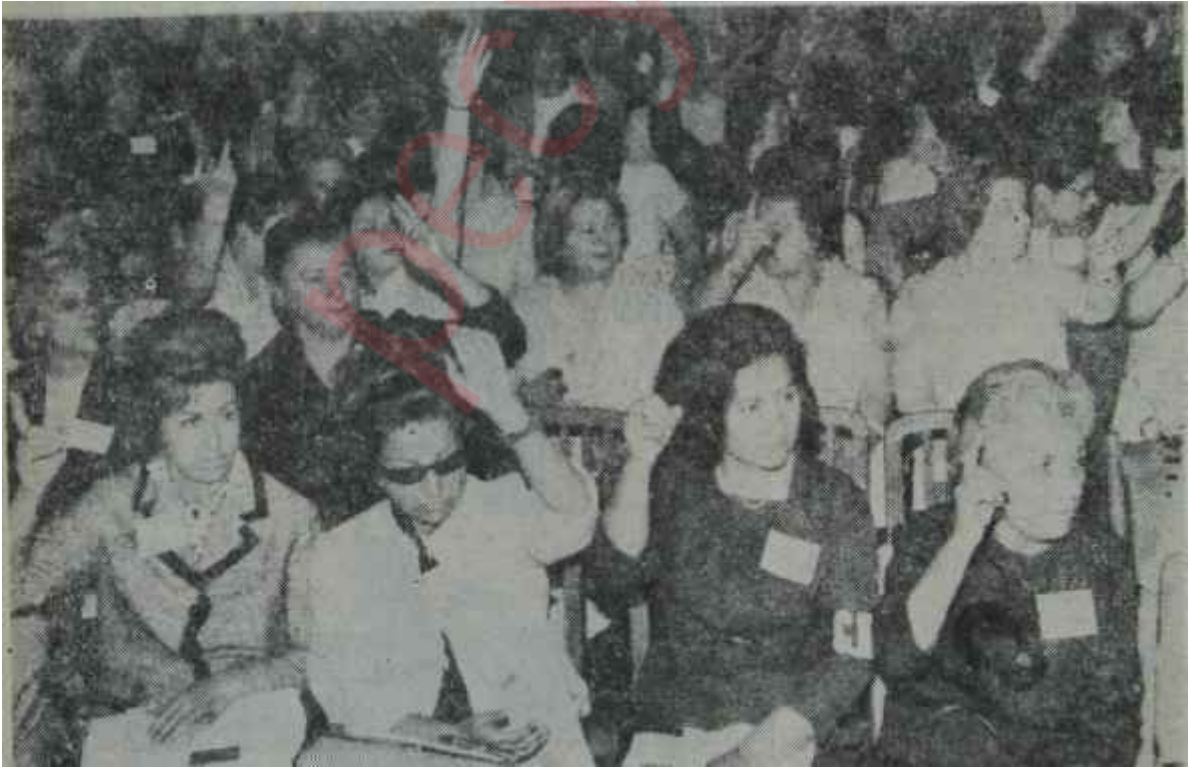
CHP Kadın Kolları Kurultayı Kadın politikaya girince...

Büyük Kurultayın kabul ettiği 36. maddeye göre. Gençlik ve Kadın Kolları teşkilâtlarının tamamlandığı ve kongrelerinin yapıldığı her parti kademesinde, bağlı buldukları ilçe ve il yönetin kurulları ile Parti Meclisinde birer tiye ile ilâveten temsil edilirler. Bu temsil, ana kademe kongresinde seçim yolu ile olur. Fakat bu 36. madde birçok şekillerde yorumlanmış ve bazı aksaklıkları görülmüştü. Ka-