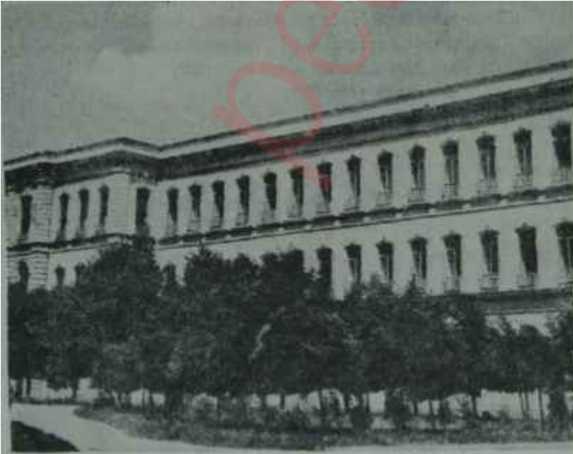
İstanbul Üniversitesi binası