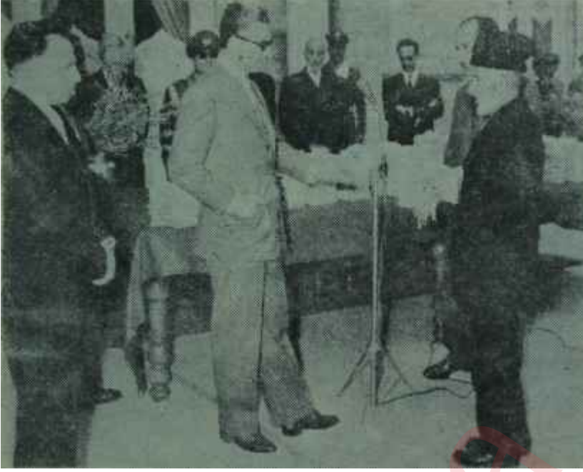
Şehinşah İranlı köylülere tapularını dağıtıyor