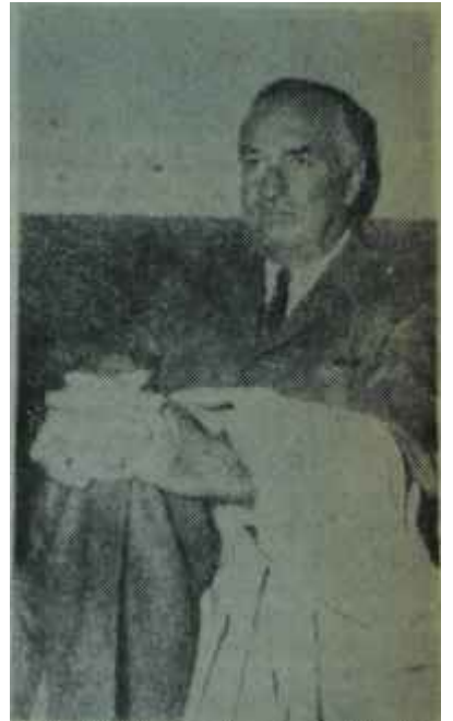
Arabulucu Piazza Allah yanını görür...

Kahirede toplanan tarafsız devletler liderleri, geçen haftanın sonunda bir bildiri yayınlayarak çeşitli meseleler üzerindeki görüşlerini açıkladıkları zaman, bu bildiri de Kıbrıs meselesine temas edecekleri de bilinmiyor değildi. Fakat doğrusunu söylemek: gerekirse, akli başında hiç kimse, tarafsız devletler liderlerinin bir politikacı Papazın oyununa gelip, gerçekle hiçbir ilgisi olmayan dilekleri sürececeklerini sanmamıştı. Yayınlanan bildiri de, bütün ülkelerin Kıbrısın bağımsızlığına ve toprak bütünlüğüne saygı göstermesi gerektiği söyleniyor, Kıbrıs halkına siyasi geleceğini tayin etme hakkı tanınması isteniyordu. Aslında, Ada rumlarının bugünkü davranışları karşısında, bunlar birbirleriyle tabantabana aykırı iki dilek olmaktan öteye gidemiyordu. Gerçekte, Türkiye'nin istediği de Kıbrısın bağımsızlığına ve toprak bütünlüğüne saygıdan başka bir şey değildi. Bu bağımsızlık ve toprak bütünlüğü Kıbrıs Cumhuriyeti kurulurken imzalanmış andlaşmalar ve hazırlanmış aynaya ile milletlerarası teminat al-