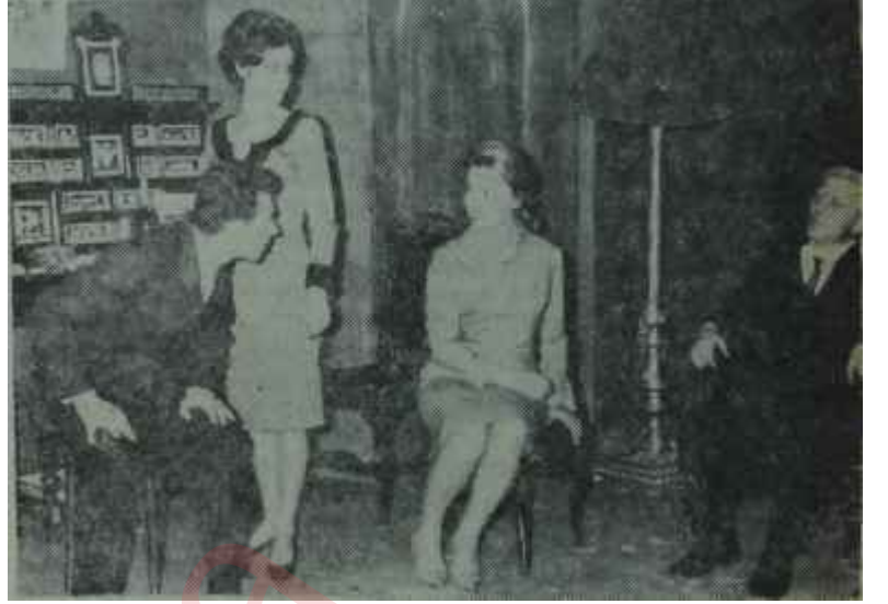
Oraloğlu Tiyatrosunda "Altona Mahpusları"

Oyun : "Altona Mahpusları" ("Les Sggestrgrs d'Altona").