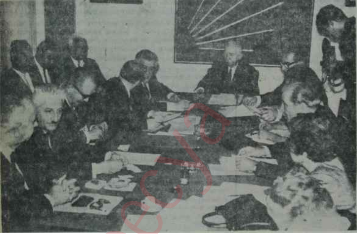
C.H.P. Meclisi Kurultay hazırlığında Millete hesap verme zamanı