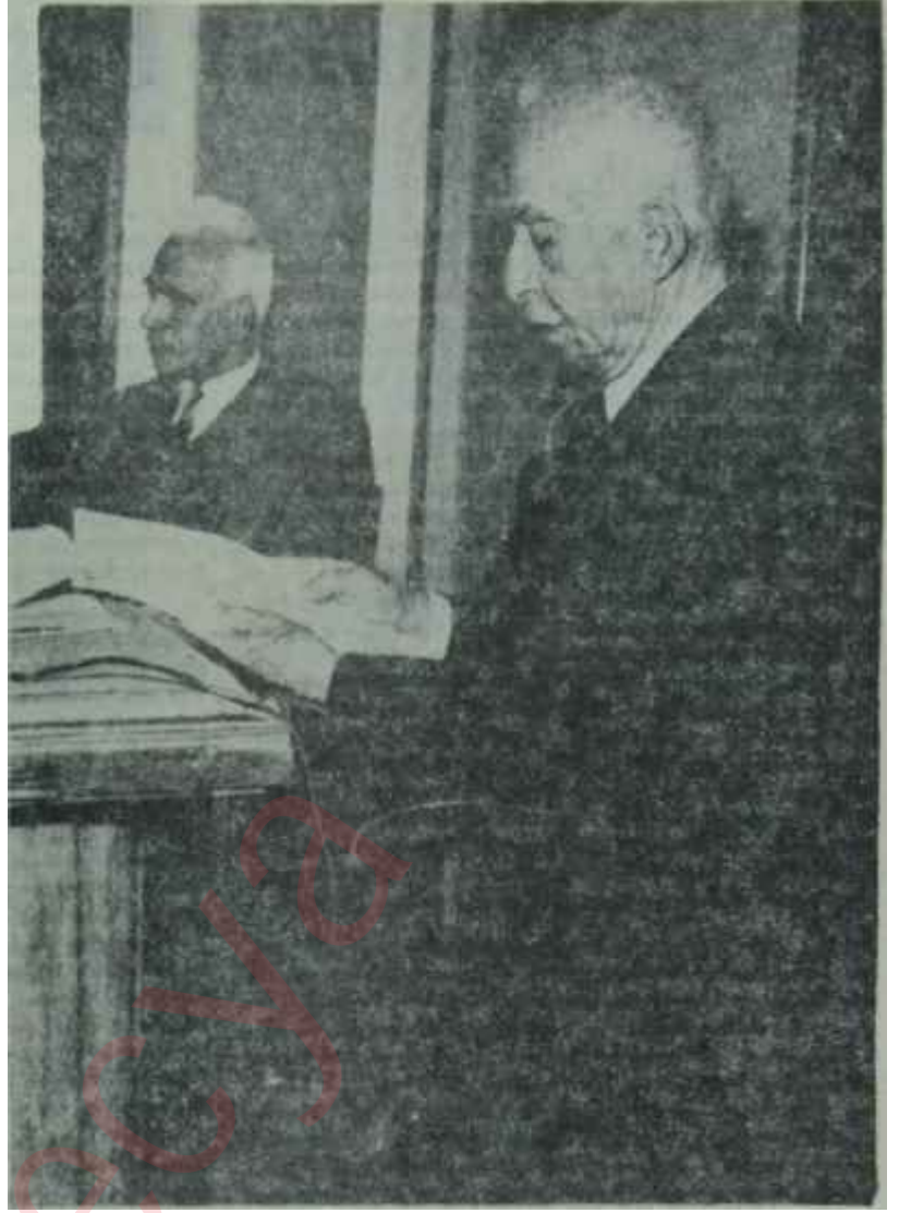
C.H.P. Genel Başkanı İnönü C.H.P. Meclisinde

Bu espriyi hemen benimsiyenleri" çoğunluğunu, bu haftanın sonlarında Cuma günü yapılacak olan CHP Büyük Kurultayına katılmak üzere Ankara'ya toplandı. Başlayan teşkilât delegeleri teşkil etmektedir. Otel salonlarında, politikacılarca pek sevilen Bulvar kahvelerinde. Genel Merkez koridorlarında birbirleriyle dertleşen delegeler, nabız yoklamak amacıyla, gülümseyerek sözü bu espriye getirmekte sonra da içlerini dökmektedirler. Delegelerin şikayetlerinin hedefi çok defa Genel Merkez olmakta ve Partinin üst kade-