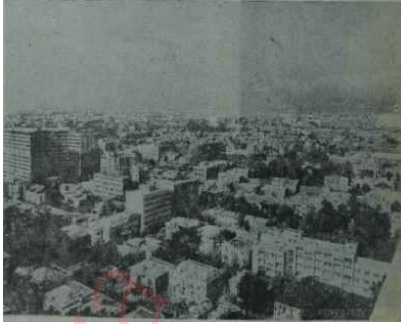
Tahranın genel görünüşü

Bugün İran, belki de modern tarihinde ikinci defadır ki bir yol kavşagında bulunuyor. 1925 yıllarındaki reform hareketlerine, bizim Atatürkümüzün büyük dostu Rıza Şah başlamıştır. Rıza Şahın çok şey yaptığını inkâr etmek imkânı yoktur. İranın ve İranlının dış görünüşünü değiştiren odur ve genç İran kuşaklarına yeni u-