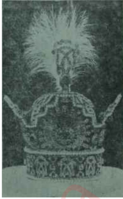
Şehinşahın tacı Onun da ölçüsü var

Nitekim bu prensiplerden altı tanesini Şah referandumdan geçirerek bugünkü İranın millî politikası haline getirmeye muvaffak olmuştur "Taht ihtilâli" adı verilen ihtilâl, işte bu harekettir.