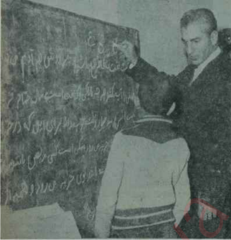
Şah öğretim seferberliğinde Başöğretmen

getirmişlerdir. Bu, bir nevi kulüptür. Meselâ İngilteredeki Fabian'lar gibi bir şey.. 30-35 üyeye başlayan hareket üç sene sonra 300 üyeye sahip olmuştur. Hem de üyeler çok titiz şekilde seçildikleri halde... Sonra, Referandum arzulanan neticeyi verdiğin de ve Meclis seçimlerine gidildiğinde bu Birliğin çok üyesi' Adaylığını koymuştur. Meclis teşekkül edince "İlerici Birlik" bir siyasî parti haline gelmek saatinin çaldığını anlamıştır Bu saatin çalınmasında. Şahın başlıca rolü oynadığını herkes bilmektedir, "İlerici Birlik" bunun üzerine "İran Novin Parti = Yeni İran Partisi" oluşturmuştur Mansur bu partiyi» Genel Sekreteri, yani lideri seçilmiştir.