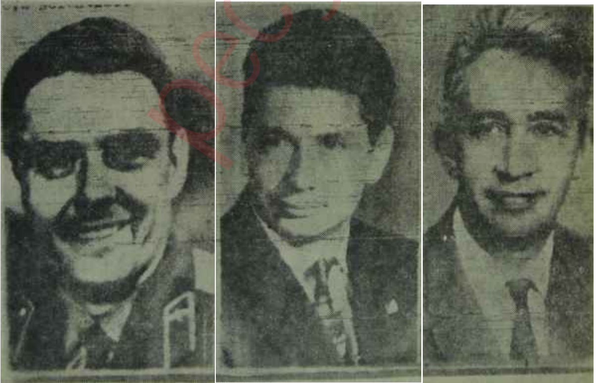
Fezaya giden üç sovyet kozmonotunun uçuştan az önceki resimleri

Bu arada dikkati çeken başka bir nokta daha vardı: Sovyetler Birliği tarafsız devletler .1961 yılında Belgratta ilk toplantılarını yaptıkları zaman, seri halinde, çekirdekli bomba denemelerini yürütmüştü. Uzaya üç kişilik bir kapsül yollaması da, eğer garip bir tesadüf değilse, ikinci Tarafsızlar konferansının sona erdiği güne rastlıyordu. Üstelik, bu konferansta tarafsız devletleri en çok düşündüren konulardan, biri de, Komünist Çin'in yapmak üzere olduğu söylenen atom denemeleriydi. Anlaşılan, Moskova, her-