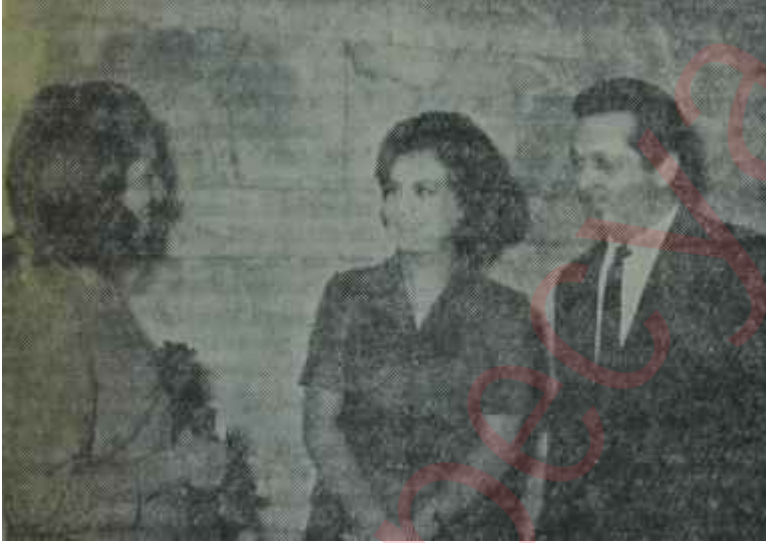
Meydan Sahnesinde galada davetliler Neşelerini bulanlar

Geçen hafta Perşembe akşamı, 'Golf Kulüpte caz ve dans vardı, fakat her zamanki kadar bile kalabalık yoktu. Sadece birkaç masa doluydu, onlar da kendi aralarında epeyce eğlendiler ve dansettiler. Bir hariciyecisi ile gelmiş