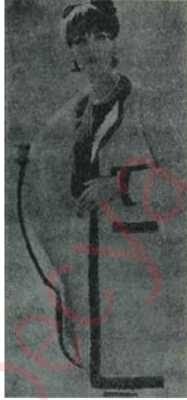
Değişmeyen Chanel Yılın modası

«— Eskiden biz, parti binasının önünden geçemzedik. Çünkü parti bi-