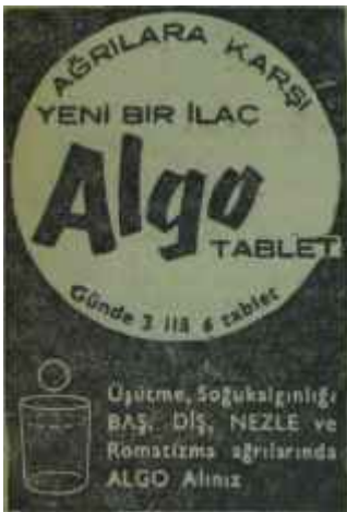
(AKİS — 1200)

Bu programda bir-iki yıldır, yayın hataları, ama genellikle küçük ve önemsiz hatalar açıklanmakta, dinleyici mektuplarına cevap verilmekteydi Radyo İdaresi ilk defadır ki muhtar bir idare olduğunu belirtiyor, meselâ Meclis Başkanına karşı bir tavır takınmaktan çekinmiyor •bağımsızlığını apaçık savunuyor, ilân ediyordu. Radyo İdaresi ilk defadır ki 10 milyonu aşan dinleyicisine, Radyoyu ağır şekilde tenkit eden bir yazıyı duyuruyordu. Sözcü, "Gerçi çeşitli imkânsızlıklardan söz açılabilir, mazeretler ileri sürülebilir ama, radyo dinleyici.