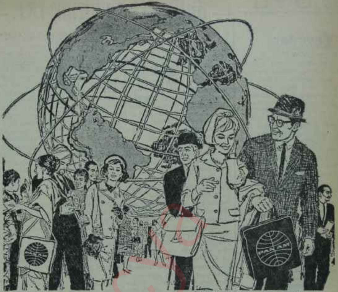
Herhalde New York Dünya Fuarı 22 Şubat'ta açılır.