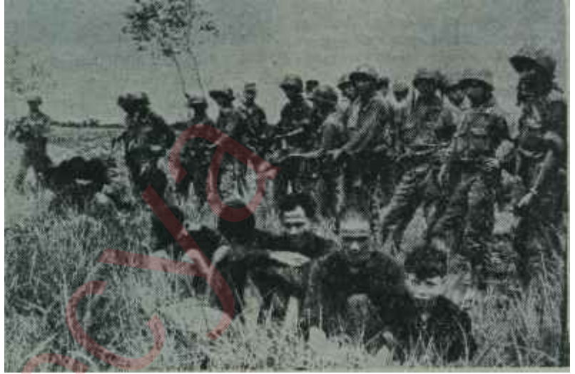
Vietnamlı askerler ve esirleri

mehtedir. Gerçi komünist çetecilerin yaptıkları da Güney Vietnamda büyük bir huzursuzluk kaynağıdır ama, bu fakir ülkede bunun yanında çok önemli başka huzursuzluk kaynakları da vardır. Bunların birincisi, Güney Vietnam ekonomisinin içler acısı durumudur. Yılları süren savaş, Vietnamlıların biraz olsun rahat nefes almalarına izin vermemektedir. İkincisi, Vietnam halkı arasındaki dini bölünme de ülkede devamlı olarak huzursuzluk yaratmaktadır. Önce Fransız idaresi altında sonra da Diem zamanında Vietnamın çoğunluğunu teş-