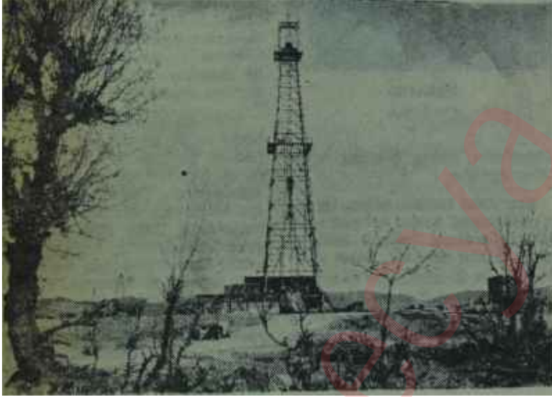
Bir petrol araması Yeni usullere doğru

Sismik metod denilen metodla son dağ ve diğer jeolojik araştırma metodlarının uygulanmasından önce yerin altındaki tabakaların derinliğine profilini ve bunun dağılışı şeklini meydana çıkarmaya ve âdetâ bir yeraltı haritası elde etmeye imkân vardır. Bu haritanın doğruluğu ve elde edilecek detayların inceliği, kullanılacak âletlerin mükemmelliği kadar, alman sonuçların iyi değerlendirilmesine dayanır. Adından da anlaşılacağı gibi, bunun için- yer yüzeyinde büyük bir titreşim dalgası suni yoldan meydana getirilmektedir. Bunun türlü yolları varsa da, en çok kullanılan yol, belirli derinliğe gömülmüş bir miktar dinamitin patlatılmasıdır. Diğer, yine