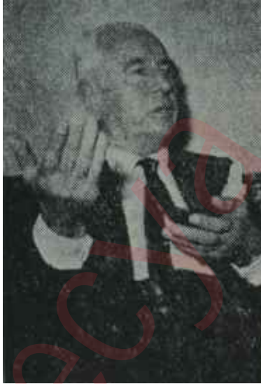
Ali Fuat Başgil

- "Eğer Başgil Büyük Kongreden önce Türkiye'ye gelir ve tevkif edilirse, bu kongre delegeleri üzerinde büyük propaganda olacak ve Genel Başkanlığa kolayca, bizi de Genel İdare Kuruluna sürükliyerek, seçilecektir 'Genel Başkan seçilmiş bir kimseyi de hapiste tutmak pek kolay değildir!'"