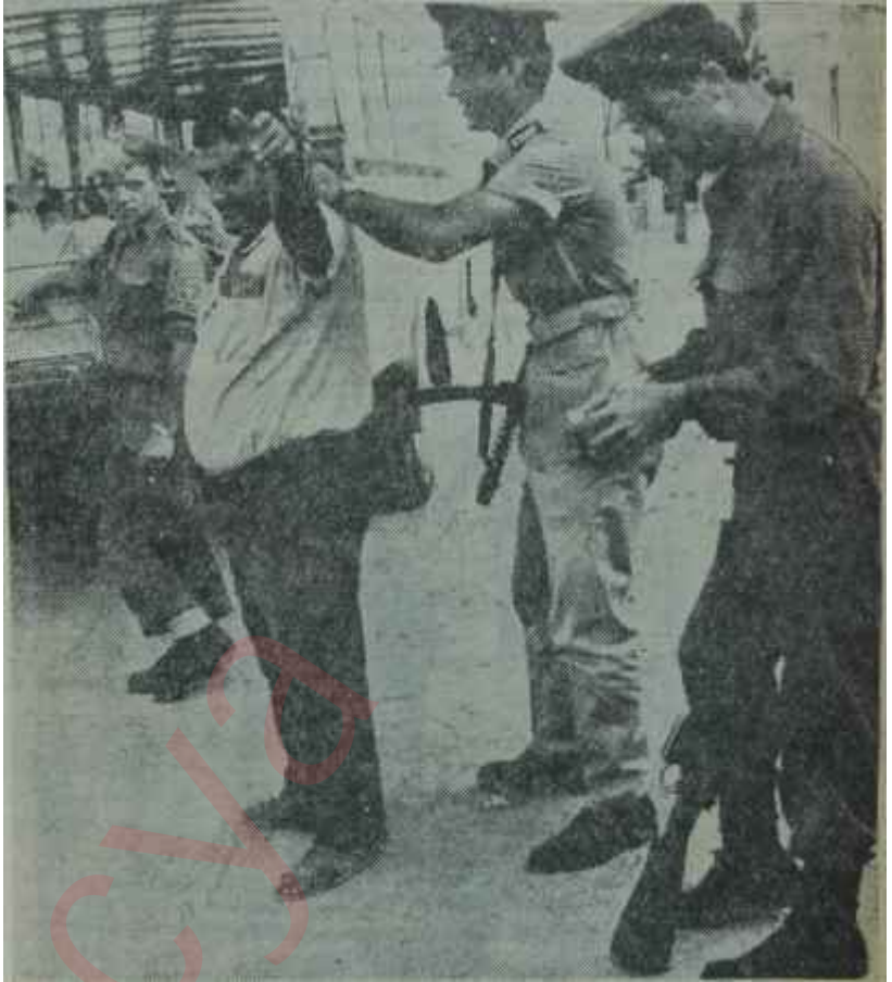
Rum polisi bir kamyonu ve şoförünü arıyor

Gerek Makarios ve gerek Papendreu için özellikle bu ikinci karar kelimenin tam anlamıyla bir sürpriz teşkil etti. İki kafadar İnönü'nün ilk açıklamasından sonra bunu bir dış müdahale olarak göstereceklerini ummuşlar ve böylece dünya kamu oyununda sempati kazanacaklarını hesaplamışlardı. Oysa bu inceleme kurulu, bütün hesaplarını bozuyordu. İçlerinde kendi temsilcilerinin de bulunduğu bir heyet Erenköye gider de orada açlık ve hastalıktan insanların öldüğüne dair bir rapora imzalarını koyar larsa bu, tam bir fiyasko olurdu. Ancak bütün "açlık yok" iddialarından sonra, inceleme kuruluna itiraz etmek te imkansızdı. Bu sebeple Yunanistan, meselesi. Güvenlik kurulunda ele a-