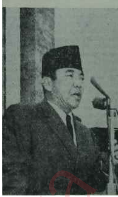
Sukarno Çileli baş

Bilindiği gibi Başkan Sukarno, Malezya Federasyonunun kurulduğu ilk günden başlayarak, bu devletin Uzak Doğudaki İngiliz emperyalizmini sürüp götürmek için zorla meydana getirilmiş bir devlet olduğunu ileri sürmüş ve Malezya Federasyonunun bir parçası olan Kuzey Borneoyu önünde sonunda Endonezyaya katacağını ilân etmişti. Bu sözüne uygun olarak, Endonezya Devlet Başkanı, geride bıraktığımız haftalar içinde Malezyaya karşı filli harekete geçmiş bulunmaktadır. Sukarno zaten şimdiye kadar da boş durmamış ve kendi adalarında yetiştirdiği çetecileri çoktan Kuzey Borneoya sokmuştu. Fakat şimdi işi daha da öteye götürmüş ve çetecileri Malaya yarımadasının göbeğine, Johore kesimine yollayacak kadar ileri gitmiştir. Hattı Endonezyanın teşvikiyle Singapurda da