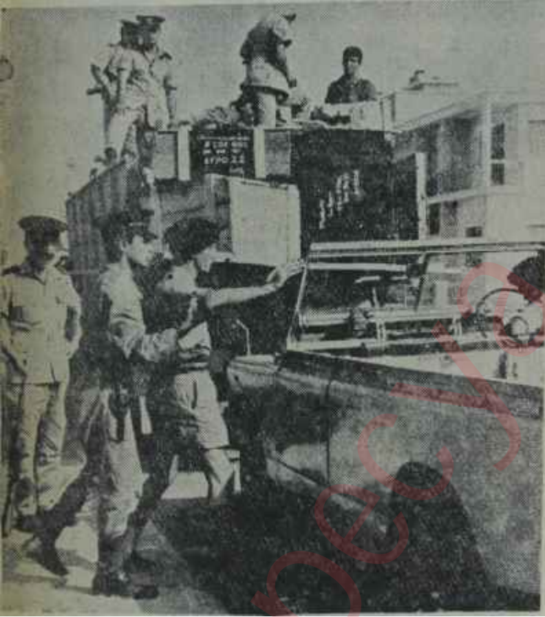
Kıbrısta rum polisi faaliyette

Bakanlardaki bu olağan dışı neşenin sebebi içeride alınmış olan bir kararla ilgilidir. Bu karara göre, Erenköye yardım götürecek olan motor Perşembe sabahı Magosa limanına varmış olacaktır. Ama meselenin