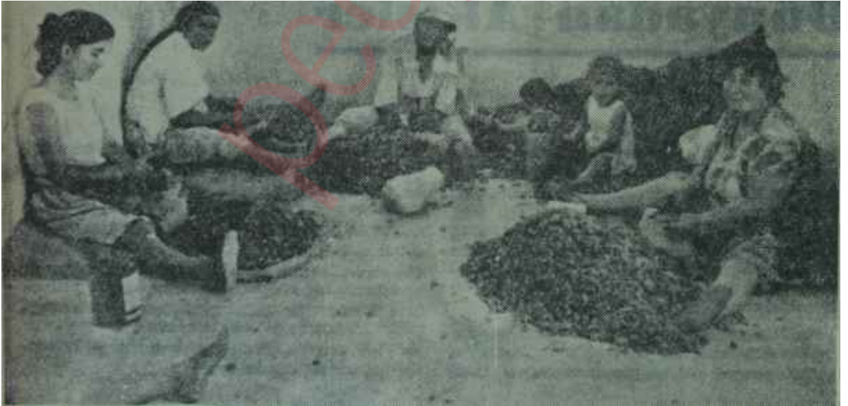
Kıbrısta abluka altında kadınlar çalışıyor

Gerçi önümüzdeki günlerde dik katiler başka bir sahaya çekilecektir.. Ama bunun da sebebi tam alaturka bir sebep olacaktır. Batılı meselelerle uğraşır, biz şahıslarla uğraşırız ya.. Şahıslarla uğraşmak merakımız bir kaç haftaya kadar şahikasına çıkacaktır. A.P. kendi Genel Başkanını seçecektir ve bir şahsî çekişme bütün gücüyle etrafı toza boğacaktır. C.H.P. de ise Kurultay vardır. Gerçi bu Kurultayın fazla hırslı geçmeyeceği tahmin edilebilir. Ama "Hükümette Re-