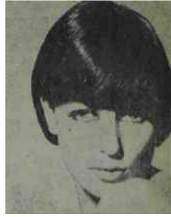
Kanatlı saç modası