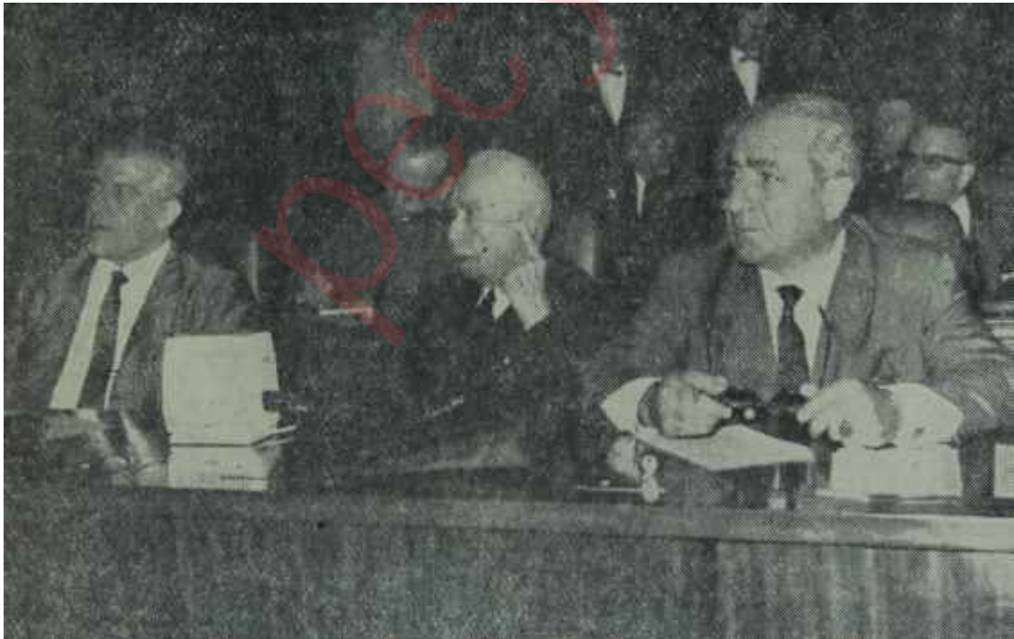
Başbakan İnönü ve yardımcıları müzakereleri takip ediyorlar