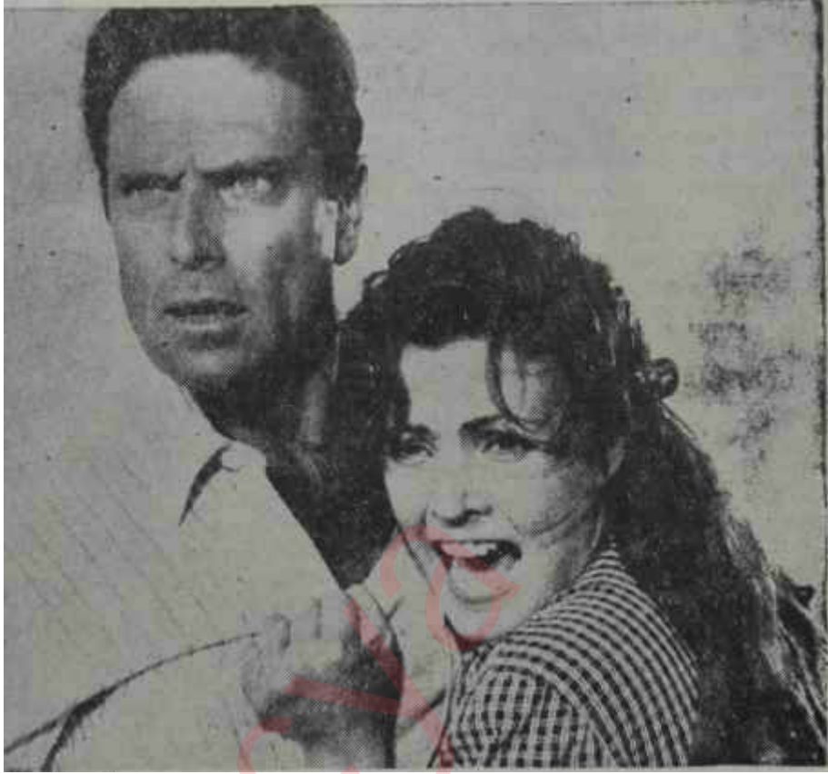
"Valonne ve Carmen Sevilla "İntikam" da