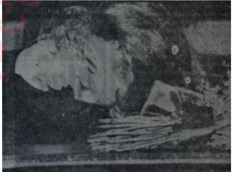
Goldwater eşi ile Talihin kudreti

Zencilere karşı reaksiyon, Amerikalının içindeki tek reaksiyon değildir. Amerikalı çok komplekse sahip bir insandır ve aslında bedbahttır. Dünya liderliği, omuzlarına fazla ağır gelmektedir. O kadar yardım yaptığı halde herkesin kendisini tenkit etmesine kırgındır. Komünizmden, mikrop-tan korkar gibi korkmaktadır ve onu bir umacı gözüyle görmekte -