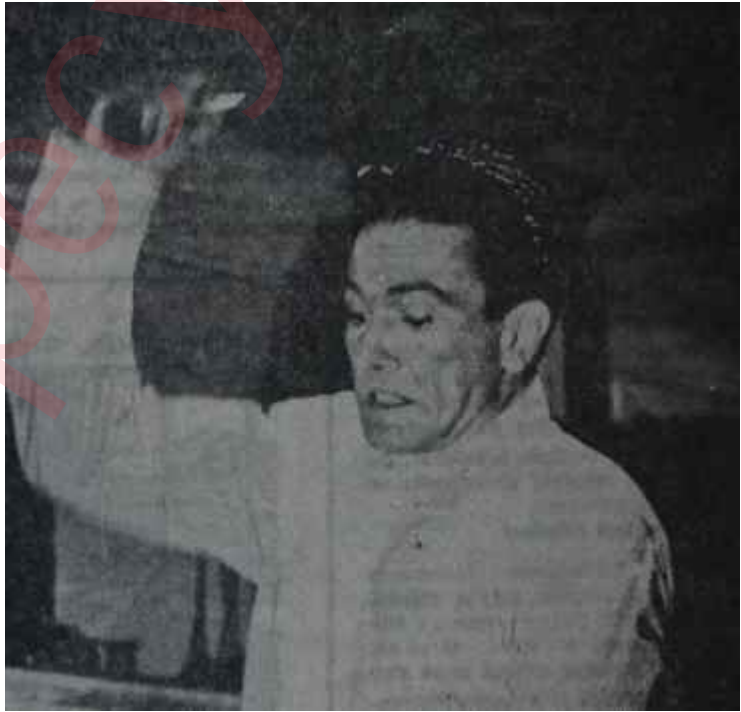
Albert Finney, Karel Reisz'in "Gece Bitecek"inde