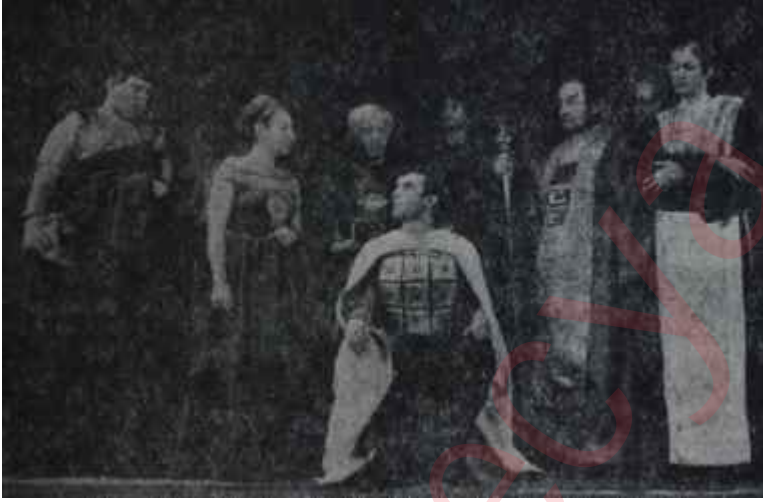
50. yıl jübilesinde "coriolanus" Kapalı tiyatrodan açikhavaya

— İstanbul Operası ile Şehir Orkestralarının Millî Eğitim Bakanlığına devri ve inşaatı bitmek üzere olan İstanbul Opera binasında faaliyete geçirilecek Devlet Tiyatro,