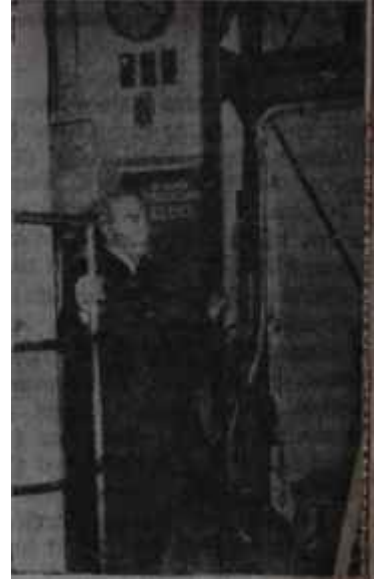
Muhsin Eruğrul Tohumu atan

Muhsin Ertuğrul 1927 de «Darülbedayi» adı altında toplanan ar-