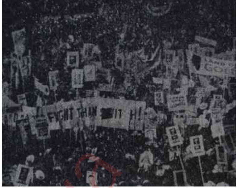
Goldwater taraftarlarının mitingi

Aşağıdaki yazı, bundan bir süre önce Amerikayı görmüş olan Başyazarımla Metin Toker tarafından kaleme alınmıştır. Metin Toker Amerikadan döndüğünde Cumhuriyetçilerin adayı olarak mutlaka Goldwater'in seçileceğini bildirmiş ve arkadaşlarına yarı lâtife, yarı ciddi "Amerikaya giderken ırk ayırımına hararetle karşıydım, dönüşte bunun hararetle bir taraftarım demıştır. Bu, aşağıdaki yomdan da sezileceği gibi, hadiseleri uzaktan ve teori sahasında değerlendirmekle içinden ve fiiliyat sahasında değerlendirmek arasındaki farkın bir neticesi" dir. O bakımdan, Amerikada cereyan eden son hadiselerin bir izahını Metin Tokerin kaleminden okumanın ilgi çekici olacağına inanıyoruz.