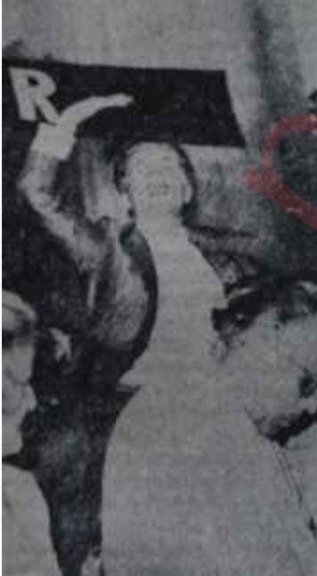
Beg omuzlarda Kahramanı

Yalçından sonra konuşanlar iki yol tutturmuşlardı. Birincisi, kulis için dışarıya dökülmüş kendi gruplarının propagandalarını rahatça yapmalarını sağlamak, ikincisi de doğrudan doğruya Eroğanı hedef alarak yayılm ateş açmak! Nitekim, durum öyle oldu. Konuşanların hepsi, partinin tek suçlusu Eroğanmış gib veritirdikçe veritirdiler ve söz sırası kendisine gelip Eroğan savunmaya geçince de salonu birerli ikişerli terkettiler. Öyle ki, başkanlık divanı da bu kargaşalığı