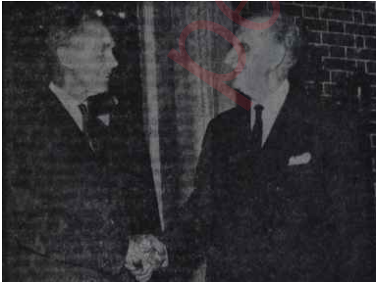
Papandreu ve Sir Alec pouglasHome Kolunu vermiş, alamıyor

Gene Makariosun Lefkoşeden ayrılmadan önce söylediğine göre, Kıbrıs anlaşmazlığı müzakere yolu ile çözülemez. Gerçekten, çetebaşı, Atinala yaptığı görüşmeler sırasında bu idasından bir türlü vazgeçmemiş ve Papanderuyu Birleşik Amerika ile İn-