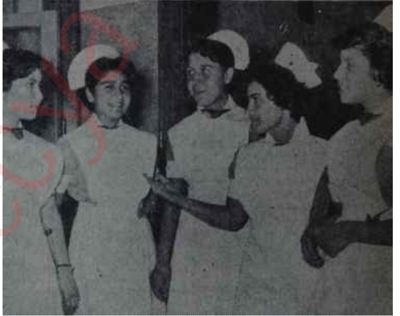
Hemşireler bir arada Mavi melekler