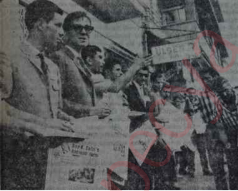
Basın-İşin grevçileri Akıll için yol birdir

«— Bu cümle, mevhum da olsa, bir grubu hedef tutmaktadır. Bunlar mahkeme kararı ile cevap hakkı elde ederlerse onları da konuşturmak gerekir. Bu yüzden cümlelerin ve daha bazı kısımların metinden çıkarılmasını istedim» demektedir. Doğrusu bu tarafsızlığa Öztrak'tan başka hiç kimsenin ekli ermemiştir.