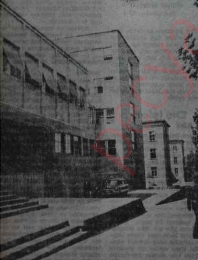
Dışişleri Bakanlığı binası

Bir neslin görev anlayışına göre merkezde çalışmak kızığa çekilmek demektir. Bunlar en şatafatlı etçikleri ele geçirmişlerdir içlerinde 17 yıldan beri fasılasız dış görevde bu-