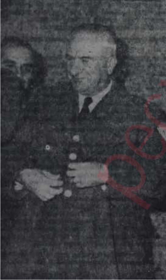
Orgeneral Cemal Tural