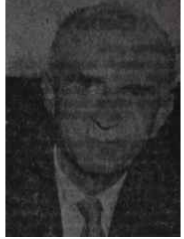
Papandreu Bir demagog

Kıbrıs konusunda önümüzdeki hafta beklenen en önemli gelişme de, hiç şüphesiz, başçeteci Makariosun Atina'ya yapacağı yolculuk olacaktır. Bu yolculuğun amacı, rum ağızlarına; gö-Makariosun Papandrunun yaptığı Amerika ve İngiltere temasları konusunda bilgi almasıdır. Fakat iki inat-