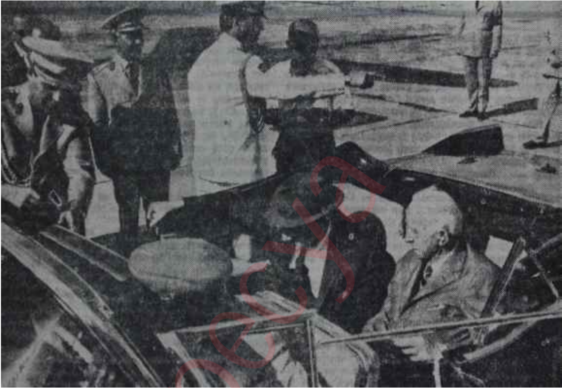
Cumhurbaşkanı Gürsel ve Başbakan İsmet İnönü