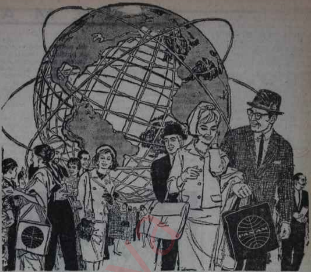
Yaklaşık New York Dünya Fuarı 23 Ağustos'ta açılıyor.