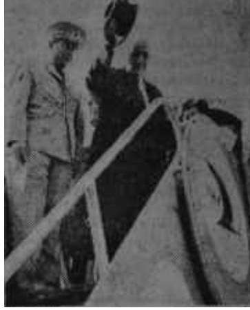
Gürsel uçakta Yeni adımlar

İstanbul Toplantısı siyasî tarafı hariç, bir tek kişiye baş ağrısı verdi. İstanbul Emniyet Müdürüne Şahın gittiği her memlekette oradaki iranlı öğrencilerin hareketi geçip Şah alevinde gösteri yapmaları adettir. İstanbuldaki iranlı öğrenciler de bunu unutmadılar. Şahın gelişinin arifesinde