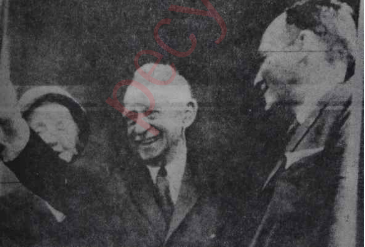
Türkiye Başbakanı İnönü Amerikada uçaktan inmezden önce Mümtaz bir devlet adamı

Beşinci olarak, İnönü, Başkan Johnson'la Dean Rusk'a Türk Hükümetinin Yunanistanla yapılacak ikili