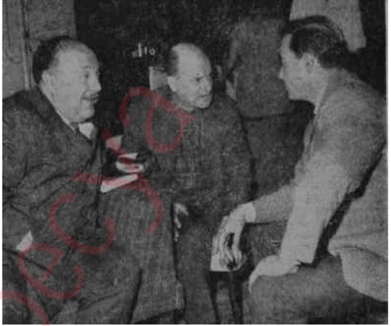
Ayhan Işık, bir filminin çevriminde

1962-63 ile 1963-64 sinema mevsiminde star sistemi en şiddetli devri-