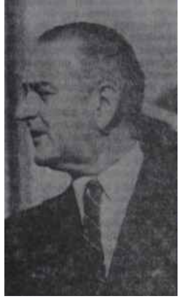
Kennedy - Johnson