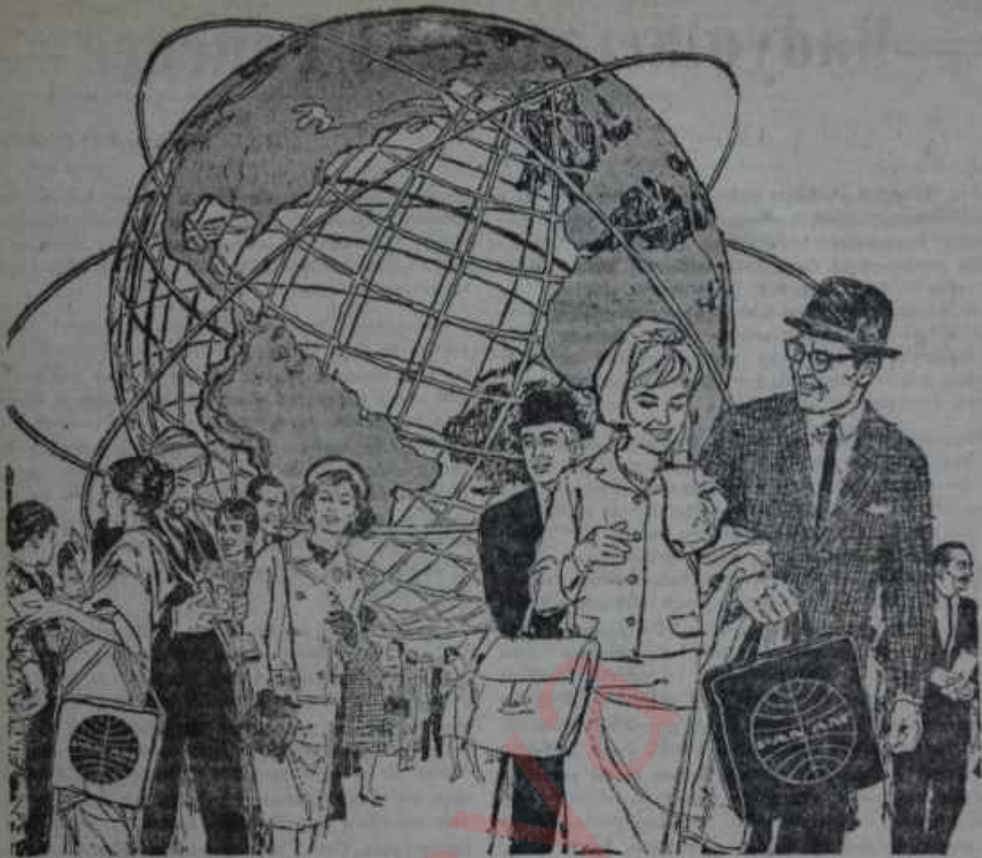
Halkın New York Dünya Fuarı 21 Haziran'da açılır.