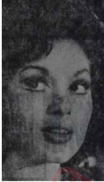
Türkân Şoray "Sultan Hanım"ımız!

Eski starlar, herşeyden önce fazla pahalıydılar. Stara ödenen para ile maliyet ansızın yükseliveriyor, buna