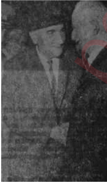
İnanönü ve Gürsel İki el bir baş içindir

Geride bıraktığımız haftanın son günü, güneşli deniz kıyılarında geçirdikleri bir hafta sonunu daha arkada bırakan milyonlarca amerikalının, altlarında arabaları, yanlarında karıları, çocukları ve köpekleri, evlerine dönmek üzere olduğu saatler, do, virginia eyaletindeki Langley hava üssüne dev bir tepkili yolcu uçađı indi. Üzerindeki yazılardan, bunun, Birleşik Amerika Devlet Başkanının üç özel uçađından biri okluğu anlaşılı-