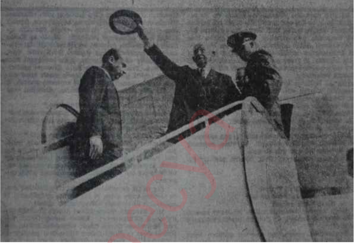
Başbakan İnönü Esenboğa Hava Alanında veda ediyor Amerika yolunda