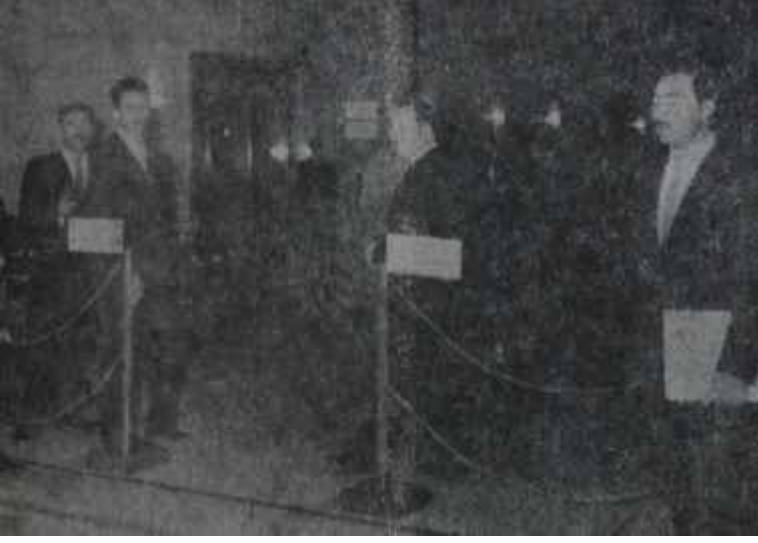
Mecliste A.P. kulisinin yapıldığı koridor Kaynayan kazan