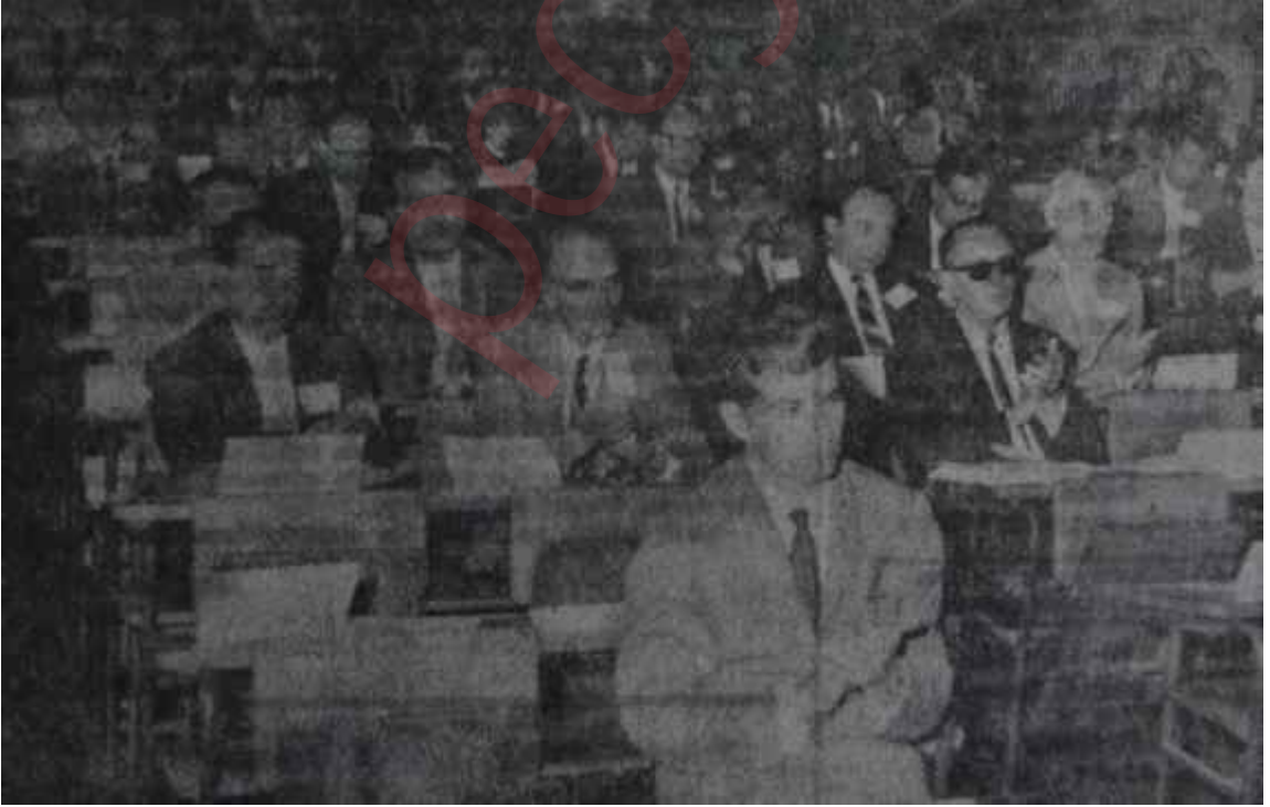
Turizm Danışma Kurulu toplantı halinde Tavuk mu yumurtadan çıkar, yumurta mı tavuktan

Öteyandan, bahsedile edile artık bir efsane haline gelmeye başlayan İzmir-Hayfa-Brindizi-Cenova feribot seferleri de nihayet geçen hafta başladı. Salı günü saat 10'da dünyanın en lüks feribotlarından Blue, İzmirde 750 bin lira harcanarak inşa edilmiş olan özel iskeleye yanaştı. Turizm ve Tanıtma Bakan Ali İhsan Göğüşün de katıldığı bir törenle karşılandı.