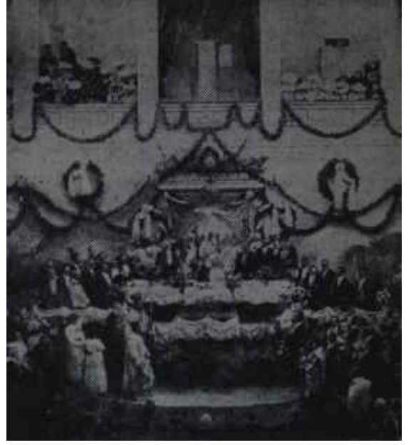
Venizelosun Kral Aleksandrı Venizelosun meclisinde yemin ediyor

Ama yunanlılar Kıbrısta bugün, buna karşı, 1919-20 yıllarında Anadoluda yaptıklarını yapmaktadırlar: İntikamlarını masum, silâhsız sivil halktan, kadın ve çocuklardan almaktadırlar.