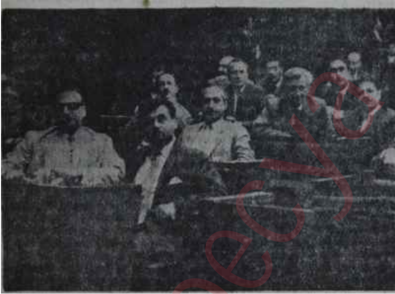
Güven oyu görüşmelerinde AP liler Kırmızılar

Ancak bunların milleti hiç anlamadıkları ve sistemi itibarsız kılacağı diye kendilerini itibarsız kıldıkları son tecrübeden ortaya çıkmıştır. Milletin küçük partileri kesin şekilde tasfiye etmesinin sebebi, bunların eline bir fırsat geçmişken bunu hiç kullanamamaları ve sadece menfi istikamette, bir rol oynamalarıdır. Bugünkü Meclisin küçük partileri kesin şekilde tasfiye etmesinin sebebi, bunların eline bir fırsat geçmişken bunu hiç kullanamamaları ve sadece menfi istikamette, bir rol oynamalarıdır. Bugünkü Meclisin küçük partileri kesin şekilde tasfiye etmesinin sebebi, bunların eline bir fırsat geçmişken bunu hiç kullanamamaları ve sadece menfi istikamette, bir rol oynamalarıdır.