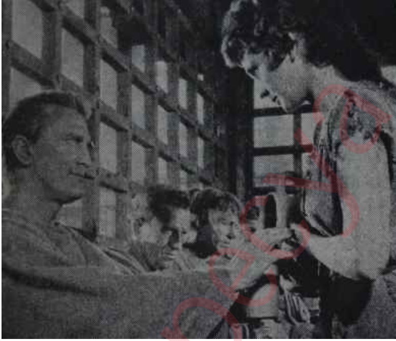
Kirk Douglas ile Jean Simons

Geçen yılın en önemli filmi, hiç şüphesiz italyan sinemasının en ilginç rejisörü Antonioni'nin "La Notte - Gece"sidir. Uluslararası Berlin Film Festivalinde Altın -Ayı armağanını ka-