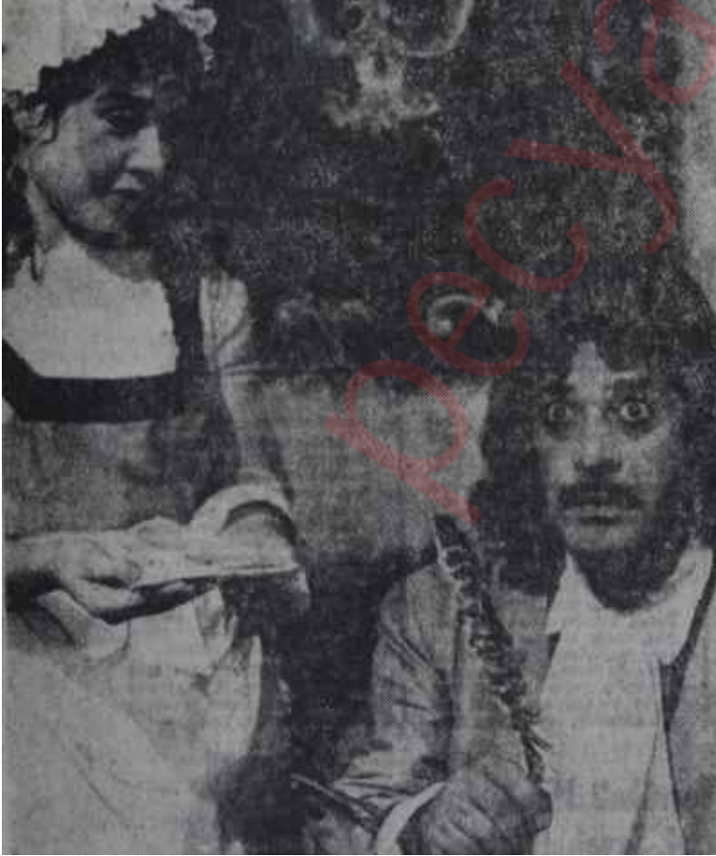
Arena Tiyatrosu Ankarada

Geçirdiğimiz hafta içinde Perşembe akşamı, Golf Kulüpte çocuk hastahanesi yararına bir yemek verildi.