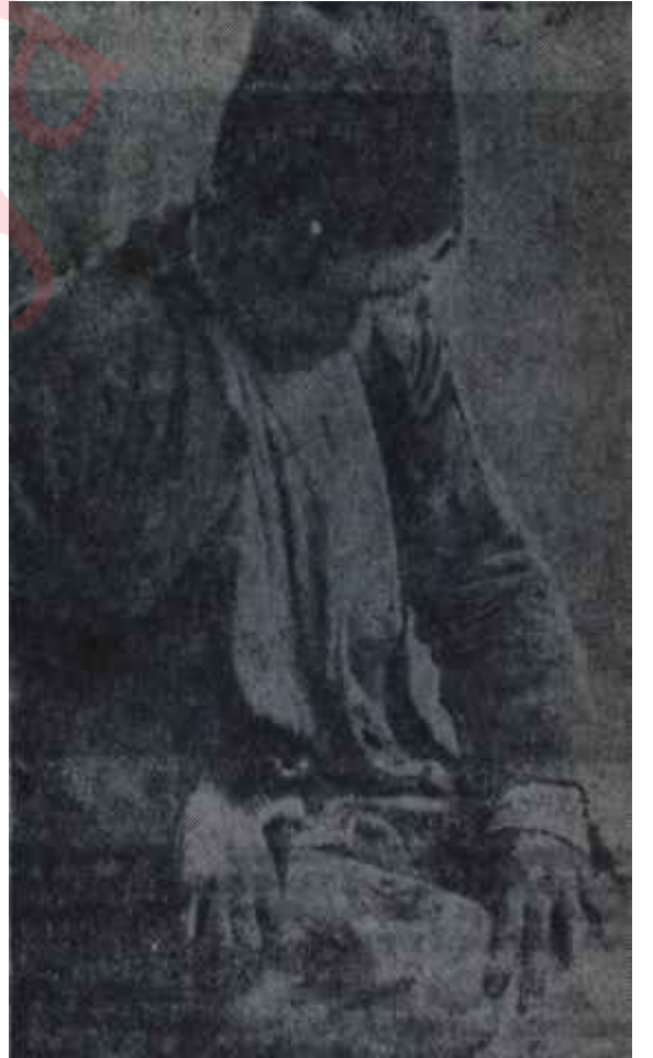
Yunanlıların süngülediği bir Türk

İkincisi, dört yıl harp içinde yaşamış olan batılı galiplerin bütün düşmanlarına karşı bir hıncı vardır. Büyük bir tehlike geçirmişlerdir, ölüm-kalım savaşı yapmışlardır. Kendilerini buna mecbur eden İtilâf Devletleri her türlü cezaya müstahaktırlar. Hele bunların içinde bir tanesi vardır ki o üstelik Hristiyanı da değildir. Müslüman-