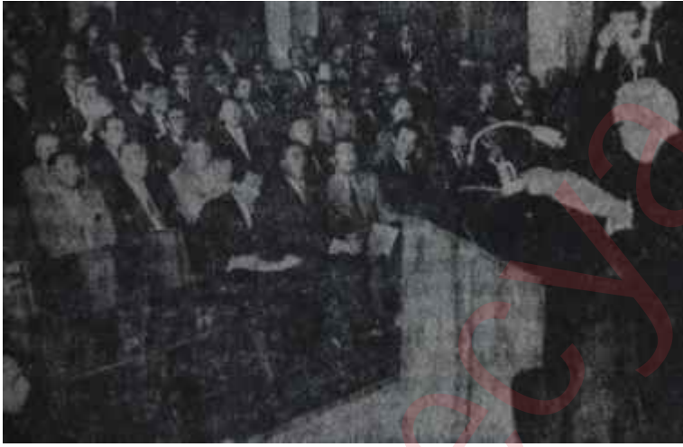
İnönü Sanayi Kongresini açıyor

Yüze yakın konuşmacının söz aldığı, kalkınma dâvasının en önde gelen problemlerinin enine boyuna tartışıldığı Altıncı Sanayi Kongresi, Çarşamba günü yapılan bir açık oturumla sona erdi.