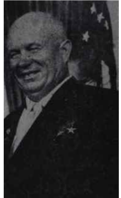
Ulbricht ve Krutçef Yardan, ve serden geçemeyenler