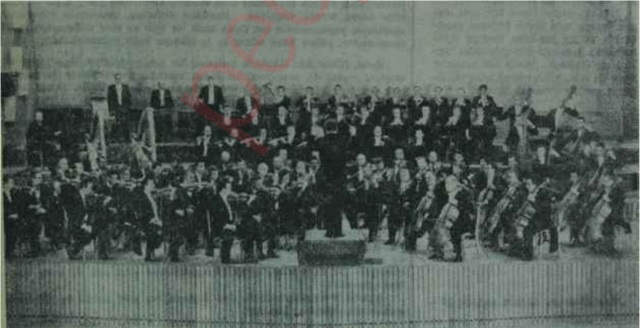
Cumhurbaşkanlığı Senfoni Orkestrası "Küçücük fişçik..."

Aslında, yukarıda sıraladığımız nedenler hiç şüphesiz önemli zorluklardır. Ama bunların Devlet Bütçesinden resmen bir devlet dairesine tahsis edilerek getirtilen yabancı sanatçıların vereceği konserlerin bilet hasılatına gayriresmi bir demenin tamamen el koymasına, üstelik bu büyük paraları bütçesiz, kontrolsuz ve daha kötüsü sorumsuz bir şekilde harcamasına hak verdireceğini ummak ya büyük bir saf-