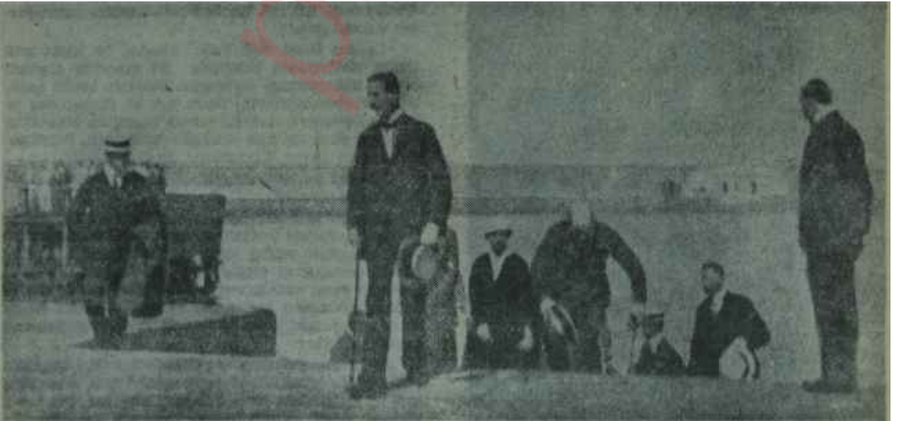
Kral Konstantin İtalyada sürgünde

"-- Görüyorum ki İstanbulda bir kaçak olmuş ve Türkler, galiba bizim kendi temsilcilerimizden, İzmirle il-