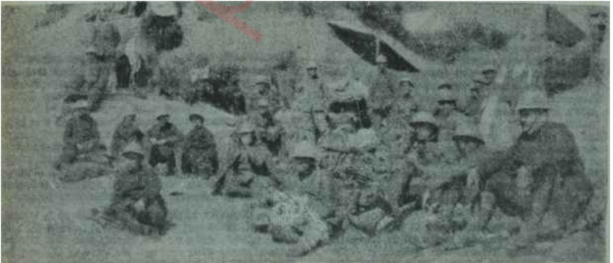
Venizelosun askerleri Doğa cephesinde

(Bu yazıların bütün hakkı AKİS Mecmuasına aittir. İzinsiz kısmen dahi iktibas edilemez).