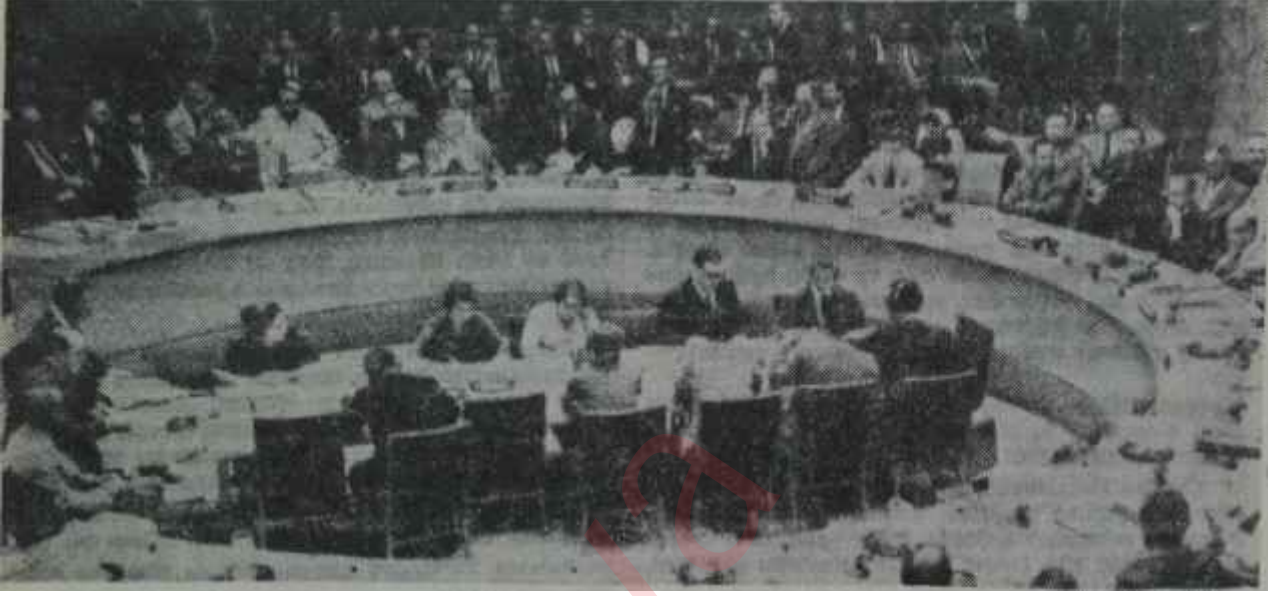
Güvenlik Konseyi Kıbrıs meselesini görüşüyor Çare peşinde