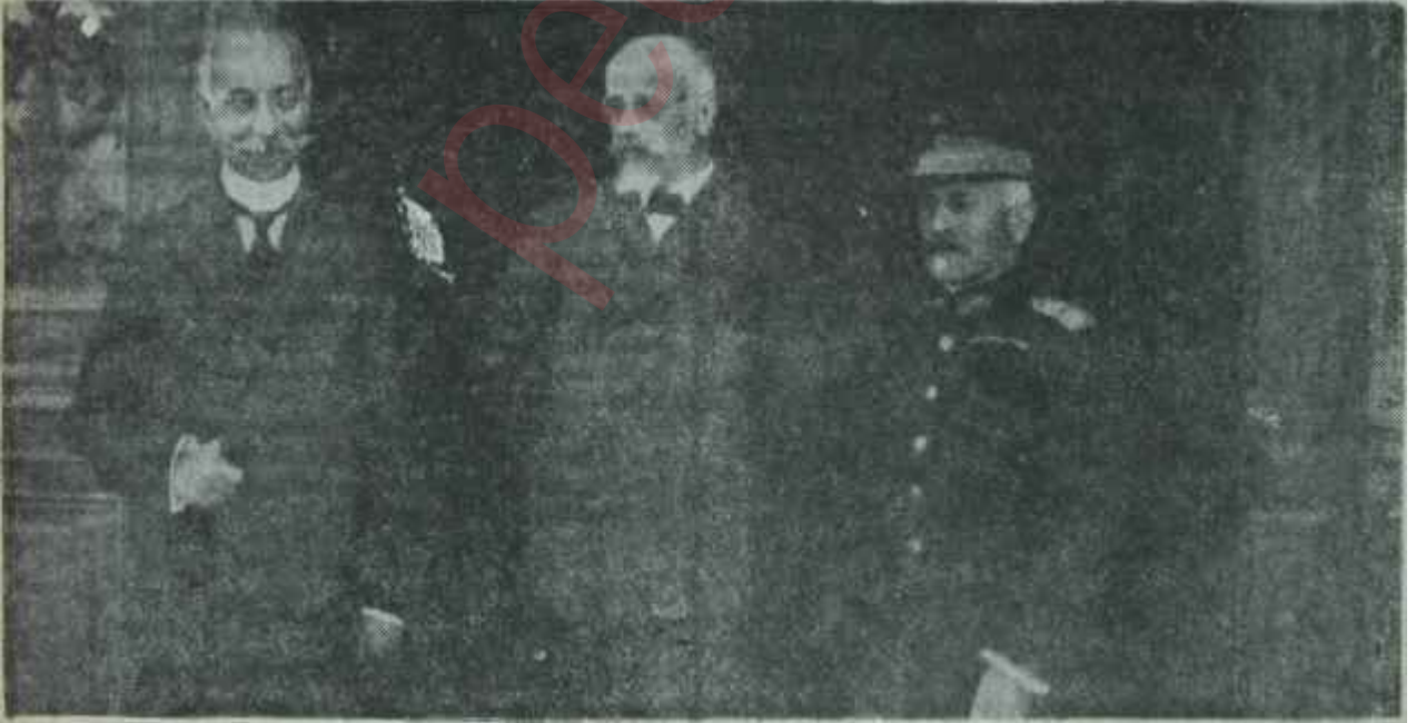
Venizelos Selanikte ideal arkadaşlarıyla

Millî Mücadelesinde Türkiye sadece Anadolu'ya yu-karda anlatılan şekilde ayak basmış olan Yunan Ordusuyla değil, yunanlıların kurup işlettikleri bu muazzam