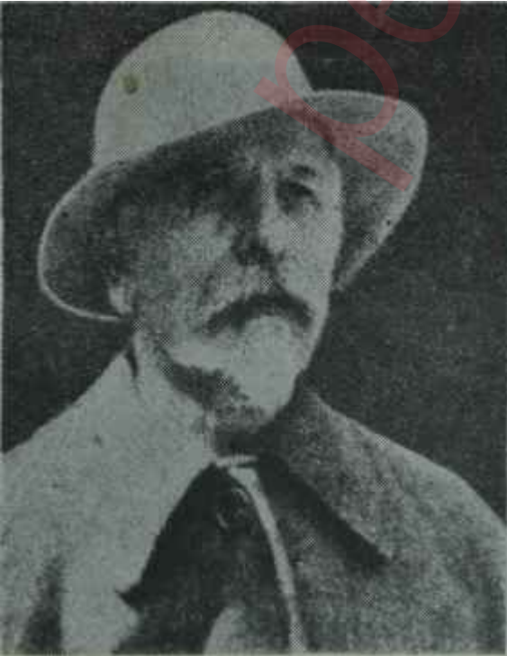
Sir Basil Zaharoff

Ama Sir Basil Zaharoff 1920 yılları civarında - oynadığı bu kadar büyük ve önemli role rağmen - yunanlıların ve bilhassa Venizelosun dünya umumi efkârını ve dünyanın liderlerini yunan dâvalarının, savunucuları haline getirmek, için kurdukları, muazzam propaganda mekanizmasının sadece bir çarkıdır. O tarihe-kadar görülmemiş olan bu propaganda faaliyeti Birinci Dünya Harbinden sonra Yunanistanın bilhassa bizim, aleyhimize