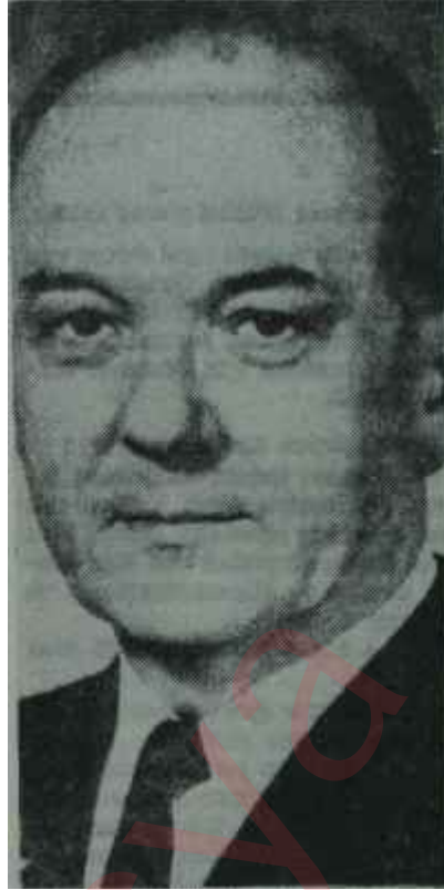
Dean Rusk Ortadaki adam

Vietnam savaşının gün geçtikçe züleceğine Kötüye gittiğini gören A-