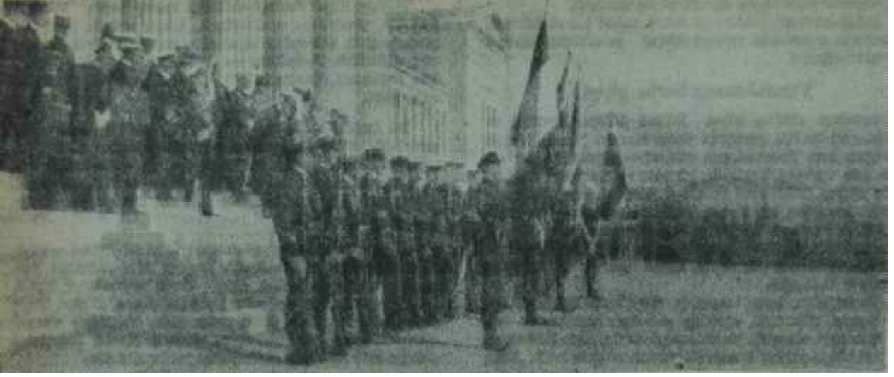
Müttefik askerleri işgal edilmiş Atinada

Bu, 1918-20 yılları arasında, Barış Konferansı devam ederken şahsen Venizelosun ve onun sayesinde Yunanistanın inanılmaz bir söz sahibi olmalarının bir nedenini gözlerin önüne sermektedir. Bir yandan Venizelosun bu müthiş itibarı, diğer taraftan onun kurduğu muazzam propaganda makinesi, nihayet harpte elde edilen zaferin sarhoşluğu Müttefikleri Yunanistana Türkiyeyi, Yunan Başbakanının arzusuna uygun şekilde peşkeş çekmeleri neticesini vermiştir.