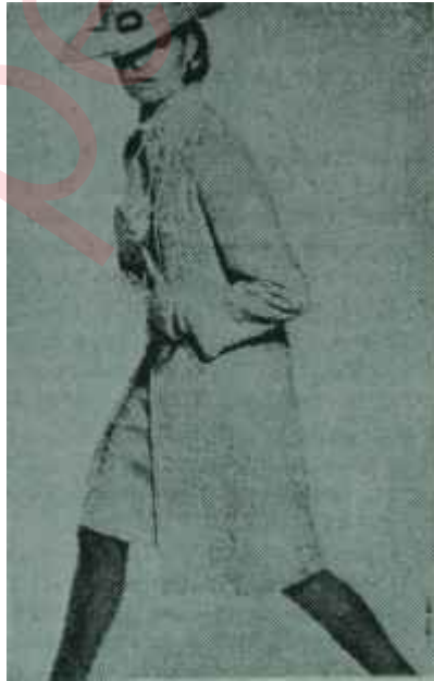
Bahar kıyafetlerine hazırlık