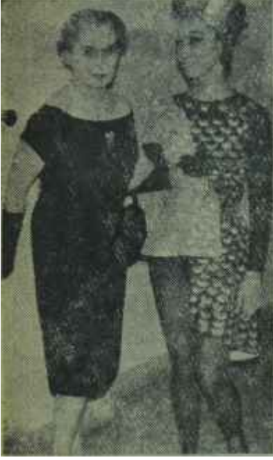
Dame N. Valois ve Onat Ustanın, usta çırağı