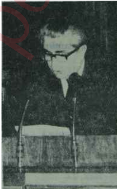
Melen Mecliste konuşuyor "Dert çok, hemdert yok"

Haftanın başlarında Salı akşamı Ferit Melen, Millet Meclisi kürsüsünden bir takım rakkamlar sıralıyor. Türkiye'nin 1964 yılı bütçesini izah ediyordu. Elindeki bir tomar kâğıt hay-