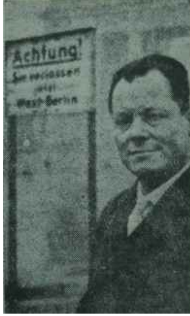
Willy Brandt Dönemeçte

Bata Almanyanın ekonomik durumu şu sırada alabildiğine iyi olduğuna