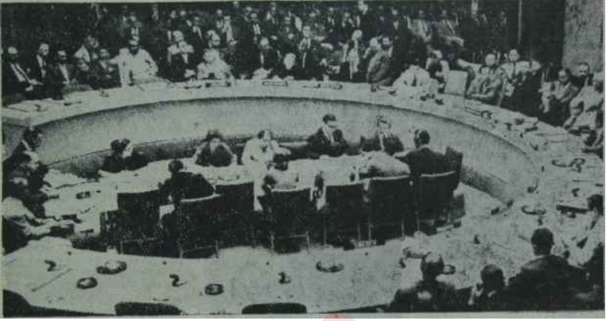
Güvenlik Konseyi toplantı halinde Zili çalmak son kapı

nu bir defa daha kullanarak ve prestijini ortaya koyarak bizi çok haksız ve kötü bir duruma düşürecek olan hadiselerin patlak vermemesini sağladı. Gençler bir defa daha, büyük olgunluk gösterdiler. Durumu Başkentteki amerikalılar endişeyle takip ediyorlardı.