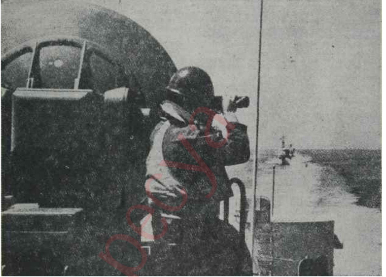
İskenderundan hareket eden bir muhripte türk askeri

H arp Filosu, Kıbrıs açıklarındayken, telsizle bir emir aldı. Bu emir ilk emire bir müddet için ambargo koy-