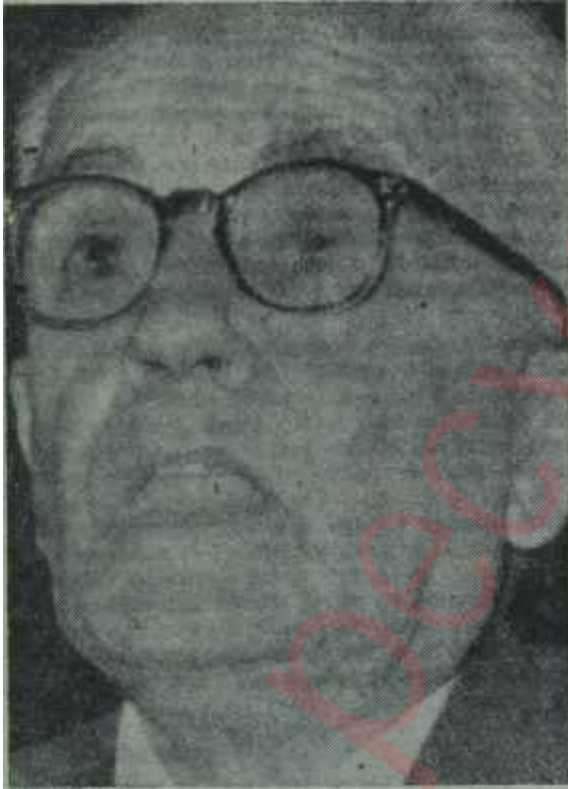
Tahsin Banguoğlu Bir halkevcisi

Halkevleri - Halkevlerinin Atatürk tarafından kuruluşunun 32. yıldönümü olan Çarşamba günü bütün yurtta çeşitli törenlerle kutlandı. Bu konu ile ilgili olarak haftanın başında bir basın toplantısı yapan Halkevleri Genel Başkanı Tahsin Banguoğlu, halkevlerinin görevlerini anlatarak başında bulunduğu kuruluşun türk halkını sosyal hayata alıştırmak ve gençliği Atatürk ilkelerine göre yetiştirmek üzere çalıştığını belirtti ve: