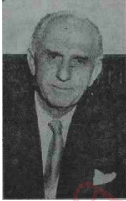
Papandreu Muradına eren adamı

Haftanın ortasında Atinadan alınan haberlere bakılırsa geçen yılın sonlarında yapılan seçimlerde oyların yüzde 42'sini alıp 138 sandalye ile yetin-