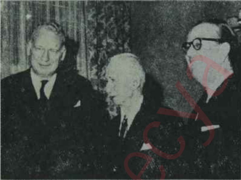
George Ball İnönü ve Sunay ile birlikte

Hadise Türkiyede duyulduğunda tarifsiz bir infial bilhassa Gençliği kapladı. Eğer Başbakanlıkta İsmet İnönüden başka biri bulunsaydı, İstanbulda mutlaka kütleler harekete geçerd. Nitekim Cuma günü İstanbuldan Başbakana tehlikeli haberler geldi. Fakat İnönü, gençler üzerindeki nüfuzu-