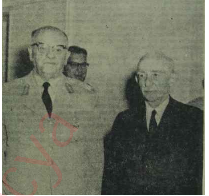
Başbakan İnönü Genel Kurmay Başkanı Sunay ile Onlar diyor "Bayram Haftası", Papaz anlıyor "Mangal Tahtası"

İsmet İnönü ile Cevdet Sunayın beraberce konuştukları ve çalıştıkları konu Zürih ve Londra Andlaşmalarının bize verdiği hakkın kullanılmasındaki siyasî zamanın iyi seçilmesi ve askerî harekâtın başarısının sağlanmasıdır. Bunun birinci kısmının büyük sorumluluğu Başbakanın, ikincisinininki Genel Kurmay Başkanının omuzundadır. Genel Kurmayda oldukça uzun bir süredir gerekli hazırlıklar yapılmıştır ve bütün tertibat alınmıştır. Başbakana gelince o, bu hafta bilhassa Güvenlik Konseyinin çalışmalarını yakından takip etti ve Dışişleri Bakanlığında Kıbrıs konusuyla ilgili olarak gelen bütün şifreleri bizzat okudu, lazım gelen emirleri verdi. Dışişleri Bakanı Feridun Cemal Erkin ve Genel Sekreteri Fuat Bayramoğlu sık sık evlerinde dahi aranan veya yataklarından kaldırılan kimselerdir.