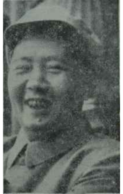
General de Gaulle — Mao—çe Tung Vergülüm!..

le geniş iticaret bağları kurmaya ça- lışmıştı ama, Birleşik Amerikayı gü- cendirmemek için, siyasî bağları en azında tutmaya özel bir dikkat gös- termiştir. Bu arada, Komünist Çinin Birleşmiş Milletlere girmesi konusun- da da Amerikanın hoşlanmıyacağı bir davranıştan devamlı olarak kaçınmış- tır. Oysa, Fransanın Komünist Çin- le kuracağı bağlarda bu kadar dik- katlı olacağı söylenemez. Bir kere, Pekini tanımamasının sebebi olarak As- yada Komünist Çinin varlığını kabul etmeden hiçbir siyasî anlaşmazlığı çözmek imkânı olmadığını ileri sür- mektedir. Bu da gösteriyor ki, Asya- yı ilgilendiren bütün meselelerde Ko- münist Çini en bellibaşlı muhatap o- larak kabul edeceklerdir. Bu durumun şimdiye kadar Komünist Çin gerçeği- ne gözlerini kapayan Washington'u ne kadar kızdıracığı açıktır.