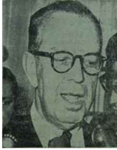
Feridun C. Erkin

D urum bu iken, Çarşamba akşamı Londrada bir ışık belirdi. Duncan Sandys Erkinini davet etti ve kendisine, Amerikalıların Adaya asker göndermeyi prensip itibarıyla kabul ettiklerini bildirdi. Bu, bir NATO birliğinin çerçevesi içinde olacaktı ve buna Türkiye'nin ilâve kuvvetlerle katılması uygun görülüyordu. Erkin sonradan bunu memnurlukla karşıladığını gazetecilere söyledi. Fakat tabii bu, Türkiye'nin Adadaki haklarında en ufak bir değişiklik yapmayacaktı. Bir hâl çaresinin bulunması için elinden geleni hakikaten yapan Erkinin Londrada herkese anlatmak istediği gerçek şudur: Türkiye'de hiç kimsenin Türk lere kabul ettiremeyeceği şeyler vardır, bunlar İnönüden istenmemelidir. Bunların başında ise, bizim Adadaki