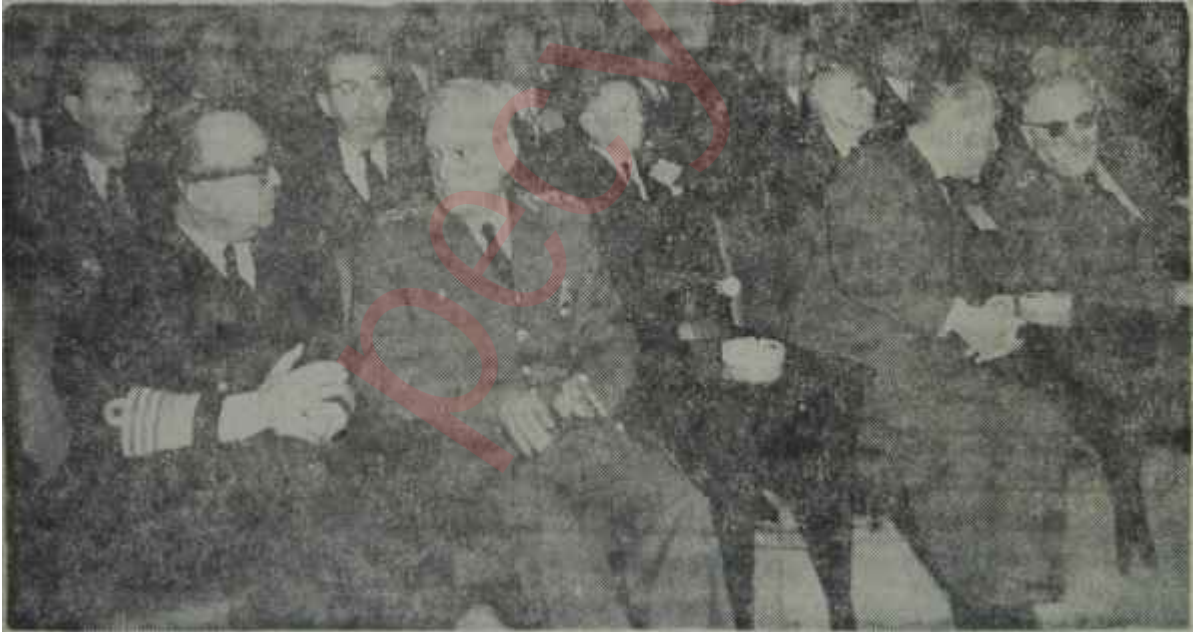
Genel Kurmaydaki brifing

Divanları bundan kısa bir süre önce müşterek bir toplantı yaparak Parlâmento muhabirlerinin çalışma şartlarını kısıtlayıcı bir takım tedbirler almışlar ve bu tedbirleri yeni bir talimatname ile ilgililere duyurmuşlardı. 1 Şubat 1964 günü yürürlüğe girecek olan bu yeni talimatnameye göre, Parlâmento muhabirleri ancak Meclis binasının arka tarafında bulunan bir kapıdan işleyecekler, koridorlara, şeref holüne, diğer katlara, grup odalarına ve komisyonlara giremeyeceklerdir. Gazetecilere arka tarafta bulunan giriş kapısının holünde bulunan bir vestiyer toplantı ve dinlenme odası olarak tahsis edilmiştir. Vestiyerden bozma bu holde tipik bir amerikan barı andıran tezgâhın arkasında Basın Bürosu memurları çalışacaklar, milletvekili ve senatörlerin konuşmalarını, grup bildirimlerini teksir edeceklerdir. Holün en garip özelliği ise çıkış kapısının her açılışında Ankaranın kuru ayazının bir anda odayı soğuk hava depolarına çevirmesidir. Basın toplantıları da bu odada yapılacağından Parlâmento muhabirleri muzip bir gülümseyişle bu talimatnamenin çıkışında öncülük etmiş olan politika-