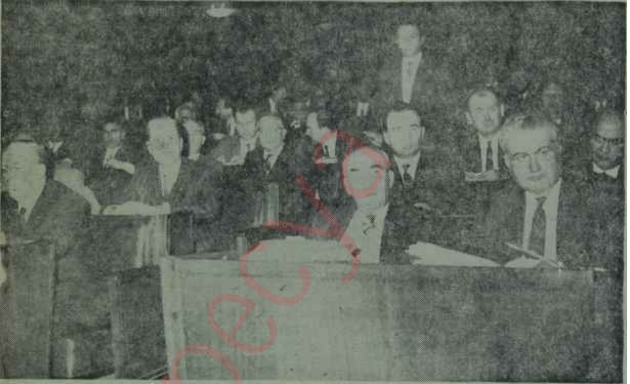
Meclis idam kararlarının görüşüldüğü celsede