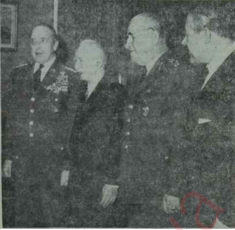
İnönü, Sunay ve Satır Orgeneral Lemnitzer ile birlikte Dostça.. ve erkekce görüşenler

Bugün Kıbrıs adasında, Kıbrıslı diye bir insan tipi yoktur. Kıbrısta yaşayan bir insan, kendisine sorarsanız, ya türk, ya da rumdur. Adada kiminle konuşursanız konuşunuz, samimiyetle "Ben Kıbrıslıyım" diyecek tek insana rastlayamazsınız.