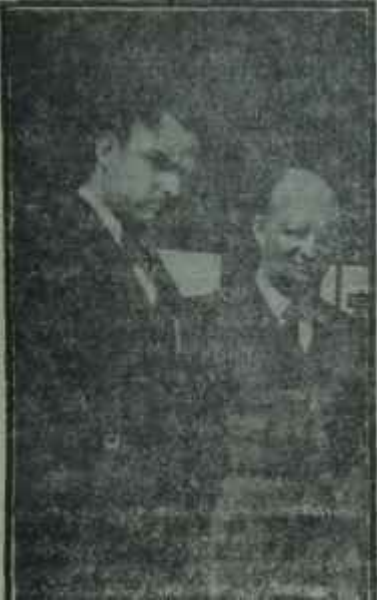
Hindemith Konservatuarda Eseri geri geldi