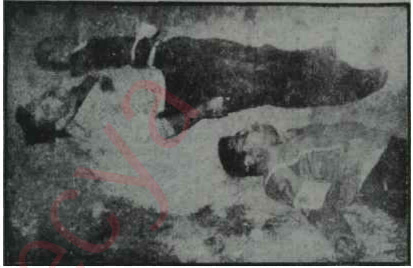
Kıbrısta şehit edilen türkler

zanmak için çok yanlış bir yol seçtiği konusunda oybirliği yapmakta, bu anlaşılmaz davranışı destekledikleri takdirde kendilerinin de dünya kamu oyu önünde suçlu çıkacaklarını gayet iyi bilmektedirler. Bu bakımdan, Londrada bulunan Yunan temsilcileri, Yunanistan ile Kıbrıslı rumlar arasında her konuda tam bir görüş birliği bulunmadığını üstü kapalı da olsa belirtmeye özel bir dikkat göstermektedirler. Bundan başka, Yunanistanın türk dostluğuna hâlâ büyük bir önem verdiğine şüphe yoktur. Kıbrıs ilhak etmekle büyük bir kazanç sağlamayacak olan Yunanistan, bu yüzden Türkiye'yi kay-