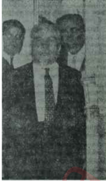
Gökay toplantıdan çıkıyor