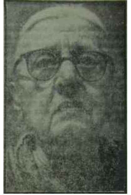
Halide Edip Adıvar Maziden sesler

Halide Edip de, İstanbuldaki birçok "iyiniyetli yurtsever aydın" gibi, 1919