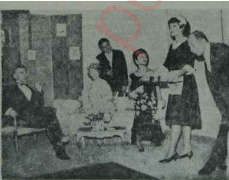
Dormen Tiyatrosunda "Şahane Züğürtler". ve Şahane bir oyun