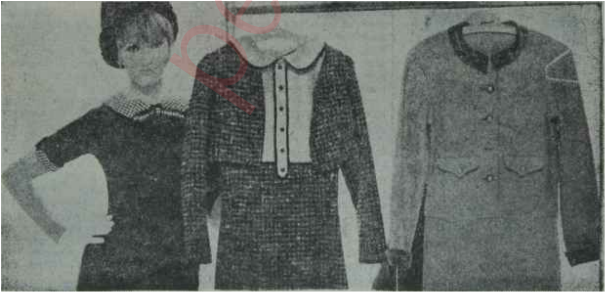
Bu yılın moda elbiseleri Ucuza ve zarife doğru