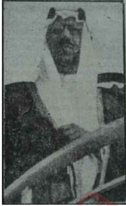
İbni Suûd Kaynayan kazan

Bilindiği gibi, İsrail ve Ürdün topraklarından akarak Ölü:Denize dökülen Şeria nehri, Suriye ile İsrail arasındaki Taberiye gölünden çıkar, uzun bir süredir İsrail, kurak topraklarını sulamak ve Negef çölünü işletmeye açabilmek için bu gölün sularını açacağı kanallara pompalamak niyetindedir. Bu takdirde Şeria nehrinin sularının azalacağını ve Ürdünün susuz kalacağını bilen Arap devletleri bu projeye şiddetle karşı durmaktadırlar. İsrailde Ben Gurion işbaşındayken, ne zaman Taberiye gölünde çalışan israilli işçilere Suriyeden ateş açılrsa, ateşe ateşle karşılık verirdi. Fakat yerimi alan Eskol daha az şiddet taraftarı, olduğu için geçen yaz meseleri. Birleşmiş Milletlere götürmüş ve Gü-