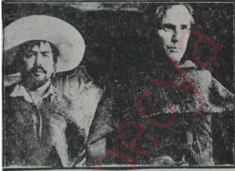
Marlon Brando. Marlo Brando'nun "Aşk ve İntikam" ında