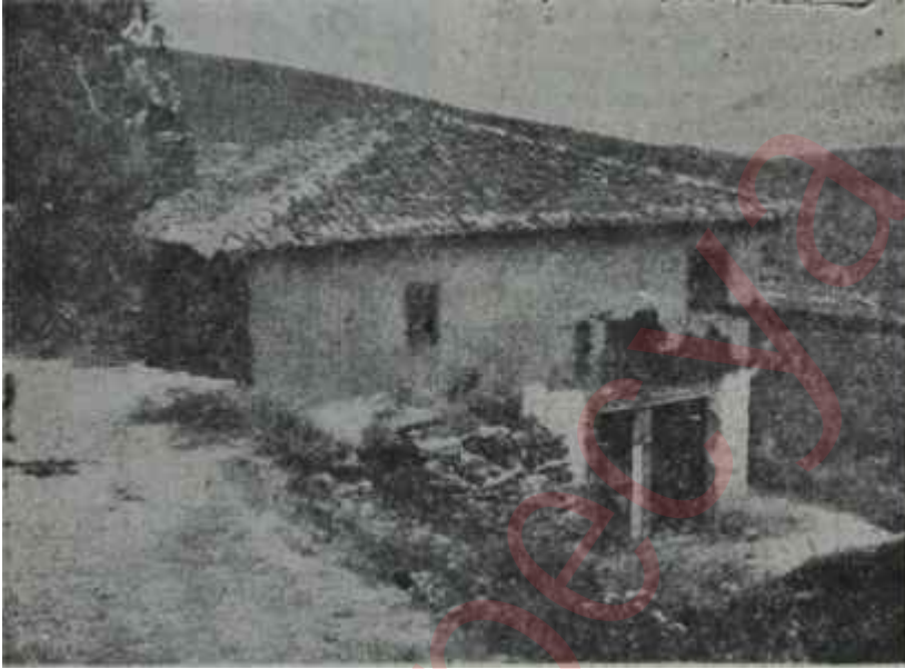
Bir köy Bakanım buldu

da.-her halde fazla ılımlı dahi sayılamayacak bir fikre sahip olmuşlardır. Sonra çeşitli bölgelere "tayin olunmuşlar, oralarda realitelerle de karşı karşıya gelmişlerdir..Böyle kaymakamlar, kendilerini aşırılıklardan korudukları nisbette bugünkü Türkiyenin havasını veren kimselerdir. Bu kaymakamlar, yeni Köy Bakanlığının anketini son derece müsait karşıladılar.