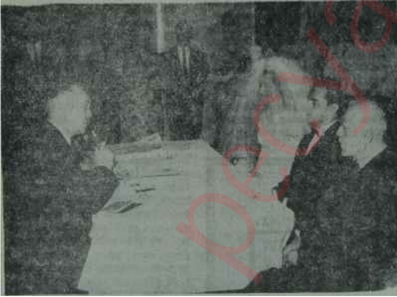
Bulvar Palastaki düğün