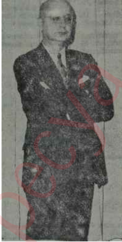
Prof. Nihat Erim

Şimdi merakla seyredilen, CHP nin böyle avantajlı bir durumda nasıl davranacağı, önüne çıkan fırsatı iyi mi kullanacağı, yoksa bir çuval inciri berbat mı edeceğidir.