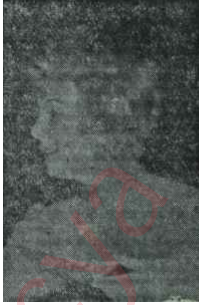
Eva Gabor Görünmez kaza!