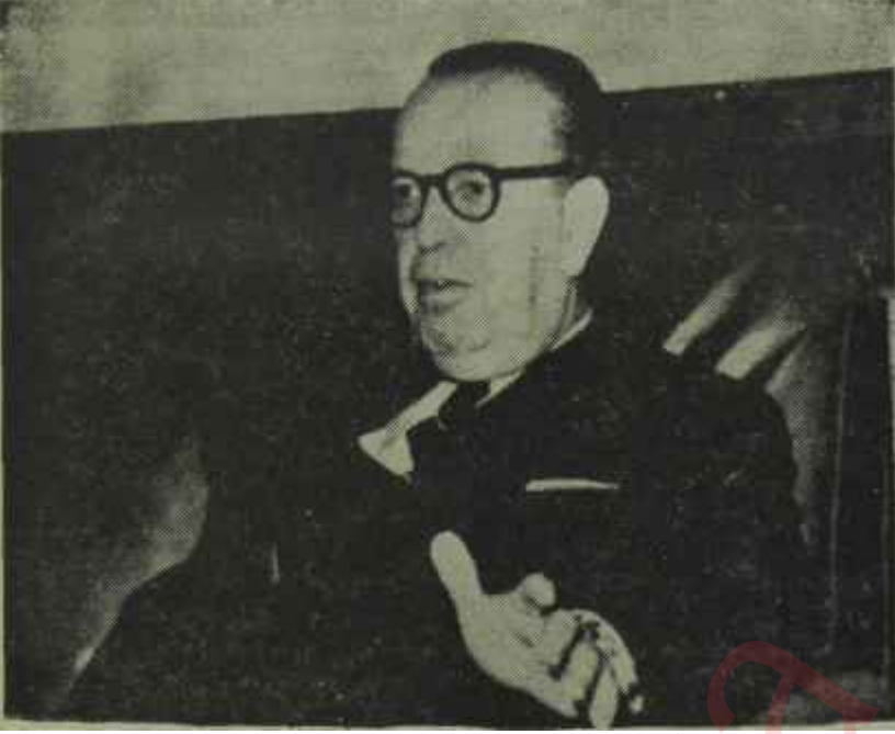
Feridun Cemâl Erkin vazife başında