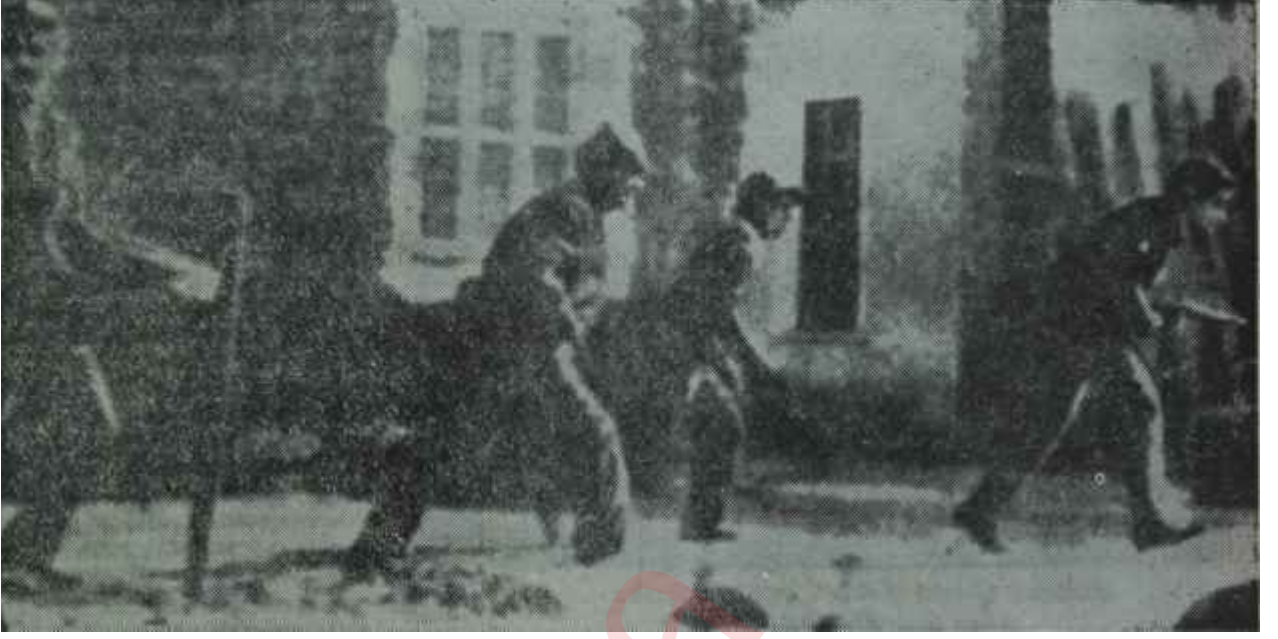
Kıbrısta trklerle ateş eden bir yunanlı birlik