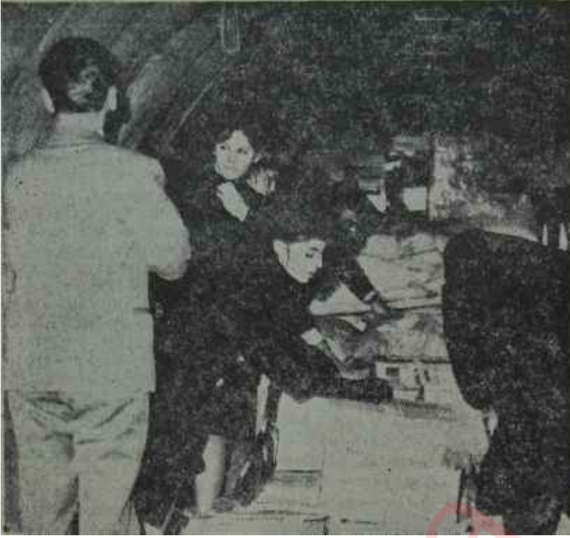
M.T.T.B. nin yardımı Kıbrıs'a gönderiliyor Gençliğin palavraya karnı tok

mek aşırı bir iyimserlik olur. Bu bakımdan eninde sonunda, ortaya ister istemez taksim tezi çıkacaktır. Zaten Türk hükümeti, artık bu tezi iyiden iyiye benimsemiş durumdadır.