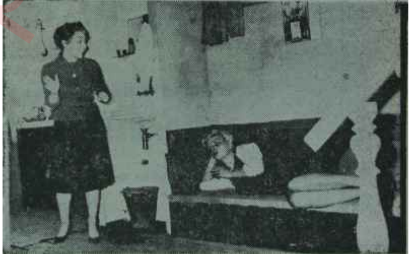
"Avluya bakan pencere"