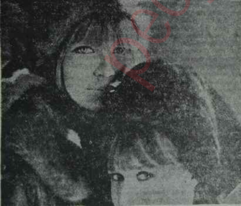
Yılın modası kürk şapkalar