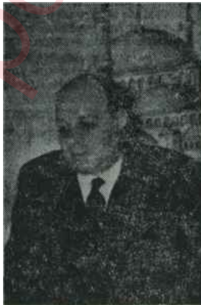
Rauf Denktaş Yanık bir bağır

Kıbrısın Türkiye için önemi yalnız güvenlik bakımından değildir. Bugün Kıbrıs 120 bine yakın türk yaşamaktadır. Gene aynı uzmanın yazdığına göre, bunlar, 1571'de Adayı zapteden ordudan o zaman terhis edilen 30 bin kadar askerin ailelerini Anadolu'dan geti-