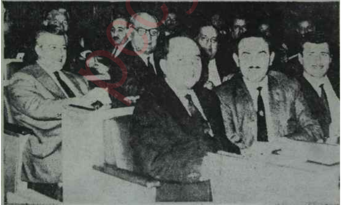
Başbakan Yardımcısı Kemal Satır CHP Grupunda

İnönü, kabinesini kurarken eski Başbakan Yardımcısını çağırды ve kendisiyle görüştü. İnönü Turhan Feyzioğlunu Başbakan Yardımcılığına getirirken iki iş düşünmüştü. Birincisi Plan ve dış finansman kaynaklarının bulunması idi. Bu sahada Turhan Feyzioğlu tam numara aldı. Bütün gecesini ve gündüzünü bir araya getirdi, bir hamal gibi çalıştı, dış temaslarda, başarı gösterdi ve hem plân fikrinin, hem de çoğu zaman plâncıların kuvvetli