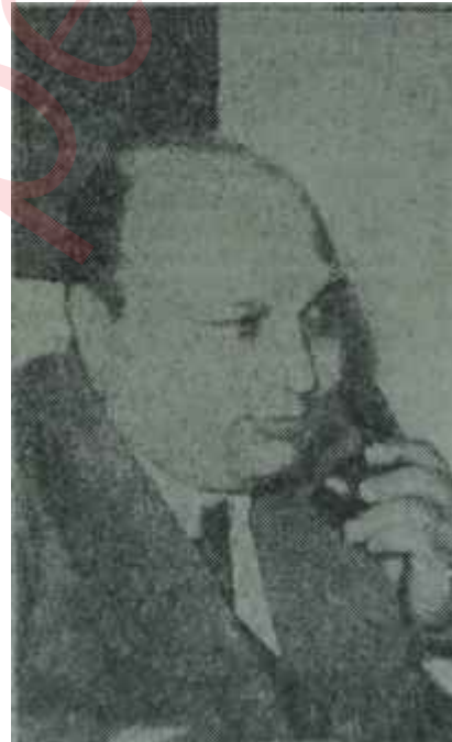
Lebit Yurdoğlu Köyden bir Bakan

Ancak Y.T.P. Genel Başkanı, A.P. li koalisyon yürümeyince C.H.P. li koalisyon da Y.T.P. nin hayır demesi halinde partinin ikiye ayrılacağını hemen sezdi. O