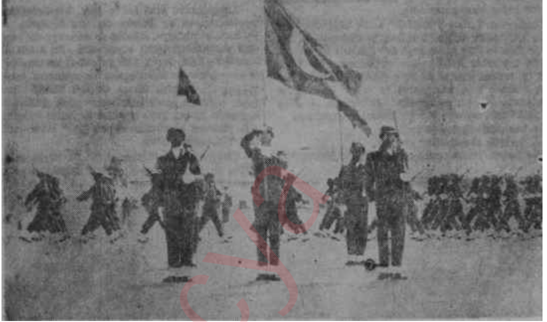
Kıbrıs Türk birliği