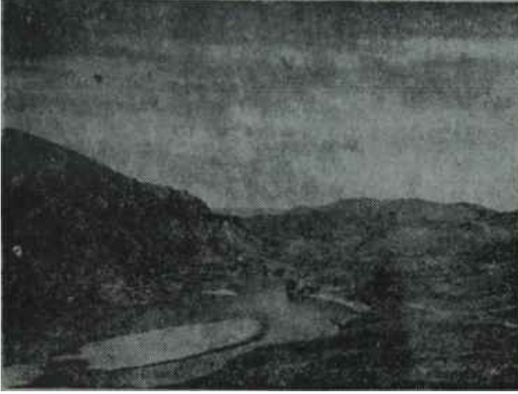
Elâzığdan görünüş Su sesi, su sesi, su sesi

sancı mümkün olabilecektir. Keban tesislerinin tek başına yıllık döviz kazancı ise 18 milyon 500 bin dolar olarak hesaplanmıştır. Bu hesaplardan da anlaşılacağı üzere, özellikle endüstriye olan büyük tesiri sebebiyle. Keban Barajının sağlayacağı faydaların başında elektrik üretimi gelmektedir. Türkiye'nin 3 milyar 500 milyon kilovat saatlik elektrik üretimiyle bu alanda dünyanın en geri kalmış ülkelerinden biri olduğu Türkiye'de fert başına düşen yıllık üretim miktarı 7 bin 400 kilovat saattir göz önüne alınırsa, Keban Barajının önemi çok daha iyi anlaşılır. İhtiyaç ve talep her geçen yıl büyük bir süratle artmaktadır. Bu sebeple, yılda yüzde 14 oranındaki talep artışına karşı her yıl 400 milyon kilovat saatlik yeni üretim yapılması ve gene her yıl en az Hirfanlı kapasitesinde bir barajın istihale sokulması gerekmektedir.