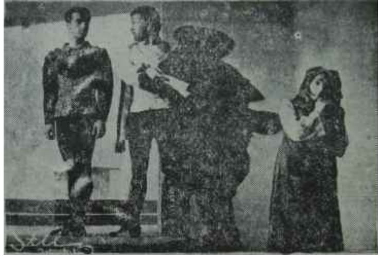
Küçük Sahnede "Othello"