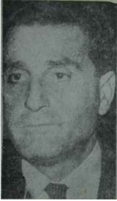
Kemal Demir Demir leblebi