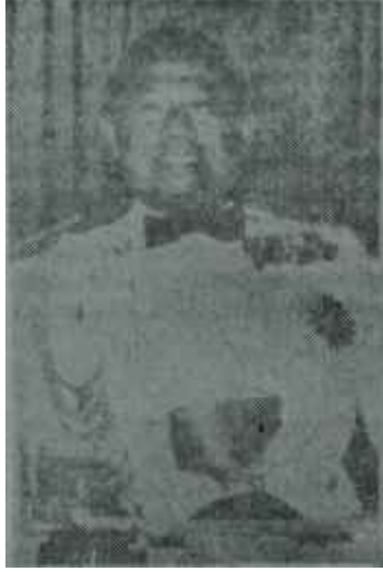
Mareşal Sarit Kadın, şarap, şarki!

Siyam Kralları bir kitap ve bir film- la XX. Asır dünyasında şan sahibi olmuşlardır. Bu kitap «Anna ve Siyam Kralı»