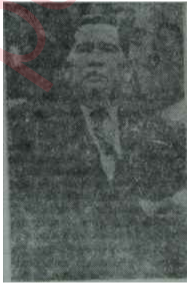
General Thanom Karanlık ufuklar

adını taşıyan romandır. Bu kitaptan yapılırsa «Kral ve Ben» adlı film de Yul Brynner tarafından oynanmıştır. Orada, çocukları için getirttiği İngiliz mürebbiyeye âşik olarak gösterilen Kral Mongkut bugünkü kralın büyük babasının bü-