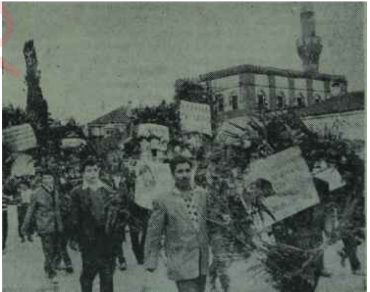
Kıbrıs olaylarından bir sahne

İşin doğrusunu söylemek gerekirse, Türkiye'nin iki yıldır yaklaşmakta olduğu açıktan açığa görülen bu olaylar karşısında biraz fazla yavaş davrandığı gizlenmemelidir. Din ve devlet adamı karışımı Makarios, davranışlarıyla, imzalandıkları gündem başlayarak Zürih ve Londra andlaşmalarını değıştirmeye çalışmış.