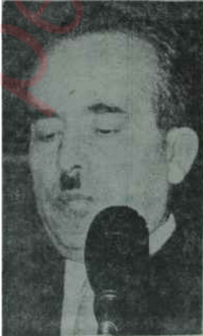
Ahmet Oğuz Str ve ser

İsmet İnönünün bir hafta içinde 180 derecelik bir dönüşle, hiç bir şey yapamayacağı aşikâr bir "Eski Kabil" ye tekrar sarılması haftanın acı hayal sukutunu teşkil etti. Bu satırların yazıldığı sırada Reformcu Kabine tamamıyla suya düşmüş bulunuyordu. Ama milletin "Peki. bunlar neden istifa et-