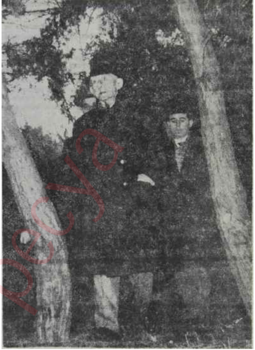
Başbakan İnönü bir gezinti sırasında gazetecilerle Yol yürümekle, borç ödemekle biter

Nitekim bu yüzdendir ki bir fikir etrafında değil de bir adama karşı kurulmak istenilen "İsmet Paşasız Hükümet", Gümüşşalanın gayretlerine rağmen ve Bölükbaşının canhıraş çığlıkları arasında gümbür gümbür iflâs etmiştir. Gene Gümüşşalanın, siyaset sahasını bir bukalemunun marifet sa-