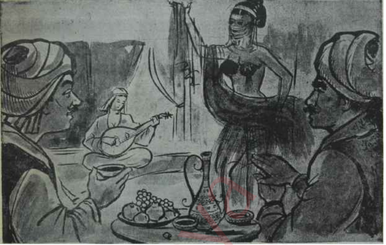
Osmanlılar devrinde bir oturak âlemi