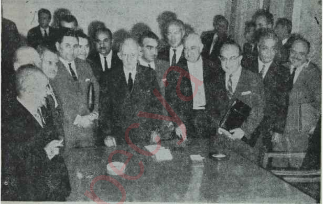
İnönü ilk temasını müstakillerle yapıyor

ki kendi arzulan, C.H.P. yi bir mânasız C.H.P. - A.P. koalisyonuna mecbur etmekte. Bu grup -en öndeki temsilcileri ve bayraktarları Emin Paksüt ile Coşkur Kırcaydı - CHP. - A.P. koalisyonunun, düşünülecek bütün koalisyonlardan daha zayıf olduğunu bilmiyor, idrak etmiyor değildir. Böyle bir ortaklık marifetiyle memlekette hiç birşey yapılamayacağını da mükemmelen müdriktir. - Zira, bu kadar zekidirler -. Ama böyle bir koalisyonun, kendi ekipleri için "sayılmıyacak kadar çok faydası" vardı. İsmet İnönü bu çeşit bir ortaklığa C.H.P. takımını başında katılmayacak ve İnönü-