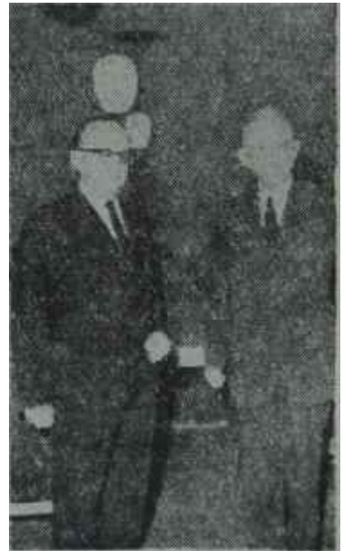
İnönü — Gümüşpala Ak ile kara