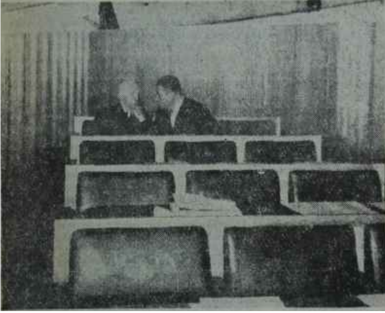
İnönü Grup salonunda Genel Sekreter Satır ile "Durum Muhakemesi"

te C.H.P. nin katılmaması gerektiğini düşünen İnönünün ve C.H.P. Grubu ekseriyetinin, sadece Bağımsızlarla böyle bir programı Meclis önüne, olmazsa memleket önüne çıkarmakta kesin kararlı olduğuydu.