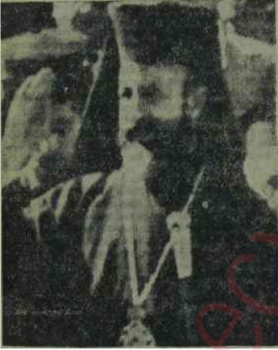
Kıbrıs Cumhurbaşkanı Makarios Refik Koraltan gibi

Kıbrıs — Bundan beş yıl kadar önce, 1958 Ağustosunda, Celâl Bayar yurt dışında bir geziye çıkmıştı. Kendisine Meclis Başkanı Koraltan vekâlet ediyordu. O günlerde Türkiye, iç politika bakımından, en ateşli bir devreye girmişti. CHP Genel Başkanı İsmet İnönü, tatilde bulunan Büyük Millet Meclisinin toplantıya çağırılması için büyük gayretler sarfediyordu. Bu arada, İstanbulda geçirmekte olduğu tatilini yanda bırakıp Ankaraya gelmiş, Koraltanla bir görüşme yaparak, kendisine bu konudaki görüşlerini bildiren bir muhtıra da vermişti.