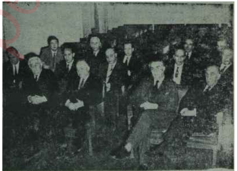
C.K.M.P. Grubu Koalisyon konusunu görüşüyor

Bu gibi davranışlar, YTP de görülmeyen şey değildir, öyle ki, bir kaç gün evvel CHP ile koalisyonun, hela İnönünün başkanlığındaki bir koalisyonun tam manasıyla karşısında olanlar, bugünlerde bambaşka havalar çalmaktadırlar. Nitekim Azizoglu, bundan bir müddet evvel "İnönüye Üçüncü Koalisyonu kurdurmak, onun De Galle olmasını ve öyle hareket etmesini sağlamak olacaktır" demekten çekinmemiştir. Gene koalisyona katılma tarafı Esat Kemal Aybarın, AP ye transfer fikrini açıklamasının üzerinden birkaç gün ya geçmiş ya geçmemiştir. Ama hava ve ağır basan bazı milletvekilleri, Aybarı Hükümet ortaklığının büyük tarafı yapmıştır.