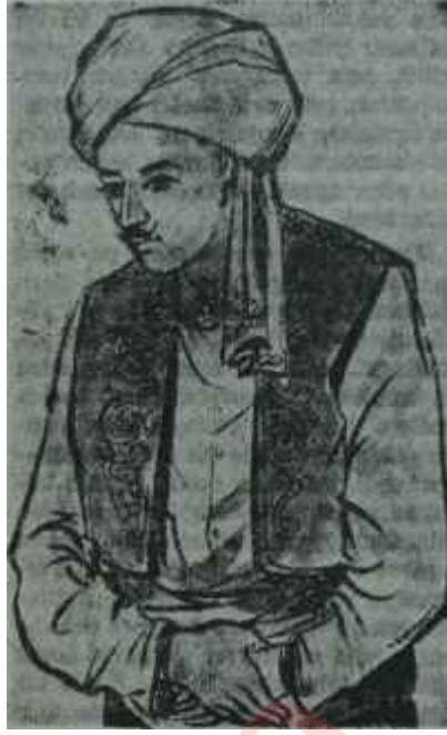
Bir osmanlı delikanlısı